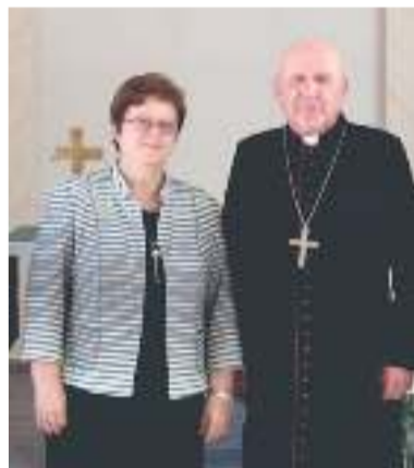
Посол Моника Иверсен и архиепископ Юрий Новгородов в храме Христа Спасителя

В ходе состоявшегося разговора архиепископ Юрий Новгородов