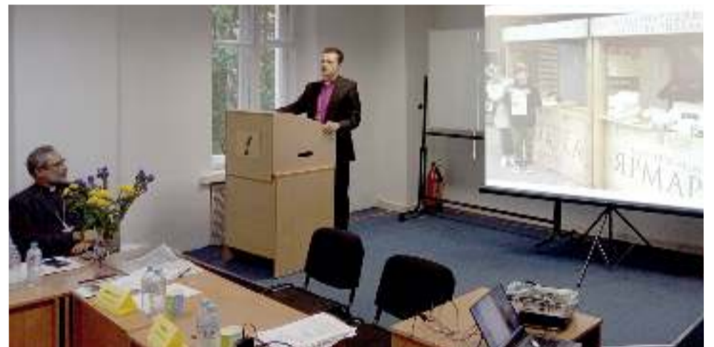
Архиепископ Дитрих Брауэр выступает с отчетом перед Синодом

Среди других важных задач, стоящих перед Церковью, архиепископ обозначил возвращение новых служителей, что возможно сделать только на местах, а также умение находить источники саморегулирования, эффективно используя ресурсы.