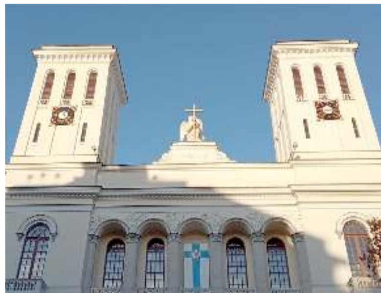
На западной башне расположились солнечные часы, на восточной – механические