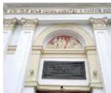
Фасад бывшей главной лютеранской церкви Львова, сегодня церкви евангельских христиан-баптистов

На следующий день гости ждали рабочие встречи в УКУ с администрацией и заведующими кафедр Философско-богословского факультета. На встрече были представлены магистерские программы разных направлений, студентами которых могут стать служители НЕЛЦУ и СРЕЦ. «УКУ является хорошим при-