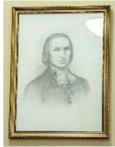
Портрет пастора Иоахима Кристиана Грота, написанный к юбилею освящения церкви св. Екатерины

становил его приблизительный облик. Портрет занял свое место над входом в сакристию.