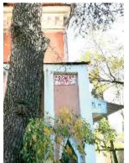
Здание безо всяких на то оснований уже долгое время используется в коммерческих целях

остается лишь надеяться на то, что в ближайшее время правда всё же восторжествует и они на уже имеющихся законных основаниях наконец смогут вернуться в свою церковь. ■