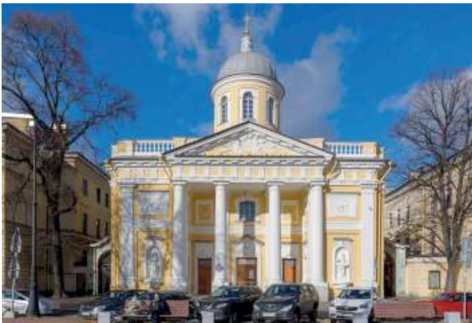
Подарком для общины к юбилею освящения стала реставрация здания, которая окончательно завершилась в августе этого года...