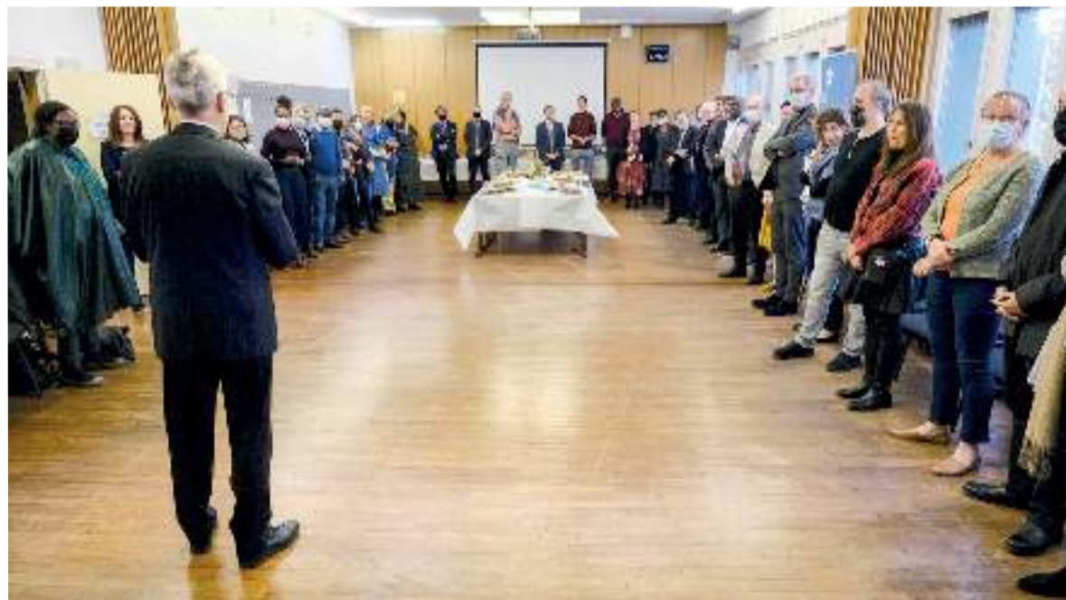
Прием по случаю завершения служения Мартина Юнге на посту генерального секретаря