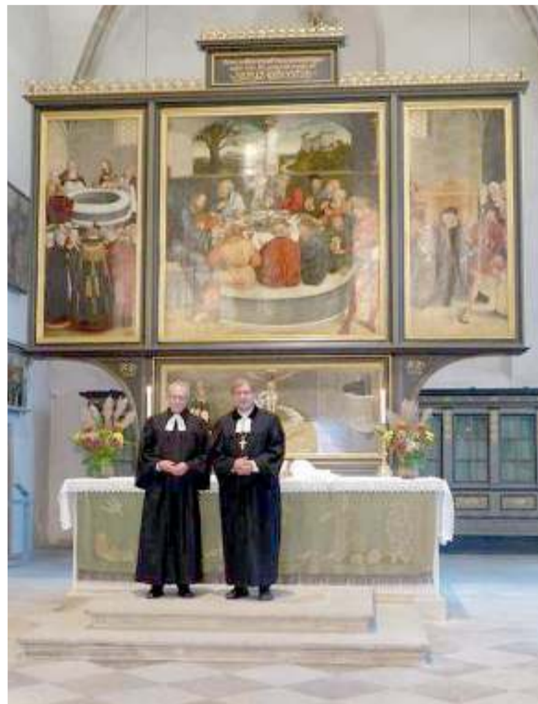
У алтаря церкви св. Марии в Виттенберге: президент СМЛ д-р Карстен Рентцинг (слева) и новоизбранный президент СМЛ д-р Тамаш Фабини

По материалам сайта Союза Мартина Лютера