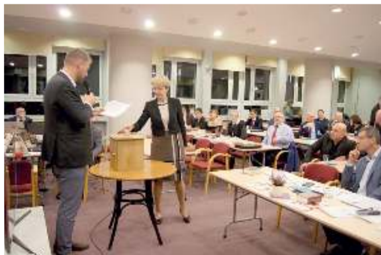
Тайное голосование по вопросу женской ординации на Синоде ЕАЦП