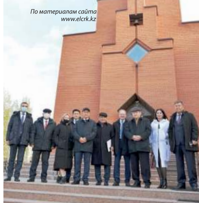
Группа депутатов Мажилиса Парламента Республики Казахстан на ступенях храма Христа Спасителя