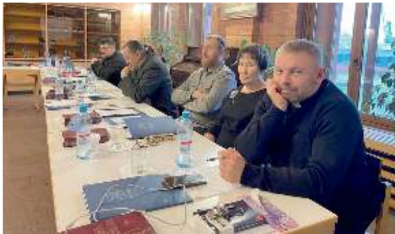
На заседаниях Синода

Синод продолжил работать над задачами в рамках концепции развития «Церковь-2025». В рабочих группах были проработаны и приняты Синодом задачи для общин Церкви на 2022 год. Такими задачами стали даль-