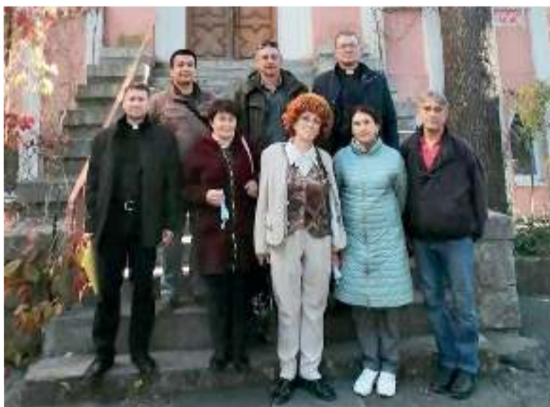
Представители ялтинской общины со священнослужителями ЕЛЦЕР на ступенях церкви св. Марии

остается лишь надеяться на то, что в ближайшее время правда всё же восторжествует и они на уже имеющихся законных основаниях наконец смогут вернуться в свою церковь. ■