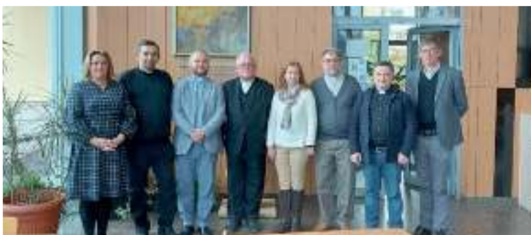
Лютеранско-реформатская делегация с сотрудниками УКУ