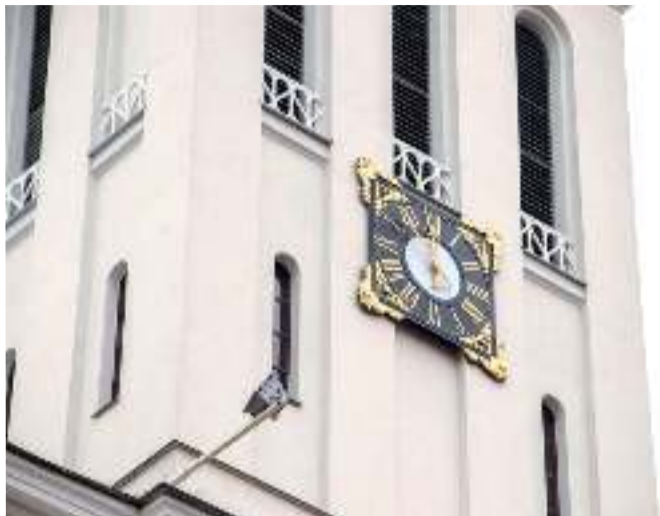
Механические часы на восточной башне собора