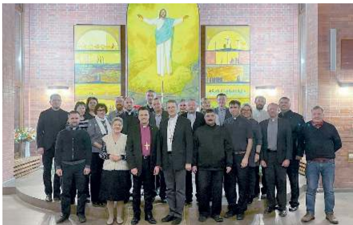
Участники Синода в церкви Христа