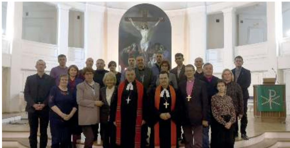
Синодалы и прихожане Петрикирхе после богослужения в завершение Генерального Синода ЕЛЦР