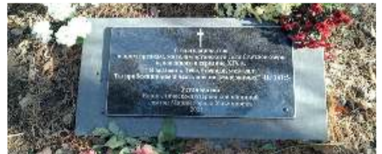
Памятный камень, установленный ульяновской общиной

Ульяновск/Светлое Озеро. В прошлом году после поездки на кладбище эстонского села Светлое Озеро (Теренгульский р-н, Ульяновская обл.) ульяновская община св. Марии приняла решение установить памятный камень жителям этого села, исповедовавшим лютеранство.