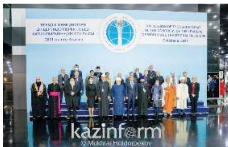
Участники рабочей группы Секретариата Съезда лидеров мировых и традиционных религий