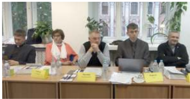
Делегаты Синода на заседаниях

Архиепископ Дитрих Брауэр указал на основные принципы отличия Свода внутрицерковных положений от устава общины. Внутрицерковный устав – это документ для пасторов, который ложится в основу обета и в котором будут содержаться отсылки на различные Положения.