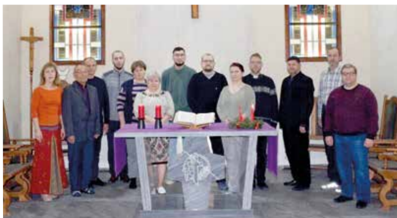
Участники семинара в храме Христа Спасителя