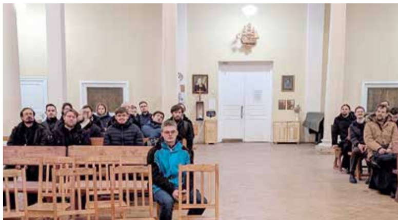
Православные богословы в е.-лют. церкви св. Екатерины на Васильевском о-ве