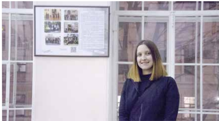
В церковном зале на галерее открылась фотовыставка «История общины Петрикирхе с 1992 по 2022 гг.»