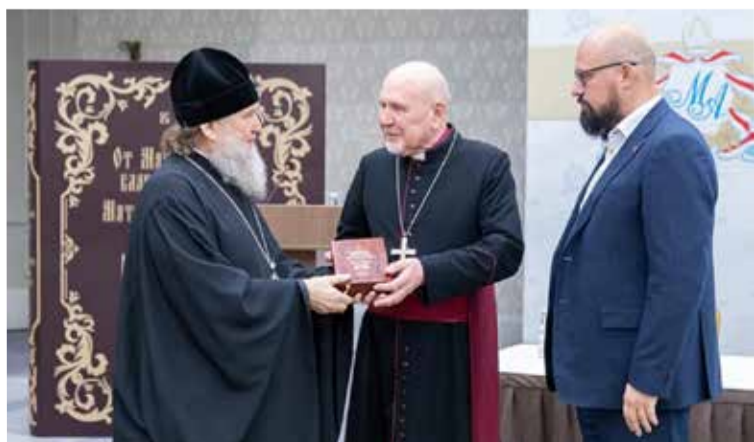
Архиепископ Юрий Новгородов (в центре) на презентации