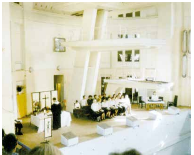
Первое после многих десятилетий богослужение в Петрикирхе 31 октября 1992 года