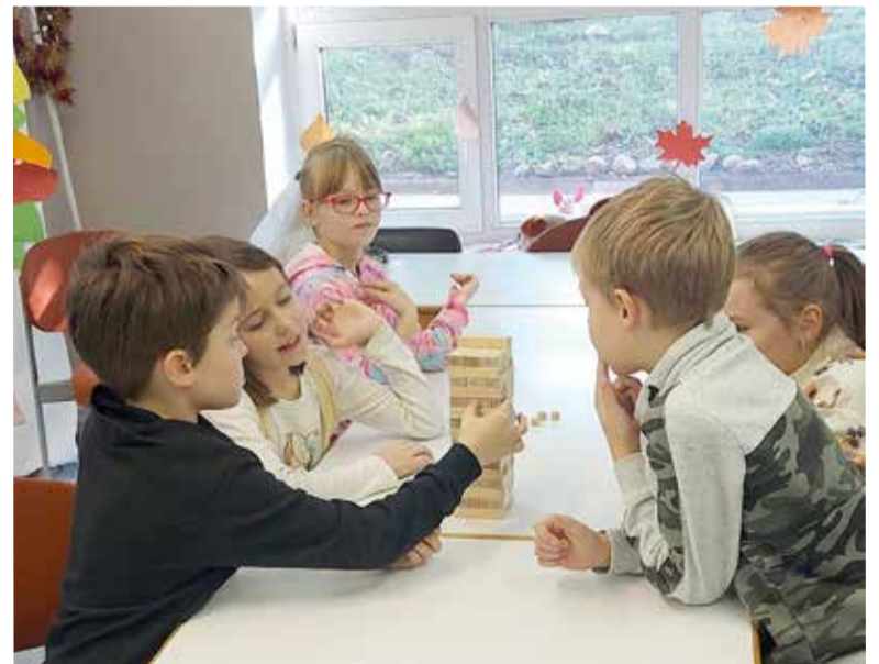
Приятно и ценно видеть отдачу детей, их благодарные сердца...

2 ноября дети отправились на одну из программ музейного фестиваля «Острова» в музей Иммануила Канта в кафедральном соборе. Ребята получили маршрутные листы с различными заданиями, связанными с экспонатами музея, которые они должны были выполнить.