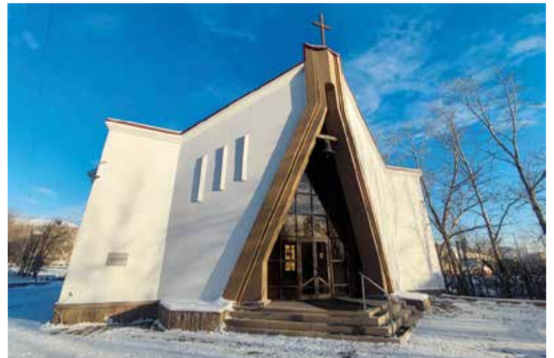
Ев.-лют. церковь в Челябинске