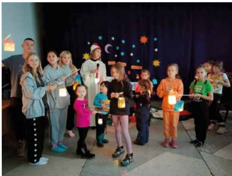
Садчиковка (Костанайская обл.)