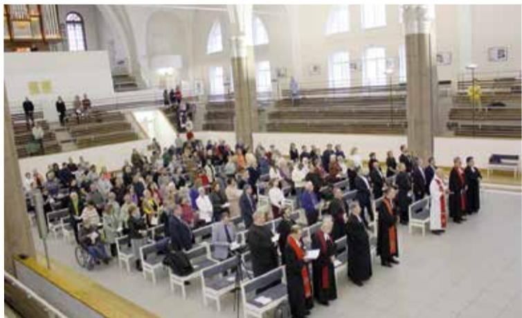
Торжественное богослужение прошло в кафедральном соборе свв. Петра и Павла