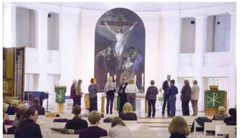
Богослужение в Петрикирхе 31 октября 2022 года