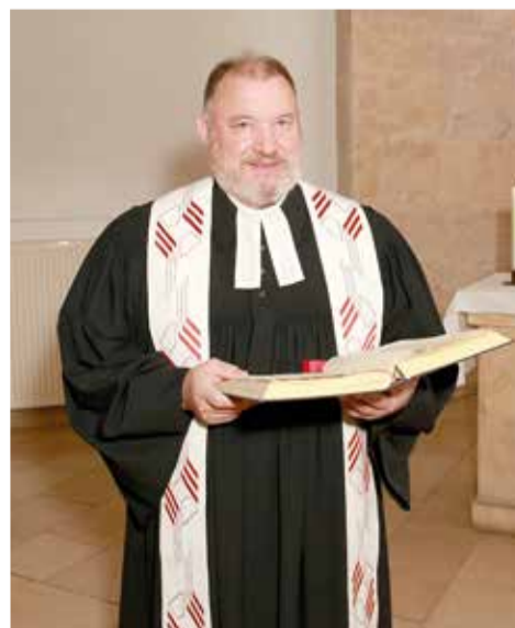
Епископ ЕЛЦГ Рольф Барайс