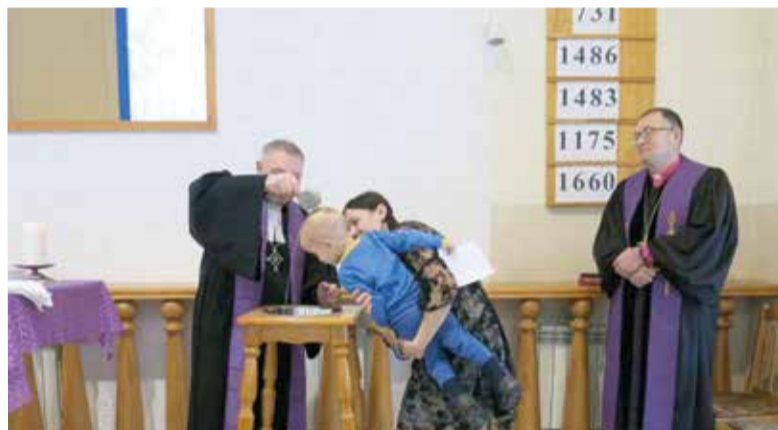
На богослужении в общине Краснотурьинска