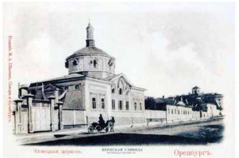
Историческое здание лютеранской церкви в Оренбурге

25 октября этого года торжественное богослужение про-