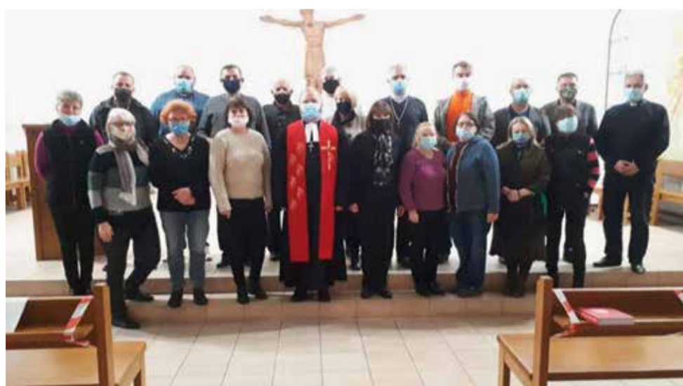
Синодалы в церкви св. Екатерины

Синод утвердил бюджет Церкви на 2021 год, логотип Церкви, а также девиз, видение, миссию, ценности и список важных исторических документов Церкви.