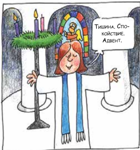
Воскресенье в АДВЕНТ