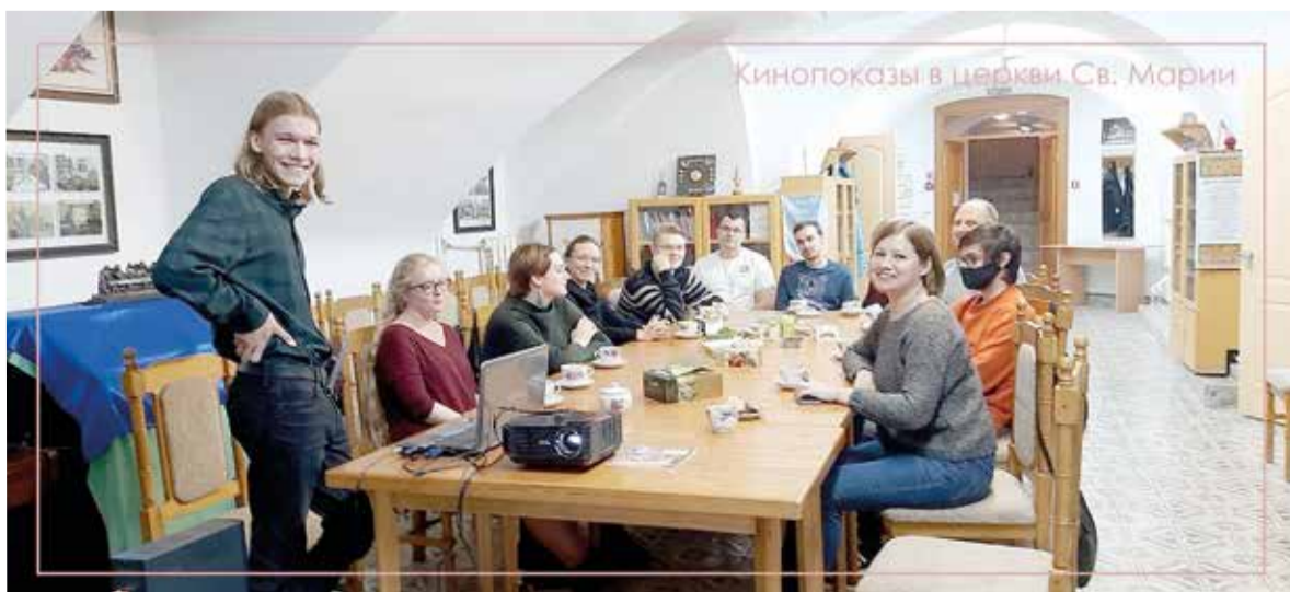
Встреча кино клуба в церкви св. Марии

множеством смыслов, аллюзий и т. д., поэтому и дискуссия получилась очень интересной»; «Мы посмотрели современный фильм на религиозную тематику, очень неоднозначный, даже немного провокационный, и затем обсудили свое понимание, видение этого фильма, смыслы и послания, которые в нем, как нам показалось, были заложены».