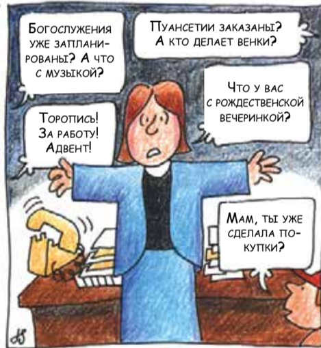
Понедельник в АДВЕНТ