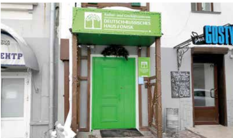
Здание Русско-немецкого дома в Омске