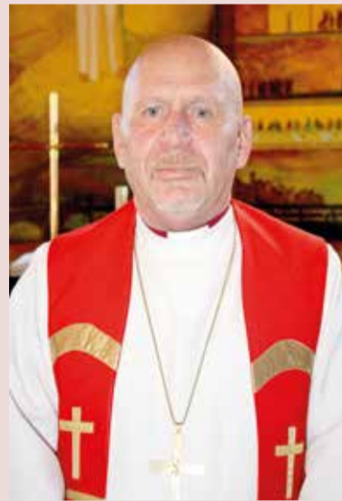
Архиепископ ЕЛЦ РК Юрий Новгородов

28 октября Архиепископу Евангелическо-Лютеранской Церкви в Республике Казахстан (ЕЛЦ РК) Юрию Новгородову исполнилось 65 лет! С юбилеем его поздравил Архиепископ Евангелическо-Лютеранской Церкви России (ЕЛЦР) Дитрих Брауэр. Редакция нашей газеты присоединяется к поздравлениям!