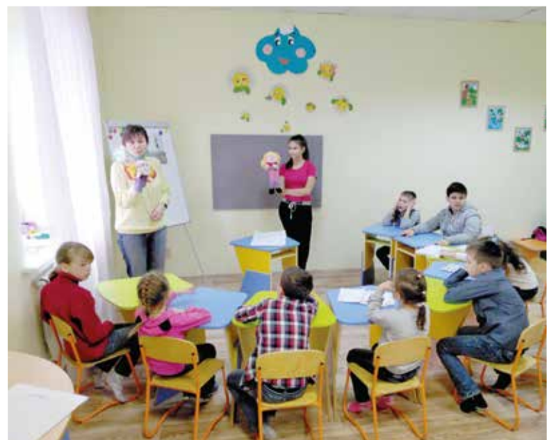
Детский час в общине Саратова ведут участники семинара