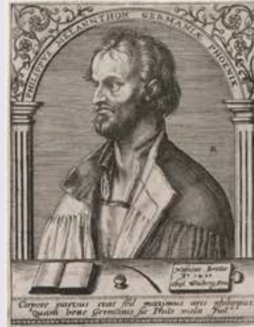
Гравюра Роберта Буассара (1560–1601) с изображением Филиппа Меланхтона