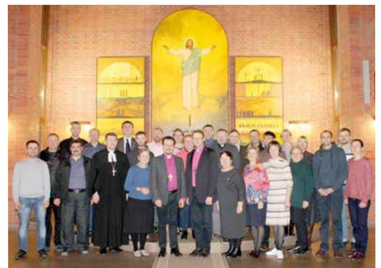
Участники заседаний XXIX Синода в церкви Христа