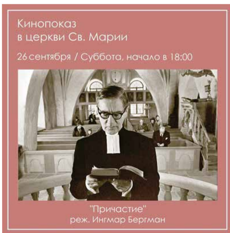
Афиша встречи кино клуба

Да и отзывы участников кино-встреч были положительными, например, такие: «Фильм очень интересный, неоднозначный, со