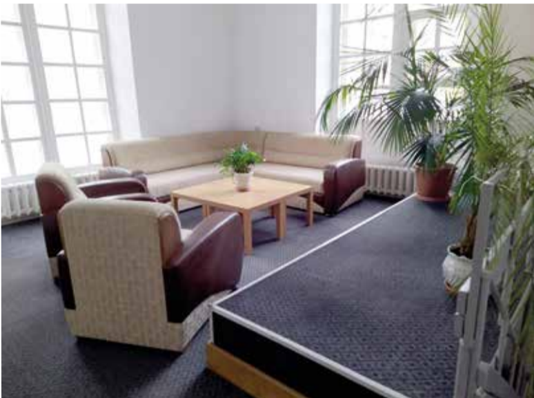
Очень скоро мы сможем вас пригласить в наше новое – теплое и очень светлое пространство в самом сердце Петербурга...

По материалам сайта www.novosaratovka.org