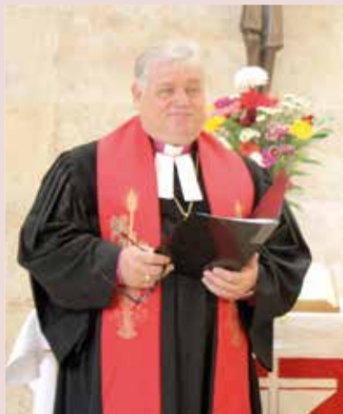
Епископ ЕЛЦ КР Альфред Айхгольц

Свое 60-летие 5 ноября отпраздновал Епископ Евангелическо-Лютеранской Церкви в Киргизской Республике (ЕЛЦ КР) Альфред Айхгольц. Поздравление ему отправил Архиепископ Евангелическо-Лютеранской Церкви России (ЕЛЦР) Дитрих Брауэр. Мы также поздравляем юбиляра!