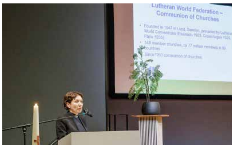
Анне Бургхардт обратилась с речью к синодалам в Люнтерене

По материалам сайта www.lutheranworld.org