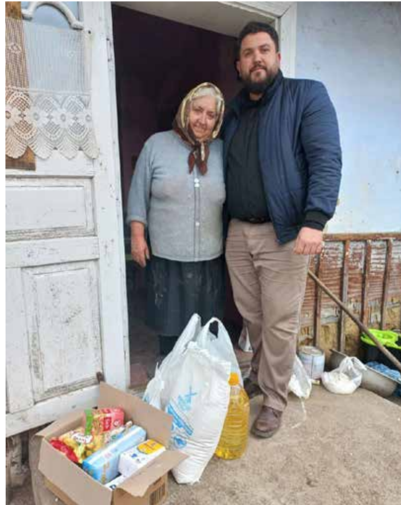
Братская реформатская община св. Андрея в с. Подгайчики Ивано-Франковской обл. стала одним из мест размещения вынужденных переселенцев...