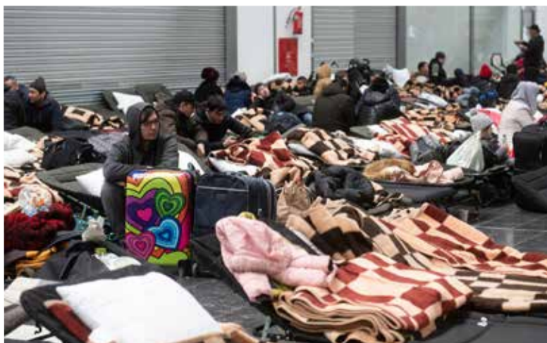
Беженцы из Украины в Корчовой на польско-украинской границе

Этот проект является одним из мероприятий, организованных ВЛФ как реакция на украинский кризис, среди которых также поддержка Церковью, принимающих беженцев в Польше, Румынии, Словакии и Венгрии, и оказание помощи внутренне перемещенным лицам в Украине. ■