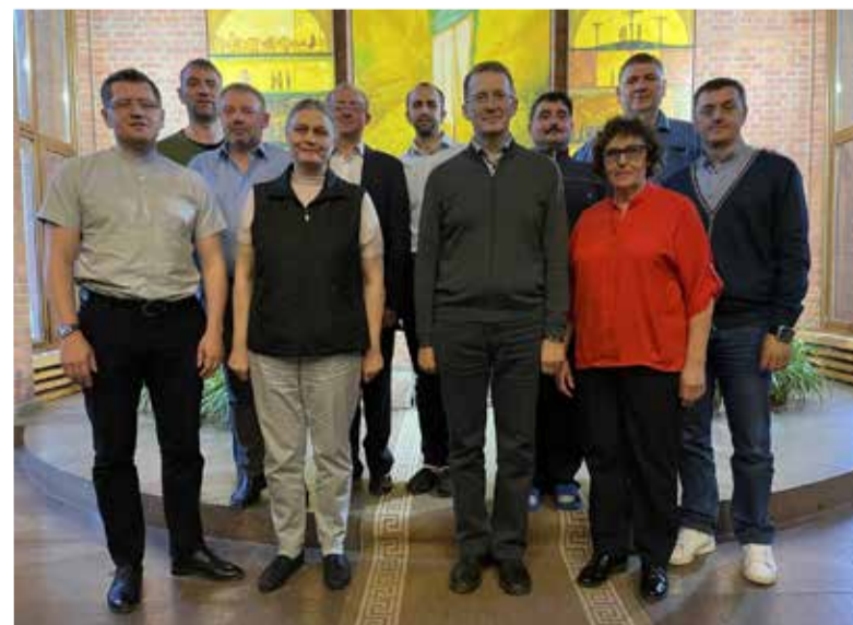
Служители ЕЛЦ УСДВ на встрече

Такие встречи являются поддержкой, мотивацией и укреплением в вере для дальнейшего служения. ■