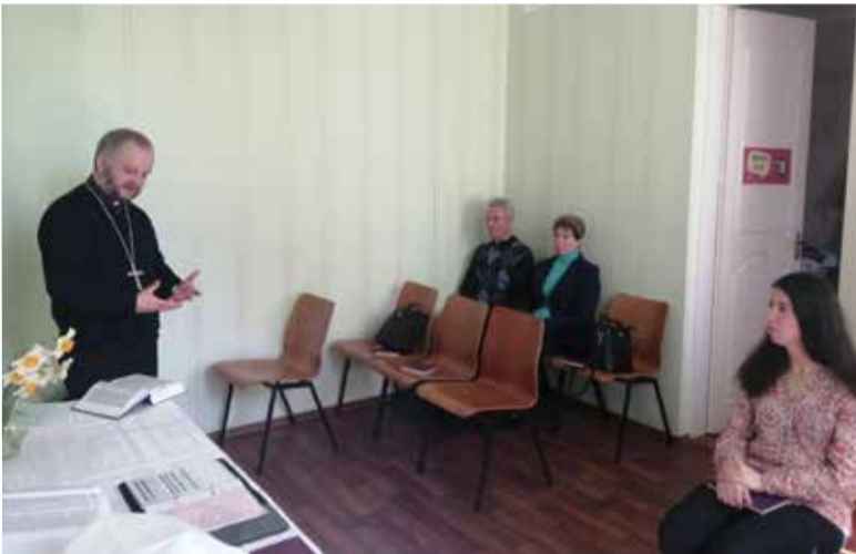
Бискуп Павел Шварц ведет богослужение в общине Белой Церкви