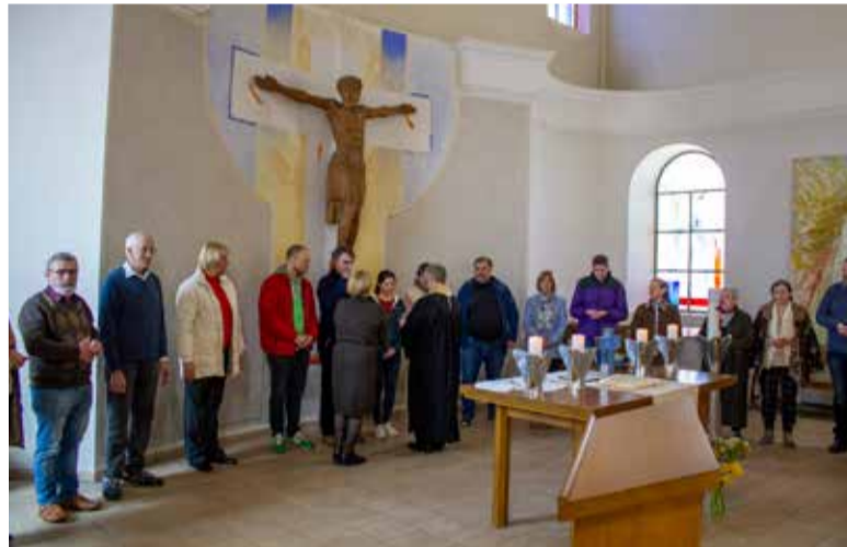
Причастие на богослужении в общине св. Екатерины в Киеве