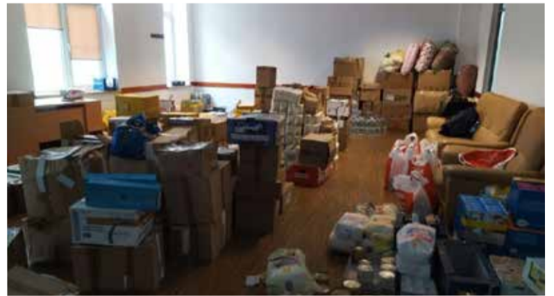
Склад гуманитарной помощи в здании Церковного центра св. Павла в Одессе