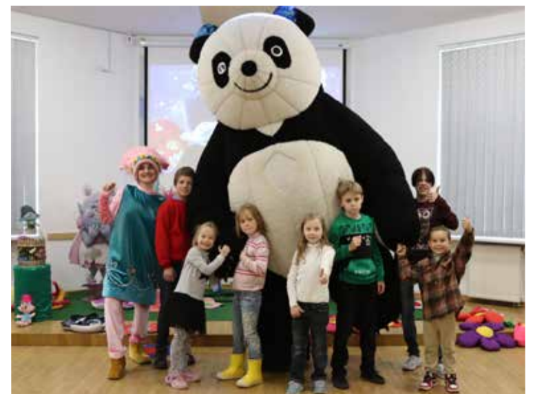
Развлекательная программа для детей из Херсона в Церковном центре св. Павла