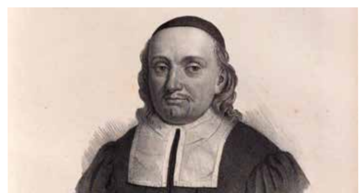
Пауль Герхардт (1607 – 1676).

Некоторые из хоралов Герхардта обладают почти мистическим характером, выражая глубокую любовь ко Христу. К ним относятся „Ich steh an deiner Krippe hier“ («У яслей