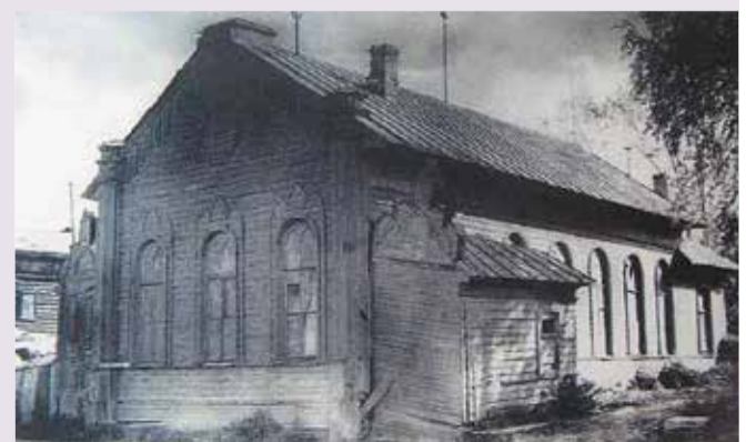
Лютеранская церковь в Вологде. (Не сохранилась).

Лютеране, посылаемые в разные стороны от Москвы на службу в полки и гарнизоны, а также торговцы в городах и посадах устраивали здесь свои дома и образовывали семьи. И получалось так, что там, где размещались гарнизонные службы, где возникали «дворы», там появлялись группы лютеран. Проясняются и их региональные особенности. В костромской группе «немцев» больше всего было военных; в ярославской – в равной степени и военные, и купцы; вологодская группа формировалась преимущественно из торговых людей.