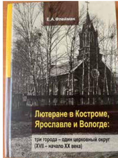
Книга объемом 242 страницы вышла тиражом 150 экземпляров. На обложке – кирха в Костроме. (Не сохранилась).

Лютеране оставили заметный след в развитии региона, активно