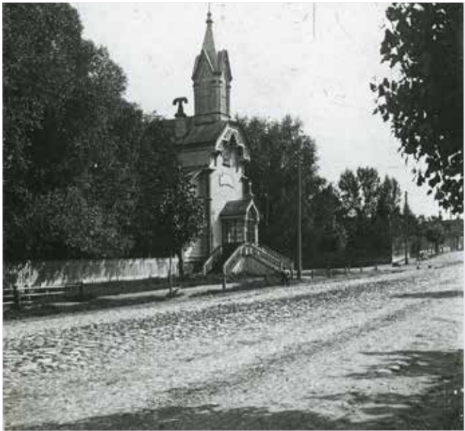
Лютеранская церковь в Рыбинске Ярославской губернии. (Не сохранилась).

Шел процесс зарождения будущих официальных лютеранских общин, который не мог не испытать воздействия регионального фактора. И неудивительно, что первые группы лютеран появлялись в местах, расположенных на речных трактах.