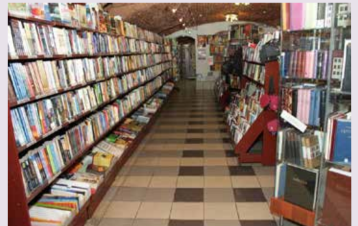
Магазин «Слово» располагается в соседнем доме с кафедральным собором свв. Петра и Павла (Петрикирхе) в Санкт-Петербурге.