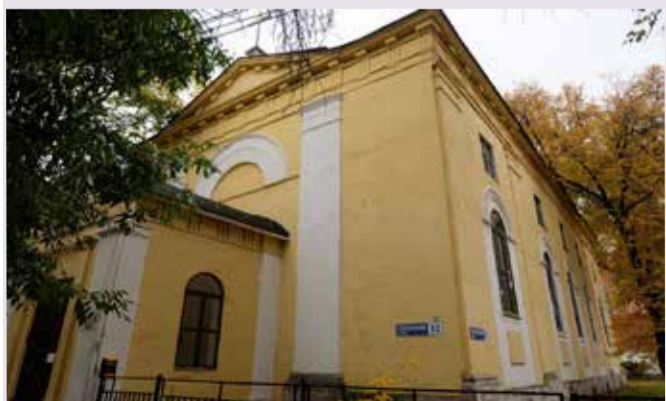
Лютеранская церковь свв. Петра и Павла в Ярославле. (Действующая).

Возникновение церковного округа повлекло за собой строительство кирх. За счет жертвований прихожан, средств лютеранской «Кассы взаимопомощи» и государственной поддержки были возведены лютеранские кирхи в Костроме, Вологде, Ярославле, Великом Устюге, Рыбинске. ■