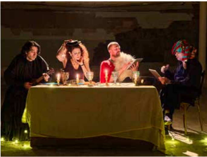
Сцена из спектакля.