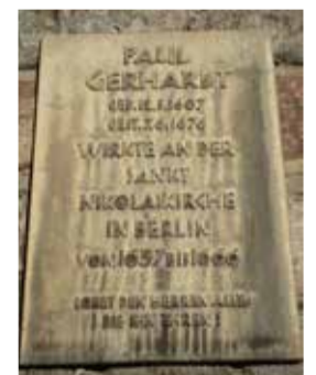
Мемориальная доска, посвященная Паулю Герхардту, на церкви св. Николая в Берлине.