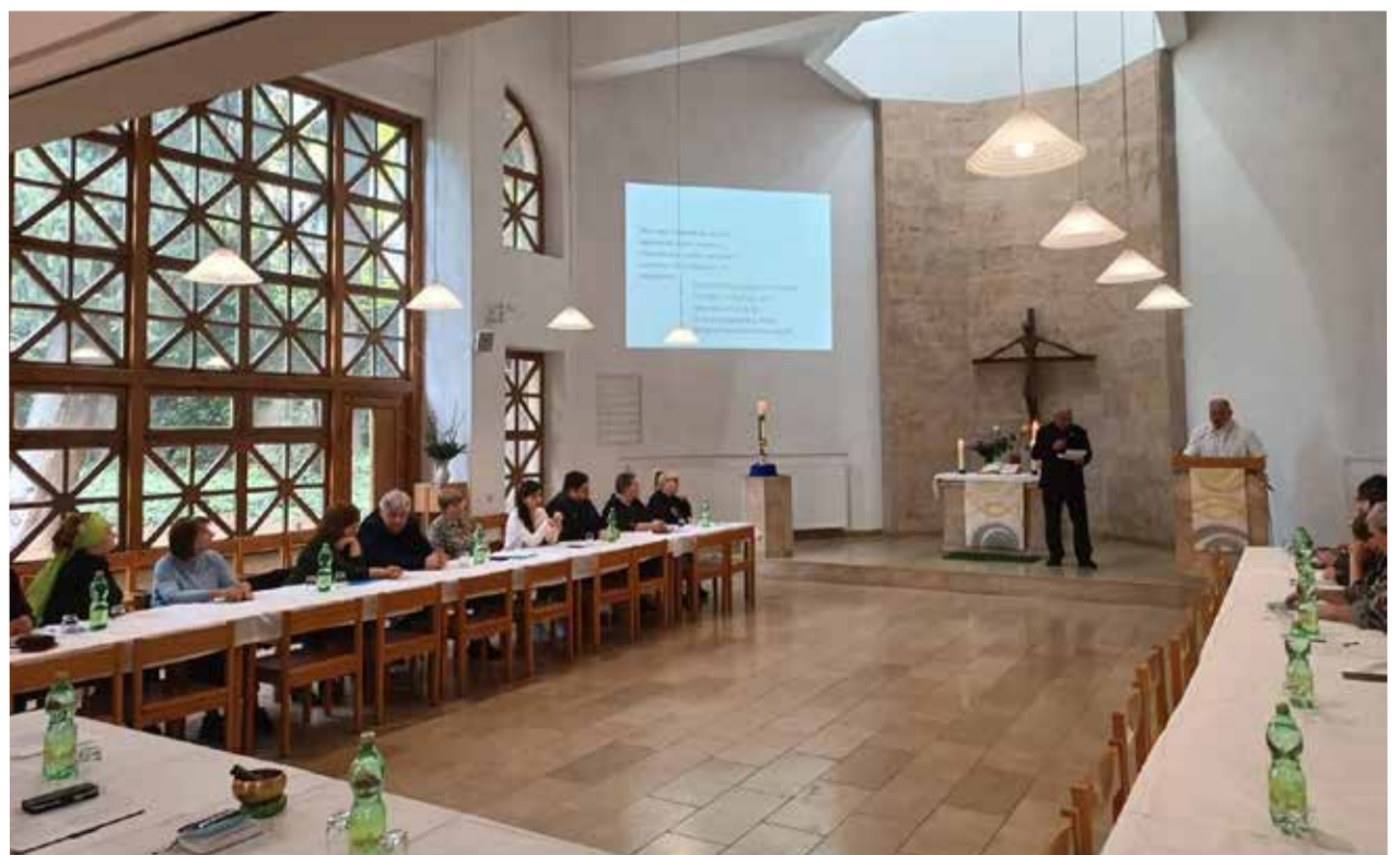
Заседание Синода прошло в церкви Примирения.