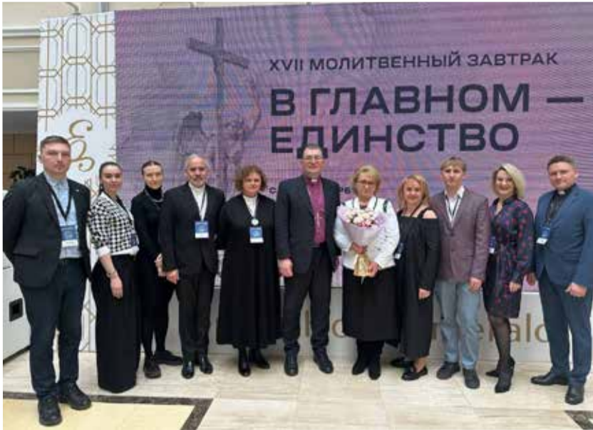
Делегация Союза ЕЛЦ приняла участие в XVII Молитвенном завтраке.

«Молитвенный завтрак в Санкт-Петербурге». Продолжение. Начало на с. 1