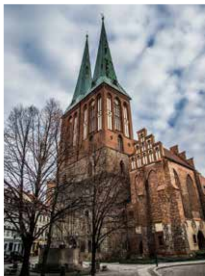
Церковь св. Николая в Берлине, где Пауль Герхардт служил с 1657 по 1666 год.

350 лет назад, 27 мая 1676 года, пастор Пауль Герхардт умер в Люббене в Шпреевальде. Он родился в 1607 году в Грэфенхайнихене, недалеко от Виттенберга, и жил в столетие, ознаменованное Тридцатилетней войной, чумой и конфессиональными спорами.