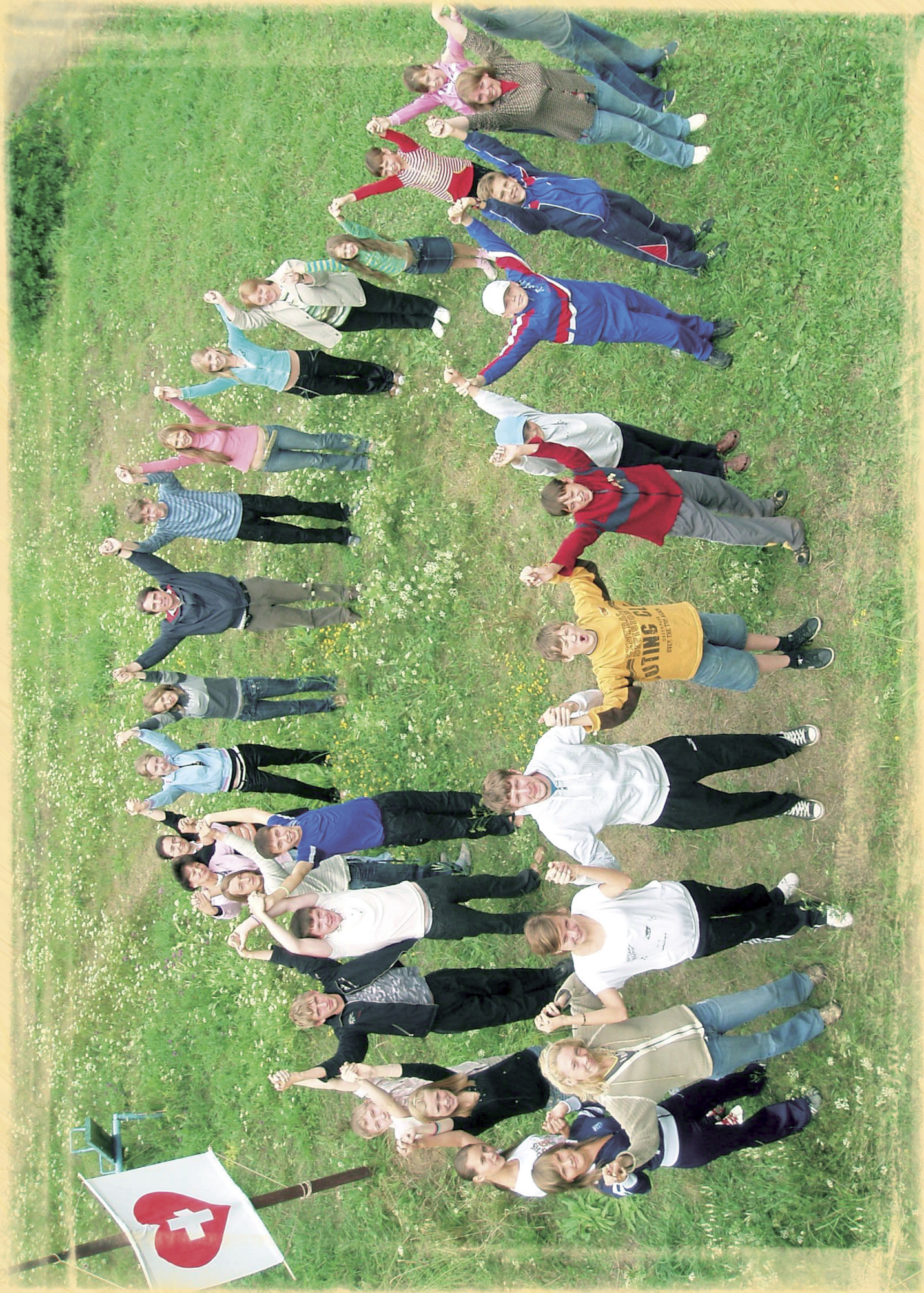
Детско-молодежный христианский лагерь «Человек по сердцу Господа», г. Пермь Kinder- und Jugendlager bei Perm "Mensch nach dem Herzen Gottes"