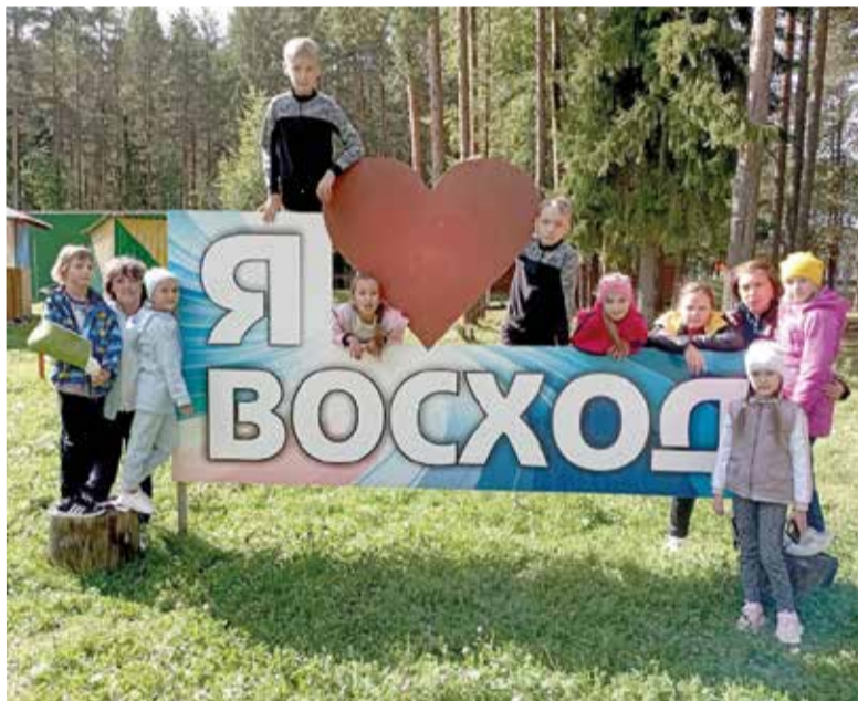
Детский христианский лагерь прошел в оздоровительном комплексе «Восход»

Краснотурьинск. Какими нас создал Господь, что необходимо слушать, смотреть и о чем говорить – об этом рассуждали ребята в детском христианском лагере, который прошел со 2 по 4 сентября в оздоровительном комплексе «Восход» в Краснотурьинске (Свердловская обл.).