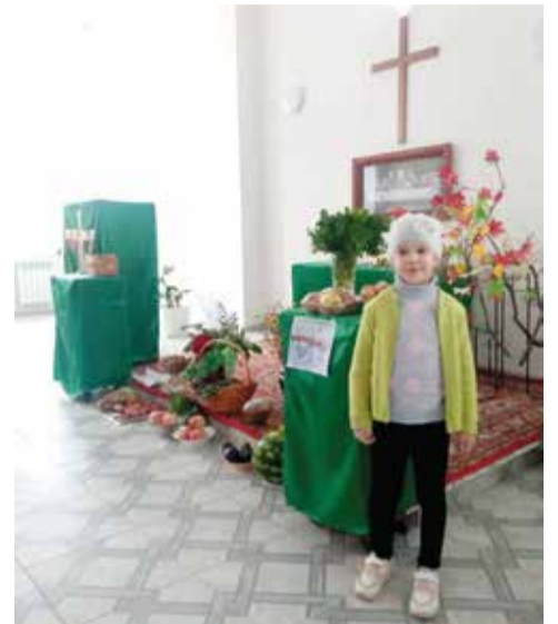
Камышин (Волгоградская обл.)