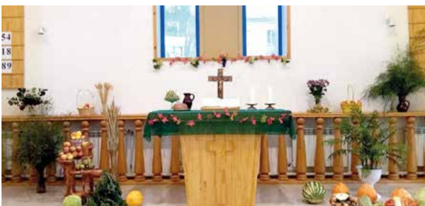
Краснотурьинск (Свердловская обл.)