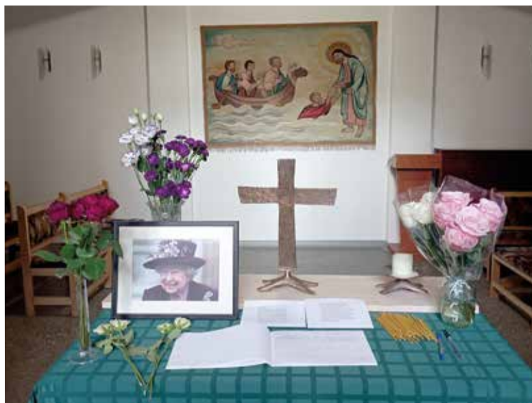
По инициативе англиканской общины в капелле собора 9 сентября был установлен небольшой мемориал Елизавете II...

«Вы стали для нас эпохой. Спасибо Вам!», «Спасибо за Вашу историю любви (74 года – это сильно!)», «Мир праху удивительной женщины и королевы», «Спасибо миру, что такие люди бывают на свете!» – вот лишь несколько из многих надписей, оставленных посетителями собора в книге.