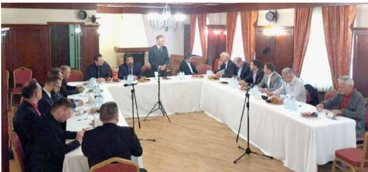
На заседании обсуждались вопросы благотворительности, религиозных свобод, празднование 20-летия КСГПЦР и 505-летия Реформации, а также процесс и шаги создания Музея протестантизма...