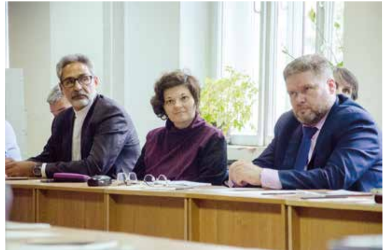
Гости круглого стола