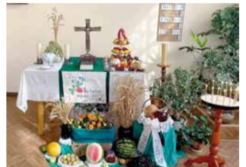
Бердянск (Запорожская обл.)