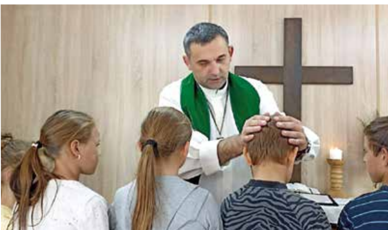
Благословение на новый учебный год в Новоградковке