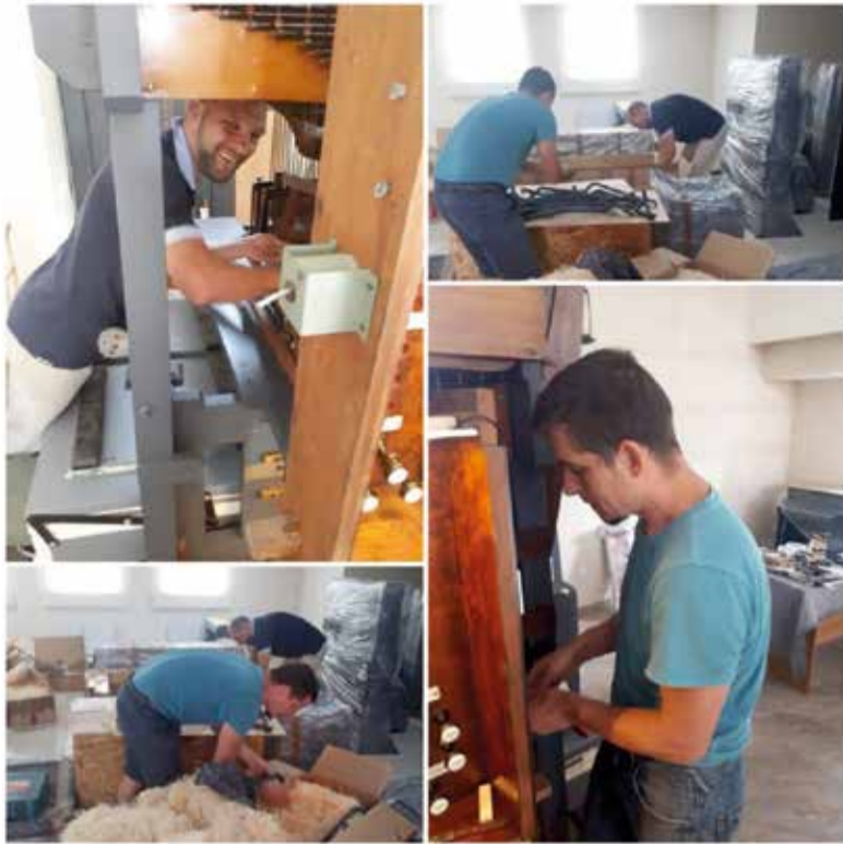
Сборка и настройка органа Martin &amp; Coate в храме Христа Спасителя