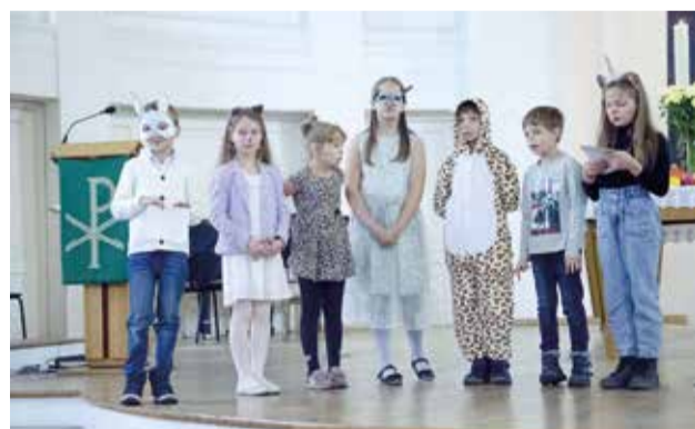
Санкт-Петербург (собор свв. Петра и Павла)