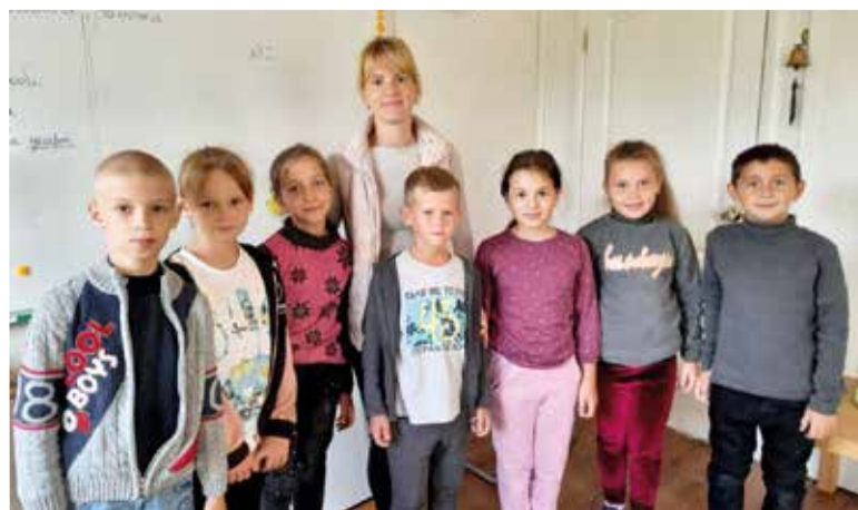
Начало учебного года в новом Детском центре в Петродолинском