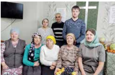
Анжеро-Судженск (Кемеровская обл.)