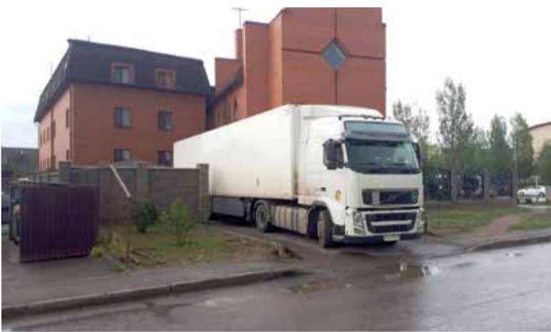
Вечером 8 июля орган был выгружен в помещении церкви в Астане...