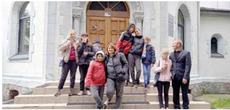
Группа из общины Большой Поляны в Калининграде

Наша поездка 10 сентября, в субботу утром, началась с молитвы о благословении тех, кто