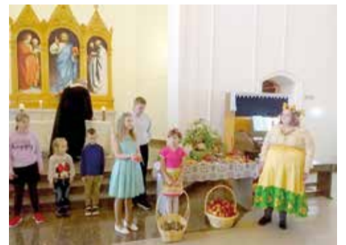
Зоркино (Саратовская обл.)