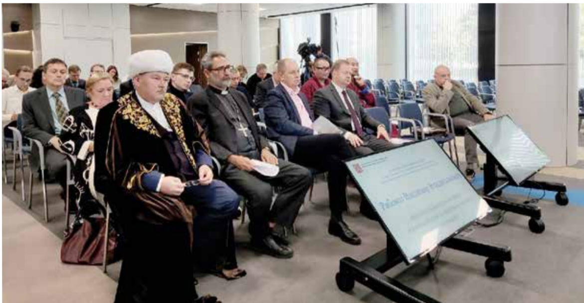
Участники конференции на заседании