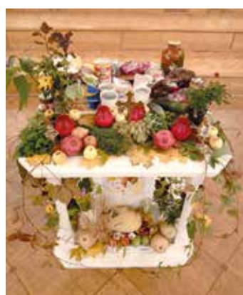
Санкт-Петербург (церковь св. Екатерины)