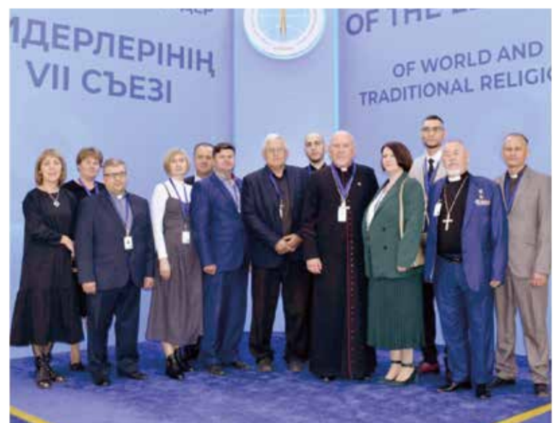
Делегация Евангелическо-Лютеранской Церкви в Республике Казахстан на Съезде