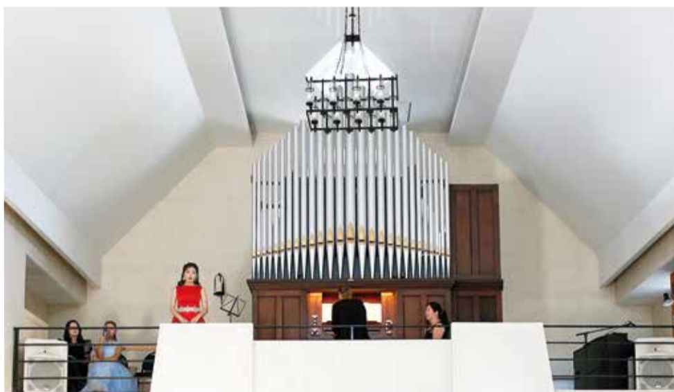
На концерте, посвященном пятилетию освящения храма, прозвучали произведения на новом органе

Астана. 24 сентября в храме Христа Спасителя – кафедральном соборе Евангелическо-Лютеранской Церкви в Республике Казахстан (ЕЛЦ РК) состоялся первый органный концерт, посвященный пятилетию освящения храма.