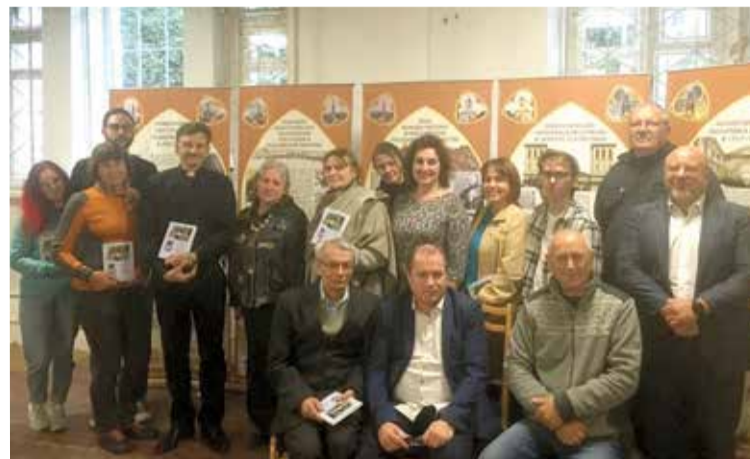
Участники встречи с новыми сборниками