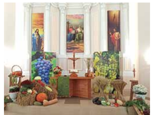
Маркс (Саратовская обл.)