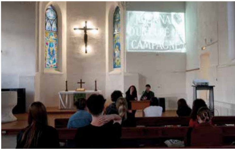
Кинопоказ в церкви св. Марии 23 июня.

Фильм «Дневник сельского священника» является экранизацией романа Жоржа Бернаноса.