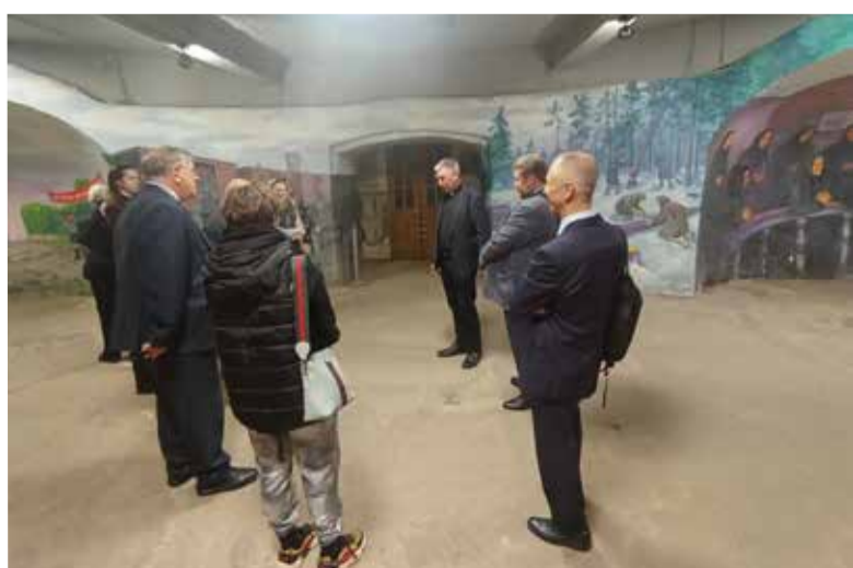
В катакомбах Петрикирхе пастор остановился подробнее на судьбе российских немцев в советское время.