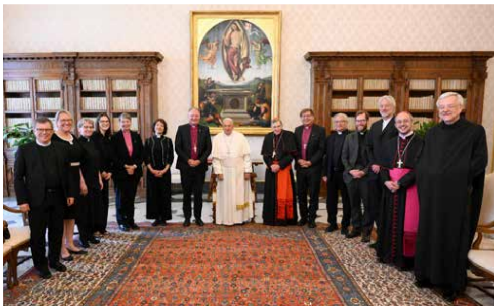
Папа Франциск (в центре) принимает делегацию ВЛФ в Ватикане.

По материалам сайта www.lutheranworld.org