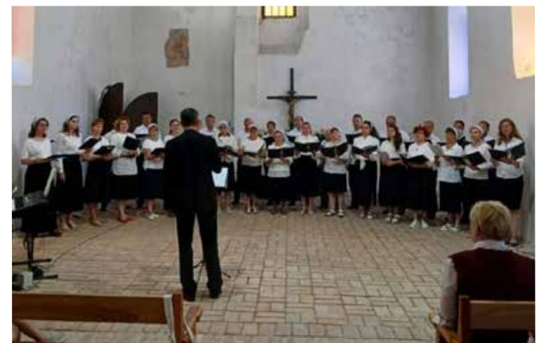
Музыкальную программу представили коллективы разных протестантских конфессий.