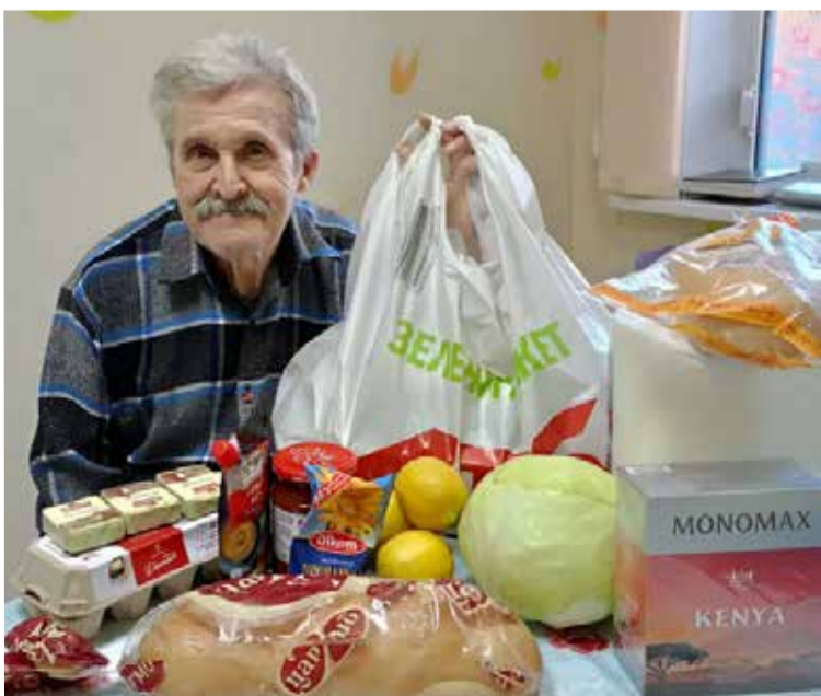
Многие прихожане из общин НЕЛЦУ получили в качестве пасхального подарка сертификаты для приобретения продуктов питания.