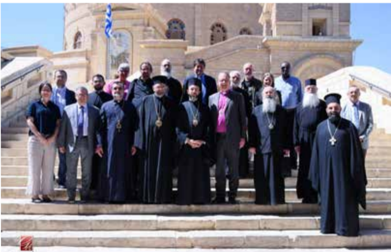
Члены Международной объединенной лютеранско-православной комиссии перед Патриаршим монастырем св. Георгия в старом городе Каира.