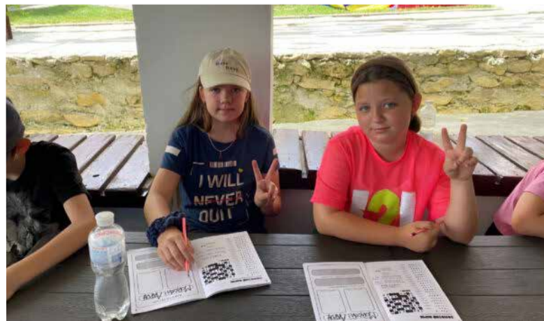
Специально для лагеря была создана тематическая тетрадь.

Финансовую поддержку смены оказал Фонд Густава Адольфа через программу „Kindergabe“ («Детский дар»). ■