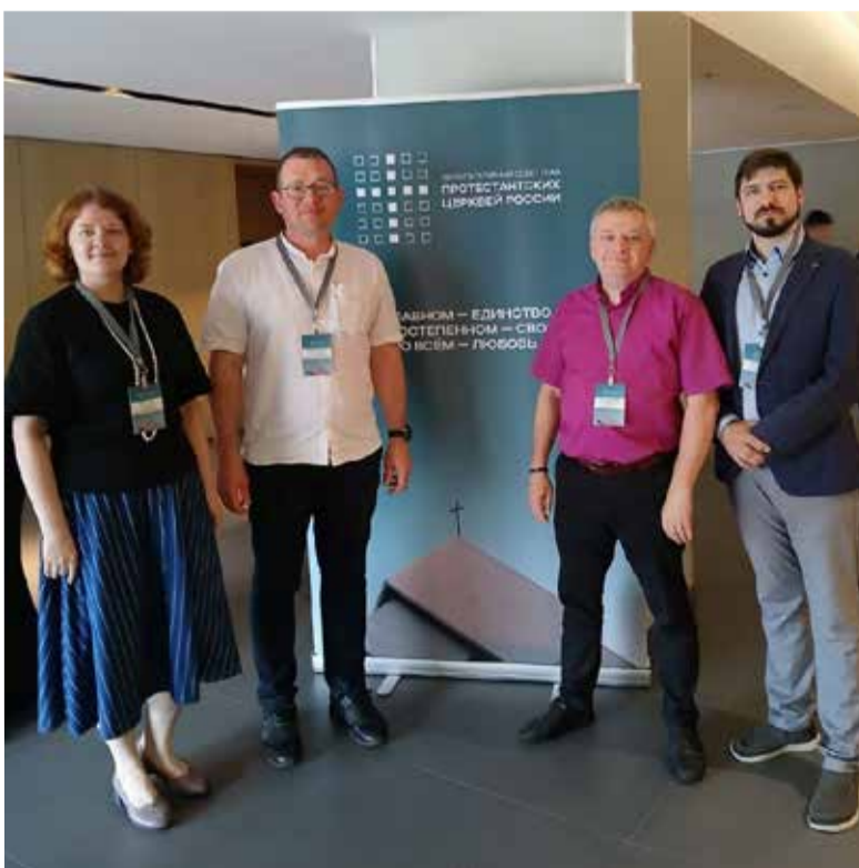
Представители Евангелическо-Лютеранской Церкви России на саммите.