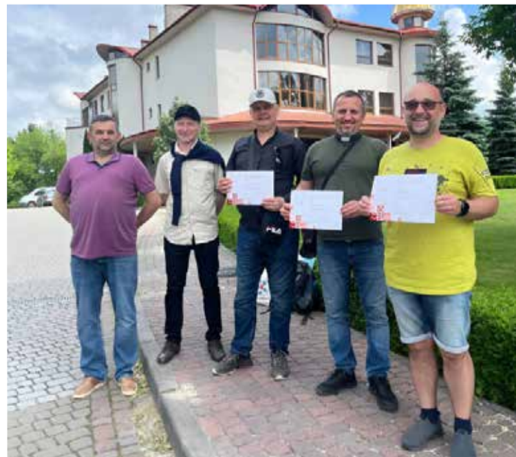
Слушатели курсов в конце получили сертификаты.