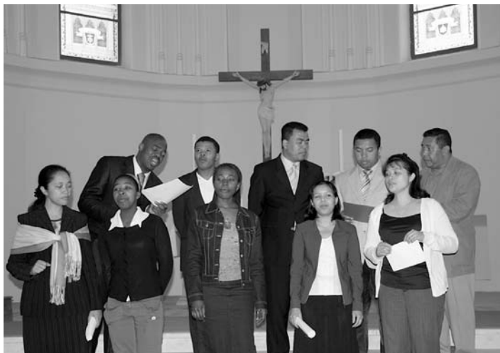
ХОР ФРАНКОЯЗЫЧНОЙ ОБЩИНЫ НА ПРАЗДНИКЕ В СОБОРЕ