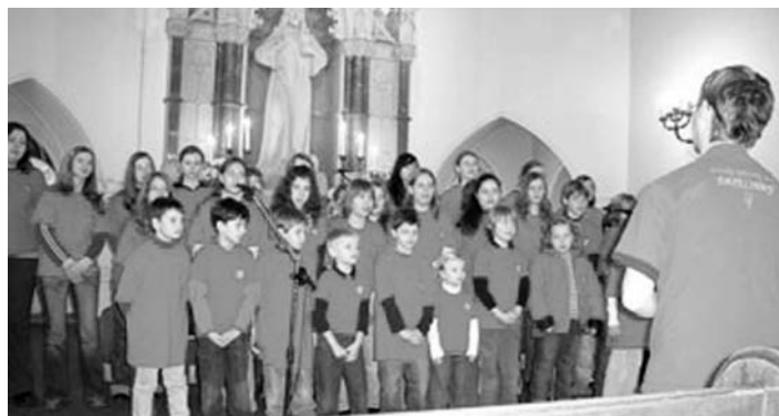
ВЫСТУПАЮТ РЕБЯТА ИЗ СЛОВАКИИ