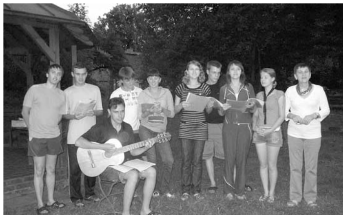
ПРОЩАЛЬНЫЙ ВЕЧЕР НА ТУРБАЗЕ ЛЮТЕРАНСКОЙ ЦЕРКВИ ОКРУГА КОТБУС

провождении оркестра. Наш квартет духовых инструментов играл в его составе. Во время поездки мы посетили лютеранскую школу, каждый день проводили библейские занятия. Дали концерт в доме престарелых в Котбусе, где исполнили песни на русском и немецком языках в сопровождении духового квартета и гитары. Побывали в немецкой деревне Хорно, которая была уничтожена из-за того, что в Восточной Германии ведется добыча бурого угля открытым способом – в результате многие деревни были разрушены, а жители переселены в другие районы. Чтобы сохранить память об этих деревнях, был создан видеоархив. Из него можно узнать, как выглядели деревни, и как бульдозеры сносили дома. В Хорно на просмотр выставлены деревянные макеты всех разрушенных церквей. Перед отъездом группа встретила с бывшим пробстом