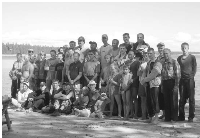
МУЖЧИНЫ НА БЕРЕГУ ОЗЕРА

нить такое положение вещей, мы решили организовать некоторые мероприятия только для мужчин. А мужчин объединяют путешествия, походы, рыбалка, беседы, сауна и Божье Слово. Часто мужчины с утра до вечера находятся на работе и мало времени уделяют своим детям. Поэтому мужчины, отправляющиеся в лагерь, могут взять с собой своих сыновей. Отцы являются примером для своих детей и, таким образом, отношения между отцами и детьми укрепляются. С помощью лагеря мы также пытаемся подготовить в этих мальчиках будущее Церкви».