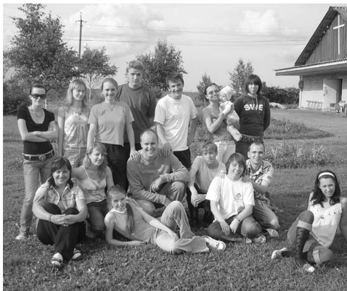
РЕБЯТА И ОРГАНИЗАТОРЫ

Единство среди христиан и радость от Евангелия придают сил для повседневной жизни.