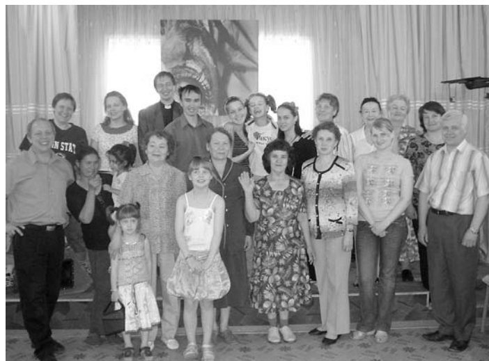
НА ОДНОМ ИЗ БОГОСЛУЖЕНИЙ

ловек, но среди них есть дети, а это значит – у нас всё впереди. Все наши библейские часы и молитвы, а также богослужения проходят у меня на квартире, но мы активно молимся, чтобы с Божьей помощью найти подходящее помещение для богослужебной деятельности. Просим всех читателей, «Вестей» молиться за нас».