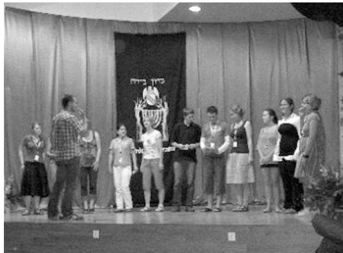
РАБОТА ПЕСЕННОЙ МАСТЕРСКОЙ