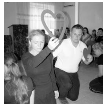
ЕВАНГЕЛИЗАЦИОННАЯ ГРУППА ИЗ ГЕРМАНИИ

В последний день семинара мы выехали на природу в Кара-Алму, где нас ждала интересная духовная программа, отдых и общение.