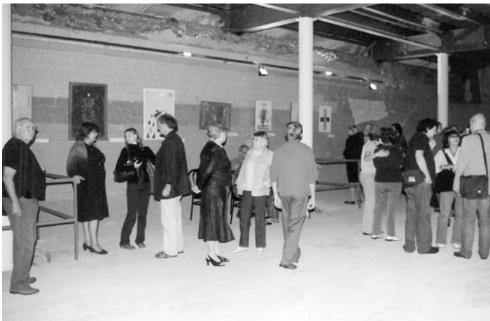
ЧАША БЫВШЕГО БАССЕЙНА СЛОВНО «ОЖИЛА» С Появлением в ней картин

Организованная общиной св. Анны и св. Петра выставка продлится до 22 сентября, во время ее проведения собираются пожертвования на реставрацию храма.