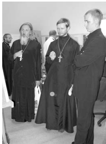
СВЯЩЕННОСЛУЖИТЕЛИ КАРЕЛИИ ДЕЛЯТСЯ ОПЫТОМ РАБОТЫ

КОНДОПОГА. Министерство Республики Карелии по вопросам национальной политики и связям с религиозными объединениями провело 22 июля на базе прихода Успенского храма г. Кондопоги Петрозаводской и Карельской епархии Русской Православной Церкви рабочее совещание с руководителями религиозных организаций Республики Карелии. В его работе также приняли участие представители администрации Кондопожского муниципального района, муниципаль-