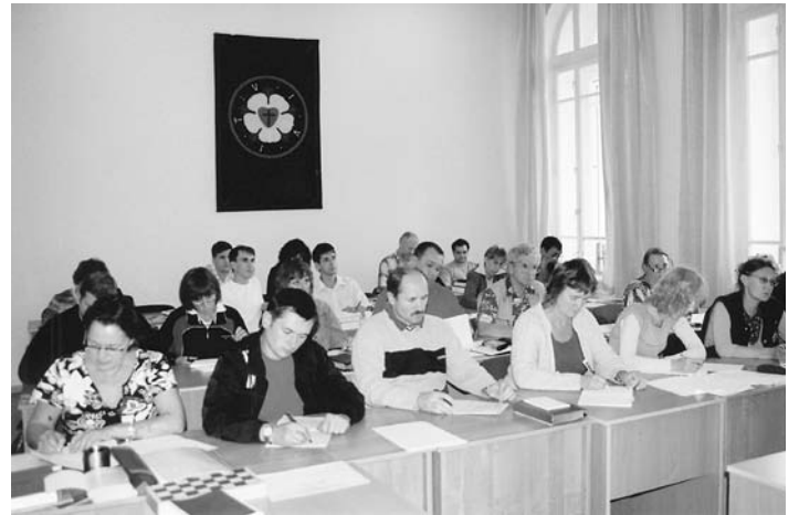
СЕМИНАРИСТЫ ВО ВРЕМЯ ЗАНЯТИЙ

Но в этот раз внимание семинаристов было приковано к выпускам новостей. Война на Кавказе застала нас врасплох. Мы не переставали думать о невинных жертвах насилия. В день начала занятий было отведено время для просительной молитвы о мире на Кавказе. Каждый день во время утренней и вечерней молитвы мы в сердце своем просили Господа о ниспослании мира и о примирении между народами. Нам было больно слышать о страданиях наших братьев и сестер. Пусть Господь благословит нас на пути нашего служения и дарует мир всем страждущим на этой земле.