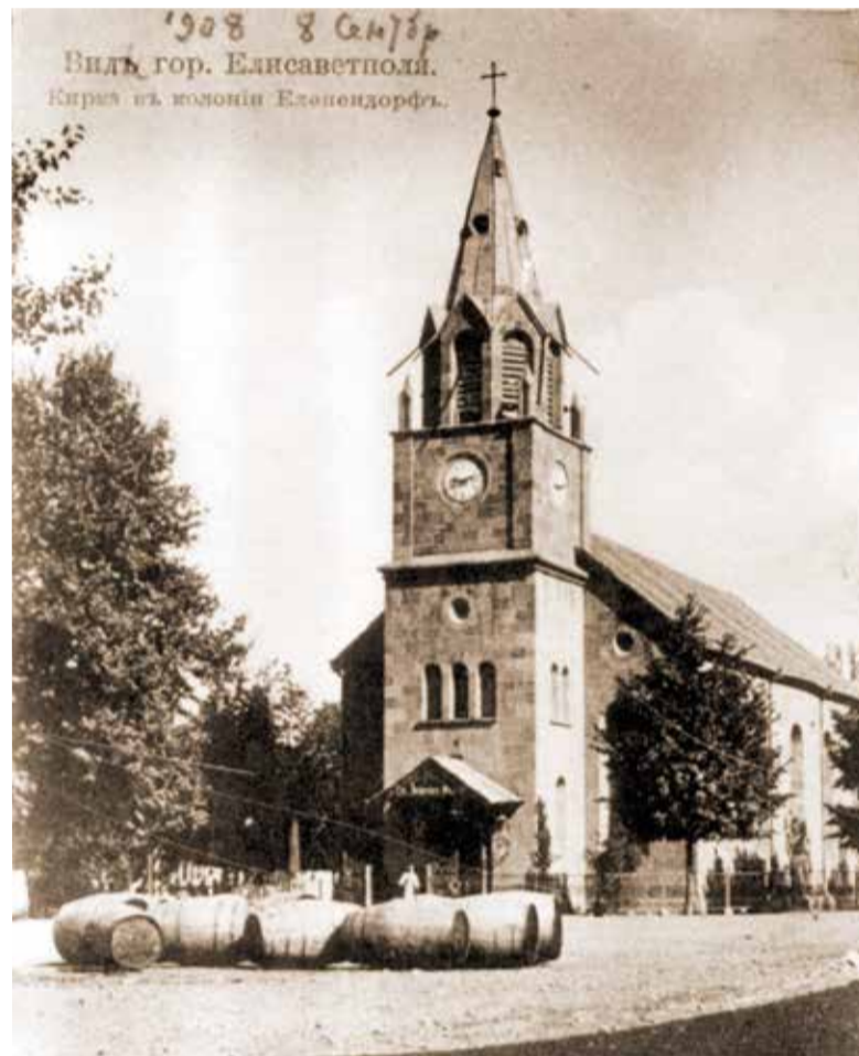
Церковь св. Иоанна в Еленендорфе (Гейгеле). Построена в 1857 году. Историческое фото

В Баку мы прибыли далеко за полночь. День был весьма насыщенным. Мне было также очень приятно пообщаться с коллегами из других общин и с представителями Госкомитета. ■