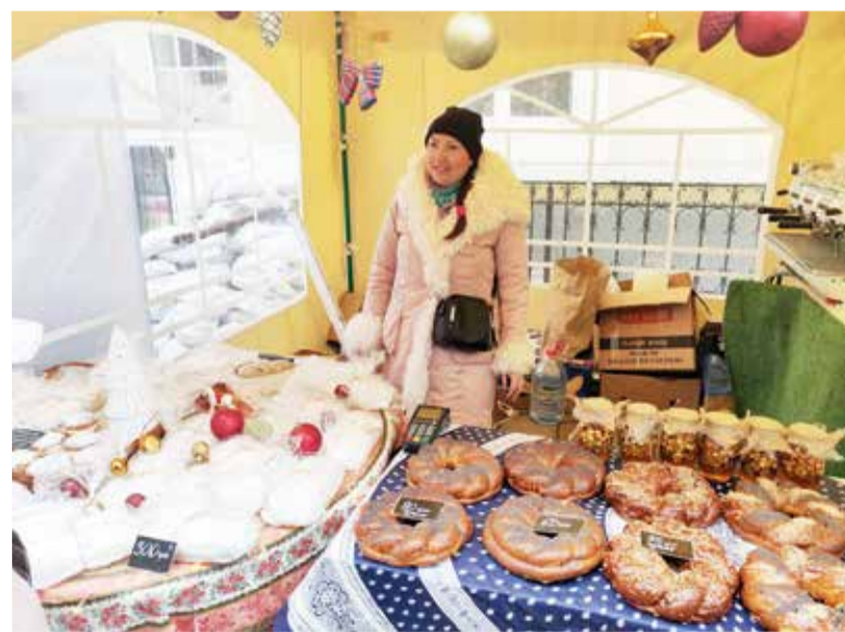
На ярмарке можно было приобрести традиционные рождественские и немецкие блюда – колбаски и выпечку, а также украшения, игрушки и многое другое...

«Черноморские немцы сыграли огромную роль в развитии Одессы и всего региона в целом. Среди них были выдающиеся администраторы, инженеры, ученые, предприниматели, которые