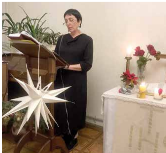
Черняховск (Калининградская обл.)