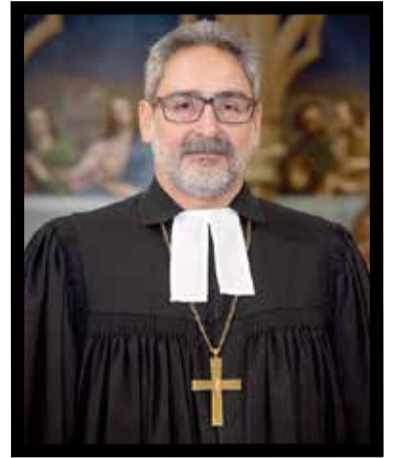
Епископ Андрей Джамгаров (1967–2023)

Траурное богослужение состоялось 14 февраля в соборе св. Марии в Саратове. ■