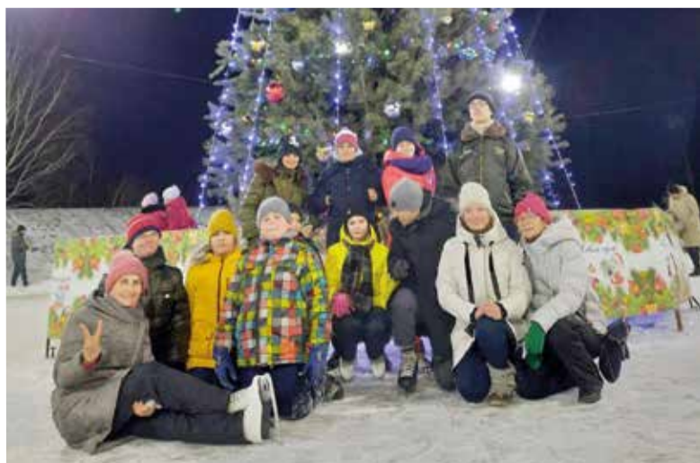
Ребята ежедневно ходили на каток...

Надеемся, что дни, проведенные в лагере, наполненные незабываемыми впечатлениями и полезными делами, надолго останутся в памяти у его участников. ■