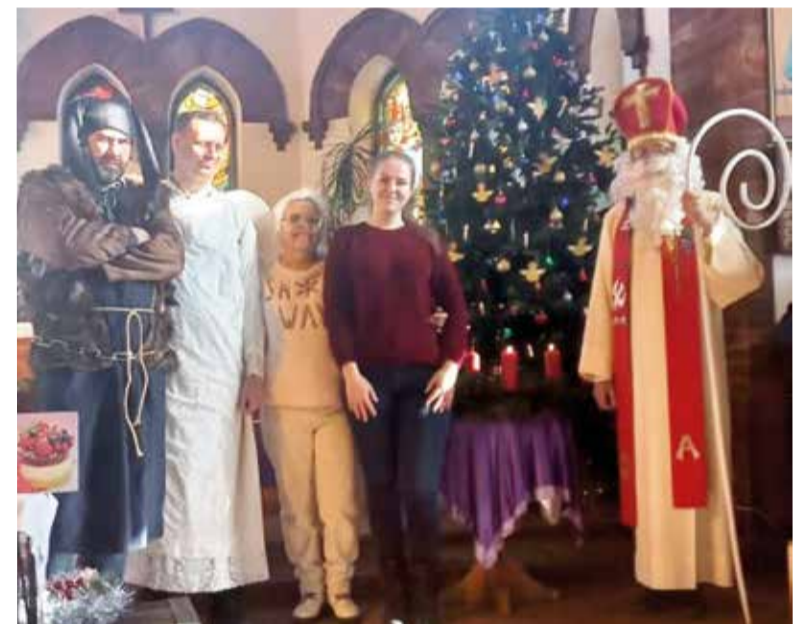
Праздник св. Николая в церкви св. Павла

Но вера и надежда прихожан доказали, как дорого им Рождество. Они исполнили рождественские гимны, принесли свои символы Рождества, вернув