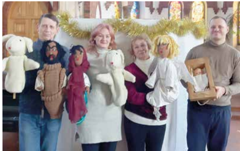
Актеры кукольного спектакля о рождении Младенца Христа

Хочется верить, что чудесный свет Рождества озарил сердца всех участников наших праздничных мероприятий. ■