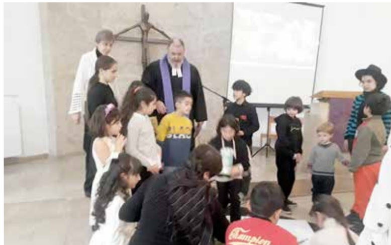
Семейное богослужение в Первый Адвент провел епископ Рольф Барайс

На Первый Адвент зажигается первая свеча на адвентском венке, даря нам свет ожидания и надежды, что и было темой богослужения. Дети заранее