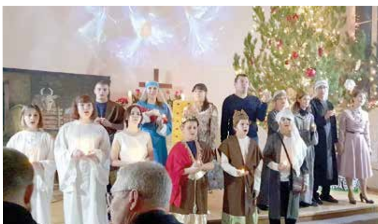
Спектакль «Сила Рождества» экспериментального театра «Встань и иди»