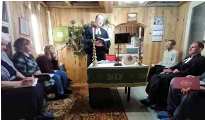
Богослужение в пос. Крестцы (Новгородская обл.)