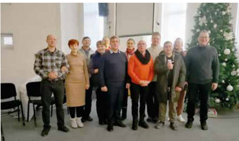
Участники семинара в соборе св. Марии в Саратове

ОМСК/САРАТОВ. С 4 по 8 января прошел итоговый семинар для студентов второго курса образовательного проекта «О.К. Проповедник».