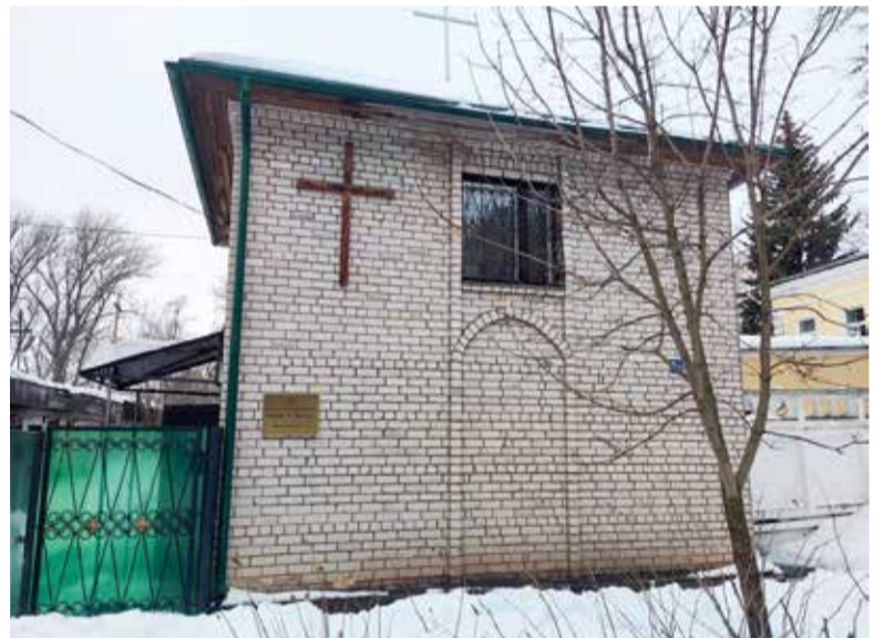
Церковное здание общины св. Николая в Великом Новгороде