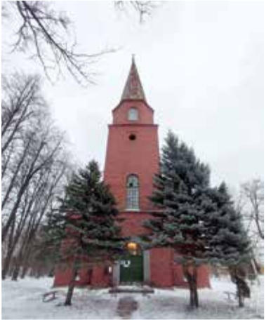
Церковь св. Петра в Печорах