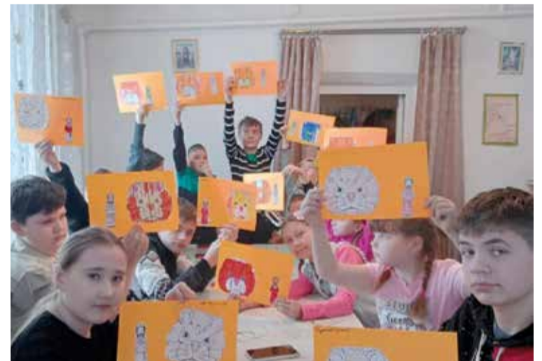
Ребята выполняли задания, развивающие творческие способности...