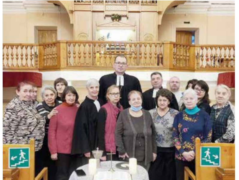
С общиной в церкви св. Екатерины в Архангельске