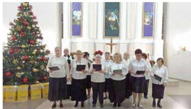
Маркс (Саратовская обл.)