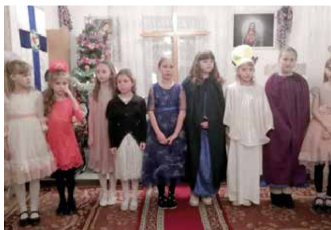
Камышенка (Акмолинская обл.)