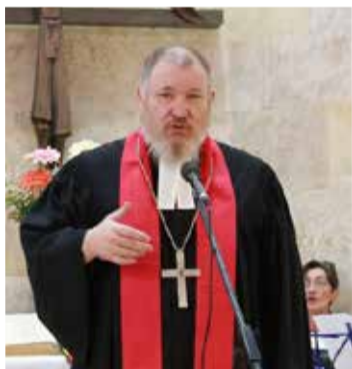
Епископ Рольф Барайс