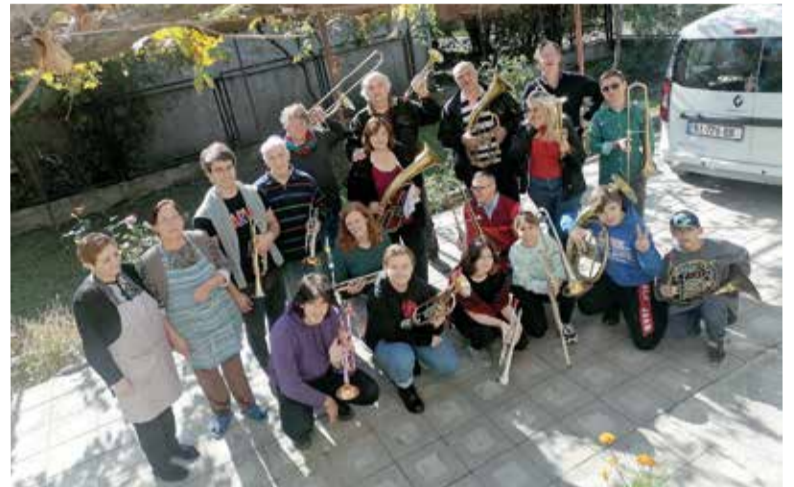
Наша группа из 18 человек в возрасте от 14 до 80 лет отправилась в Кахетию, где мы должны были научиться играть на медных духовых инструментах...

В субботу днем, когда наши губы уже с непривычки онемели, для всех на балконе был проведен экспресс-курс по чтению нот. Вечером мы уже могли сыграть несколько нот.