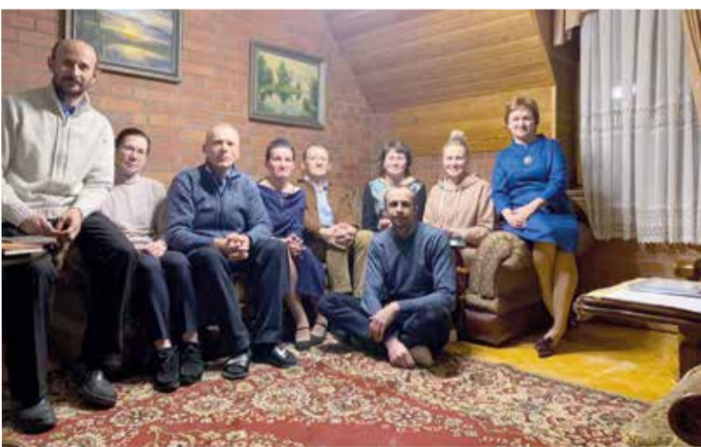
Участники семинара в Церковном центре Христа в Омске