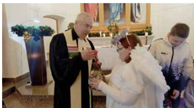
Зоркино (Саратовская обл.)