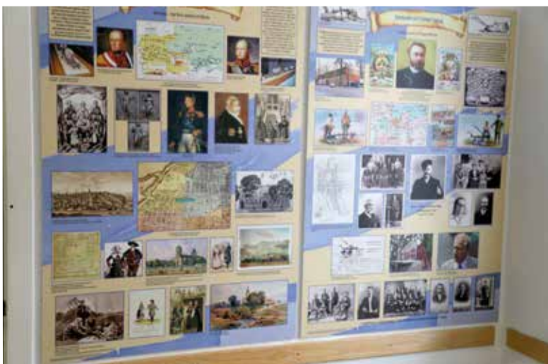
Выставка «Наследие черноморских немцев» разместились на первом этаже пасторского дома