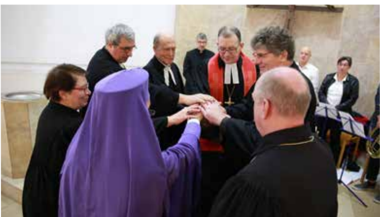
Поставление совершили епископы Церквей из разных стран и пасторы ЕЛЦГ