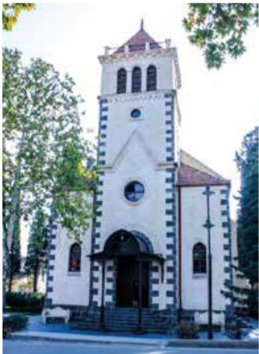
Кирха в Шамкире (Анненфельде). Построена в 1909 году