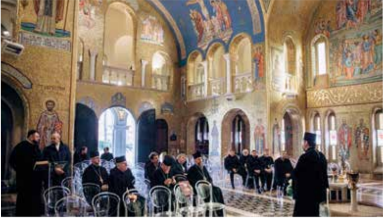
Делегация посетила прокафедральный собор св. Софии Украинской Греко-Католической Церкви в Риме

«Президент Синода НЕЛЦУ посетил Ватикан». Продолжение. Начало на с. 1