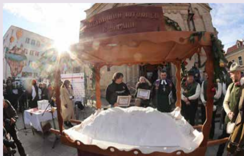
Самый большой в Украине штоллен, весом в 92 кг, изготовлен в кондитерской „Galateria“