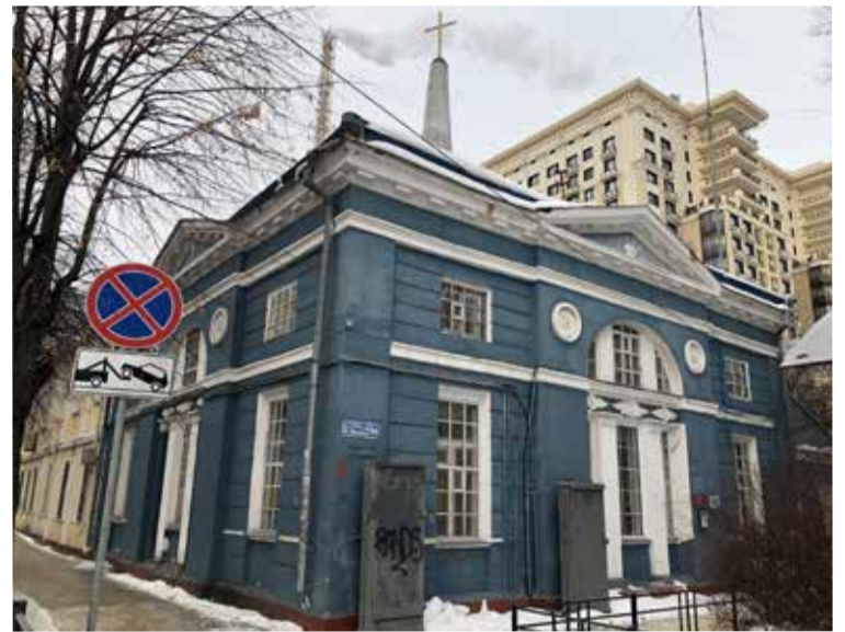
Церковь св. Марии в Воронеже