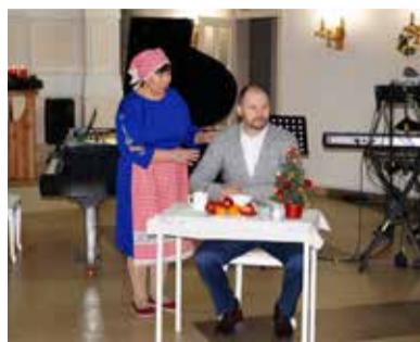
Маркс (Саратовская обл.)