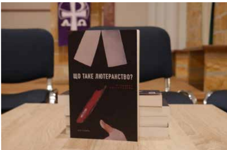
Книга на украинском языке вышла в этом году в издательстве «Дух і Літера»

ОДЕССА. 28 ноября в кирхе св. Павла прошла презентация книги «Что такое лютеранство. Немецкая перспектива» («Що таке лютеранство? Німецька перспектива»). Книга на украинском языке вышла в этом году в издательстве «Дух і Літера» по инициативе Немецкой Евангелическо-Лютеранской Церкви Украины (НЕЛЦУ) и при поддержке Немецкого национального комитета Союза Мартина Лютера и Объединенной Евангелическо-Лютеранской Церкви Германии.