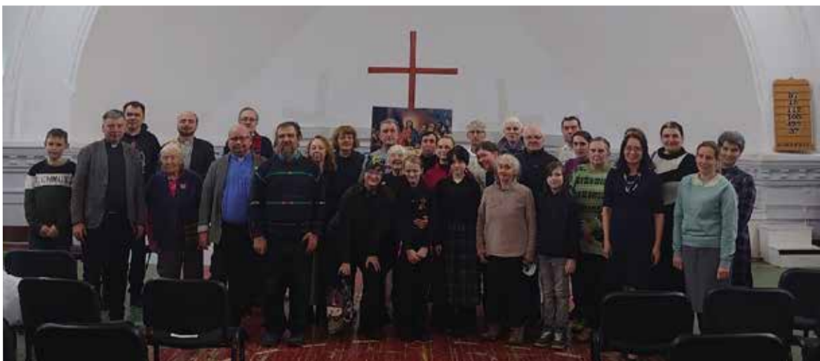
Община и гости на празднике

копфа. А также от англиканской, евангелическо-реформатской и других протестантских общин, шведского консульства и многих гостей. ■