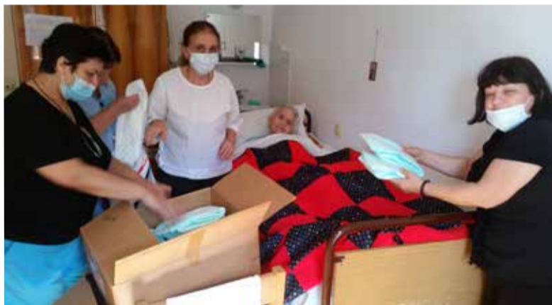
Раздача гуманитарной помощи в Доме Зальтета