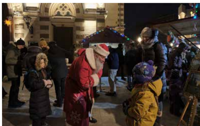
Благотворительная ярмарка на территории собора