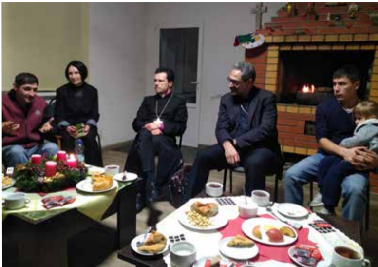
Архиепископ Дитрих Брауэр (3-й слева) на библейском часе саратовской общины

По завершении богослужения каждый мог пообщаться с архиепископом лично, задать ему насущные духовные и иные вопросы. ■