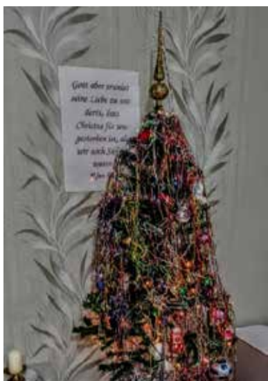
Анжеро-Судженск (Кемеровская обл.)