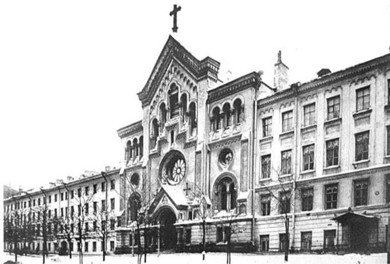
Шведская церковь св. Екатерины. Интерьер и фасад. Фото 1900-х годов

Изначально община, собранная из таких разных по своему статусу прихожан, даже недавних противников, собиралась в двух комнатах в деревянном доме на нынешней Миллионной, в здании главной аптеки, где шведские и финские богослужения проводились до 1734 года. Сам император Петр I утвердил первого проповедника