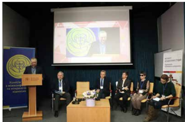
Епископ Павел Шварц выступает на конференции

По материалам Украинского католического университета