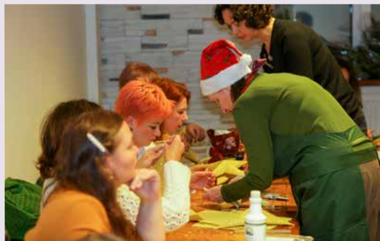
На ярмарке устраивались мастер-классы для детей и взрослых