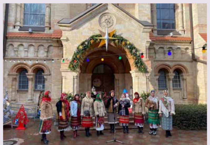
В «арт-дворике» проходили выступления народных ансамблей

На ярмарке были представлены как элементы рождественского стола (глинтвейн, штоллены, имбирные пряники), так и традиционные блюда немецкой кухни (колбаски на гриле, крафтовые сыры, брецели, разнообразная выпечка и т. п.), которые можно