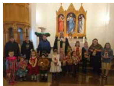
Зоркино (Саратовская обл.)