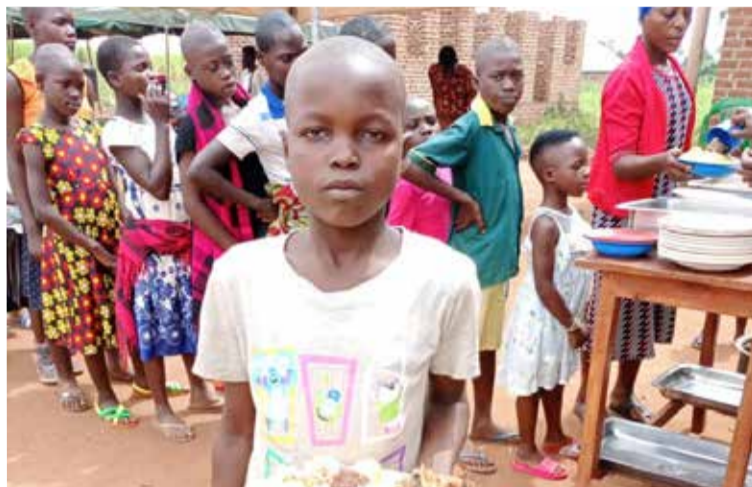
Адресатами благотворительной акции «Рождественская еда» стали более чем 120 детей-сирот из африканской деревни Исагаза

ПАВЛОДАР/КОСТАНАЙ. О многом можно вспомнить в уходящем 2021 году, но благотворительная акция «Рождественская еда» для более чем 120 детей-сирот далекой африканской деревни станет ярким и добрым воспоминанием для прихожан лютеранских общин Павлодара и Костаная.