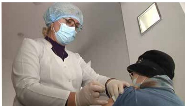
Желающих привиться обслуживает трое медицинских работников...