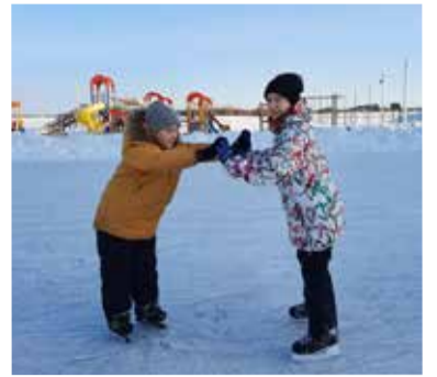
Дети в зимнем лагере в Красном Яру

Рождественское богослужение 25 декабря украсили пением