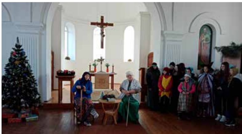
Змеевка (Херсонская обл., Украина)