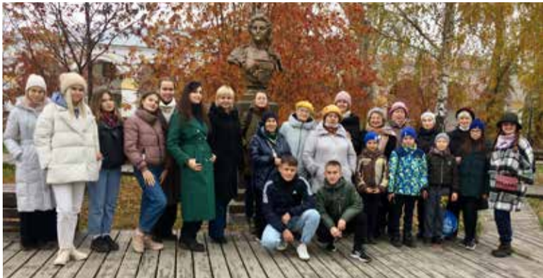
Община Набережных Челнов у памятника Екатерине II в Елабуге

тие было связано с разрешением на строительство, полученным от Екатерины II. Ее приезд в Казань состоялся в 1763 году. Через восемь лет была открыта и освящена первая кирха в сегодняшней столице Татарстана.