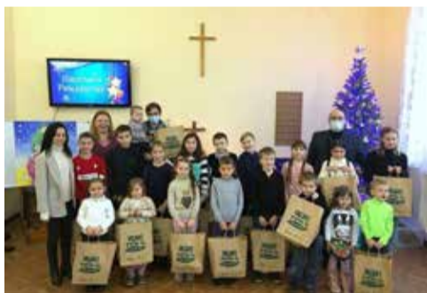
Бердянск (Запорожская обл., Украина)