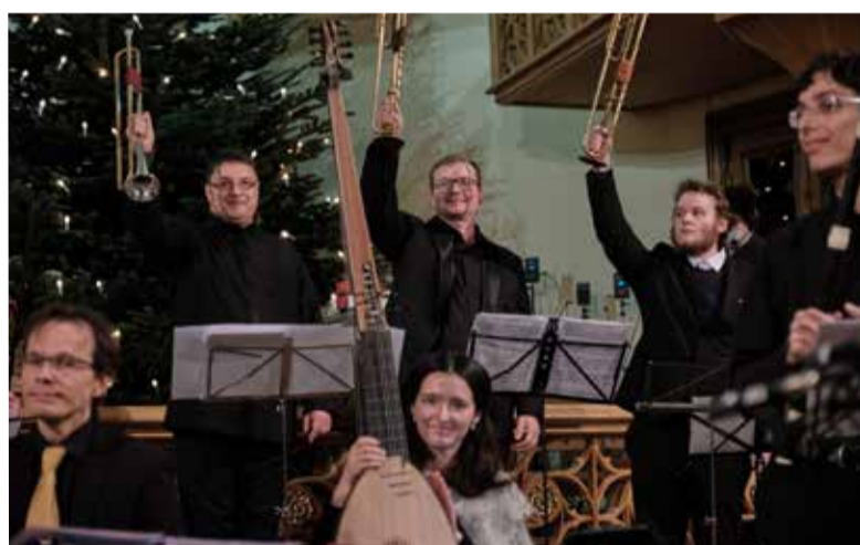
Проведение посольских концертов в соборе свв. Петра и Павла во время Адвента уже стало традицией

По материалам сайта www.lutherancathedral.ru