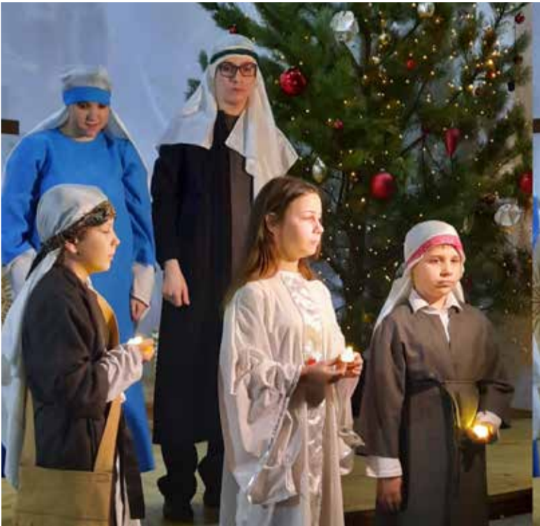
В Сочельник Рождества на праздничном богослужении экспериментальный театр «Встань и иди» представил общине свой спектакль «Рождение Чуда» ...