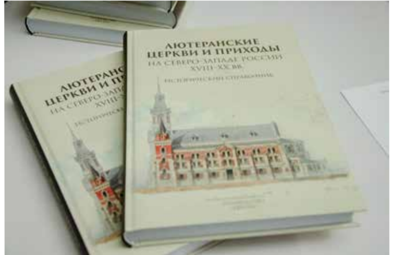
Книга трех ученых-историков вышла в ноябре этого года тиражом 1000 экземпляров в петербургском издательстве «Аврора»...

В книгу включены сведения о церковных постройках, обозначены границы приходов с перечислением входивших в них населенных пунктов, приведены фамилии служивших в приходах пасторов, указаны годы их служе-