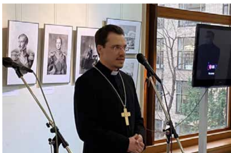
Архиепископ Дитрих Брауэр приветствует собравшихся на презентации выставки