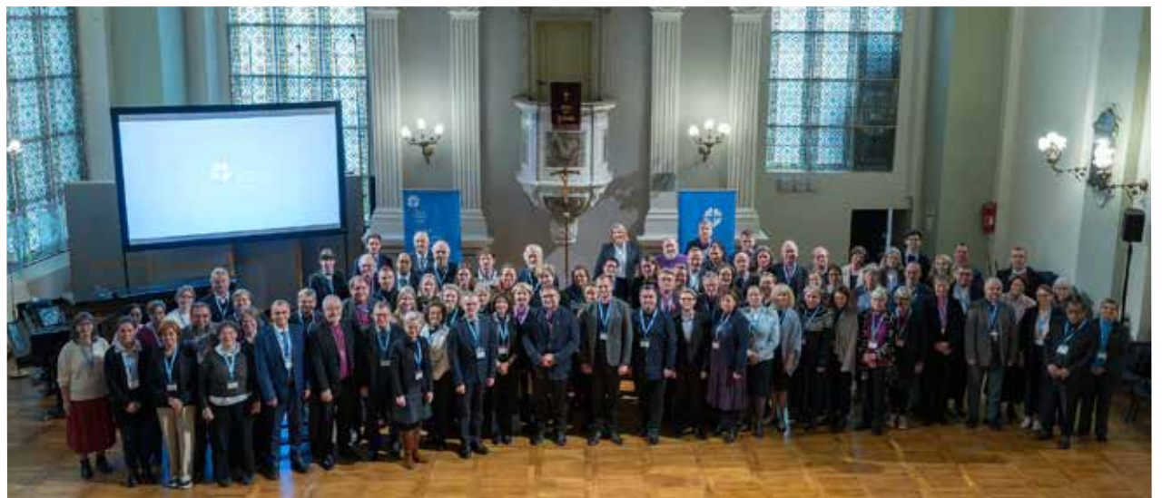
Всего во встрече приняли участие более 80 епископов и пасторов из разных европейских стран.

Всемирная Лютеранская Федерация (ВЛФ) была основана в 1947 году. В настоящее время в ее состав входят 149 церковных организаций в 99 странах, представляющих более 77 миллионов лютеран. ■