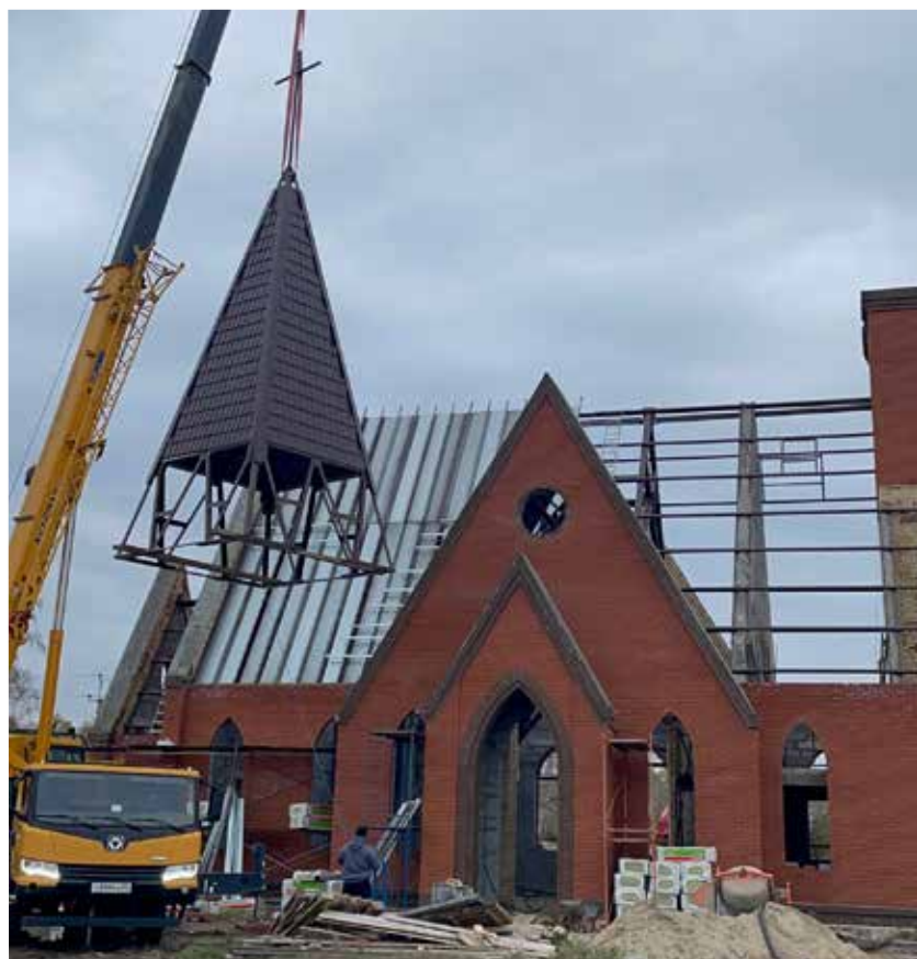
На строящейся церкви был торжественно установлен крест.

Азово. 8 октября в с. Азово (Омская обл.) совершилось знаковое событие для местной лютеранской общины – на строящейся церкви был торжественно установлен и освящен крест.