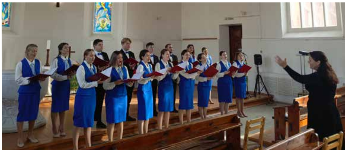
В течение семи часов в церкви св. Марии пели лучшие хоровые коллективы города.

Оказать помощь пациентам Ульяновского областного хосписа можно в любое время, перечислив посылную сумму на счет ульяновской общины св. Марии (назначение платежа: «Пожертвование для хосписа»). Для этого нужно зайти в банковское приложение на телефоне, из него сканировать QR-код с реквизитами счета общины и отправить средства на этот счет.