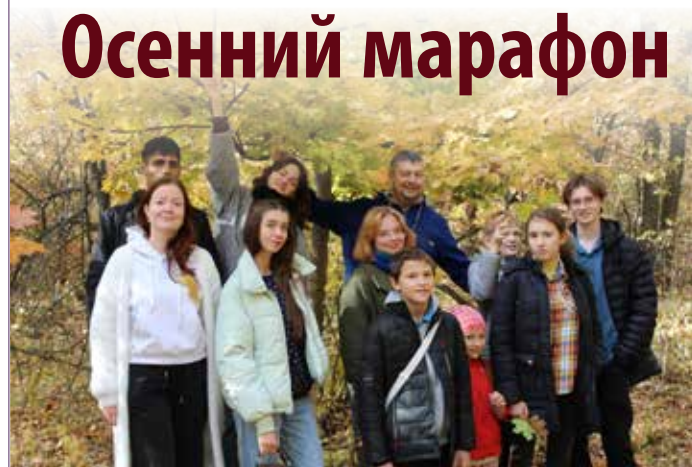
Накануне Дня урожая молодежь устроила встречу на выезде с прогулкой по лесу и фотосессией.