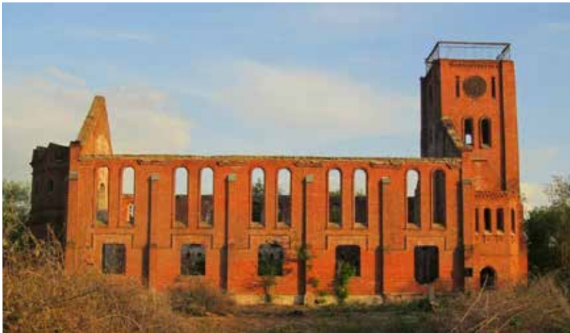
Руины церкви Иисуса в Зоркино до начала работ по ее восстановлению в 2013 году.

Несохранившийся лютеранский собор св. Марии в Саратове – точная копия церкви Иисуса в с. Зоркино.