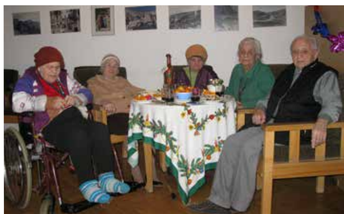
Жители дома престарелых в Доме Зальтета.

Я принимала участие в недавнем заседании Диаконического совета и слышала о текущих проблемах и планах на будущее. Но самое важное для меня – это выразить огромную благодарность всем вам, сотрудникам Дома Зальтета и Службы ухода на дому, за вашу верность, ваш образцовый труд по уходу за людьми, которые вас ждут, за работу, которую вы выполняете с большой самоотдачей и от всего сердца! ■