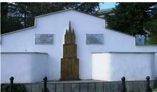
Мемориал немецким колонистам и их потомкам в Болниси.

Дай Бог, чтобы тяжелые события прошлого никогда не повторялись! ■