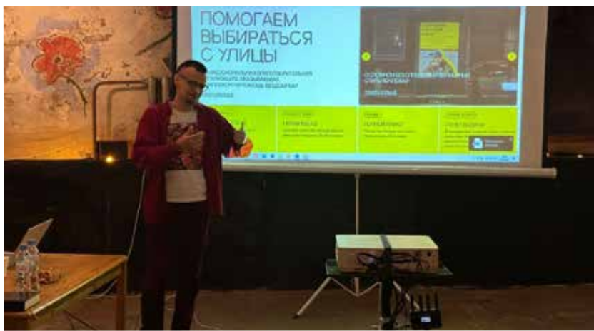
О проекте «Ночлежка» рассказывает его волонтер.