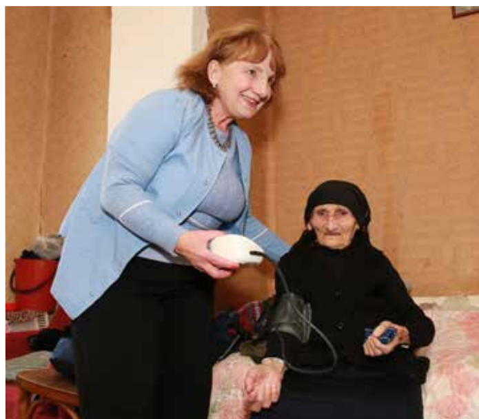
Сотрудница Службы ухода на дому и ее подопечная.