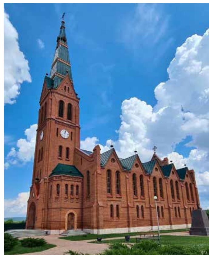
Современный вид церкви Иисуса в с. Зоркино.