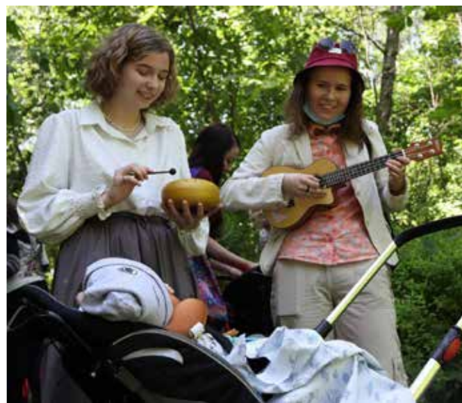
Волонтеры из общины на прогулке с детьми-пациентами хосписа.