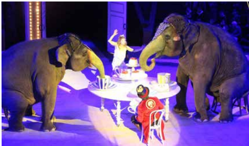
Кульминацией программы стало чаепитие слонов с огромными кружками.

Ребят ждали легендарные слоны династии Корниловых, которые участвовали в многочисленных съемках