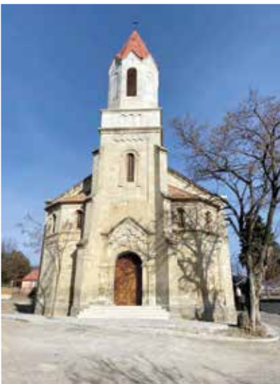
Старая лютеранская церковь в Асурети была отреставрирована в 2020 году.

Я рассказала детям историю этой церкви, а также деревни Асурети (бывшей немецкой колонии Елизабетталь), где до сих пор сохранились дома переселенцев с особой архитектурой тех далеких времен. ■