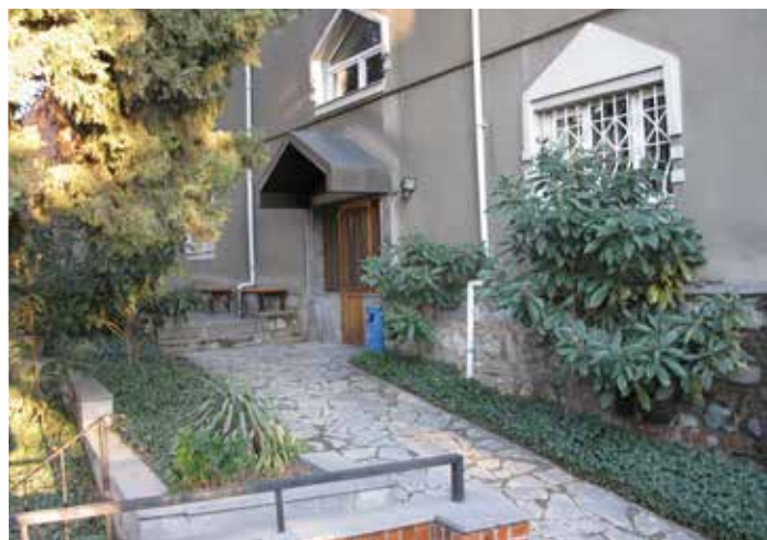
Здание Дома Зальтета и церковный сад.