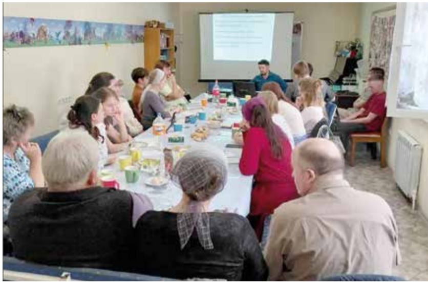
Библейская работа в группе молодежных лидеров.