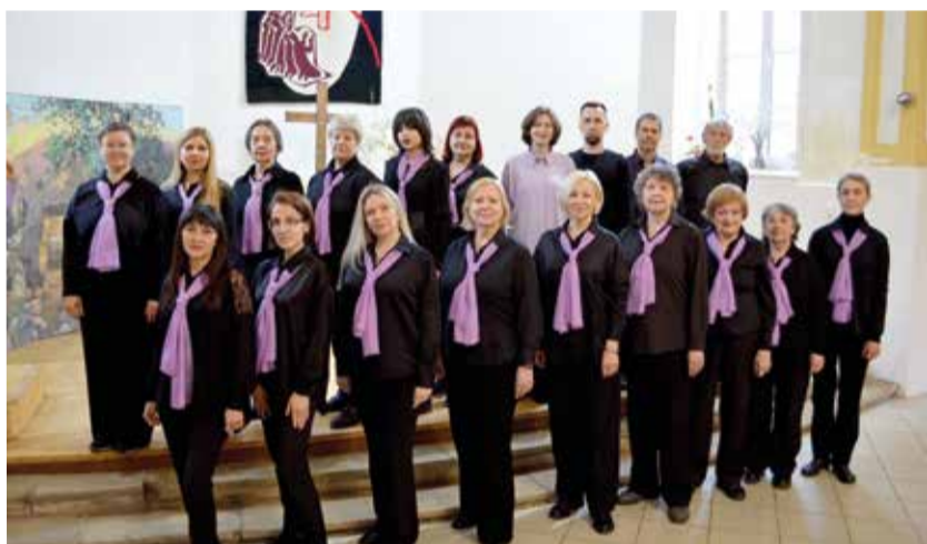
Хор церкви св. Георга (Самара) – лауреат I степени.