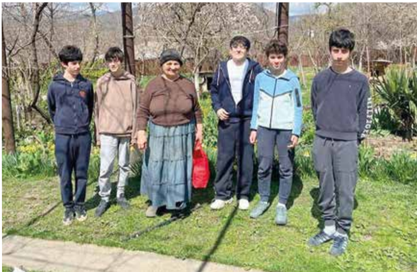
Дети были поделены на группы, которые в сопровождении сотрудников «Службы ухода на дому» посещали пожилых людей в Душетском р-не.