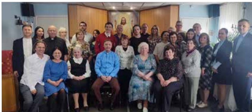
Община св. Николая и гости праздника.