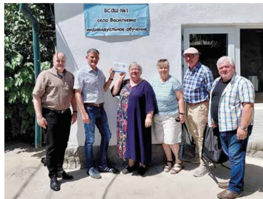
Делегация ФГА посетила центр для детей с ОВЗ в Васильевке.

О проектах и мероприятиях киргизских лютеран, которые гости посетили в ходе поездки, они рассказали на страницах блога ФГА ( www.glaube-verbindet.gustav-adolf-werk.de ).