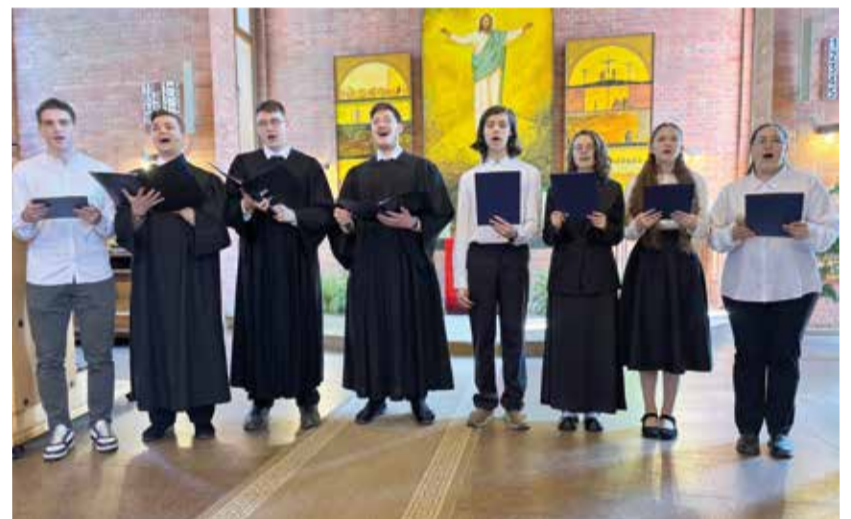
В качестве поздравления молодежь общины Омска исполнила торжественный гимн.

и Омской области. На богослужение приехали гости из разных общин Омской области.