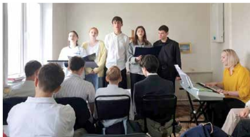
Участники молодежного форума провели богослужение в с. Липовка.

кульминацией стало Крещение одного из участников форума. Ведь целью проекта было «не развлечь, а вовлечь», то есть не просто заполнить время, а наполнить его духовным смыслом.