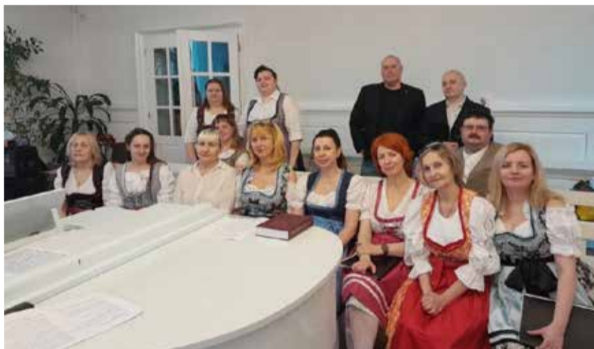
Вокальный ансамбль «Соловей» (община Сарепты, Волгоград) – лауреат II степени.

Сообщение Пресс-службы Саратовского пропства