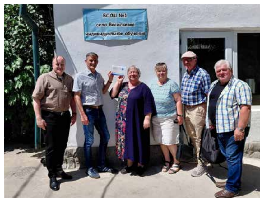
Делегация ФГА посетила центр для детей с ОВЗ в Васильевке.

О проектах и мероприятиях киргизских лютеран, которые гости посетили в ходе поездки, они рассказали на страницах блога ФГА ( www.glaube-verbindet.gustav-adolf-werk.de ).