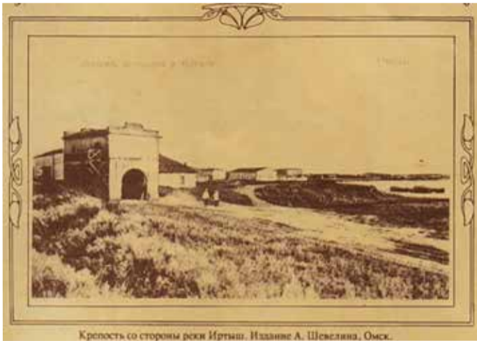
Омская крепость на дореволюционной открытке.

Омск. 24 мая в общине Омска прошло торжественное богослужение, посвященное празднику Пятидесятницы.