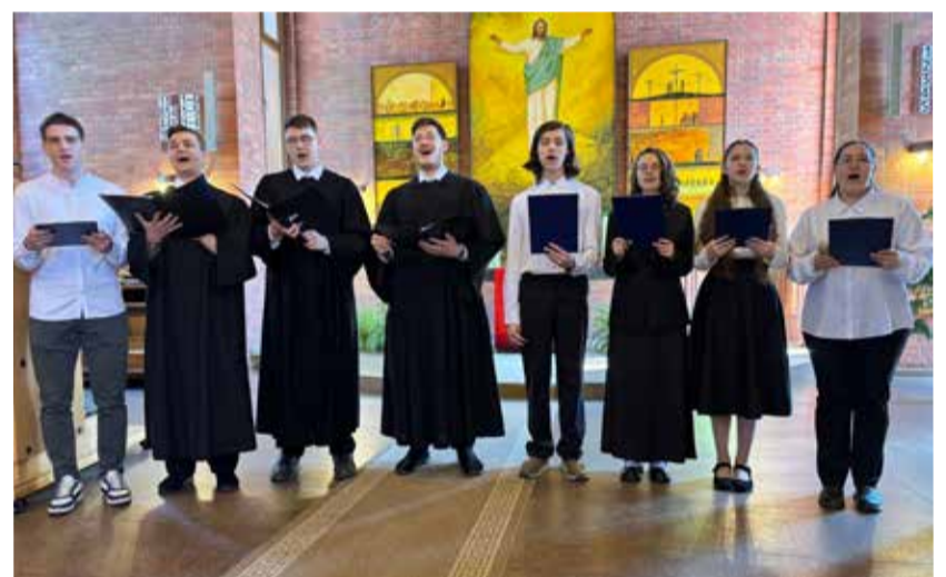
В качестве поздравления молодежь общины Омска исполнила торжественный гимн.

и Омской области. На богослужение приехали гости из разных общин Омской области.