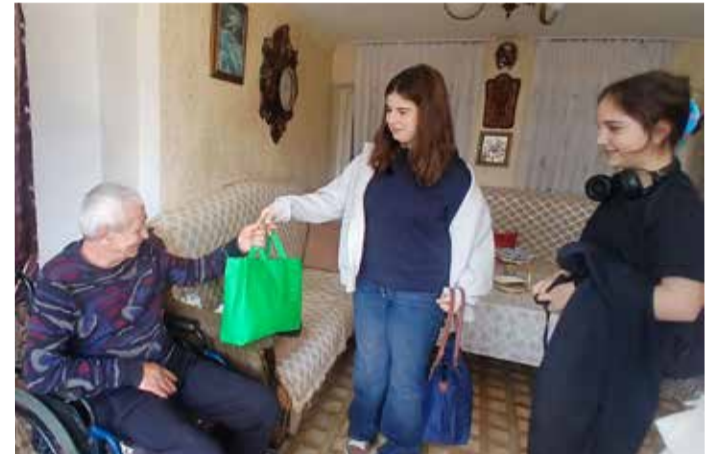
Дети встречались и знакомились с людьми в селах Душетского р-на, которые в силу разных обстоятельств остались одни, и вручали им подарки.