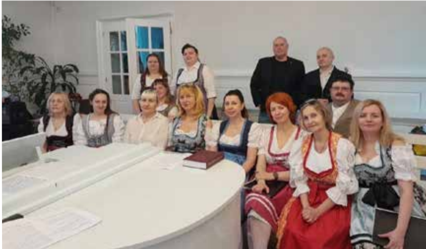
Вокальный ансамбль «Соловей» (община Сарепты, Волгоград) – лауреат II степени.