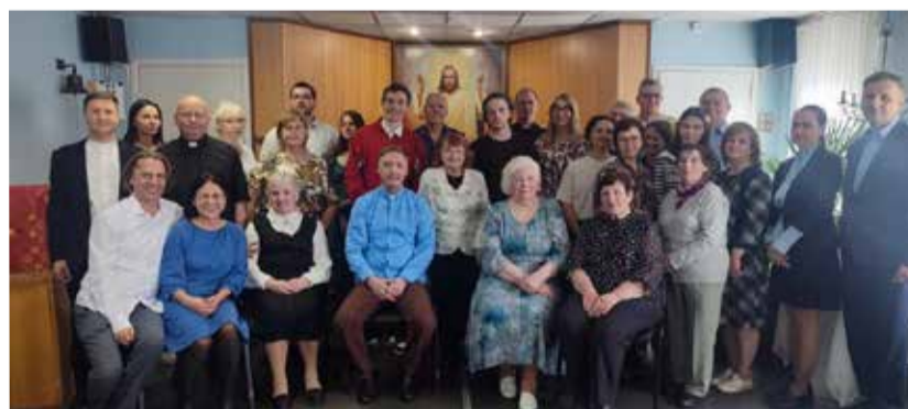
Община св. Николая и гости праздника.