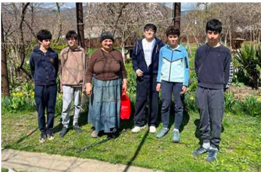
Дети были поделены на группы, которые в сопровождении сотрудников «Службы ухода на дому» посещали пожилых людей в Душетском р-не.