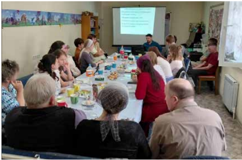
Библейская работа в группе молодежных лидеров.