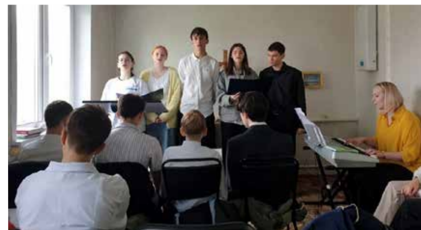
Участники молодежного форума провели богослужение в с. Липовка.

кульминацией стало Крещение одного из участников форума. Ведь целью проекта было «не развлечь, а вовлечь», то есть не просто заполнить время, а наполнить его духовным смыслом.