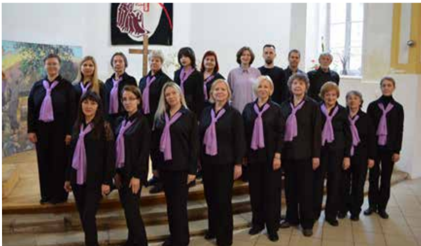
Хор церкви св. Георга (Самара) – лауреат I степени.