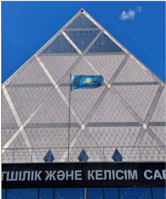
Вершина пирамиды – здания дворца мира и согласия.

С 11 по 14 мая генеральный секретарь Фонда Густава Адольфа (ФГА) Энно Хаакс и председатель региональной группы ФГА в Восточной Фризии, пастор Свен Грундманн посетили Евангелическо-Лютеранскую Церковь в Республике Казахстан (ЕЛЦ РК). Своими впечатлениями от визита они поделились в блоге ФГА ( www.glaube-verbundet.gustav-adolf-werk.de ).