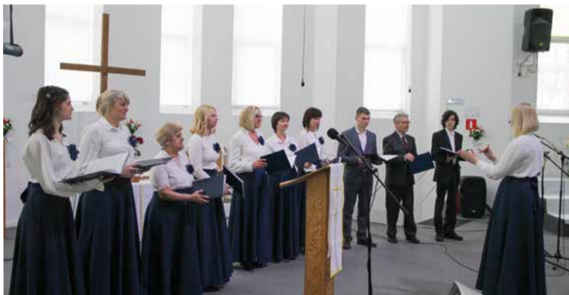
Хор церкви св. Марии (Саратов) – лауреат I степени.

САРАТОВ. В начале этого года община Саратова пригласила музыкальные коллективы из лютеранских общин принять участие в I Всероссийском