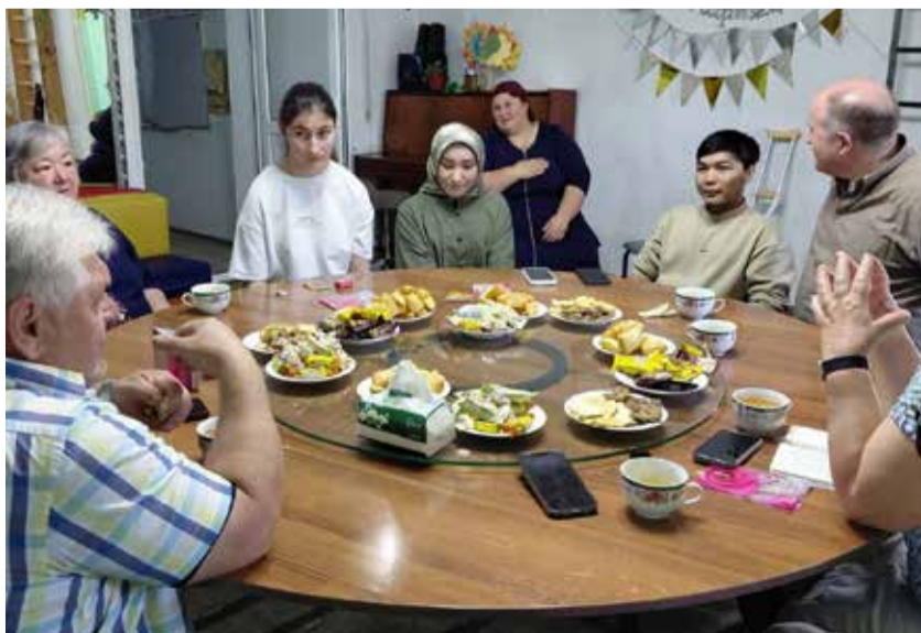
Визит делегации ФГА в центр в Васильевке. Встреча с бывшими учениками и сотрудниками.

По материалам сайта www.glaube-verbindet.gustav-adolf-werk.de