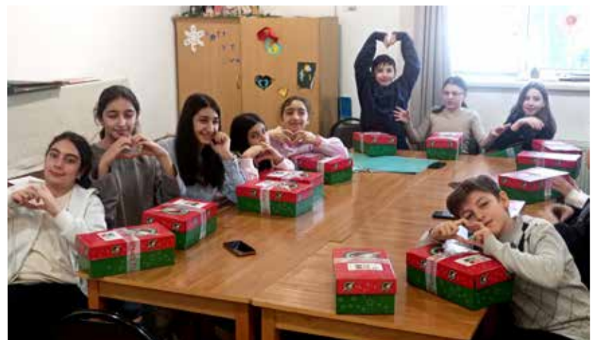
Подарки для детей в церкви Примирения.