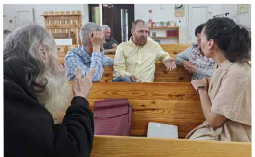
Семинар объединил служителей и прихожан из общин Екатеринбург, Полевского, Тюмени и Берёзовского.