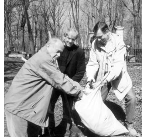
АРХИЕПИСКОП РАТЦ, ПАСТОР ЦИРОЛЬД И ГЕНЕРАЛЬНЫЙ КОНСУЛ БРАУН НА СУББОТНИКЕ

включающая водоотведение, инженерную инфраструктуру и ограждения, будет реализована в 2009–2010 годах. 41 объект на территории кладбища находится под охраной государства. После молитвы, которую провели пробст Ханс-Херманн Ахенбах и пастер Рихард Штарк, более 30 человек в течение трех часов собирали в мешки и относили затем в специальный контейнер прошлогоднюю листву и мусор.