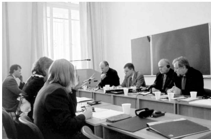
СООБЩЕНИЯ ИЗ ЦЕРКВЕЙ ПРИБАЛТИКИ

Мы желаем новому изданию широкого распространения на грузинском книжном рынке иобретения большого числа заинтересованных читателей.