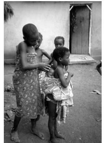
КОТ-ДИВУАР. ДЕВОЧКИ С РЕБЕНКОМ