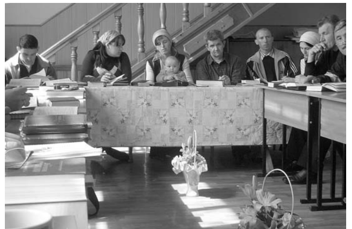
СЕМЬИ ПРОПОВЕДНИКОВ НА СЕМИНАРЕ

Полное понимание этих тем обоими супругами, один из которых является сотрудником Церкви, дает возможность полноценного служения Господу,