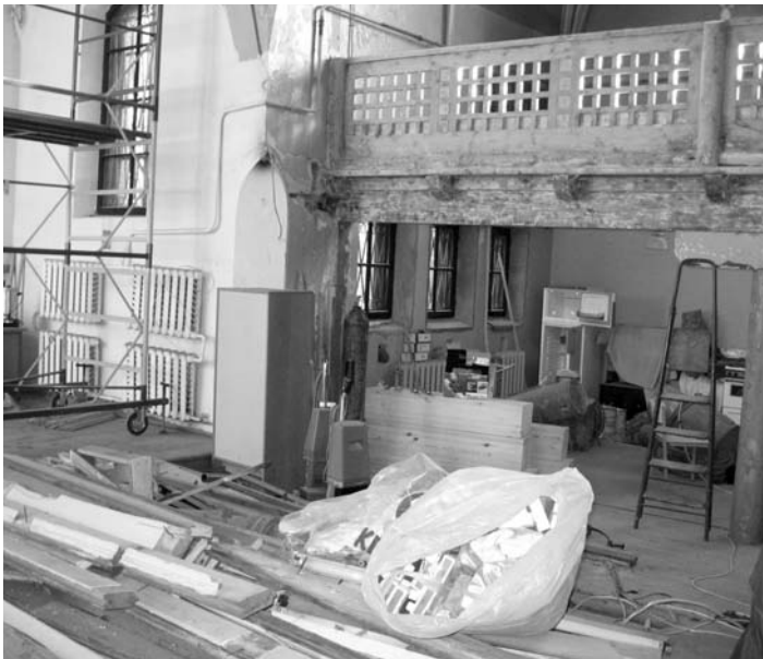
ВНУТРЕННЕЕ ПОМЕЩЕНИЕ ХРАМА

ЗЕЛЕНОГОРСК. Продолжаются и близятся уже к завершению ремонтно-реставрационные работы в храме лютеранской общины в городе Зеленогорск. Хотя наружные работы были закончены в 2003 году, к внутренней реставрации удалось приступить не сразу. Несмотря на различные трудности, начались внутренние работы, и скоро храм предстанет в своем первозданном виде, включая все перепланировки, которые необходимы для жизни общины в современных условиях. Приглашаю всех друзей нашего прихода 14 сентября на праздник пересвящения церкви, а во второе воскресенье Адвента – на столетний юбилей храма. Молитесь о скором и успешном завершении ремонта.