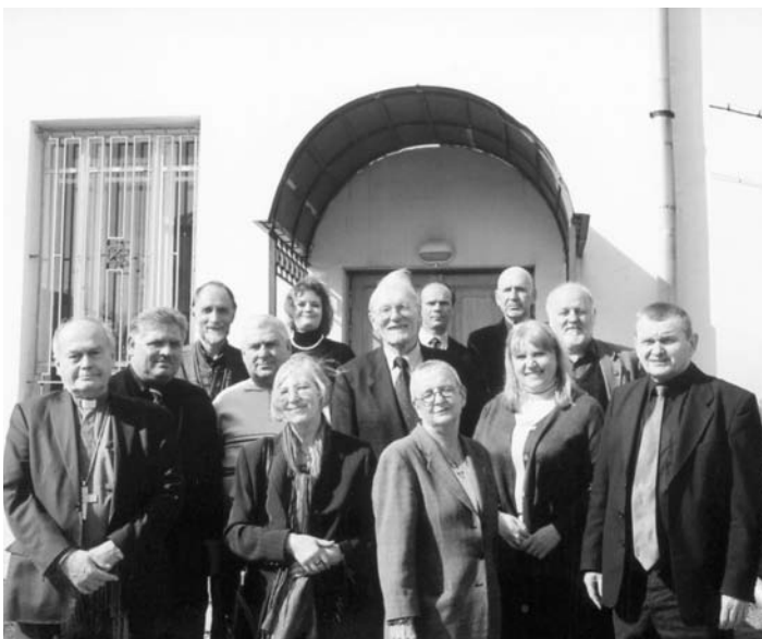
УЧАСТНИКИ ЕПИСКОПСКОГО СОВЕТА