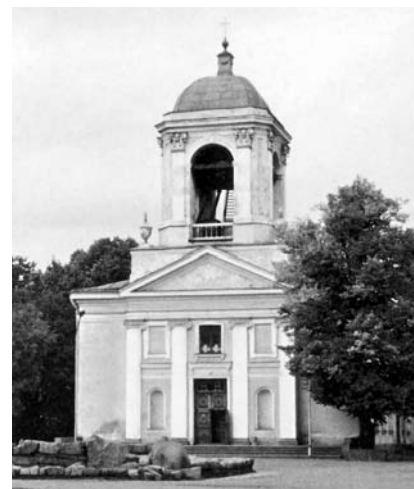
ЗДАНИЕ ЦЕРКВИ В ВЫБОРГЕ