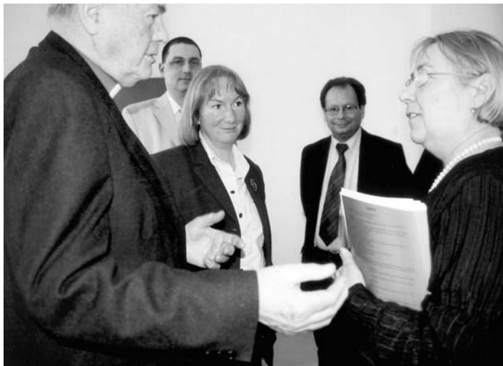
СЛОВА БЛАГОДАРНОСТИ В АДРЕС АДМИНИСТРАЦИИ САНКТ-ПЕТЕРБУРГА