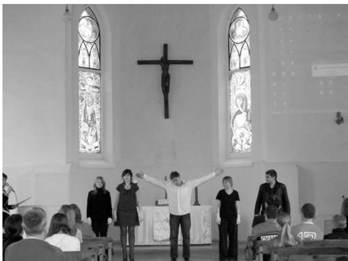
МОЛОДЕЖНАЯ ГРУППА ПОДГОТОВИЛА ДЛЯ ДЕТЕЙ СЦЕНКУ

Мы благодарим Бога за возможность открытой проповеди в общеобразовательной школе – Он совершил, казалось бы, невозможное. Мы убеждаемся, что для Него нет никаких преград и ограничений: чтобы доставить детей из одного района города, где они живут, в другой, где стоит наша церковь, мы арендовали трамвай!