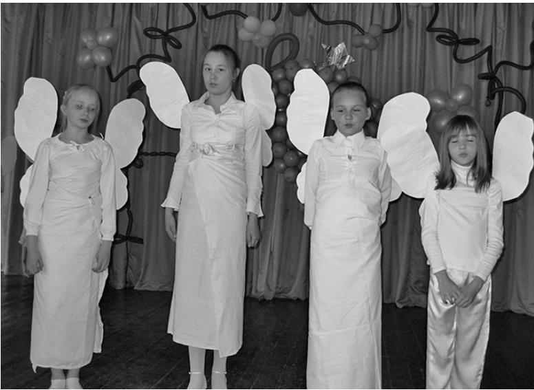
ПЕСНЯ АНГЕЛОВ СЛЫШНА

ПЕТРОЗАВОДСК/КОНДОПОГА. В Петрозаводске и Кондопоге успешно завершились очередные смены «Языкового лагеря дружбы», проводимые волонтерами и работниками Центра миссии в Восточной Европе (США). Кондопожский лагерь – в четвертый раз при участии лютеранского прихода – проходил в две смены: с 31 мая по 4 июня и с 7 по 11 июня. А в Петрозаводске есть даже особая смена для школьников и студентов Карелии, ко-