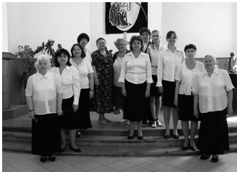
ХОР «СВЕТ СВЕЧИ» В ЦЕРКВИ СВ. ГЕОРГА

20 июня в Евангелическо-лютеранской церкви св. Георга состоялся концерт хора православного храма великомученицы Елисаветы. Это не первое выступление этого хора в стенах лютеранского храма: 11 апреля там состоялся концерт хора Евангелическо-лютеранской общины св. Георга совместно с хором православного храма великомученицы Елисаветы, посвященный празднованию Пасхи. ■