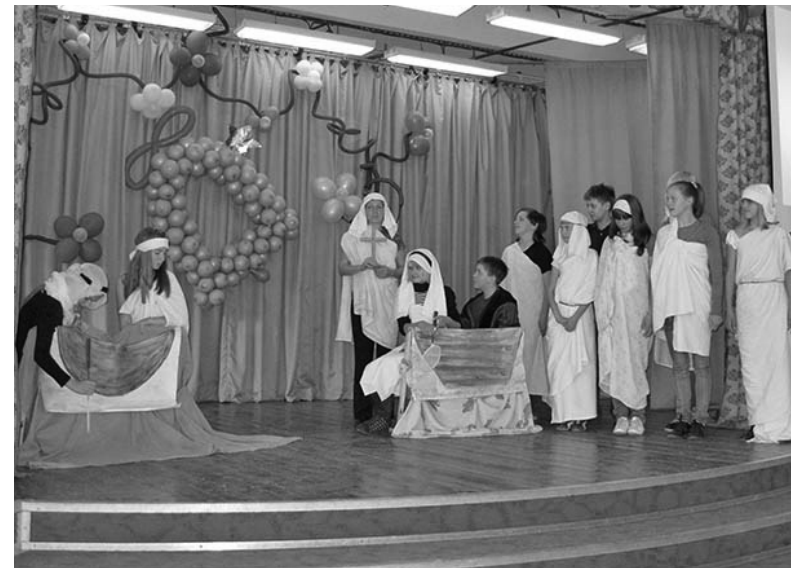
СЦЕНКА НА БИБЛЕЙСКИЙ СЮЖЕТ (ИИСУС ПРИЗЫВАЕТ СЛЕДОВАТЬ ЗА НИМ)

В мире много сиюминутных дел, неуловимых мгновений. В этом водовороте важно знать, что есть нечто устойчивое. Это Языковой лагерь дружбы и те общечеловеческие ценности, которые в лагере за 15 лет подробно изучили несколько тысяч студентов и школьников. После Карелии часть американских волонтеров отправилась в Колтуши, где в этом году впервые дан старт Языковому лагерю дружбы. ■