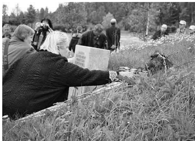
ВОЗЛОЖЕНИЕ ЦВЕТОВ НА НЕМЕЦКОМ ВОЕННОМ КЛАДБИЩЕ В ДЕРЕВНЕ СОЛОГУБОВКА

евангелическо-лютеранской Церкви Марии Йепсен, генерального консула Германии Петера Шаллера и предста-