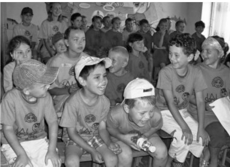
УЧАСТНИКИ ЛАГЕРЯ В НОВОГРАДКЕ

Бог был с нами все пять дней лагеря. Это можно было почувствовать во всем, что происходило в течение дня. Он хранил и оберегал, Он даровал нам детей, открытий для слушания и общения. Мы все стали одной дружной семьей перед Богом. ■