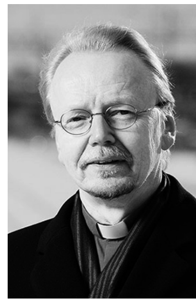
АРХИЕПИСКОП ТУРКУ И ФИНЛЯНДИИ КАРИ МЯКИНЕН

Мякинен был избран Архиепископом 11 марта после того, как получил во втором туре выборов 593 голоса. Пастор Мика Руоканен, выставивший на выборах свою кандидатуру, набрал меньшее количество голосов, а именно 582 голоса. ЕЛЦФ, включающая примерно 4,5 млн прихожан, является членом-учредителем ВЛФ. Таким образом, ВЛФ представляет более 80% населения Финляндии. ■