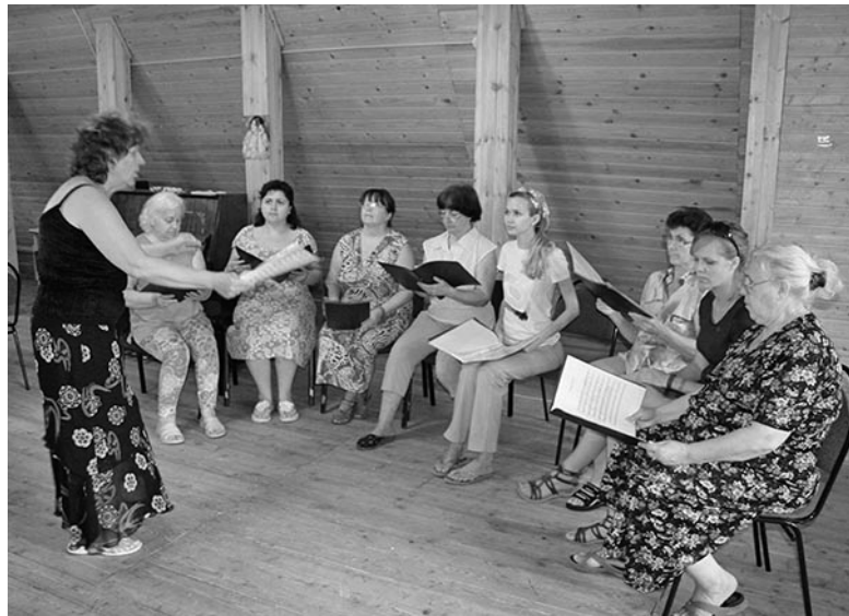
РЕПЕТИЦИЯ ОРЕНБУРГСКОГО ХОРА В ДОМЕ ОБЩИНЫ В КРАСНОМ ЯРУ

САМАРА/ОРЕНБУРГ. Выступление хора общины г. Оренбурга «Свет Свечи» состоялось 20 июня в Евангелическо-лютеранской церкви св. Георга г. Самары.