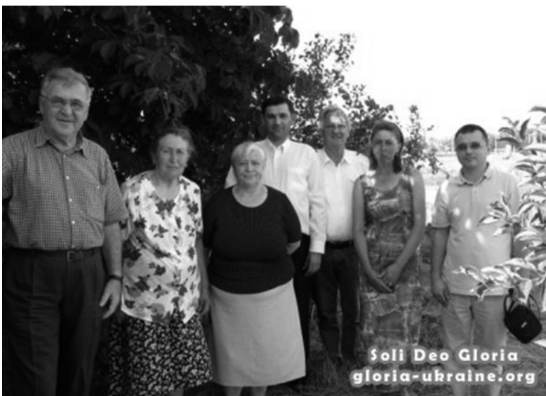
МИССИОНЕРЫ И ПРИХОЖАНЕ ОБЩИНЫ ЧЕШСКИХ БРАТЬЕВ В С. ВЕСЕЛИНОВКА

ОДЕССКАЯ ОБЛАСТЬ. Наверное, это удивительно, но в Украине есть чешские деревни. Одну такую деревню, Веселиновку, мы – сотрудники Молодежного центра в Петро долине и посетили во время миссионерской поездки с 19 по 21 июня. В деревне действует общи-