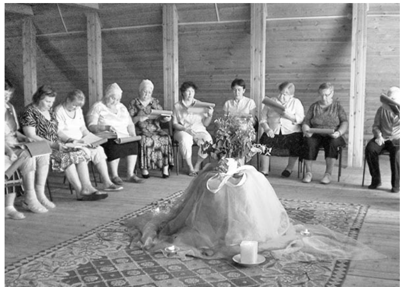
ЗАНЯТИЕ ДЛЯ УЧАСТНИКОВ ПРОГРАММЫ ОТДЫХА ДЛЯ ПОЖИЛЫХ