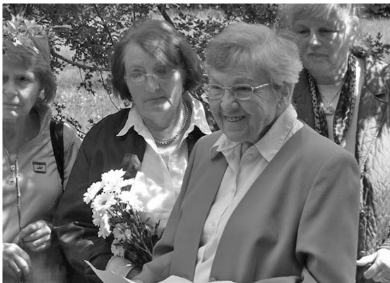
ГОСТИ ИЗ ГЕРМАНИИ – УЧАСТНИКИ АКЦИИ ПОМИНОВАНИЯ

Хор общины исполнил произведение «Kein schönes Land». Мероприятие завершилось общением гостей с прихожанами общины за чаепитием в церковном кафе. ■