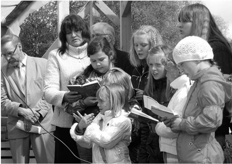
ВЫСТУПЛЕНИЕ ДЕТЕЙ ВОСКРЕСНОЙ ШКОЛЫ НА ПРАЗДНИКЕ