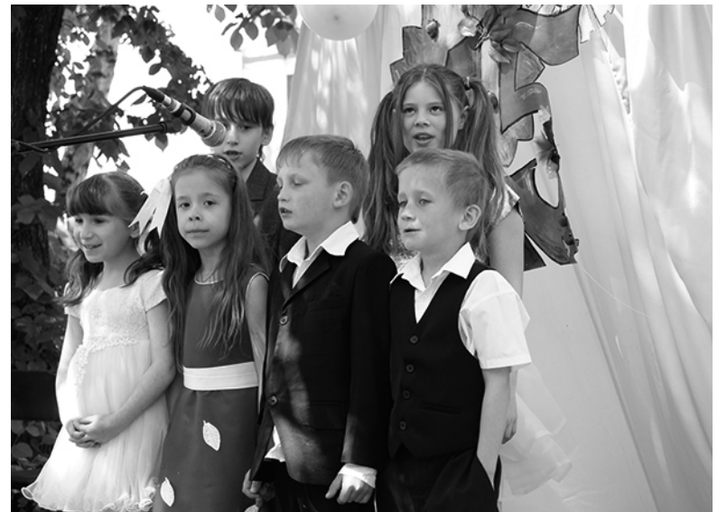
ВЫСТУПЛЕНИЕ ВОСПИТАННИКОВ ДЕТСКОГО ЦЕНТРА «ЯБЛОНЬКА»

пожелал сотрудникам и детям успеха и произнес молитву за детей и взрослых Центра. ■