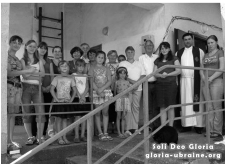
ДЕТИ И МОЛОДЕЖЬ ОБЩИНЫ С. КУДРЯВКА И СОТРУДНИКИ МОЛОДЕЖНОГО ЦЕНТРА В ПЕТРОДОЛИНЕ