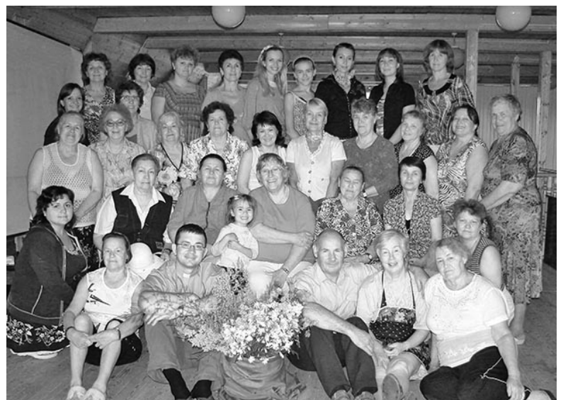
УЧАСТНИЦЫ ПРОГРАММЫ ОТДЫХА ДЛЯ ЖЕНЩИН

шелковых платков, а также изготовление подсвечников из стаканов. Погода способствовала купанию в реке Сок, что также порадовало участниц мероприятия. Накануне отъезда, как уже стало традицией, женщины подготовили весе-