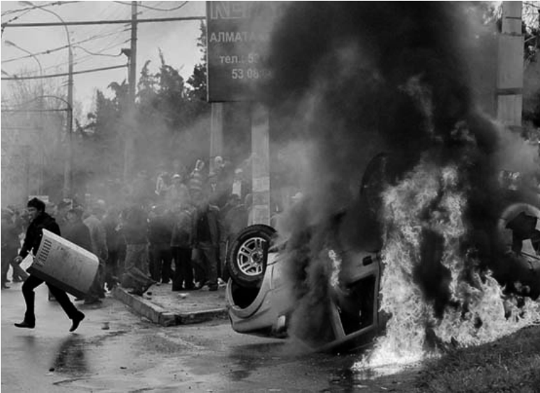
МАССОВЫЕ БЕСПОРЯДКИ В КИРГИЗИИ

ПО ИНФОРМАЦИИ ЦЕНТРАЛЬНОГО ЦЕРКОВНОГО УПРАВЛЕНИЯ ЕЛЦ