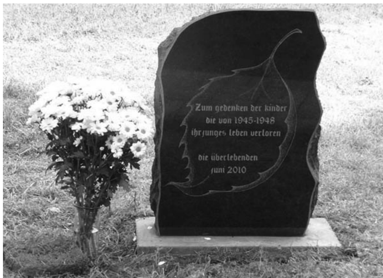
ПАМЯТНЫЙ ЗНАК, УСТАНОВЛЕННЫЙ В САДУ ЦЕРКВИ ВОСКРЕСЕНИЯ

КАЛИНИНГРАД. Девять гостей из Германии прибыли 20 июня в Калининград, чтобы стать участниками акции поминовения, организованной ев.-лют. общиной города. Все приехавшие на акцию немцы в послевоенное время до 1948 года были жителями Кёнигсберга (Калининграда), где им пришлось пережить потерю родных и близких. Теперь они смогли посетить место, где проходили их детские годы, чтобы в молитве отдать дань памяти своим усопшим братьям и сестрам.