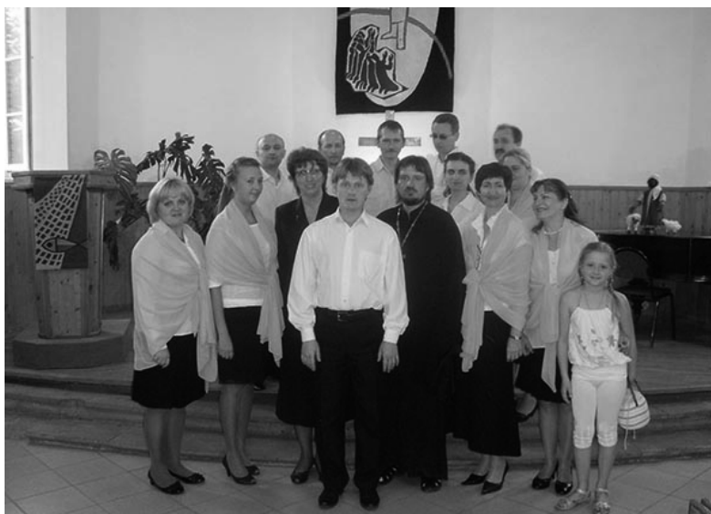
ХОР ПРАВОСЛАВНОГО ХРАМА ВЕЛИКОМУЧЕНИЦЫ ЕЛИСАВЕТЫ В ЦЕРКВИ СВ. ГЕОРГА

Канцелярия Епископа Церкви Ингрии (на конкурс эмблемы Юбилейного года). ■