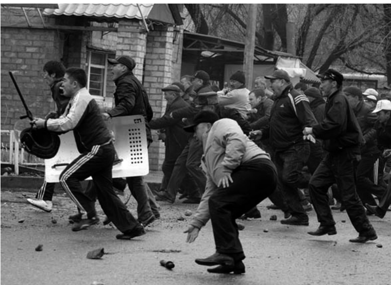
МАССОВЫЕ БЕСПОРЯДКИ В КИРГИЗИИ