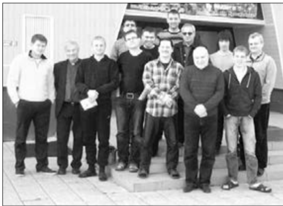
В ЧИСТО МУЖСКОМ «УИК-ЭНДЕ» ПРИНЯЛИ УЧАСТИЕ 13 БРАТЬЕВ ИЗ ОМСКОЙ И АЗОВСКОЙ ОБЩИН

Епископ Отто Шауде на примере апостола Петра в предпасхальной истории