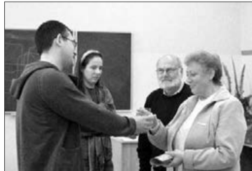
В ХОДЕ ПРАКТИЧЕСКИХ ЗАНЯТИЙ УЧАСТНИКИ ПОЗНАВАЛИ СЕБЯ И АНАЛИЗИРОВАЛИ ПРОЙДЕННЫЙ ЖИЗНЕННЫЙ ПУТЬ

САНКТ-ПЕТЕРБУРГ. «Душепопечительство – это шанс для лютеранской Церкви, – Так считает пастор и преподаватель Немецкого общества психологии для пасторов Курт Шмидт. – Только в ней этому уделяется особое внимание, что может