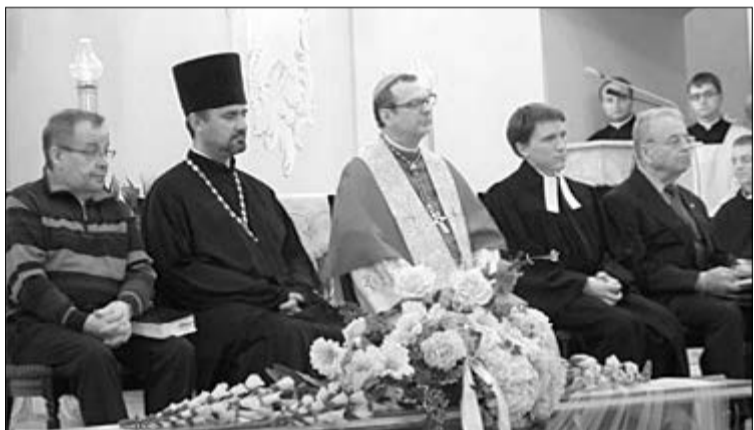
УЧАСТНИКИ ЭКУМЕНИЧЕСКОЙ МОЛИТВЫ О МИРЕ В СИРИИ