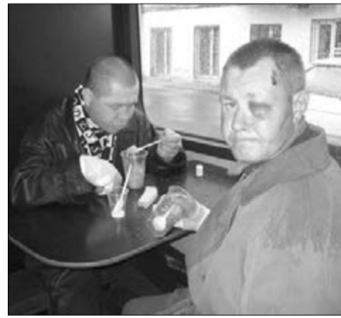
ПОДОПЕЧНЫЕ ПРОЕКТА КОРМЛЕНИЯ БЕЗДОМНЫХ РИМСКО-КАТОЛИЧЕСКОЙ ЦЕРКВИ И ЛЮТЕРАНСКОЙ ОБЩИНЫ СВ. ПАВЛА

Как часто люди отделяют себя от других, думая, что они лучше и чище. Но на самом