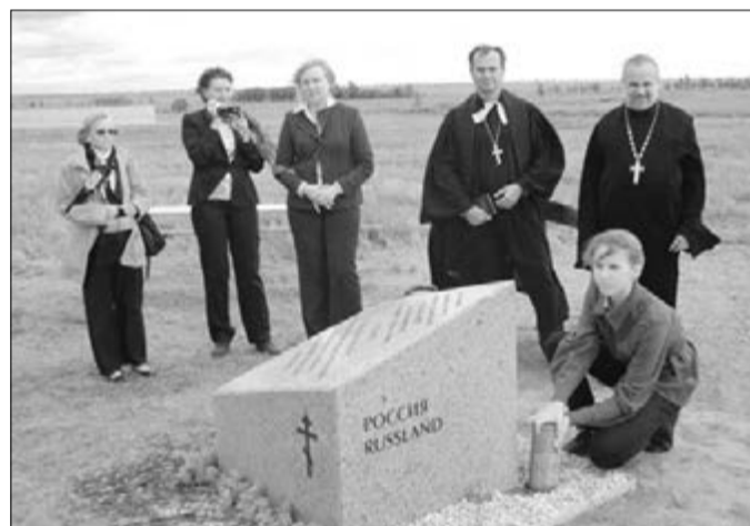
В ОСНОВАНИЕ ЧАСОВНИ БЫЛА ВЛОЖЕНА ПАМЯТНАЯ КАПСУЛА