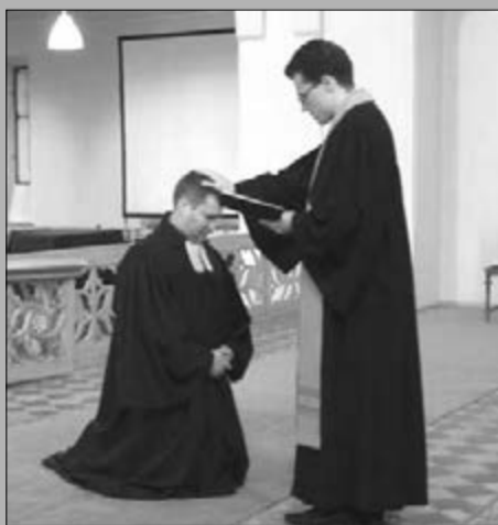
ОРДИНАЦИЮ ВИКТОРА ВЕБЕРА СОВЕРШИЛ ЕПИСКОП ДИТРИХ БРАУЭР