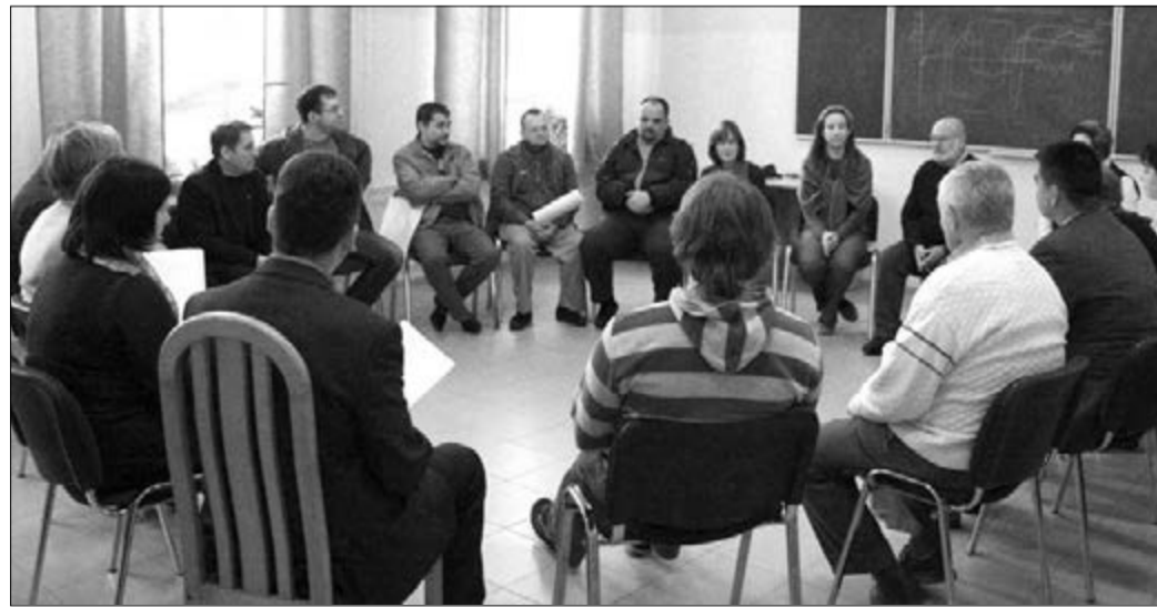
НА НЕСКОЛЬКО ДНЕЙ ОКОЛО 20-ТИ СЛУЖИТЕЛЕЙ ЦЕРКВИ ИЗ РАЗНЫХ РЕГИОНОВ СТАЛИ ОДНОЙ ГРУППОЙ

Несмотря на то, что помощь людям в трудных ситуациях является неотъемлемой частью деятельности пастора, обучению душепопечительским приемам зачастую уделяется мало внимания в теологических образовательных учреждениях. Поэтому служители Церкви нуждаются в специальном дополнительном образовании. По мнению пастора Шмидта, очень важно, что церковное руководство ЕЛЦ ЕР осознает необходимость такого образования для своих сотрудников. На сегодняшний день такой подход можно встретить не во всякой Церкви, отмечает он. В России подобные семинары оба преподавателя уже проводили в Омске для сотрудников ЕЛЦ Урала, Сибири и Дальнего Востока. «Наша цель, чтобы и в лютеранской Церкви в России существовало квалифицированное душепопечительство», – пояснил Курт Шмидт. ■