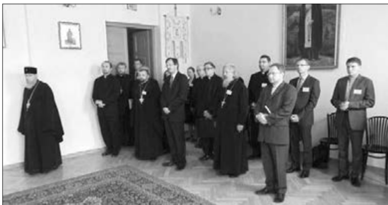
ПРЕДСТАВИТЕЛИ РАЗЛИЧНЫХ КОНФЕССИЙ НА УТРЕННЕЙ СОВМЕСТНОЙ МОЛИТВЕ В РАМКАХ КОНФЕРЕНЦИИ

Рабочая группа «Примирение» действует с 1996 года. В ее состав входят представители церквей Германии, Польши, Беларуси и Украины. Целью группы явля-