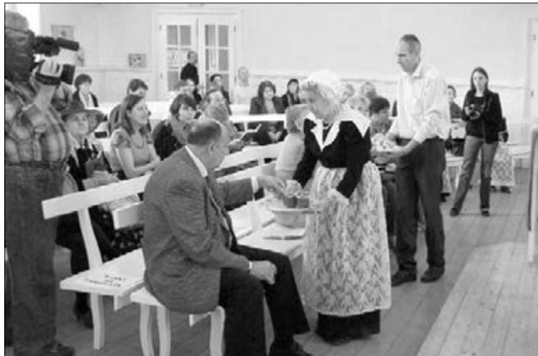
В ЦЕРКОВНЫЙ ЗАЛ ВЫШЛИ ЧЛЕНЫ ОБЩИНЫ В СТАРИННЫХ КОСТЮМАХ САРЕПТЯН С ПОДНОСАМИ

С 3 по 16 сентября евангелическо-лютеранской общине города Волгограда и музею заповеднике «Старая