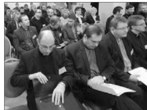
НА ЗАСЕДАНИЯХ КОНФЕРЕНЦИИ

С первым докладом на конференции выступил профессор о. Зигфрид Глезер (Римско-Католическая Церковь в Польше). Он рассказал о процессе подготовки и о содержании Совместного послания народам России и Польши Предстоятеля Русской Православной Церкви Патриарха Московского и всея Руси Кирилла и председателя Епископской Конференции Польши Архиепископа Юзефа Михалика, митрополита Перемышльского (подписано 17 августа 2012 года). Затем выступили епископ Войцех Полак (Римско-Католическая Церковь в Польше) и священник Стефан Батрух