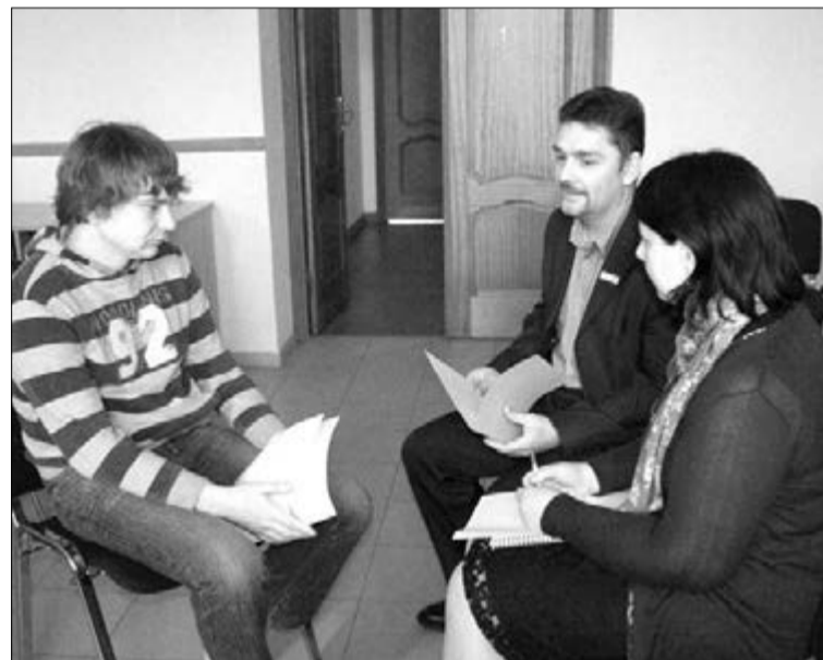
РАБОТА В МАЛЫХ ГРУППАХ

Не каждому из участников семинара было просто раскрыть себя. Кто-то ожидал от этой пасторской конференции лекций или обсуждения актуальных вопросов. Но, тем не менее, большинство активно включилось в работу, исполняя роли в импровизированных сце-