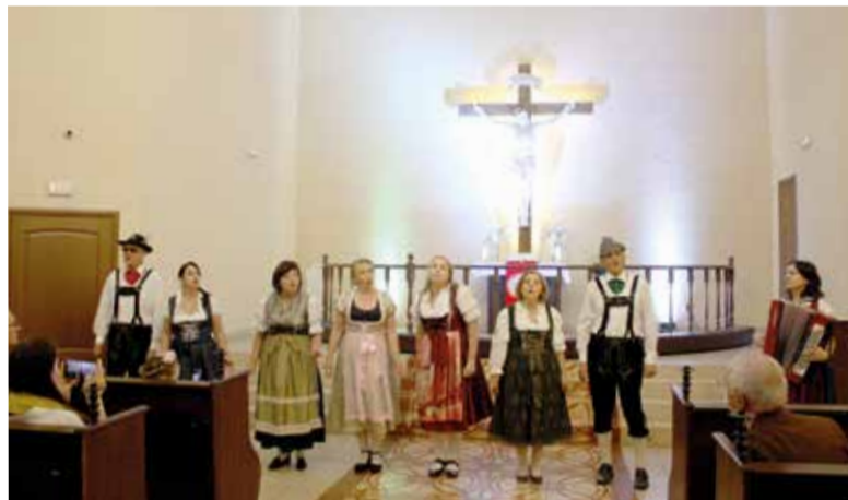
Выступление ансамбля «Эрика» из Тольятти

Праздник завершился чаепитием и Круглым столом, на котором архиепископ в общении с прихожанами и гостями говорил о важности сохранения памяти и о лютеранском наследии в России и во всём мире. ■