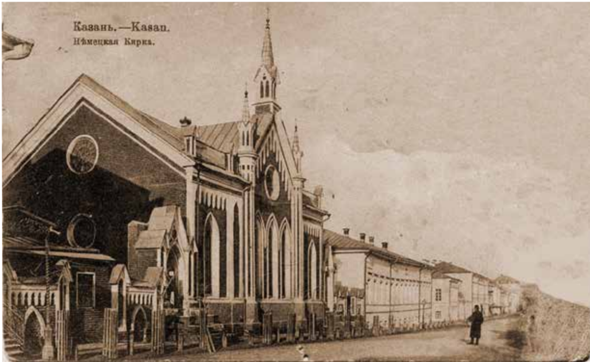
Историческое фото церкви св. Екатерины

Так, церковь св. Екатерины на улице Покровской (сегодня ул. Карла Маркса), освященная в 1771 году, стала свидетельством важного этапа в развитии этого многонационального города, в котором сегодня, по официальным данным, проживает порядка 100 национальностей.