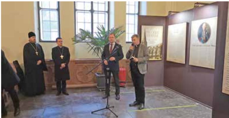
Открытие выставки «Русские немцы. Благотворители и меценаты»