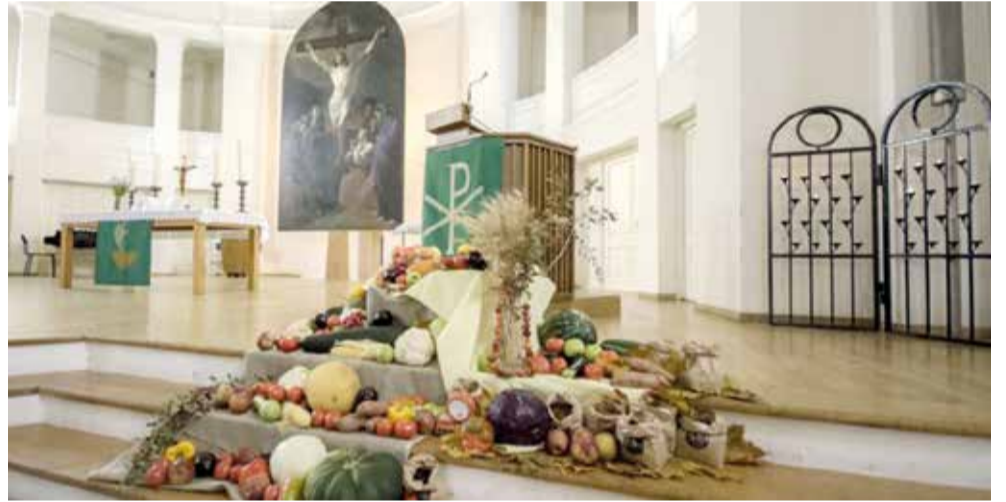
Санкт-Петербург (собор свв. Петра и Павла)