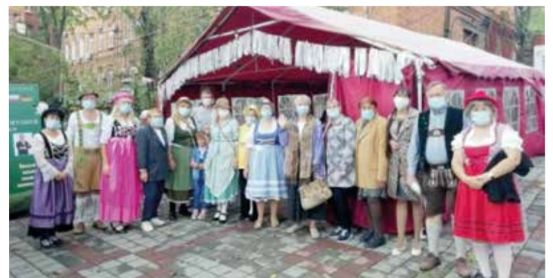
Немецкая национально-культурная автономия Приморского края представила блюда национальной кухни с дегустацией, а также организовала выставку поделок и прикладного искусства