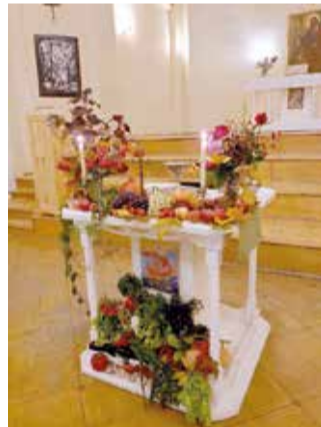
Санкт-Петербург (церковь св. Екатерины)