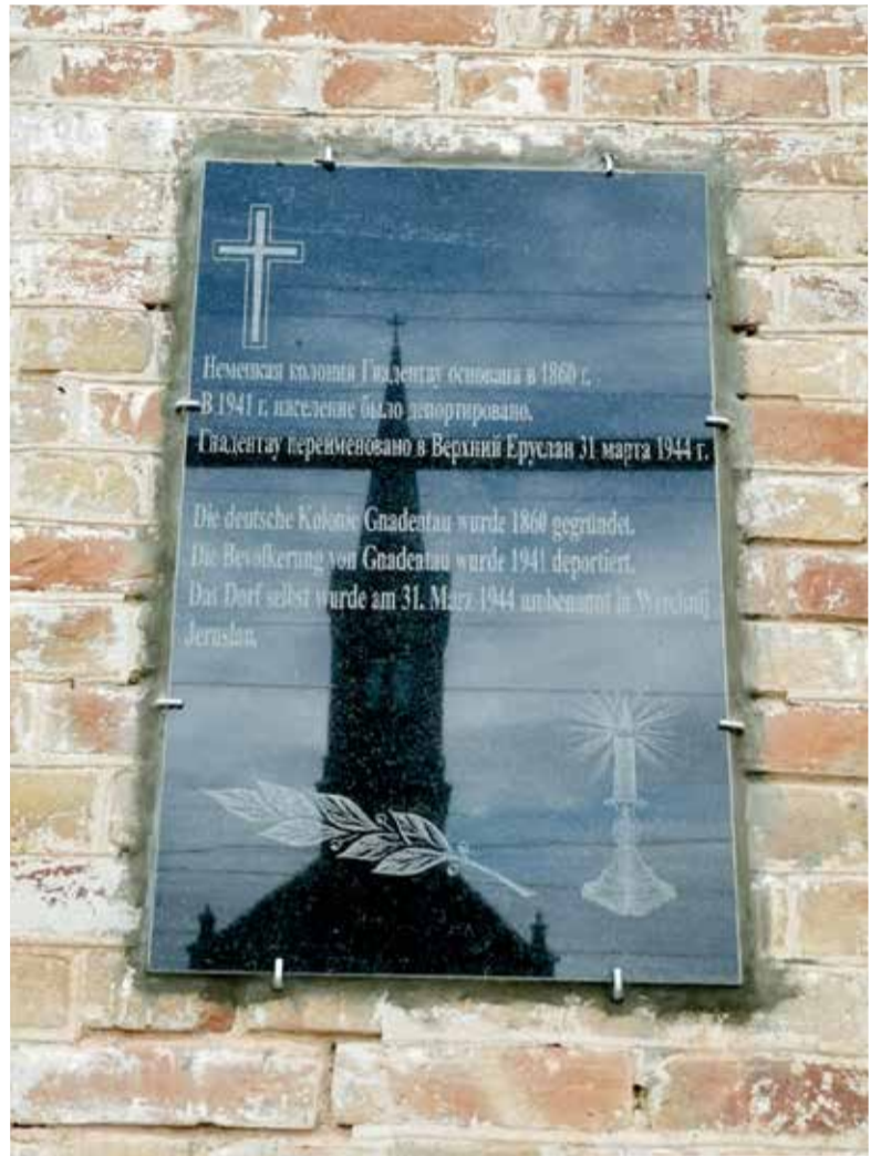
Денежные средства на памятную доску были выделены Баварским культурным центром немцев из России...