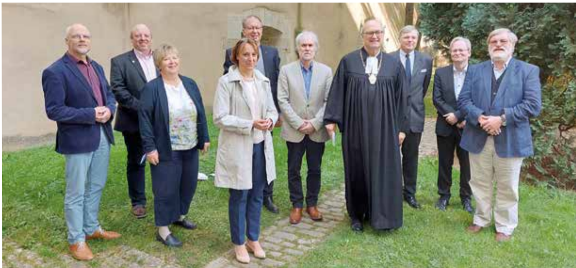
Новый президиум ФГА

По материалам сайта www.gustav-adolf-werk.de