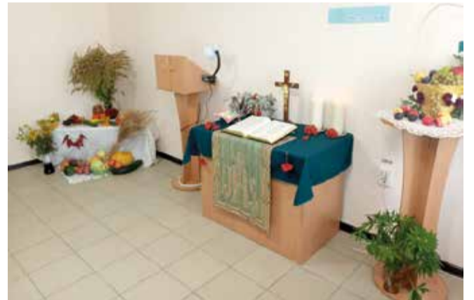
Волчанск (Свердловская обл.)