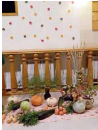
Красноуринск (Свердловская обл.)