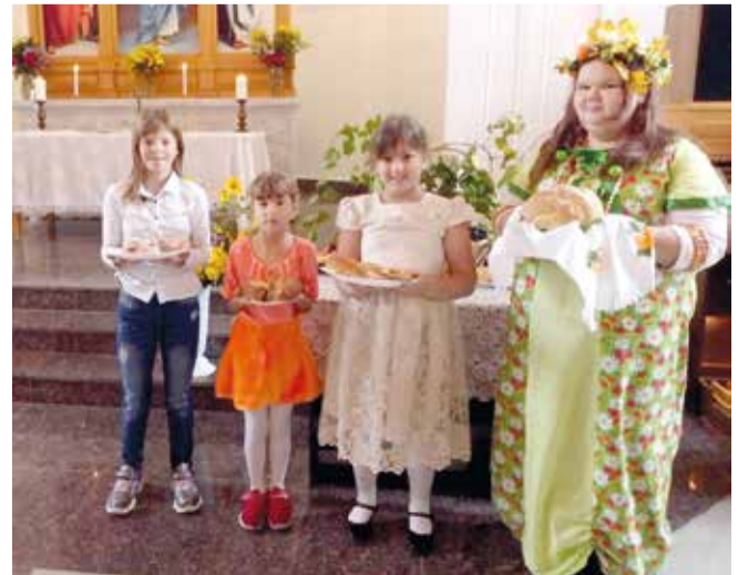
с. Зоркино (Саратовская обл.)