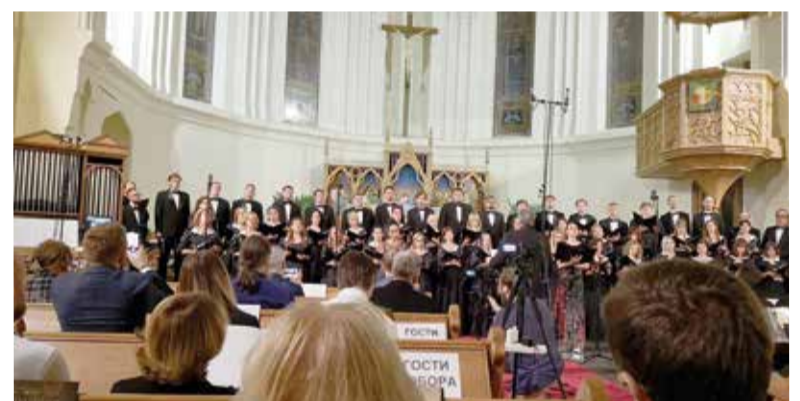
Концерт к Международному дню благотворительности