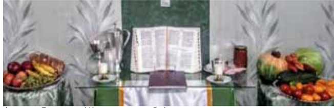
Анжеро-Судженск ( Кемеровская обл.)