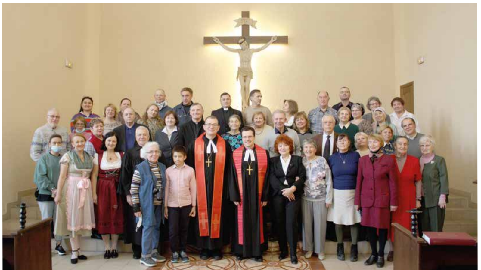
Община и гости после богослужения