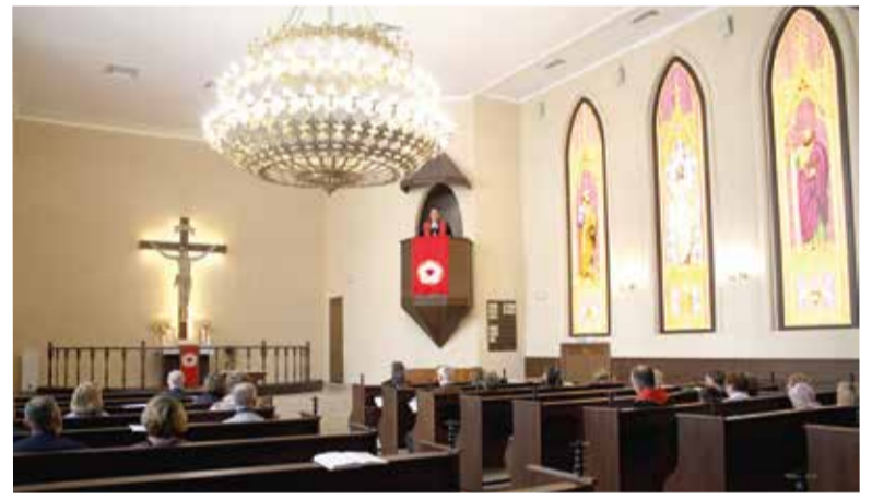
Архиепископ Дитрих Брауэр читает проповедь на богослужении