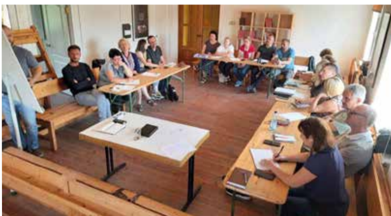
Участников конференции ждала насыщенная программа...