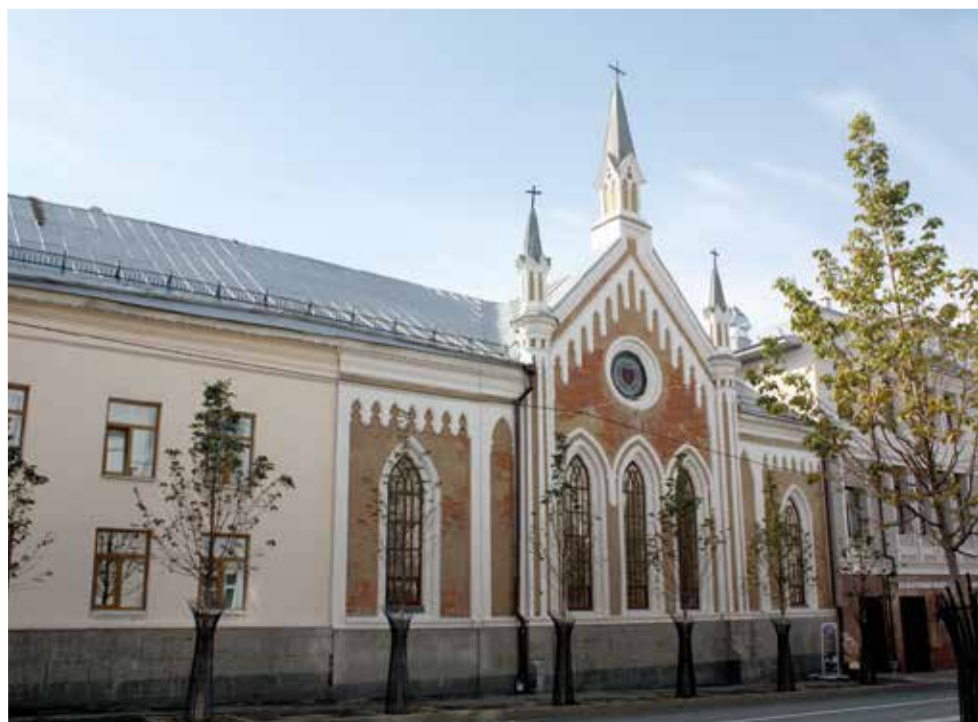
Современное здание церкви св. Екатерины было освящено в 1863 году