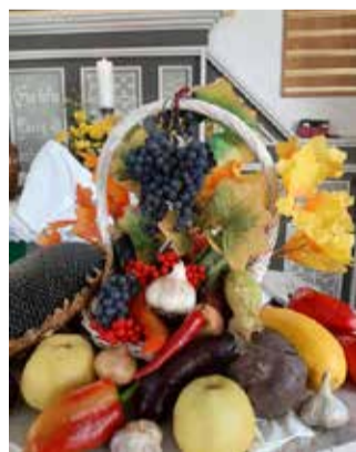
Гусев (Калининградская обл.)