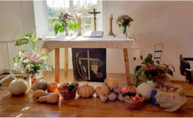
с. Петролинское (Одесская обл.)