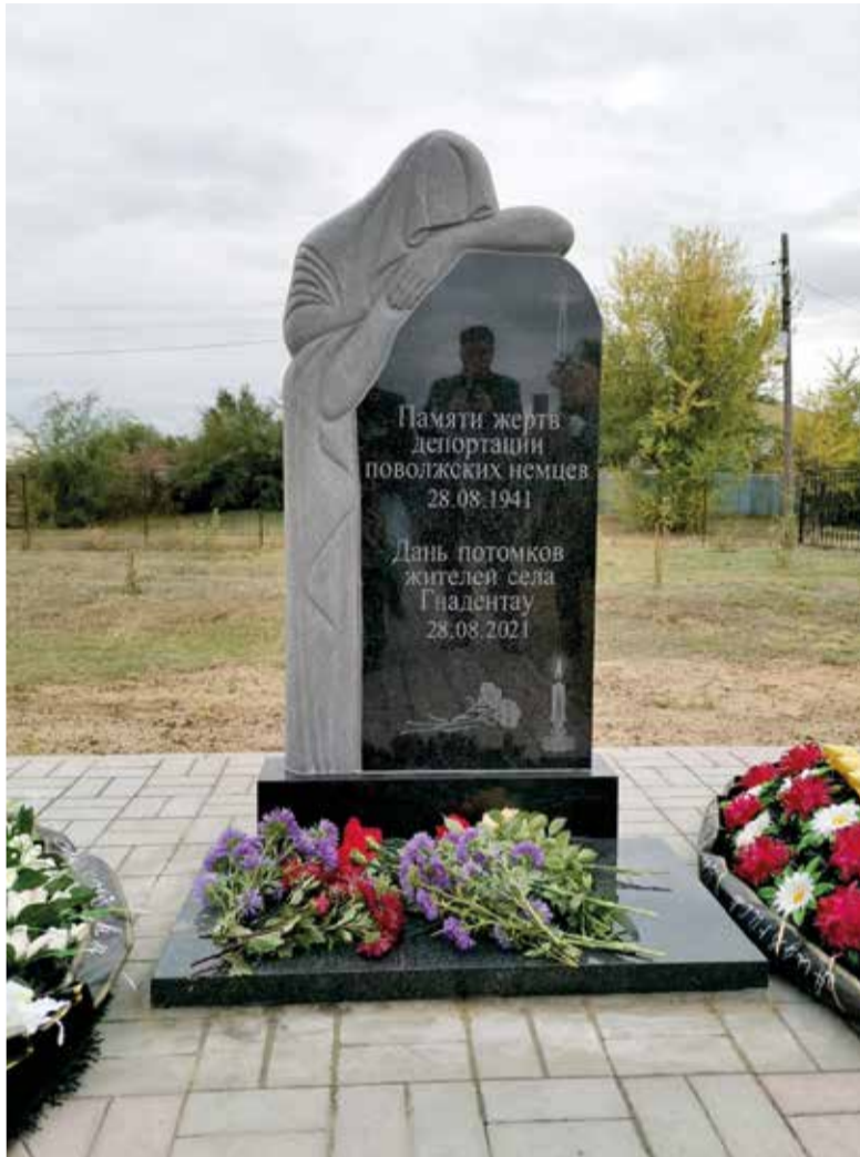
Памятник был установлен на пожертвования граждан...

По материалам группы Das Wolgadeutschegebiet на Facebook