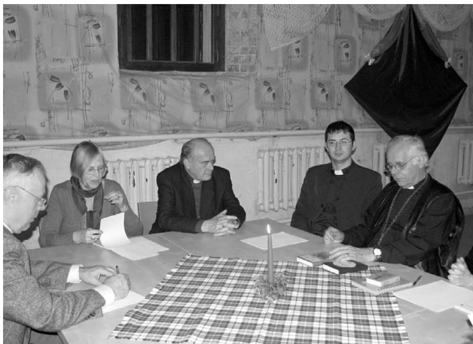
ВСТРЕЧА С СОВЕТОМ ОБЩИНЫ В КАЗАНИ

Под руководством епископа ЕЛЦЕР и Архиепископа ЕЛЦ Эдмунда Ратца в Москве 13 и 14 марта состоялось второе заседание нового состава президиума ЕЛЦЕР, а также заседание Консistorии.