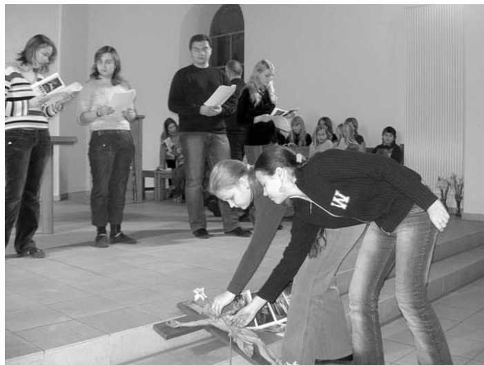
«СЫН ЧЕЛОВЕЧЕСКИЙ» – МОЛОДЕЖНЫЙ КРЕСТНЫЙ ПУТЬ

Стремления, бурлящие в нас, людях, и побуждающие нас снова и снова тянуться к божественному, обретают в крестном пути плоть и кровь.