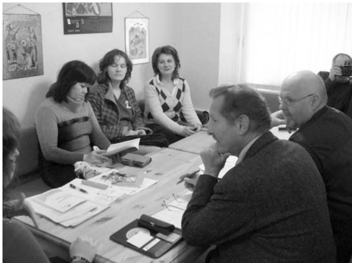
РАБОЧАЯ ВСТРЕЧА ГРУППЫ ОРГАНИЗАЦИИ «СИНИЙ КРЕСТ»

По итогам встречи участники группы приняли решение о создании и регистрации всероссийского отделения организации «Синий Крест» на базе вышеперечисленных структур.