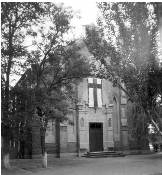
ВОЗВРАЩЕННОЕ ЦЕРКВИ ЗДАНИЕ

Итак, мы стали обладателями трех зданий: кирхи, бывшей школы и домика церковного сторожа. Одновременно с нами вселился Центр немецкой культуры. Экспертиза состояния зданий была проведена немецким архитектором Блюмом, которого пригласил пастор общины Герд Зандер. Конечно, дома строились на века, но из-за отсутствия водосливных труб за десятилетия стены пропитались сыростью, так что теперь штукатурка осыпается, и обои на них не держатся. Поэтому первое, что было сделано – установлены водосливные трубы. Предстоят еще серьезные реставрационные работы, для этого нужны крупные капиталовложения. Однако мы уверены, что Бог поможет нам решить все проблемы, и неприглядные сейчас здания воссияют в прежней красе.