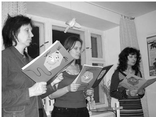
ХАБАРОВЧАНЕ МОЛИЛИСЬ ОТ ВСЕГО СЕРДЦА

7 марта побудило христиан всего мира обратить свои взоры на неизвестную для многих доселе южноамериканскую страну Гайана. Прихожане хабаровской лютеранской общины вместе с друзьями праздновали Всемирный день молитвы одними из первых в стране, да и, пожалуй, в мире. Ведь когда на Дальнем Востоке зажгли молитвенные свечи, в Центральной России и Европе было еще раннее утро. В этот вечер на глобусе, установленном в центре зала, стало одним белым пятном меньше. Благодаря слайдам Гайана предстала перед молящимися во всей своей природной красоте и уникальности, открыла сложные страницы истории и исполненные надежды упования на будущее. О настоящем этой страны, о ее мирном развитии и решении многочисленных проблем гайанцев хабаровчане молились от всего сердца, ведь многие трудности знакомы им по собственной жизни. Однако, как и южноамериканские сестры и братья, дальневосточники не теряют оптимизма. Всемирная молитва укрепляет веру, придает сил и открывает Творение с новых сторон. Информационные встречи, знакомящие с разными аспектами жизни в Гайане, собирали прихожан несколько недель подряд перед Всемирным днем молитвы, поэтому хабаровчане молились за страну, обладая широкой информацией о ее особенностях и жителях.