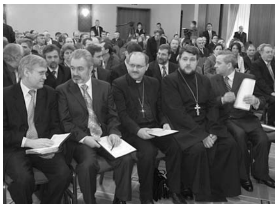
НАЦИОНАЛЬНАЯ УТРЕННЯЯ МОЛИТВА