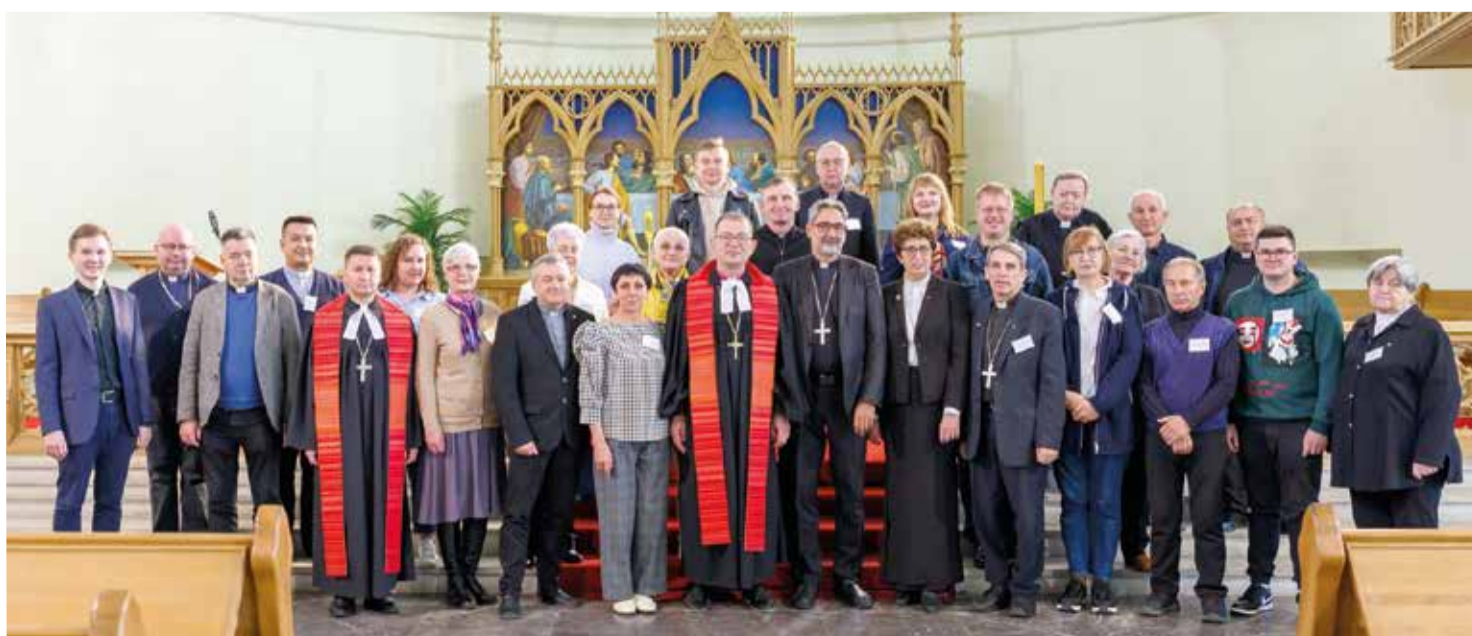
Делегаты Синода в кафедральном соборе свв. Петра и Павла