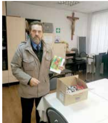
Помимо прочего раненым передали напутственные послания

Большая благодарность от руководства Саратовского церковного округа всем жертвователям и служителям – организаторам этой акции! ■