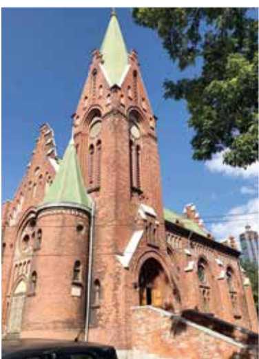
Церковь св. Павла во Владивостоке. 1908 год (арх. Георг Юнгхендель)

ВЛАДИВОСТОК. Здание церкви св. Павла, которая находится в центре дальневосточной столицы, знают многие. Особенно теперь, когда его включили в путеводители, а турагенты охотно приводят сюда гостей, чтобы показать