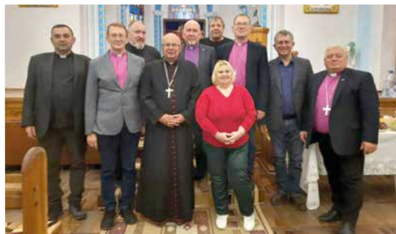
Участники Совета епископов с гостями и прихожанами общины Ташкента