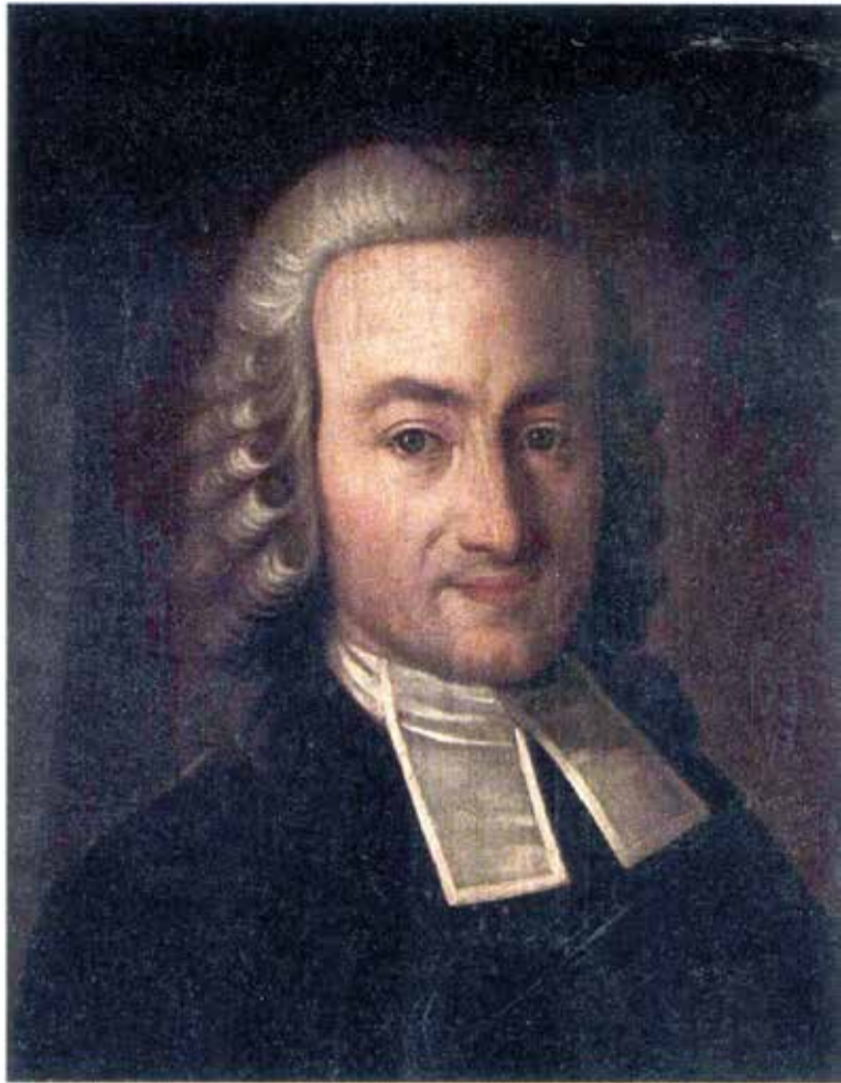
Портрет пастора Нанциуса. Неизвестный художник, середина XVIII в. Хранится в Государственном Эрмитаже