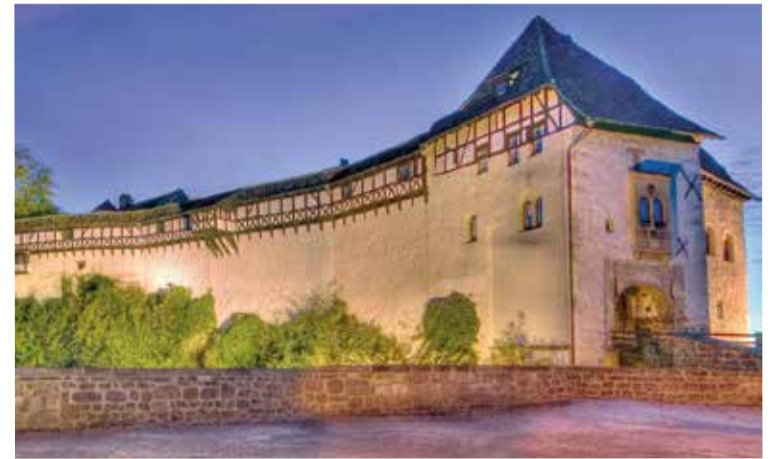
Торжества в честь юбилея Немецкого национального комитета ВЛФ прошли в замке Вартбург

ЭЙЗЕНАХ/НЮРНБЕРГ. В начале октября епископ Немецкой Евангелической Церкви Украины (НЕЛЦУ) Павел Шварц совершил поездку в Германию, в ходе которой он посетил мероприятия Немецкого национального комитета Всемирной Лютеранской Федерации (ВЛФ) в Эйзенахе, а также встретился с верующими из Украины в Нюрнберге.