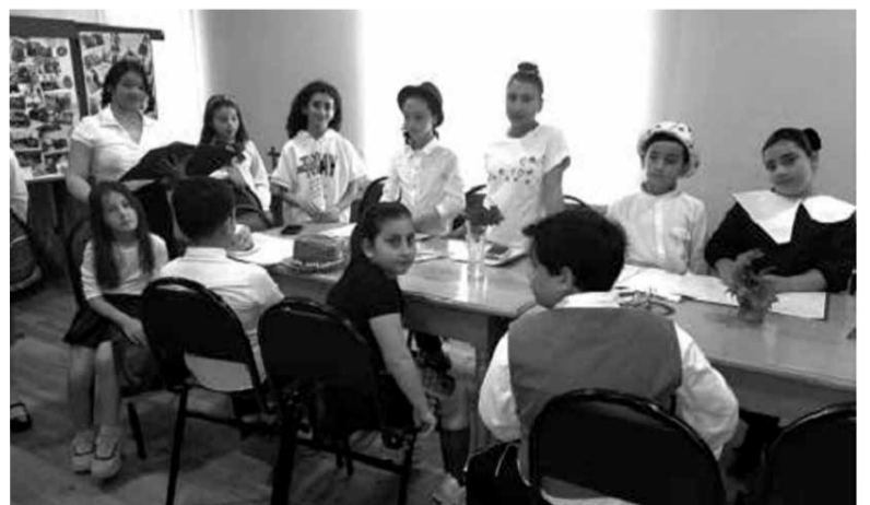
Каждое воскресенье в распоряжении местной лютеранской общины теперь находится актовый зал, в котором она может проводить богослужения...

Посол обратился к жителям Болниси с просьбой проявить собственную инициативу для использования и обустройства нового помещения. Посольство готово в будущем поддерживать дальнейшие проекты по реставрации и использованию зданий старого Катариненфельда, если такие проекты будут выполняться, в первую очередь, за счет собственных средств. Таким образом, Болниси снова может стать важным местом для проведения немецко-грузинских встреч в регионе, столь богатым традициями. ■