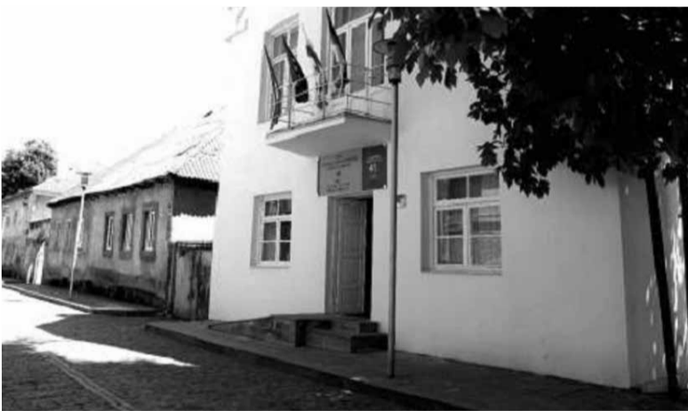
Новый культурный центр в бывшем доме сельского старосты