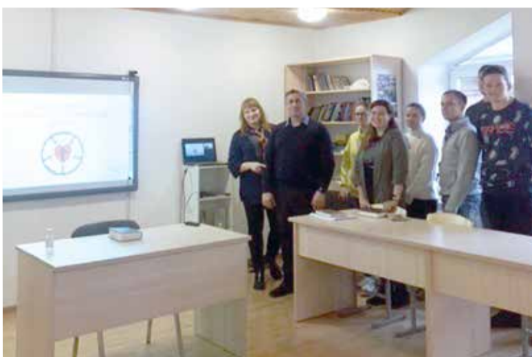
Тему встречи «Мартин Лютер и Реформация христианской Церкви» выбрали сами ребята...