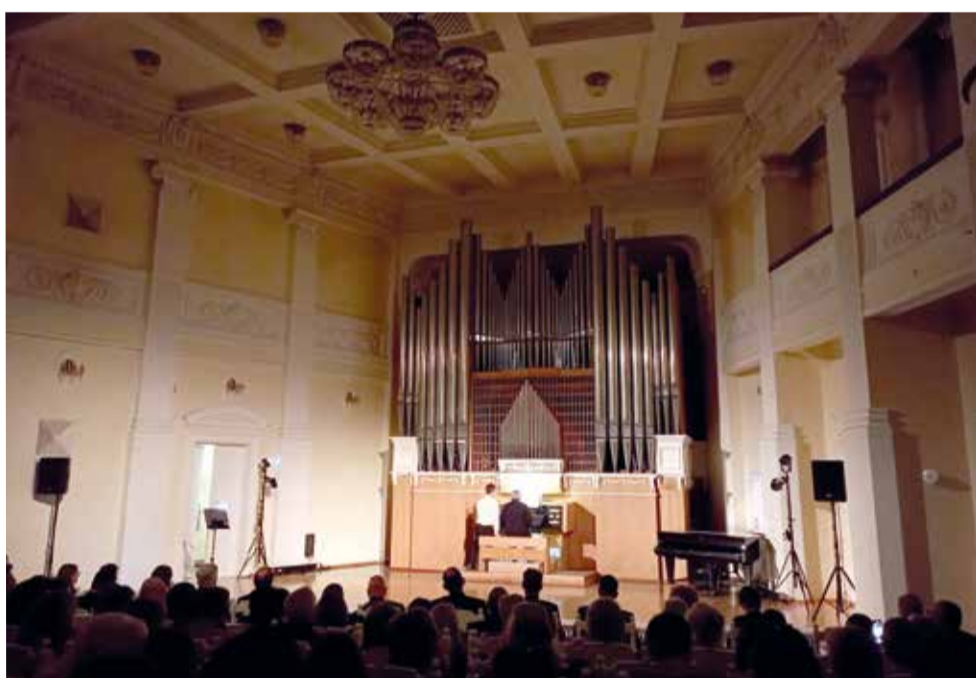
Конференция завершилась музыкальным вечером в органном зале Омской филармонии

Омск. В этом году Евангелическо-Лютеранская Церковь России (ЕЛЦР) приняла решение отпраздновать 505-летие Реформации в Омске – центре Евангелическо-Лютеранской Церкви Урала, Сибири и Дальнего Востока (ЕЛЦ УСДВ).