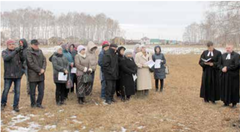
На мероприятии присутствовали сотрудники и прихожане ЕЛЦ УСДВ, а также гости – участники III Международной научно-практической конференции «Лютеране в России»

Символично, что строительство началось в юбилейный для региона год – в год 30-летия основания Азовского немецкого национального района. ■