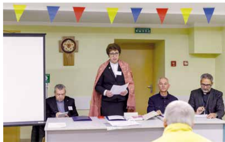
На заседаниях Синода