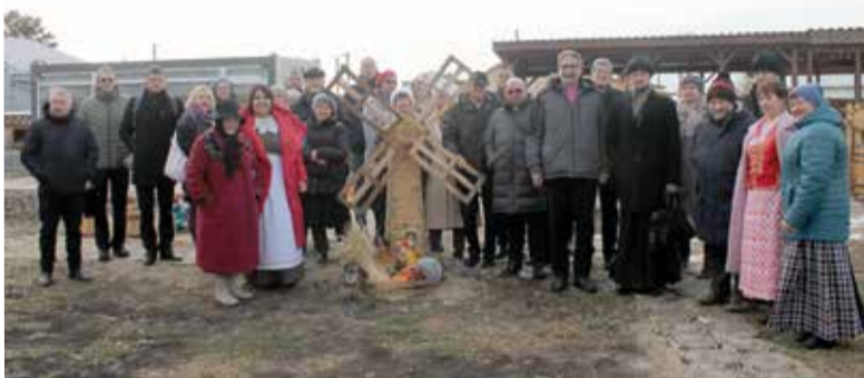
Участники конференции посетили Музей Азовского немецкого национального района