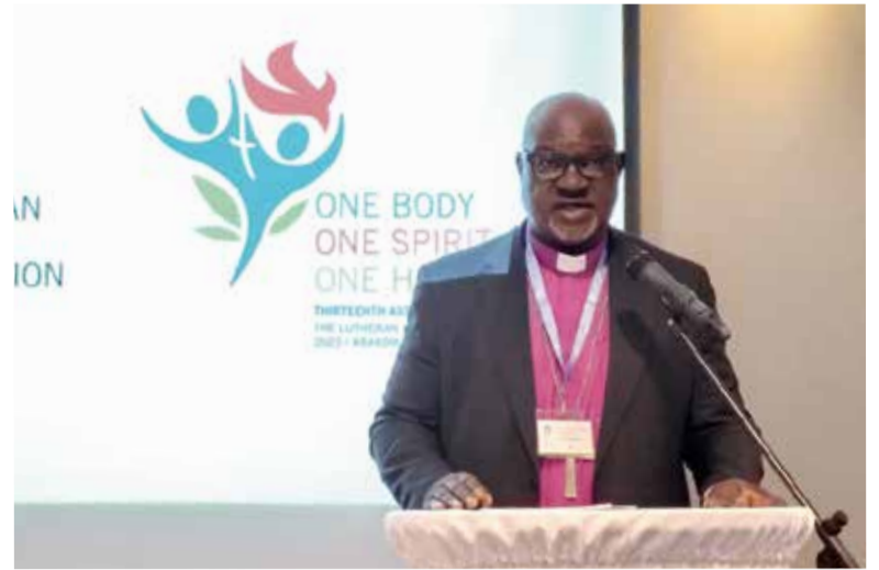
Президент ВЛФ, архиепископ Пантти Филибус Муса открыл собрание

Епископ НЕЛЦУ Павел Шварц в своем выступлении подчеркнул: «Мы еще долго будем нуждаться в помощи. Это зна-