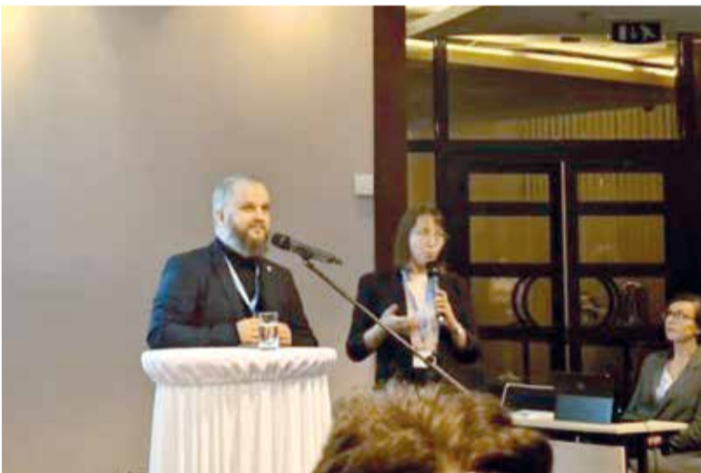
Епископ НЕЛЦУ Павел Шварц выступает на встрече