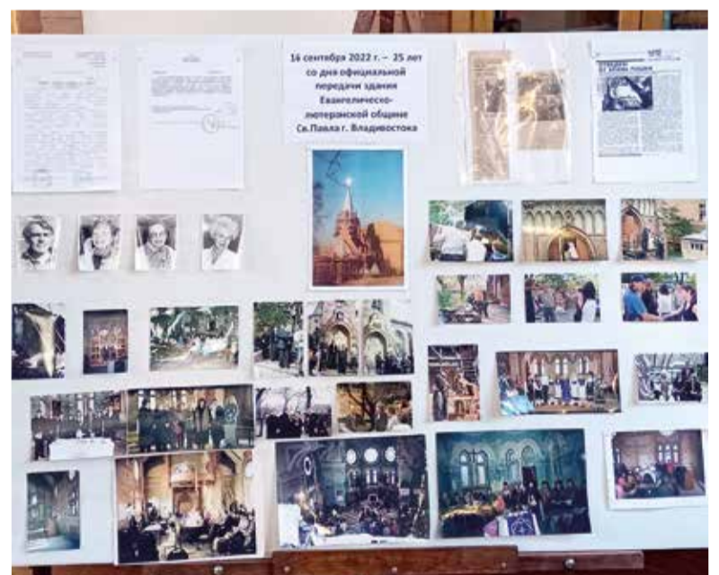
Стенд, подготовленный к 25-летию передачи здания общине

давности, тех, кто мог приехать, прийти или написать.