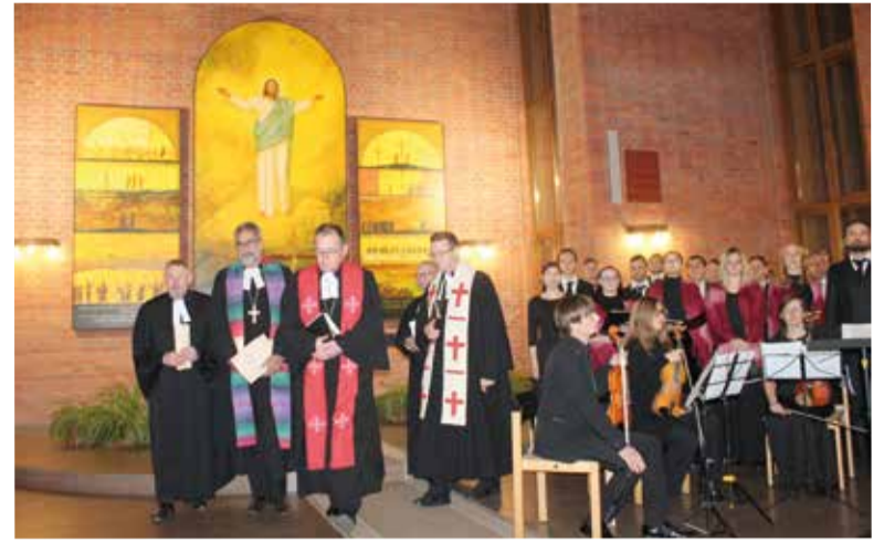
Торжественное богослужение в честь дня Реформации прошло 31 октября в церкви Христа

Конечно, празднование юбилея Реформации не могло обойтись без торжественного богослужения. Оно состоялось вечером 31