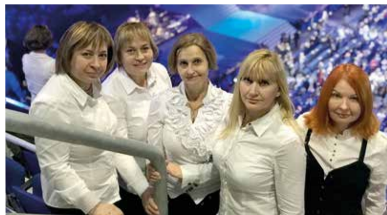
Участники хора «Голоса Сарепты» в помещении «Мерседес-Бенц-Арены» в Берлине, где в октябре 2017 года они приняли участие в исполнении поп-оратории «Лютер»