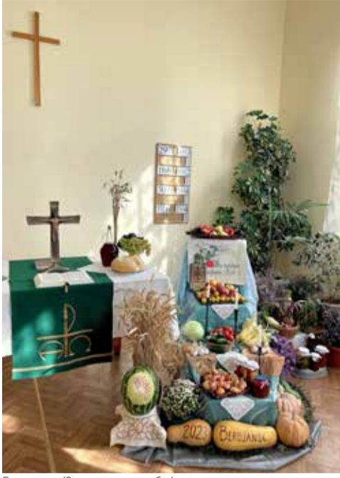
Бердянск (Запорожская обл.)