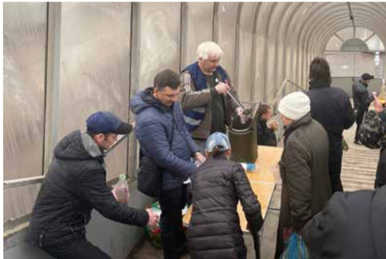
Служители и прихожане общины св. Марии участвуют в кормлении нуждающихся у вокзала

По материалам интернет-страницы в VK «Евангелическо-лютеранская община кирхи св. Марии»