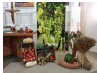
Маркс (Саратовская обл.)