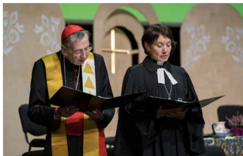
Кардинал Курт Кох и генеральный секретарь ВЛФ Анне Бургхардт представили декларацию «Совместное слово»

По материалам сайта www.lutheranworld.org