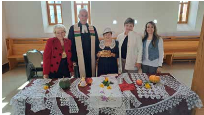
Зоркино (Саратовская обл.)