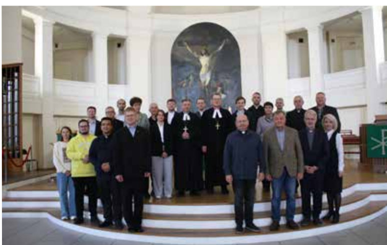
Участники заседаний Генерального Синода в Петрикирхе