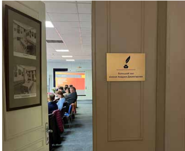
Большой зал им. Андрея Джамгарова в Теологической семинарии