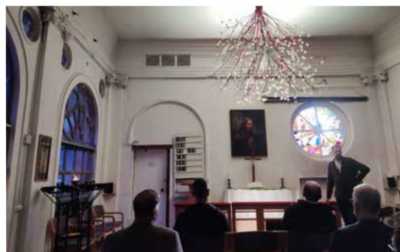
Участники экскурсии совершили вечернюю молитву в капелле церкви св. Анны...