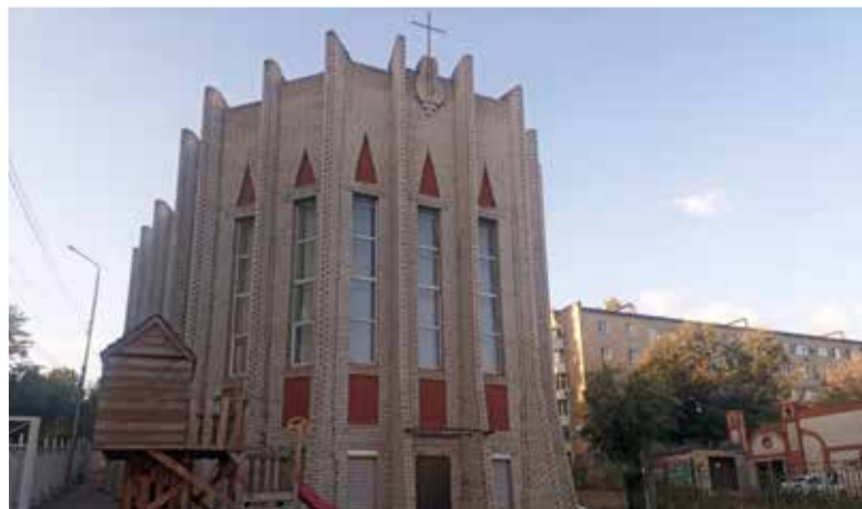
Собор св. Марии в Саратове