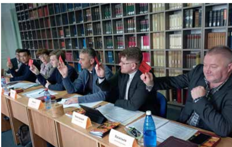
Голосование на заседании Генерального Синода