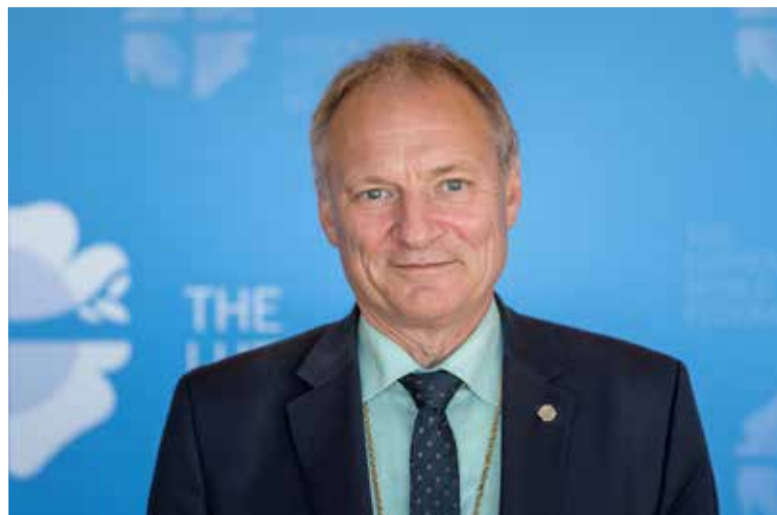
Новый президент ВЛФ, епископ Хенрик Стубьёр

Делегаты услышали сообщения о жертвах вооруженных конфликтов и насилия по всему миру. «Наша вера требует от нас быть послами справедливости, мира