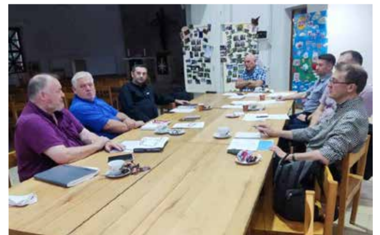
Заседание Совета епископов в церкви Примирения

Собор построен на добровольные пожертвования. ■