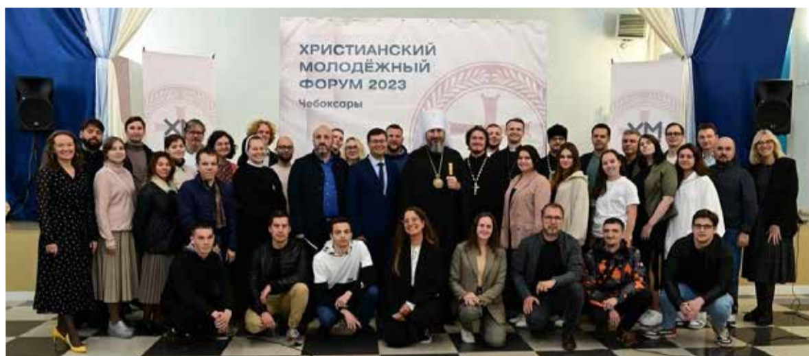
Участники II Христианского молодежного форума в Чебоксарах