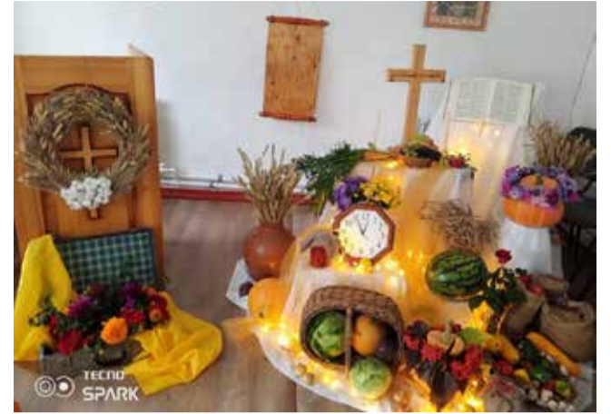
Фоминовка (Омская обл.)