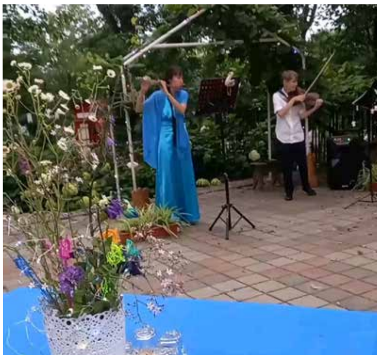
На закате особенно атмосферно звучали скрипка и флейта...

что мы открыты к общению и взаимодействию в простых житейских вопросах. ■