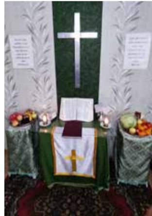
Анжеро-Судженск (Кемеровская обл.)