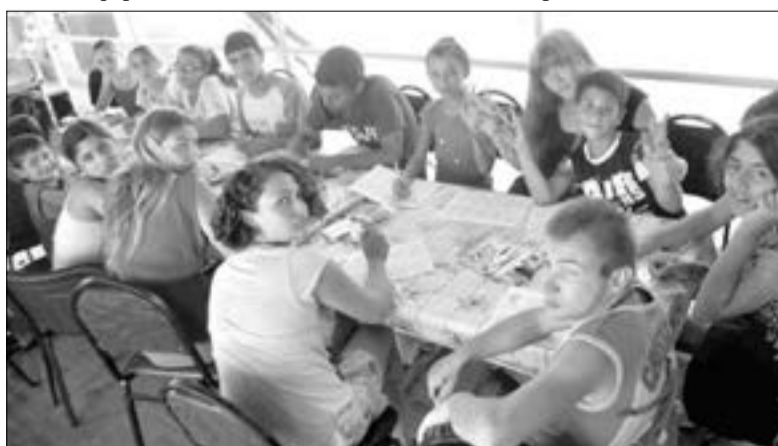
УЧАСТНИКИ ЛАГЕРЯ – ВОЛОНТЕРЫ ИЗ ГРУЗИИ, ФРАНЦИИ И ЯПОНИИ – ОПЕКАЛИ ДЕТЕЙ С ОГРАНИЧЕННЫМИ ВОЗМОЖНОСТЯМИ...