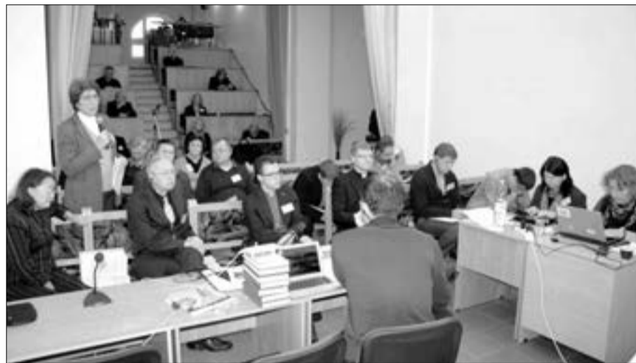
НА ЗАСЕДАНИЯХ ГЕНЕРАЛЬНОГО СИНОДА