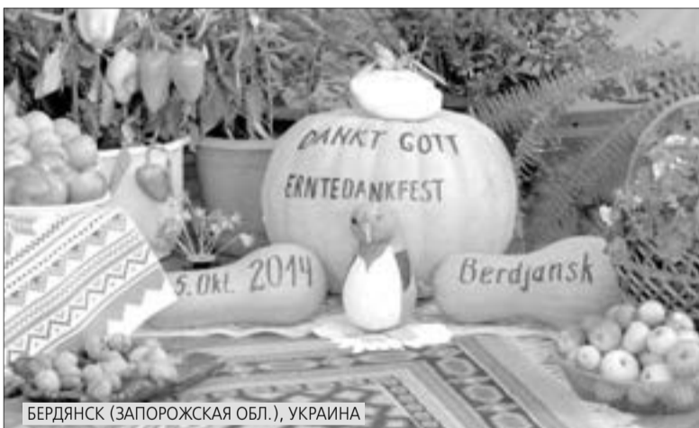
БЕРДЯНСК (ЗАПОРОВСКАЯ ОБЛ.), УКРАИНА