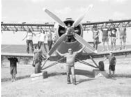
... А ТАКЖЕ И СОВСЕМ НЕДАЛЕКОГО СОВЕТСКОГО ПРОШЛОГО

бессарабских немцев. Здесь всё вокруг дышит историей. В рамках путешествия мы посетили быв-