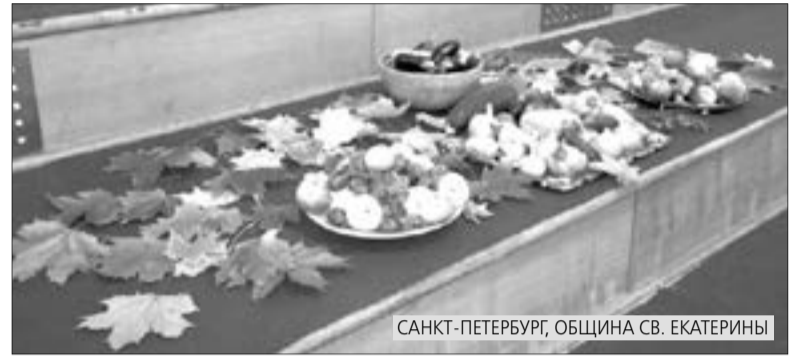
САНКТ-ПЕТЕРБУРГ, ОБЩИНА СВ. ЕКАТЕРИНЫ