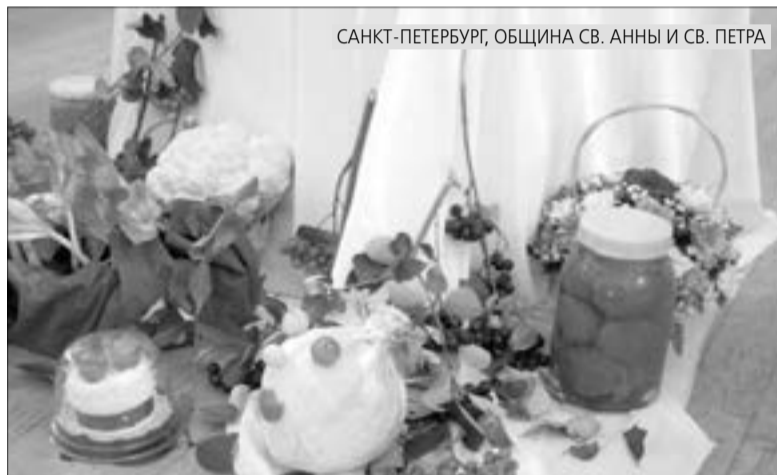
САНКТ-ПЕТЕРБУРГ, ОБЩИНА СВ. АННЫ И СВ. ПЕТРА