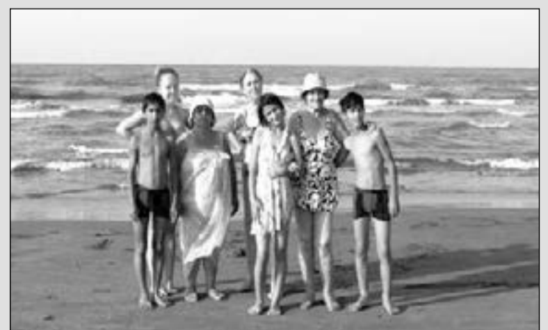
БАКИНЦЫ НА БЕРЕГУ КАСПИЙСКОГО МОРЯ