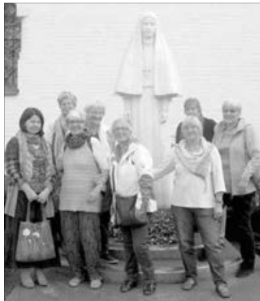
УЧАСТНИЦЫ МЕЖДУНАРОДНОЙ ЭКУМЕНИЧЕСКОЙ ВСТРЕЧИ В МАРФО-МАРИИНСКОЙ ОБИТЕЛИ

4 сентября состоялся визит в православную Марфо-Мариинскую обитель в Москве. Впервые московская община Кафедрального собора была приглашена в учреждение Русской Православной Церкви. Обитель была основана в 1909 году Елизаветой Федоровной Романовой (урожденной Гессен-Дармштадской). В те времена особенно заботились о сиротах, нуждающихся и больных. Для этого также была построена больница. В настоящее время обитель активно