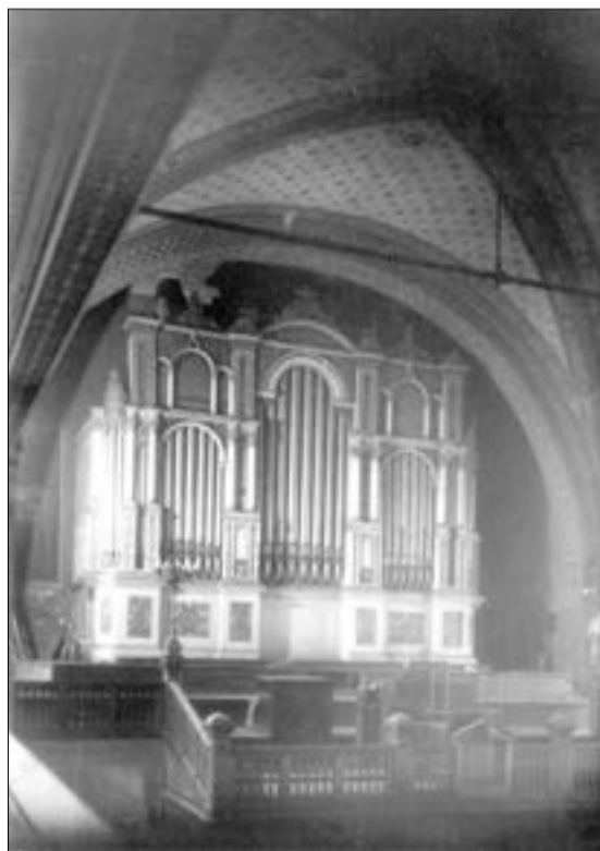
ИСТОРИЧЕСКИЙ ОРГАН ПЕТРИКИРХЕ В ЕЕ ПЕРВОНАЧАЛЬНОМ ИНТЕРЬЕРЕ