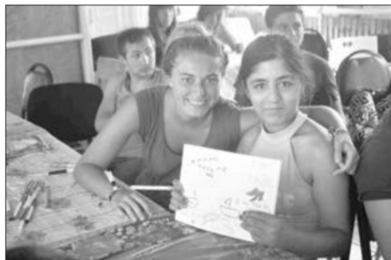
ТВОРЧЕСКИЕ ЗАНЯТИЯ В ЛАГЕРЕ

Примером такой работы в очередной раз стал лагерь «Надежда», который в этом году был проведен с 1 по 12 сентября в г. Кобулет.