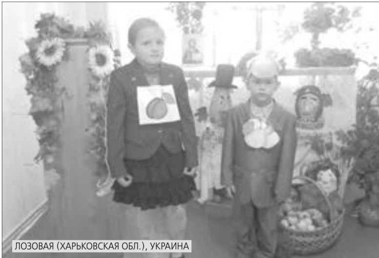
ЛОЗОВАЯ (ХАРЬКОВСКАЯ ОБЛ.), УКРАИНА