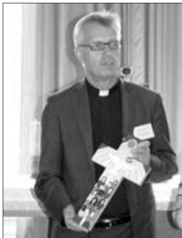
МАРТИН ЮНГЕ ПРЕПОДНОСИТ ПОДАРОК РОССИЙСКИМ ЛЮТЕРАНАМ ВО ВРЕМЯ ГЕНЕРАЛЬНОГО СИНОДА

САНКТ-ПЕТЕРБУРГ. Генеральный секретарь Всемирной Лютеранской Федерации (ВЛФ) Мартин Юнге впервые посетил Евангелическо-Лютеранскую Церковь в России (ЕЛЦР). 15 сентября вместе с Евой Фогель-Мфато, руководителем европейского департамента ВЛФ, он прибыл в Петербург для участия в работе Генерального Синода ЕЛЦР, который прошел в последние дни.