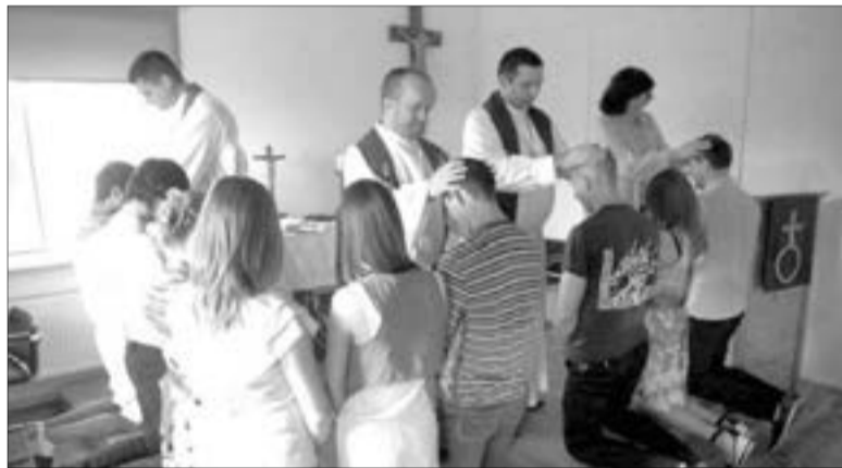
БЛАГОСЛОВЕНИЕ СТУДЕНТОВ БИБЛЕЙСКОЙ ШКОЛЫ

ший военный полигон, где в советское время разворачивались танковые учения стран Варшавского договора. Огромная территория похожа на пустыню. Отсюда после Второй мировой войны были выселены жители всех сел, здесь не возделывалась земля, и практически нет деревьев (посаженных во время государственных программ в 1960-1970 годы).