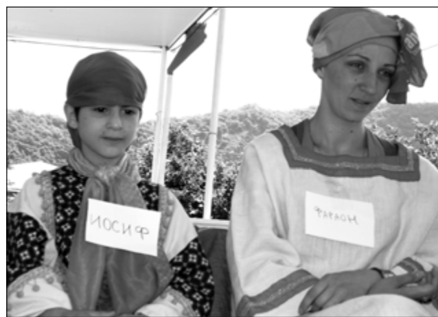
ИГРА В ГЕРОВ БИБЛЕЙСКОЙ ИСТОРИИ