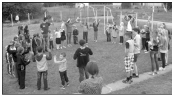
ИГРЫ ПОСЛЕ СКАЗКИ

ПЕТРОДОЛИНСКОЕ. Вот и пришло долгожданное лето, а вместе с ним замечательный праздник – День защиты детей. К этому дню студенты Библейской школы вместе с молодежью общины Петродолины подготовили специальную программу. А для этого на театральном кружке, который проходит в Библейской школе каждую среду, было решено приготовить для детей сказку. Да не просто сказку, а целую историю о том, как Зло, которое некогда поработило всех людей, теперь правит на земле при помощи своих слуг: Жадности, Лени, Лжи и Зависти. Но, несмотря на то, что люди практически не могут сопротивляться злой силе и к тому же ничего не помнят из былой жизни, у них есть надежда. Ведь есть легенда, что существует Свет и Жизнь для всех людей. Злой дракон похитил ларец, в котором необычайное бо-