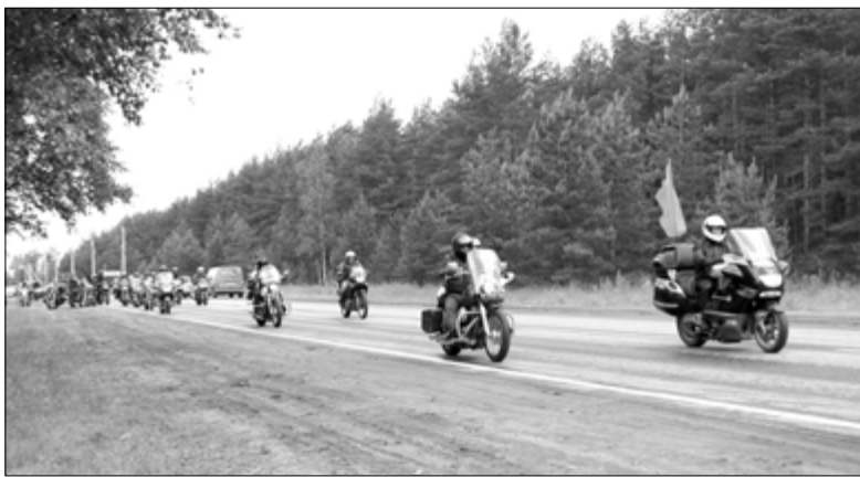
УЧАСТНИКИ МОТОПРОБЕГА НА ПУТИ С «НЕВСКОГО ПЯТАЧКА» К СИНЯВИНСКИМ ВЫСОТАМ

солдат, фрагменты распятий и икон из окопов, фотографии и истории защитников города, письмо к Богу девочки из блокадного Ленинграда – вот экспонаты этой выставки. ...Нет, война не стоит ни одного имени на военном медальоне, ни одного письма с фронта, ни одного холмика на военном кладбище. ■