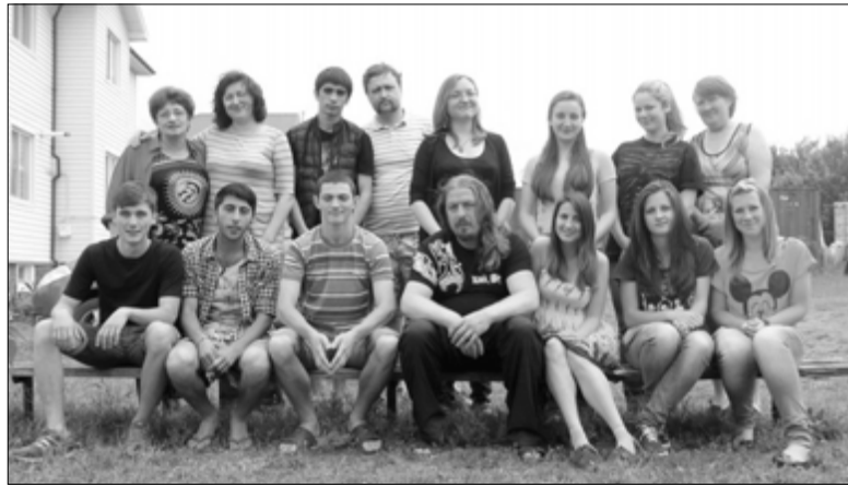
15 УЧАСТНИКОВ СЕМИНАРА ПО ПОДГОТОВКЕ ДНЕВНЫХ ЛАГЕРЕЙ

Именно поэтому с 3 по 6 июня в Петродолине проводился семинар по подготовке дневных лагерей для общин Церкви! В семинаре участвовало 13 человек из Украины и двое из Грузии. Совместными усилиями была разработана пятидневная программа лагеря на тему «Открой сердце Иисусу». Мы решили рассказать деткам о добром сердце Иисуса и учили, как быть похожими на него. Все участники семинара были разделены на группы