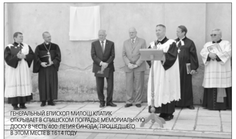
ГЕНЕРАЛЬНЫЙ ЕПИСКОП МИЛОШ КЛАТИК ОТКРЫВАЕТ В СПИШСКОМ ПОГРАДЬЕ МЕМОРИАЛЬНУЮ ДОСКУ В ЧЕСТЬ 400-ЛЕТИЯ СИНОДА, ПРОШЕДШЕГО В ЭТОМ МЕСТЕ В 1614 ГОДУ

Особенно приятно удивляет взаимодействие Церкви и государства. Прежде я уже слышала, что Церковь здесь получает дотации от государства. Но воочию увидеть это сотрудничество можно, только побывав здесь. Всех многочисленных иностранных гостей праздника – из Церквей Чехии, Польши, Венгрии, Украины, Германии, России – в первый же день торжественно принимает в ратуше губернатор города. Он приветствует каждого поименно, вручая подарки и приглашая расписаться в почетной книге гостей города. Вот так сюрприз! А балкон