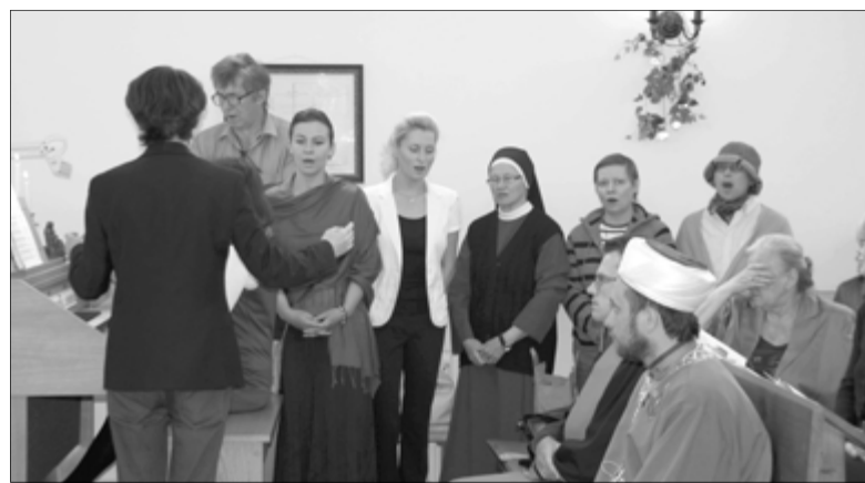
ХОР КАТОЛИЧЕСКОЙ ОБЩИНЫ ПОДАРИЛ ОБЩИНЕ ЦЕРКВИ СВ. МАРИИ ПЕСНОПЕНИЯ

Благодаря своей работе в межконфессиональном консультативном комитете и совете протестант-