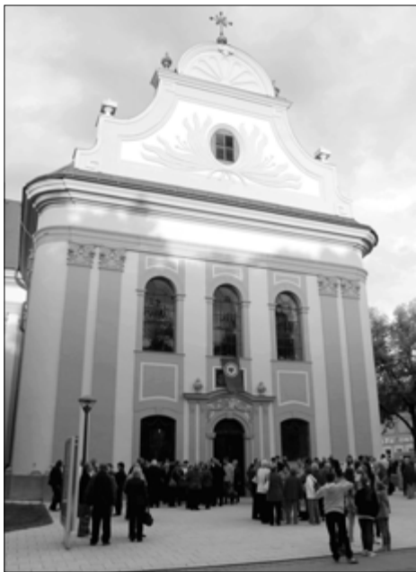
ЕВАНГЕЛИЧЕСКАЯ ЦЕРКОВЬ В СПИШСКОЙ НОВОЙ ВЕСИ В ДНИ ЦЕРКОВНЫХ ТОРЖЕСТВ

Но в памяти осталось ощущение тепла от пребывания в сообществе людей, которые так бережно и с такой радостью хранят свою веру. ■