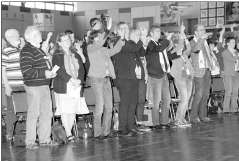
НА КОНФЕРЕНЦИЮ ПРИЕХАЛО БОЛЕЕ 2,5 ТЫСЯЧ УЧАСТНИКОВ