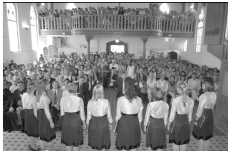
ЖЕНСКИЙ ВОКАЛЬНЫЙ АНСАМБЛЬ „ENCHORE LEIPZIG“ НА ПРАЗДНИКЕ ОСВЯЩЕНИЯ ОРГАНА