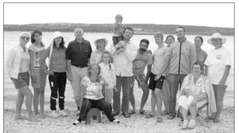
УЧАСТНИКИ МОЛИТВЕННОГО ЛАГЕРЯ ИЗ ОБЩИН УЛЬЯНОВСКА И САРАТОВА

Ульяновск. С 23 по 28 июня в Жигулёвских горах проходил очередной палаточный молитвенный лагерь, организуемый ульяновской общиной. В этом году в лагере было несколько изменений. Впервые он проходил не пять, а шесть дней. Участники предыдущих лагерей постоянно сожалели о том, что лагерь быстро заканчивается.