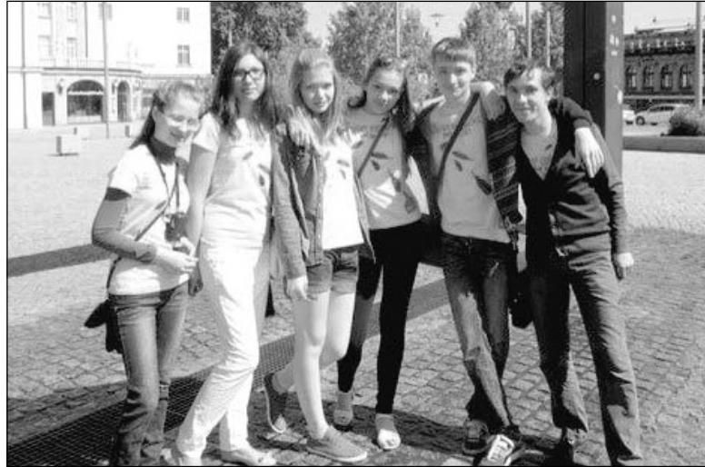
МОЛОДЕЖНАЯ ГРУППА ИЗ САМАРЫ НА ФЕСТИВАЛЕ

фестиваль со своим спектаклем, чтобы сказать свое слово на тему о свободе совести. В субботу после насыщенной двухдневной программы группа представила вечернюю молитву – миниатюру с блоком хоралов на английском, русском и немецком языках. ■