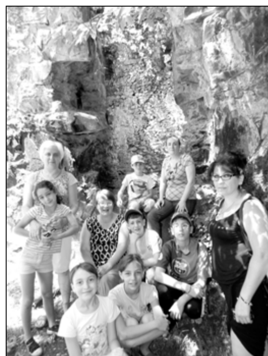
ДЕТИ И ВЗРОСЛЫЕ ЛАГЕРЯ В КВАРЕЛИ ВО ВРЕМЯ ОДНОЙ ИЗ ЭКСКУРСИЙ