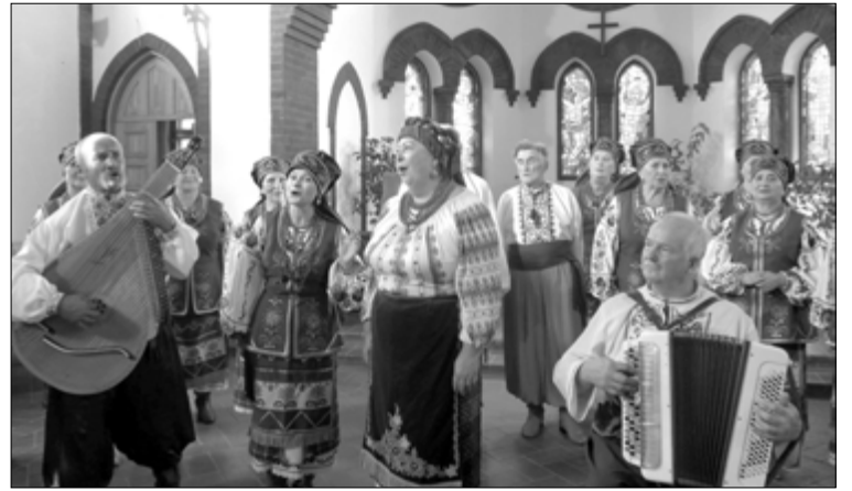
В ЦЕНТРЕ ВНИМАНИЯ НА КОНЦЕРТЕ БЫЛ УКРАИНСКИЙ НАРОДНЫЙ ХОР ИМЕНИ А. КРИЛЯ «ГОРЛИЦА»

Владивосток. Это было именно в тот день, когда на улицах Владивостока проходил сбор подписей «в защиту соотечественников Донбасса от украинского фашизма», и когда после богослужения общине передали стих, в котором говорилось об «украинском нацизме». Это следствие телевизионных репортажей. Наша Церковь, конечно, не участвует в этом. Мы служим примирению между народами, ведь и сама Церковь – это «новый народ из всех народов» (Деян. 2; Еф. 2, 17-22).