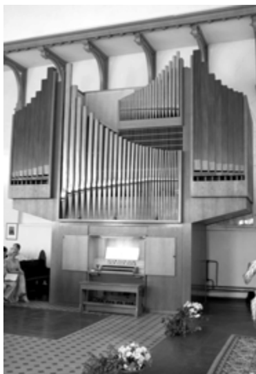
НОВЫЙ ОРГАН В ЦЕРКВИ СВ. ИОАННА

7 июня там состоялось освящение органа, привезенного двумя месяцами назад из Германии. До этого богослужения в общине проходили под аккомпанемент синтезатора. Когда три года назад родилась идея найти орган для гродненской кирхи, казалось, что сделать это будет несложно, ведь в Германии сейчас закрываются многие церкви, и инструменты выставляются на продажу. Но на деле выяснилось, что подходящий по размеру и цене вариант отыскать не так уж просто. В конце концов, с помощью бывшего рек-