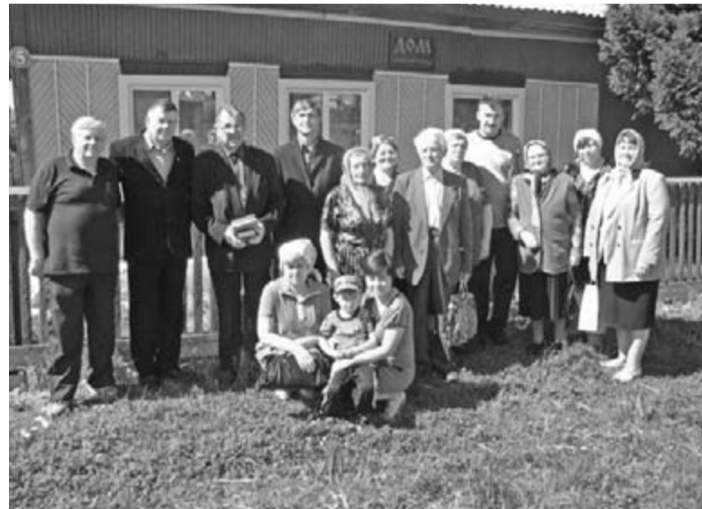
ОБЩИНА БОГРАДА ПЕРЕД ЗДАНИЕМ МОЛИТВЕННОГО ДОМА

БОГРАД. 24 июля у общины Богграда (Хакасия) был повод для радости: она совершила богослужение в отремонтированном помещении молитвенного дома. Здание, представляющее собой деревенский дом, уже длительное время нуждалось в ремонте. Старые окна больше не сохраняли тепло, сильно обветшала печь. Поэтому руководство общины приняло решение обновить окна и встроить новую печь.