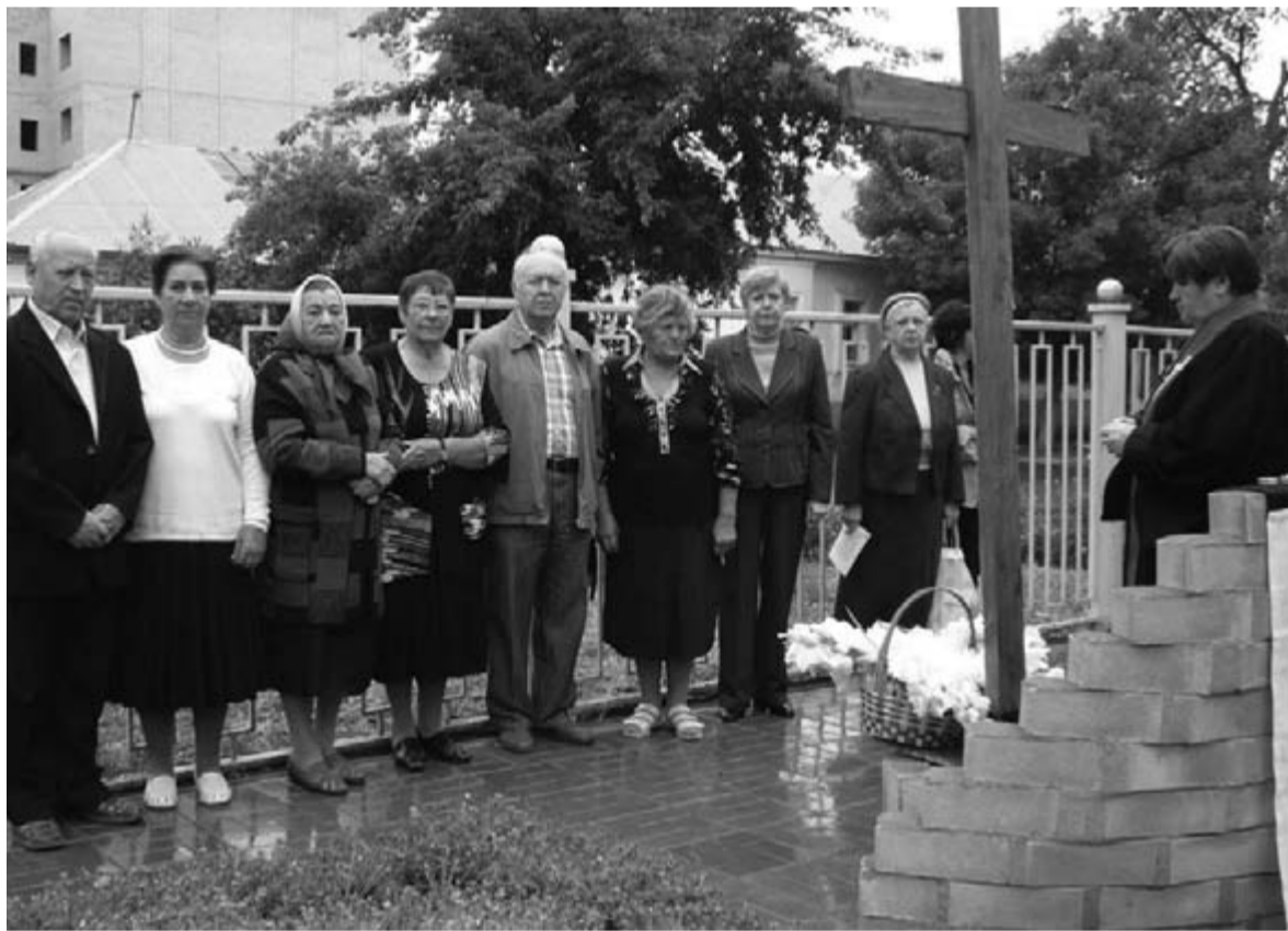
ВОЗЛОЖЕНИЕ ЦВЕТОВ У ПАМЯТНОГО ЗНАКА ВО ДВОРЕ ЦЕРКВИ

российскими немцами, которые, так же как и мы, проводили в этот день встречи, молебны, зажигали свечи памяти и возлагали венки. ■