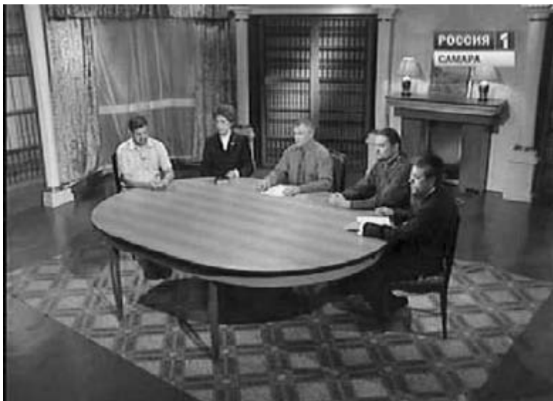
ТОК-ШОУ «ЧЕЛОВЕК И МИР» НА ГТРК «САМАРА»