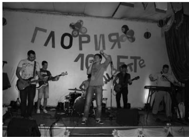
НА ФЕСТИВАЛЕ ВЫСТУПИЛ РЯД ХРИСТИАНСКИХ РОК-ГРУПП