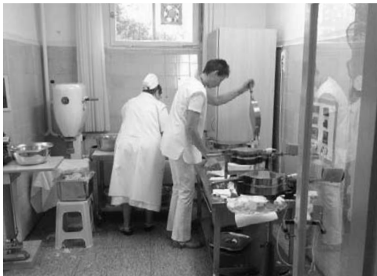
ПРОИЗВОДСТВО ОБЛАТОК В НОЙЕНДЕТТЕЛЬСАУ