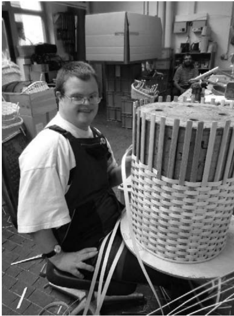
В МАСТЕРСКОЙ ДЛЯ ЛЮДЕЙ С ОГРАНИЧЕННЫМИ ВОЗМОЖНОСТЯМИ