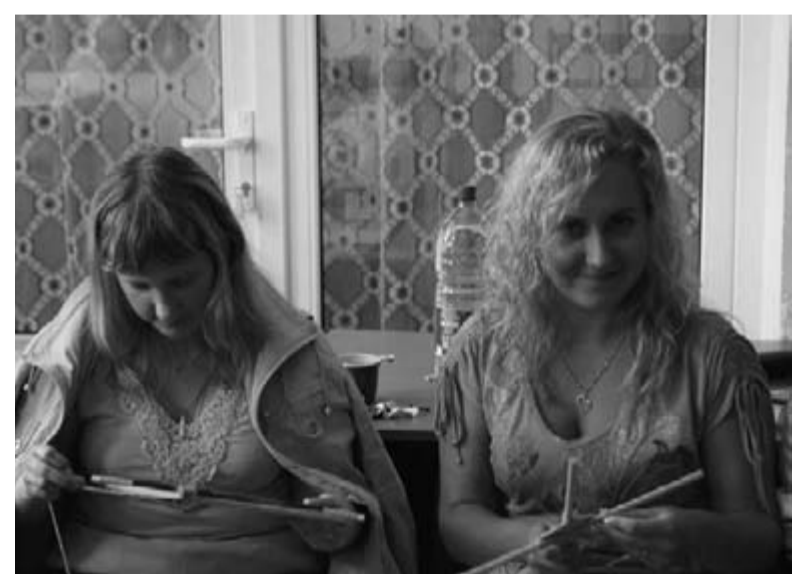
ЗАНЯТИЯ РУКОДЕЛИЕМ НА СЕМИНАРЕ

Авторы докладов указали на библейские основания диаконической работы в общинах. Ее корни можно найти уже в Ветхом Завете – десяти заповедях, дарованных Моисею. Целью заповедей было восстановление социальной справедливости. Далее