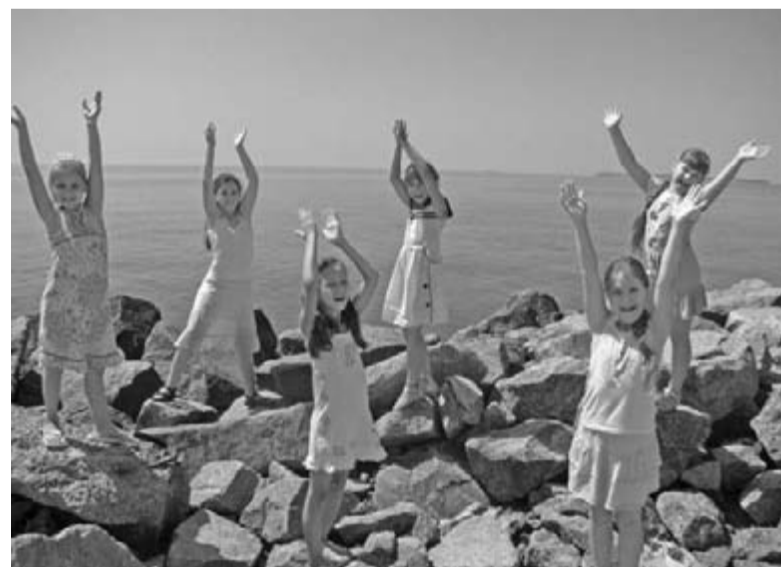
В ЛАГЕРЕ ЭТОГО ГОДА ПРИНЯЛИ УЧАСТИЕ ДЕТИ ИЗ ЧЕРНЯХОВСКА (КАЛИНИНГРАДСКАЯ ОБЛ., РОССИЯ), УФЫ (РОССИЯ), ГРОДНО (БЕЛАРУСЬ), А ТАКЖЕ ГОРОДОВ И СЕЛ УКРАИНЫ: ЛУЦКА, ХАРЬКОВА, КРЕМЕНЧУГА, ДНЕПРОПЕТРОВСКА, ЗМЕЕВКИ, ОДЕССЫ, ПЕТРОДОЛИНЫ, НОВОГРАДОВКИ

Вот такие я сделала открытия. Но, думаю, в этом чудесном и уникальном лагере есть еще много секретов. И каждый может попытаться разгадать их. Хотите попробовать? ■