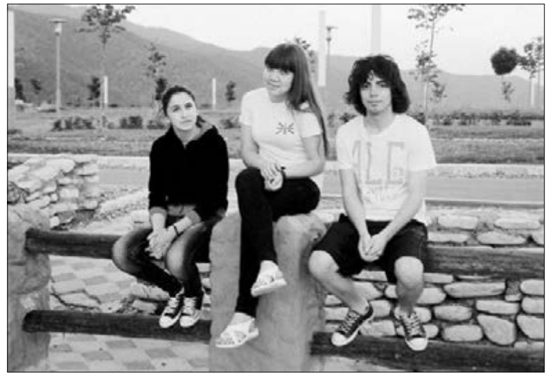
УЧАСТНИКИ СЕМИНАРА: «НАС НЕ ПОНИМАЕТ СТАРШЕЕ ПОКОЛЕНИЕ, А МЫ НЕ ВСЕГДА ПОНИМАЕМ ИХ»

И вот мы дошли до необходимой и важной темы конфликтов между старшим и младшим поколениями в Церкви. Руководители семинара