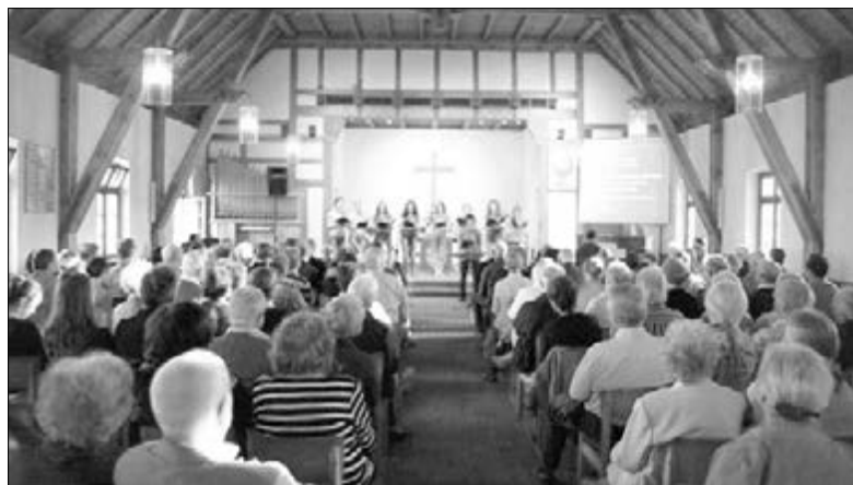
ВЫСТУПЛЕНИЕ ХОРА В ОБЩИНЕ Г. ФРИДРИХСХАФЕНА

Рассказы о Сибири, Омске, о лютеранах в России, свидетельства участников хора и, конечно же, песни не оставили равнодушным ни одного зрителя. Репертуар включал в себя христианские песнопения как на русском, так и на немецком и английском языках. Общение после каждого концерта также было полезным опытом и для участников хора, и для прихожан местных общин.