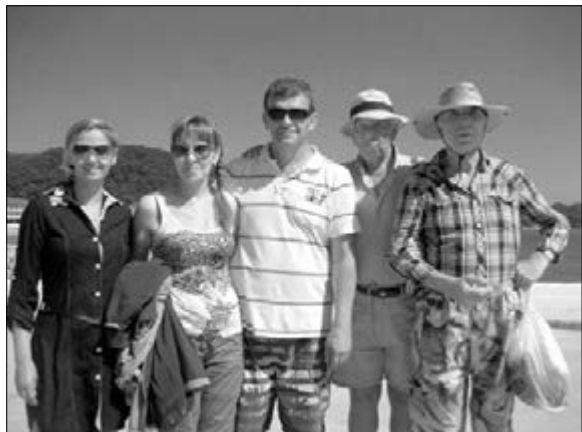
В СВОБОДНОЕ ВРЕМЯ – ЗА ЛЕТНИМ МОРСКИМ ЗАГАРОМ!