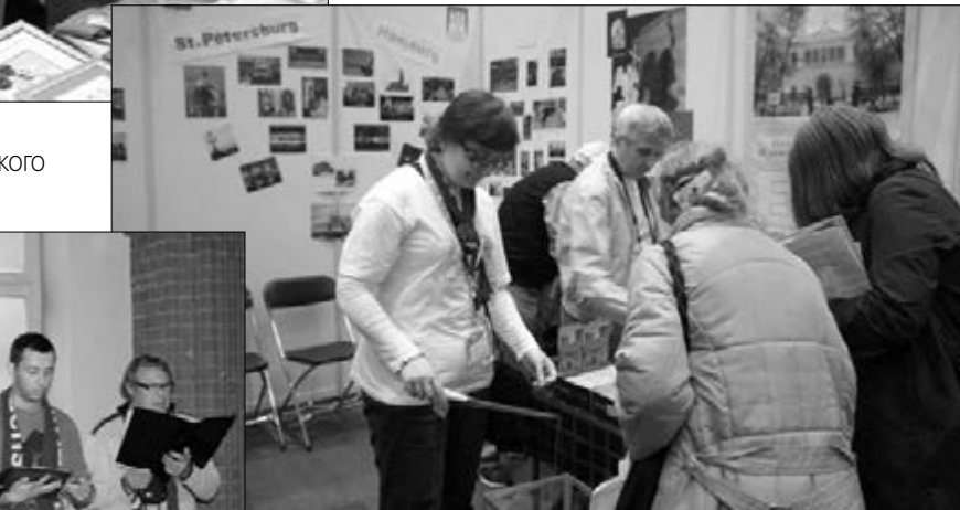
НА СТЕНДЕ ОБЩИНЫ СВ. АННЫ И СВ. ПЕТРА Г. САНКТ-ПЕТЕРБУРГА

Гамбург. 34-й Евангелический кирхентаг, прошедший с 1 по 5 мая, вновь собрал в ганзейском городе гостей из разных стран. Среди них присутствовало немало представителей Союза Евангелическо-Лютеранских Церквей (ЕЛЦ). В выставочном комплексе работали стенды общины св. Анны и св. Петра из Петербурга, Калининградского пропства, Немецкой Евангелическо-Лютеранской