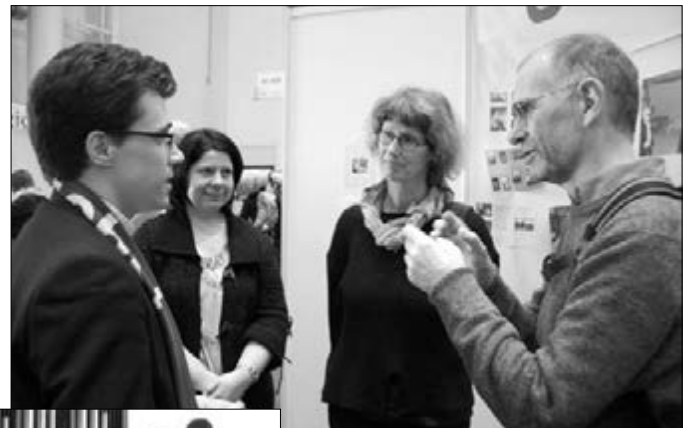
ВСТРЕЧА С ПРЕДСТАВИТЕЛЯМИ ПАРТНЕРСКИХ ЦЕРКВЕЙ НА СТЕНДЕ СОЮЗА ЕЛЦ