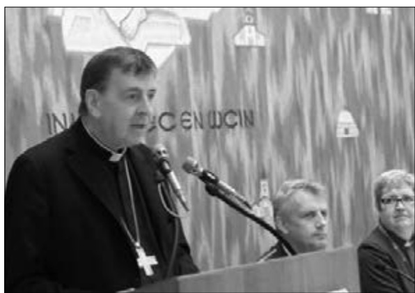
КАРДИНАЛ КУРТ КОХ ЧИТАЕТ ДОКЛАД НА ЗАСЕДАНИИ ВО ВСЕМИРНОЙ ЛЮТЕРАНСКОЙ ФЕДЕРАЦИИ

кумент может быть важным инструментом для улучшения отношений и – что еще важнее – совместного свидетельства во всех контекстах. ■