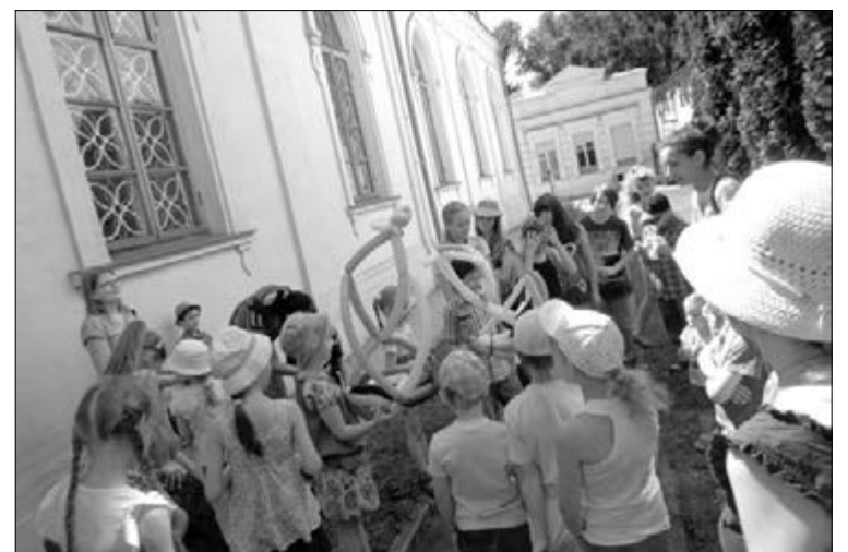
БОЛЬШЕ 20 ДЕТЕЙ МАСТЕРИЛИ СВОИМИ РУКАМИ УДИВИТЕЛЬНЫЕ ВЕЩИ ПОД НАЧАЛОМ «ФЕЙ-РУКОДЕЛЬНИЦ»

ДНЕПРОПЕТРОВСК. Что делать, если на улице – жара, дома – скучно, а хочется предпринять что-либо увлекательное? Отправиться на «Игровой марафон» в общину св. Екатерины с 10 по 16 июня! И действительно: приглашению последовали больше 20 детей! Каждый день в течение четырех часов этого марафона дети познавали магический мир творчества. После краткого слова пастора, совместной молитвы и песни мы все вместе проводили время, сопровождаемые Божьим благословением. Смешные игры и соревнования в начале дня сплотили группу, а затем дети сделали открытие: оказывается, можно создать своими руками удивительные вещи! Ной построил большой корабль? Иисус усмирил шторм Своими руками? Конечно, мы начали с малого, но под началом наших «фей-рукодельниц» появились броши из замков-молний, картины-рисунки, вылепленные из глины морские звезды, бумажные цветы, пахнущие духами и многое другое. За такими увлекательными занятиями время пролетало незаметно! После игр и шуток, а также чаепития с печеньем дети уходили, унося домой небольшие самодельные сокровища. Солнце засияло в этом году новыми, особыми красками, которые не потускнеют и осенью. ■