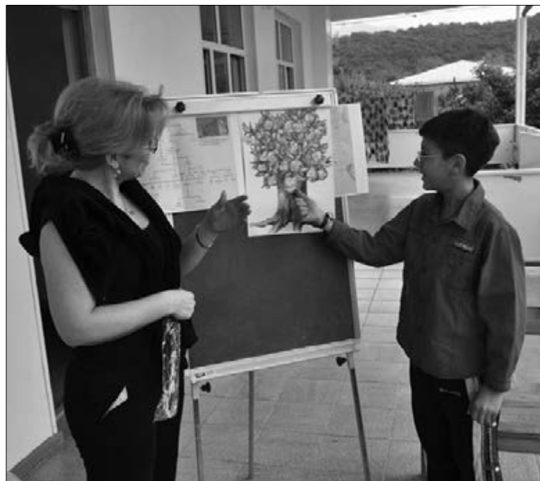
УЧАСТНИКИ ЛАГЕРЯ ПРЕДСТАВИЛИ ГЕНЕАЛОГИЧЕСКОЕ ДРЕВО СВОИХ СЕМЕЙ И РАССКАЗАЛИ О СЕМЕЙНЫХ ПРЕДАНИЯХ И ТРАДИЦИЯХ

На четвертый день пребывания в лагере наши дети были настолько сплочены, что собственными силами поставили танцы и исполняли песни собственного сочинения. К сожалению, блаженство длилось всего лишь пять дней. Надеемся, что этот опыт был положительным не только для нас, но и для организаторов лагеря. Эти несколько дней очень сдружили наши семьи, и мы будем весь год надеяться на повторение этого чуда!