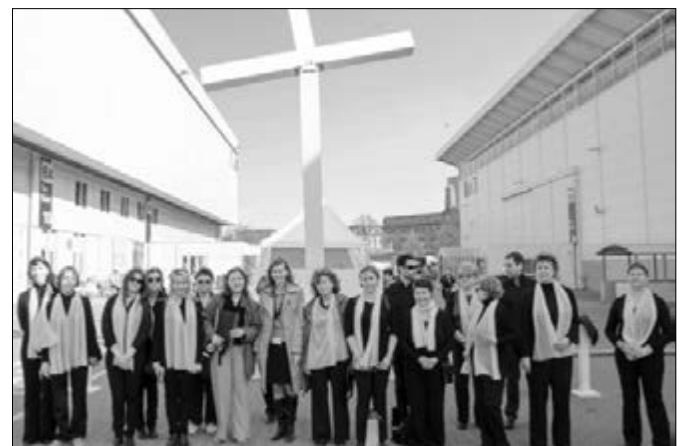
ХОР САМАРСКОЙ ОБЩИНЫ В ВЫСТАВОЧНОМ КОМПЛЕКСЕ ГАМБУРГА – ЦЕНТРАЛЬНОЙ ПЛОЩАДКЕ ПРОВЕДЕНИЯ КИРХЕНТАГА

партнеров из Штутгарта, Администрации г. о. Самара и пожертвованиям общины «Капернаум». ■