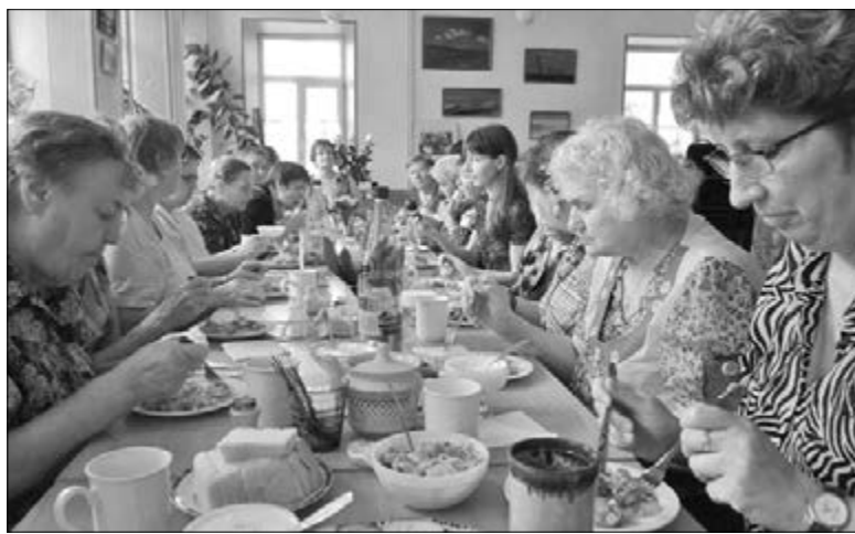
УЧАСТНИЦЫ ЖЕНСКОГО СЕМИНАРА

С возрастом особенно хорошо понимаешь, что самая большая радость – это радость общения. На отдых в Красный Яр приехали женщины пожилого и среднего возраста из общин Ульяновска, Самары, Похвистнево. Для многих из них это единственная возможность выехать за пределы родных мест, познакомиться с сестрами по вере, а главное – услышать талантливых проповедников. Они приглашают женщин к источнику жизни, о котором говорил Иисус: «Кто жаждет, иди ко Мне и пей» (Ин. 7,37). Зачерпнув живой воды в колодце библейских знаний, участницы отдыха будут использовать этот запас весь год, пока вновь не соберутся в этом благословенном месте.