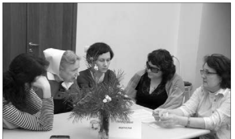
РАБОТА В ГРУППАХ НА СЕМИНАРЕ В ОМСКЕ

Это Слово обращено сегодня к нам. В нем мы слышим повеление. От Иисуса нам позволено получать силу и обретать уверенность для нашей работы на Его ниве. ■