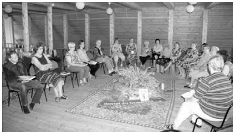
ЗАНЯТИЕ НА ЖЕНСКОМ ОТДЫХЕ В КРАСНОМ ЯРЕ

Замечательно, что для творческих, интересных и таких разных людей, но объединенных одним стремлением – познать Библию, есть возможность собираться один раз в год вместе! ■