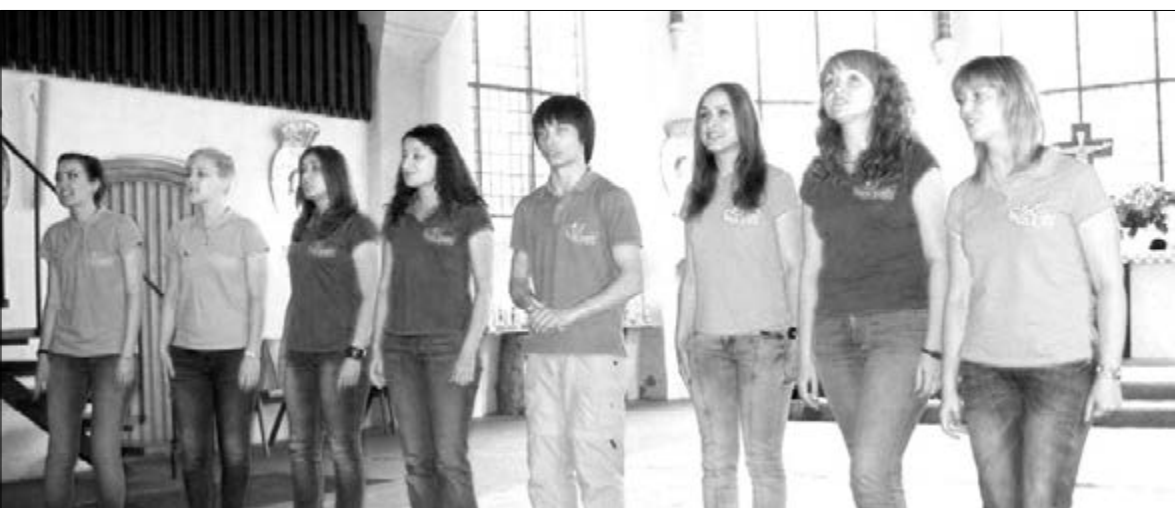
РЕПЕРТУАР ВКЛЮЧАЛ В СЕБЯ ХРИСТИАНСКИЕ ПЕСНОПЕНИЯ КАК НА РУССКОМ, ТАК И НА НЕМЕЦКОМ И АНГЛИЙСКОМ ЯЗЫКАХ...