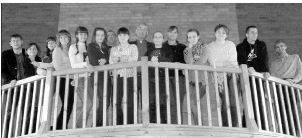
УЧАСТНИКИ СЕМИНАРА ПРИЕХАЛИ ИЗ РАЗНЫХ УГОЛКОВ ЕЛЦ УСДВ

Многодневное общение, совместное проживание в стенах Церковного Центра Христа на высоком берегу Иртыша, знакомство с новыми интересными людьми сплотили сотрудников общин ЕЛЦ УСДВ, располагающихся на территории от Урала до Ангары. Свой багаж они пополнили множеством новых игр, песен и театральных сценариев для детей, а также больше узнали о жизни в разных уголках Церкви. ■