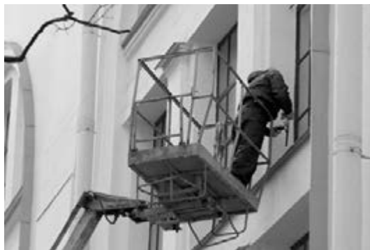
ОКНА ВО ВСЕМ ЗДАНИИ НАЧАЛИ МЫТЬ В МАРТЕ, К ПРАЗДНИКУ ПАСХИ

Ночь пролетела как один миг. За 12 часов – с 18 часов 18 мая до 6 часов утра 19 мая – 7 700 человек (примерно 11 человек в минуту) посетили «Немецкий лютеранский квартал» на Невском 22-24. Очередь начиналась от Невского проспекта! Около 80 волонтеров курировали 25 пунктов разработанного для посещения маршрута. Из фойе Петрикирхе по маршруту отправлялись экскурсии (14 гидов провели 105 экскурсий). Осмотреть удивительные уголки церкви можно было и с помощью информационных листов, заодно и ответить на вопросы веселой викторины (в ней приняли участие 400