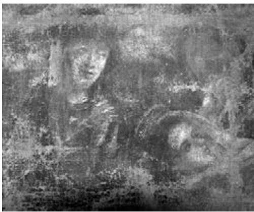
ФРАГМЕНТ АЛТАРНОЙ КАРТИНЫ, ВОЗВРАЩЕННОЙ ОБЩИНЕ БЕРДЯНСКА

Сама кирха сейчас тщательно реставрируется. Восстановлены многие архитектурные элементы, для чего используется аутентичный кирпич разобранного в селе Елизаветовке старинного пасторского дома. Под поздними слоями штукатурки и побелки обнаружены настенные росписи начала прошлого века. На будущей колокольне над входом в храм уже установлен большой бронзовый колокол, отлитый в 1959 году в Германии.