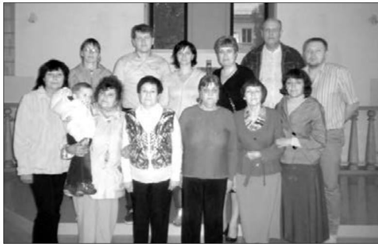
УЧАСТНИКИ СЕМИНАРА В КРАСНОТУРЬИНСКЕ

Также на семинаре участники узнали истории из жизни верующих людей с ограниченными физическими возможностями, но с удивительными возможностями их веры. Действительно, наша вера может многое! ■