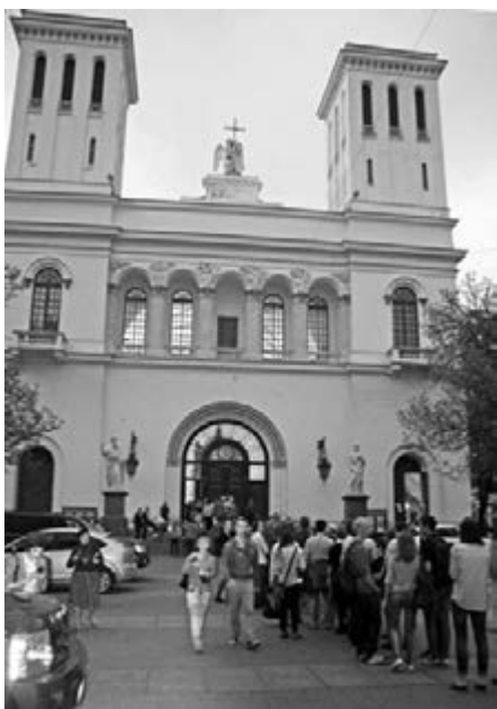
ОЧЕРЕДЬ В ЦЕРКОВЬ!