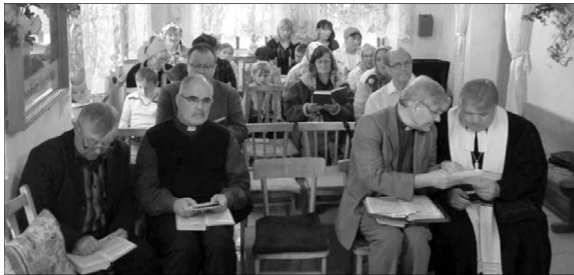
ЕПИСКОПЫ СОЮЗА ЕЛЦ НА БОГОСЛУЖЕНИИ В ОБЩИНЕ АНАНЬЕВО

Братья и сестры в Киргизии кажутся более близкими к Богу. Наверно, так говорить нельзя, потому что Бог в Иисусе Христе нам всем одинаково близок. Нам просто нужно открыть Его близость для себя! ■