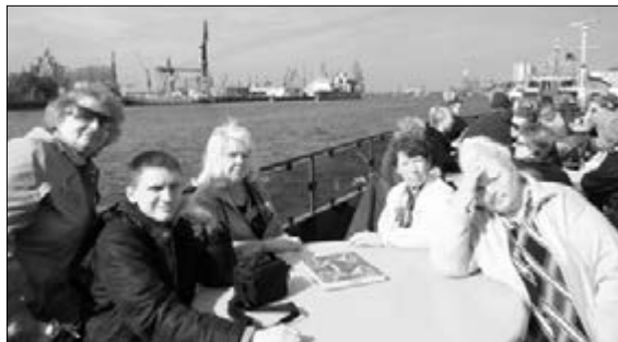
ПРЕДСТАВИТЕЛИ ОБЩИНЫ Г. ГРОДНО (БЕЛАРУСЬ) НА КИРХЕНТАГЕ