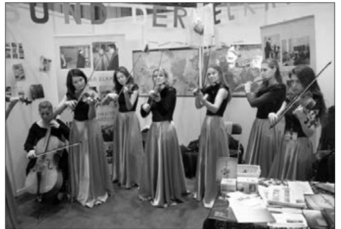
АНСАМБЛЬ «РЕНЕССАНС» ОБЩИНЫ СВ. ЕКАТЕРИНЫ Г. КАЗАНИ НА СТЕНДЕ СОЮЗА ЕЛЦ