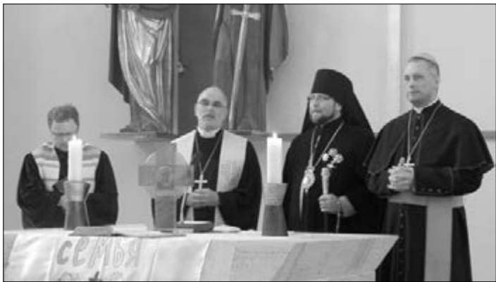
КОНФЕРЕНЦИЯ ЗАКОНЧИЛАСЬ МОЛИТВОЙ, В КОТОРОЙ ПРИНЯЛИ УЧАСТИЕ ДУХОВНЫЕ ЛИЦА ИЗ РАЗНЫХ ЦЕРКВЕЙ УКРАИНЫ

ОДЕССА. 17 мая в церкви св. Павла состоялась конференция, приуроченная к 1025-ой годовщине со дня крещения Киевской Руси. Отрадно, что большую часть гостей составили молодые люди, интересующиеся историей развития Церкви.