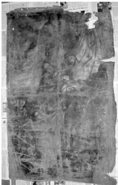
ПОЛОТНО АЛТАРНОЙ КАРТИНЫ, ВОЗВРАЩЕННОЙ ОБЩИНЕ БЕРДЯНСКА