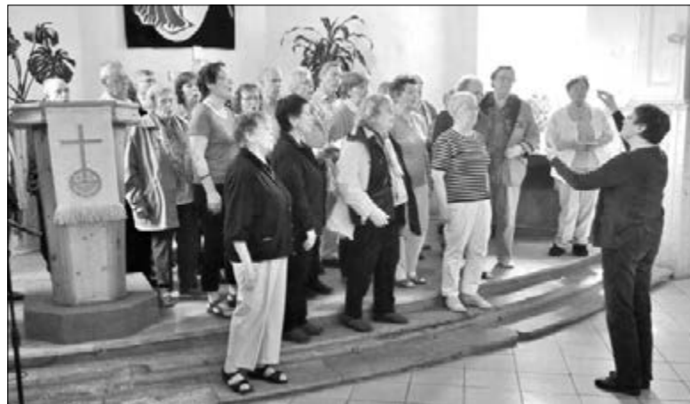
В КОНЦЕ БОГОСЛУЖЕНИЯ БРАТЬЯ И СЕСТРЫ ИЗ ГЕРМАНИИ СПОНТАННО ИСПОЛНИЛИ НЕСКОЛЬКО ХОРОВЫХ ПРОИЗВЕДЕНИЙ

Кульминацией программы, конечно же, была поездка за город. На двух огромных автобусах гости и община отправились в дом общины в Красном Яре, где уже был организован пикник с истинно русскими блюдами и... русскими народными песнями! Какое же застолье без них? Время пролетело незаметно, и нужно было возвращаться назад. Чудом было то, что на пути в город не было транспортных пробок, и путники с ветерком, любясь самарскими ландшафтами, очень скоро добрались до речного вокзала.