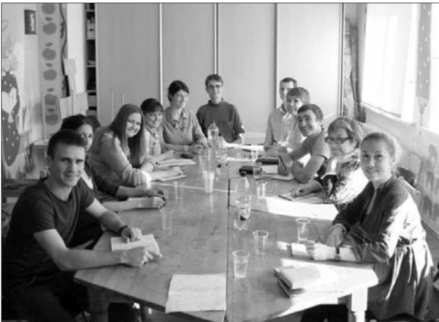
УЧАСТНИКИ КОНФЕРЕНЦИИ «ЛЮБОВЬ ОТЦА»

Планируется, что конференция «Любовь Отца» станет ежегодной. Ее организаторы призывают всех христиан объединиться в решении этой проблемы с верой в то, что однажды в нашей стране и во всем мире не будет сирот. ■