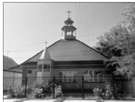
ЗДАНИЕ ЛЮТЕРАНСКОЙ ЦЕРКВИ В БИШКЕКЕ

Епископ Уланд Шпалингер (Немецкая Евангелическо-Лютеранская Церковь Украины) сделал сообщение о своем визите