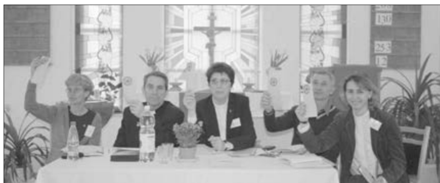
ПРЕЗИДИУМ СИНОДА ЕЛЦ ЕР

«Сила, которая созиждет Церковь». Продолжение. Начало на с. 1