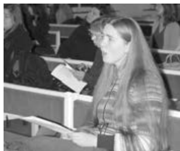
В ЭТОТ ДЕНЬ В ЦЕРКОВНОМ ЗАЛЕ ЗВУЧАЛИ ПЕСНОПЕНИЯ НЕ ТОЛЬКО НА НЕМЕЦКОМ ЯЗЫКЕ, КАК НА ОБЫЧНОМ БОГОСЛУЖЕНИИ, НО И НА РУССКОМ, ФРАНЦУЗКОМ, ИСПАНСКОМ, А ТАКЖЕ НА ЛАТЫНИ И ПОЛЬСКОМ...