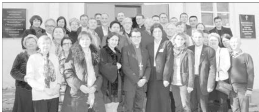
ДЕЛЕГАТЫ И ГОСТИ СИНОДА, А ТАКЖЕ ПРИХОЖАНЕ ОБЩИНЫ ОРЕНБУРГА У ВХОДА В ЦЕРКОВЬ

Уже третий год подряд Синоды ЕЛЦ ЕР проводятся не в Москве, а в других регионах – в Самаре в 2012 году, в Новороссийске и Краснодаре в 2013 году. Эта традиция полностью оправдывает себя. Проведение высшего собрания Церкви в регионах способствует упрочению авторитета лютеранской Церкви в России. Знакомство с положением наших общин помогает принимать своевременные решения для упрочения Церкви. ■