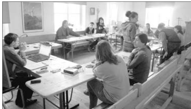
УЧАСТНИКИ СЕМИНАРА ГОРЯЧО ОБСУЖДАЮТ ТЕМЫ СЕМИНАРА

Путешествие в мир подростков мы начали с того, что выяснили для себя, почему важно служить подросткам. Есть веские причины, почему Церковь должна служить подросткам. Самое главное: мы как Церковь не должны забывать свое призвание. Посмотрите вокруг: мы живем в мире, где, по статистике, первый раз употребляют алкоголь в 13 лет, наркотик – в 14, а первый сексуальный контакт происходит в 14 лет. О жестокости, злости подростков говорит криминальная хроника. Мы обязаны понимать, что подросток – как пластилин, который по-