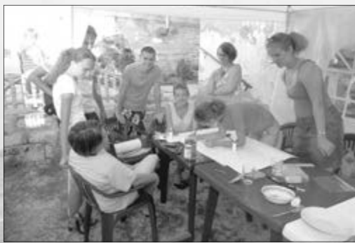
МЫ БУДЕМ ВМЕСТЕ РАБОТАТЬ НАД БИБЛЕЙСКИМИ ТЕМАМИ

- Чтобы снизить размер взноса за участие, мы будем вместе готовить пищу. Поэтому мы ожидаем от участников помощи в покупке продуктов, ее приготовлении и уборке территории палаточного городка.