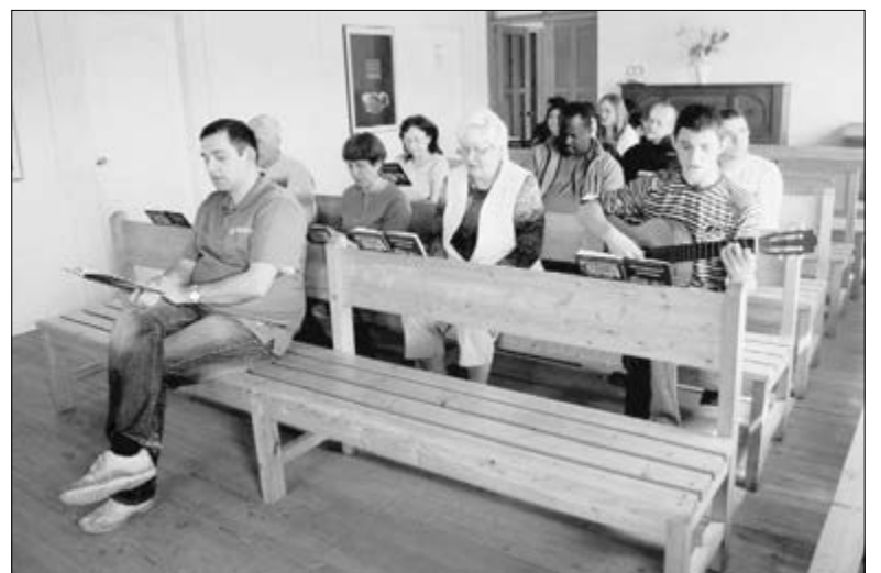
ПРИБЛИЖАТЬСЯ К ГОСПОДУ В ИСКРЕННИХ МОЛИТВАХ И ЧТЕНИИ СЛОВА БОЖЬЕГО...

Динамичные лекции, неординарные преподаватели и царящая на протяжении всего семинара атмосфера дружелюбия и христианского общения – думаю, всё это оставило яркий и теплый след в сердцах и памяти всех участников семинара. ■