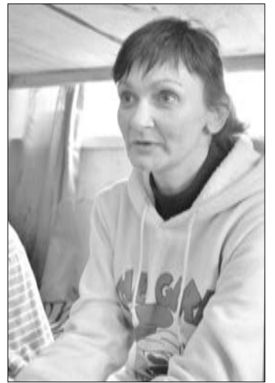
ПАЦИЕНТКА РЕАБИЛИТАЦИОННОГО ЦЕНТРА СВИДЕТЕЛЬСТВУЕТ ОБ ИСЦЕЛЕНИИ

Итак, у каждого из этих проектов есть ограничения, но есть и ресурсы. Один из главных выводов на семинаре звучит так: необходимо замечать ресурсы рядом с собой. Зачастую простые вещи могут принести не только радость, но