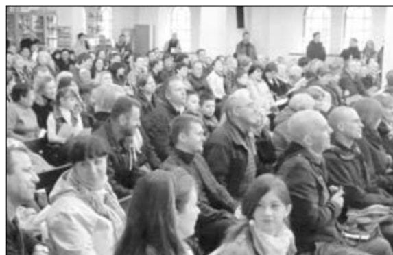
УЧАСТНИКИ АКЦИИ СОБРАЛИСЬ В ЦЕРКВИ СВ. ПАВЛА НЕМЕЦКОЙ ЕВАНГЕЛИЧЕСКО-ЛЮТЕРАНСКОЙ ЦЕРКВИ УКРАИНЫ

Первоначально акция задумывалась как молитвенный марш. Одесситы предполагали пройти через несколько христианских храмов разных конфессий, через синагогу и Арабский культурный центр, останавливаясь около них. По договоренности