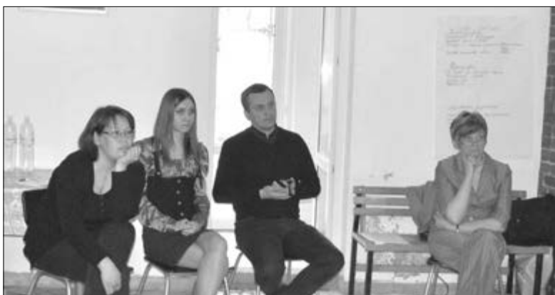
ВСЕ МЫ – УЧАСТНИКИ СЕМИНАРА – ОЧЕНЬ РАЗНЫЕ. ИМЕННО ЭТО СДЕЛАЛО НАШУ ГРУППУ ТАКОЙ ЖИЗНЕСПОСОБНОЙ, А РАБОТУ ВО ВРЕМЯ СЕМИНАРА – ПЛОДОТВОРНОЙ...