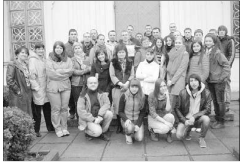
В КОНФЕРЕНЦИИ ПРИНЯЛИ УЧАСТИЕ МОЛОДЫЕ ЛЮДИ ИЗ ОБЩИН ОДЕССЫ, ПЕТРОПОЛИНЫ И НОВОГРАДОВКИ, КИЕВА, ДНЕПРОПЕТРОВСКА, ХАРЬКОВА И ЛЬВОВА