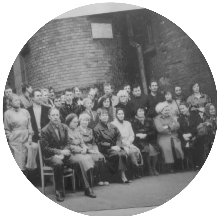
Община св. Павла в воскресенье Eхауди 31 мая 1992 года

О своем первом богослужении, состоявшемся ровно 20 лет назад, община вспоминала в воскресенье Eхауди, 20 мая этого года. За два десятилетия поменялся состав прихожан, но община не прекратила своего существования, а даже выросла. У нее есть своя история,