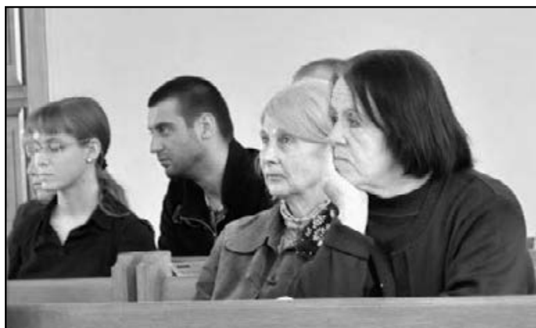
На праздничном богослужении в церкви св. Екатерины 13 мая