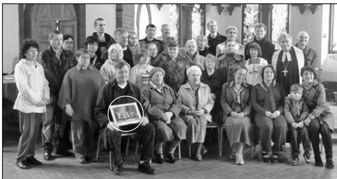
Община св. Павла в воскресенье Eхауди 20 мая 2012 года