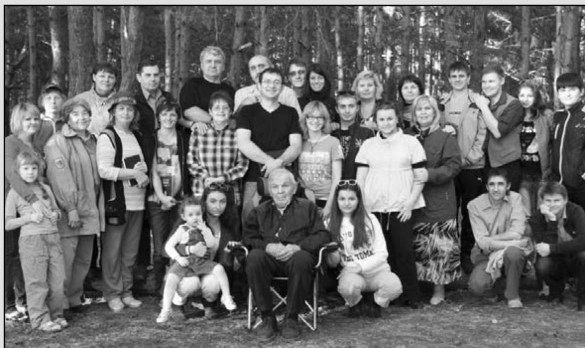
Община св. Марии г. Ульяновска на праздновании Вознесения Христова на природе