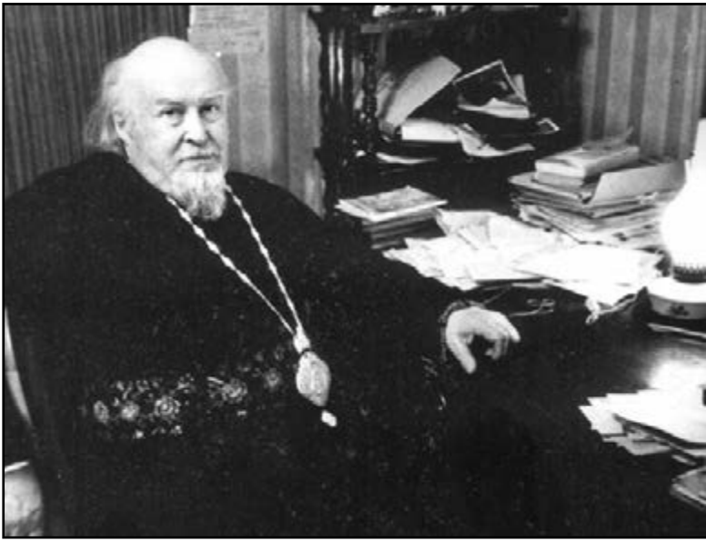
Архиепископ Михаил (Мудьюгин)