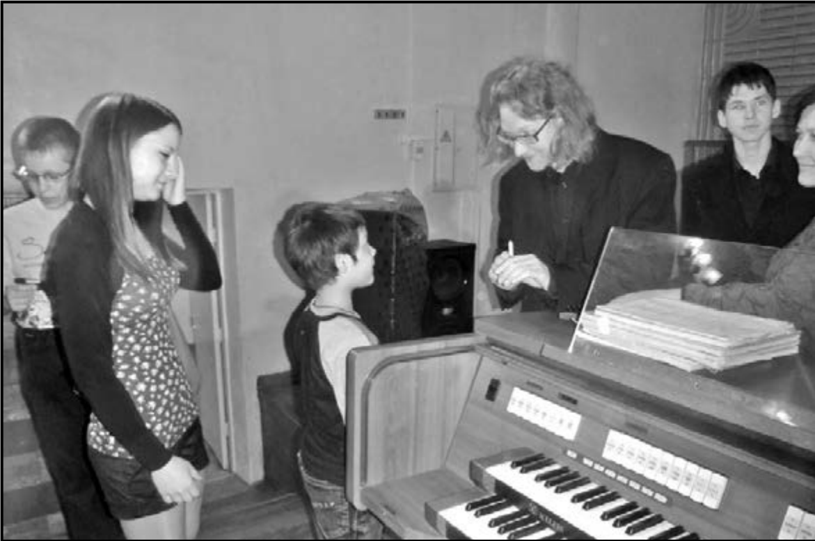
Учащиеся музыкальной школы г. Арсеньева выстроились в очередь за автографами органиста Кая-Манфреда Краакенберга