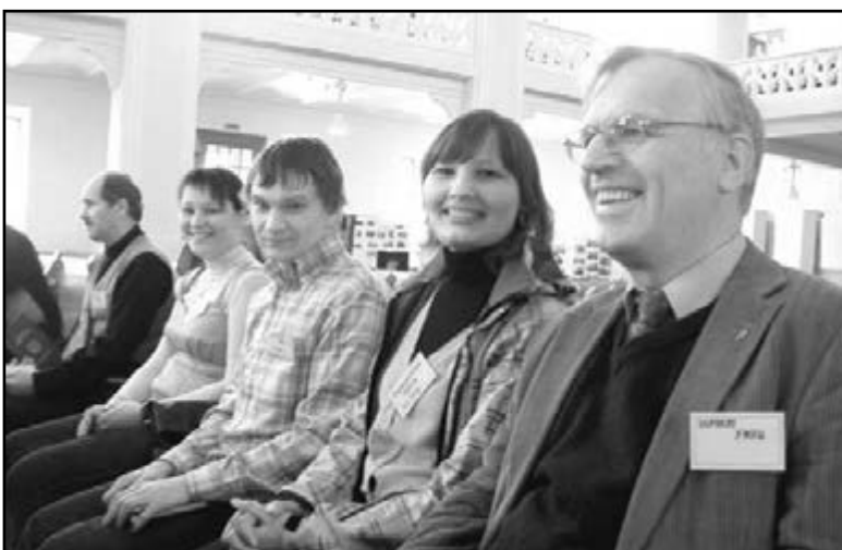
ЕПИСКОПСКИЙ ВИКАРИЙ ЕЛЦ ЕР НОРБЕРТ ХИНЦ (ПЕРВЫЙ СПРАВА) И СТУДЕНТЫ СЕМИНАРИИ НА ЦЕРКОВНОМ ДНЕ В СОБОРЕ СВ. ПЕТРА И ПАВЛА