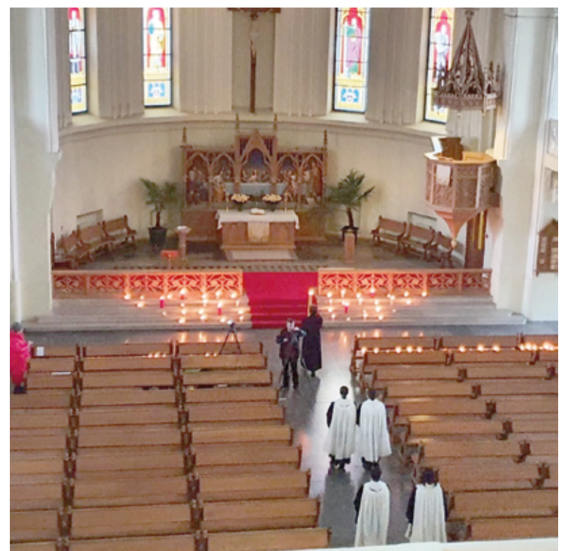
Пасхальная вигилия в кафедральном соборе свв. Петра и Павла в Москве