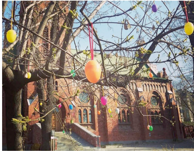
Пасха во Владивостоке. Церковь св. Павла