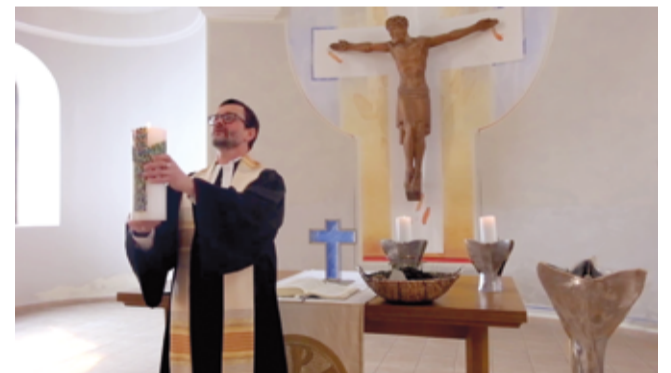
Пасхальное богослужение в церкви св. Екатерины в Киеве (Украина)