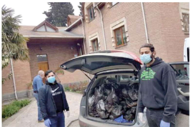
Упаковка и подготовка к доставке прихожанам церкви Примирения пасхальных пакетов с продуктами