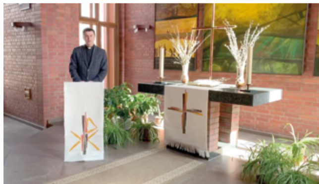
Богослужение в Чистый четверг в церкви Христа в Омске