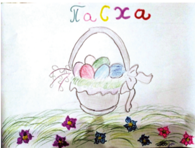
Пасхальный рисунок Лизы, ученицы воскресной школы церкви Примирения в Тбилиси