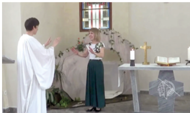
Пасхальное богослужение для детей в храме Христа Спасителя в Нур-Султан (Казахстан)