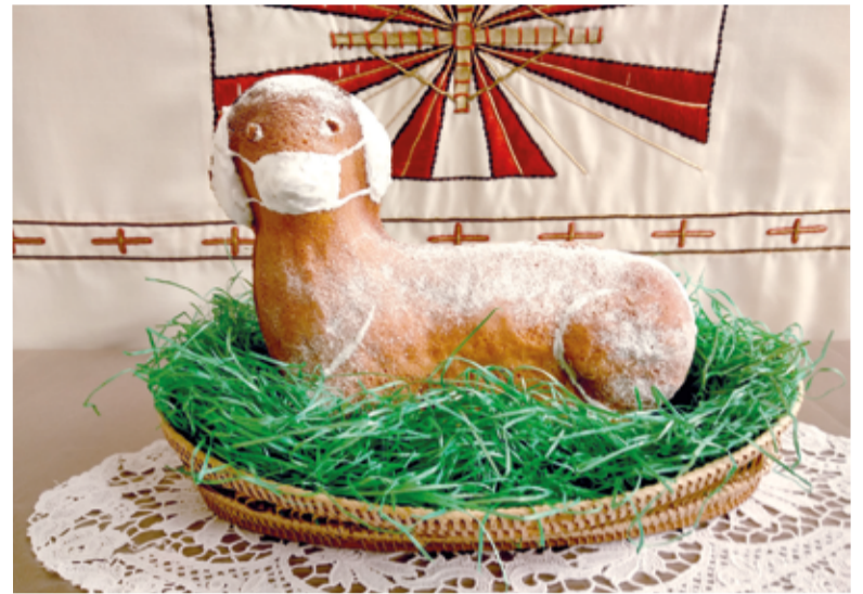
Пасхальный агнец во время карантина. Выпечка бердянской общины на Пасху-2020

Хочется заметить, что благодаря активному использова-