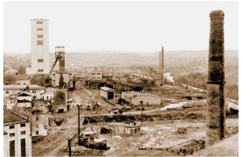
Шахта им. Ленина в г. Кизеле Пермского края