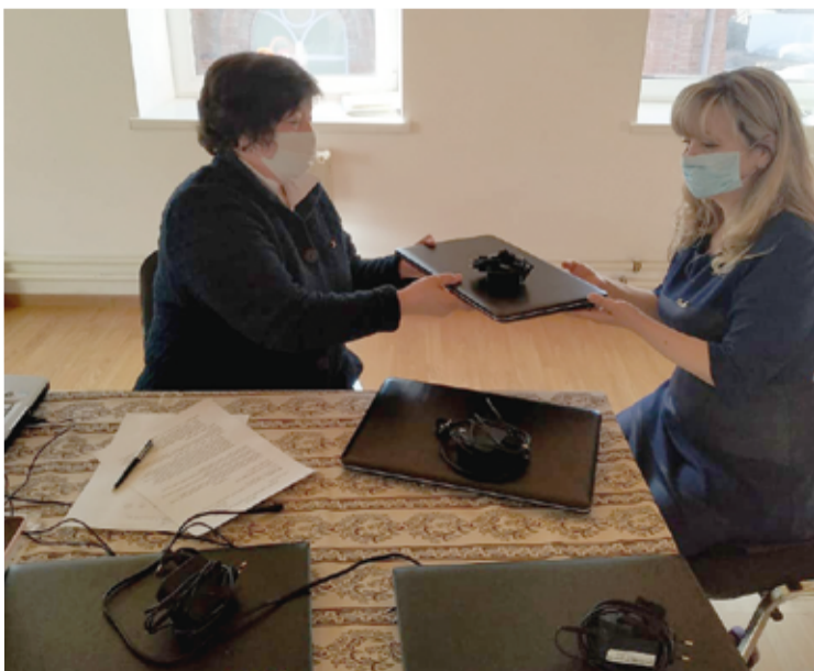
Выдача ноутбуков многодетным семьям общины

Уфимская лютеранская община выдала на время обучения многодетным семьям общины имеющиеся в церкви ноутбуки. ■