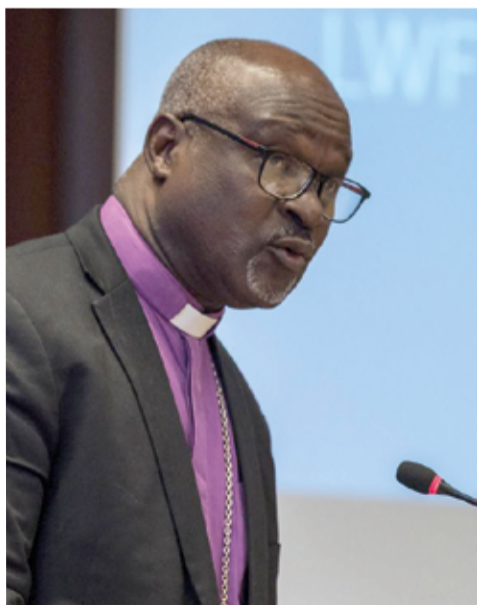
Президент ВЛФ Архиепископ д-р Панти Филибус Муса (слева) и генеральный секретарь ВЛФ пастор д-р Мартин Юнге