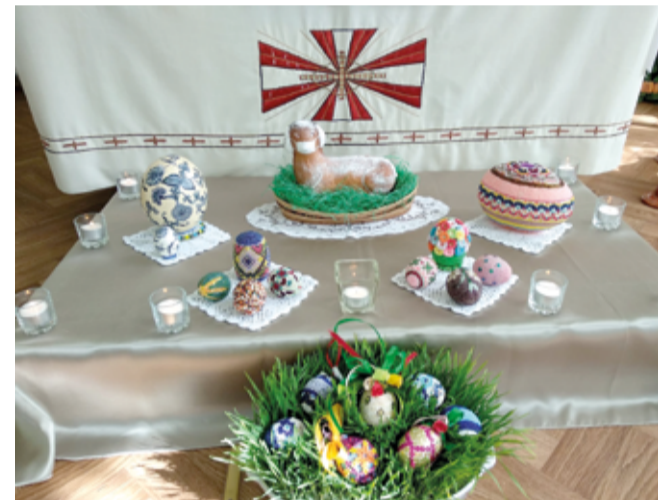
Пасхальный алтарь в общине Бердянска (Запорожская обл., Украина)