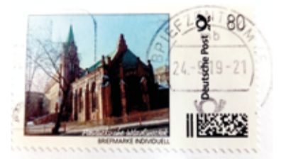
Так выглядит специальная новая почтовая марка Немецкой почты с изображением лютеранской церкви св. Павла во Владивостоке

В благодарность супружеская чета сделала особый жест: оплатила выпуск специальной почтовой марки с изображением кирхи во Владивостоке. ■