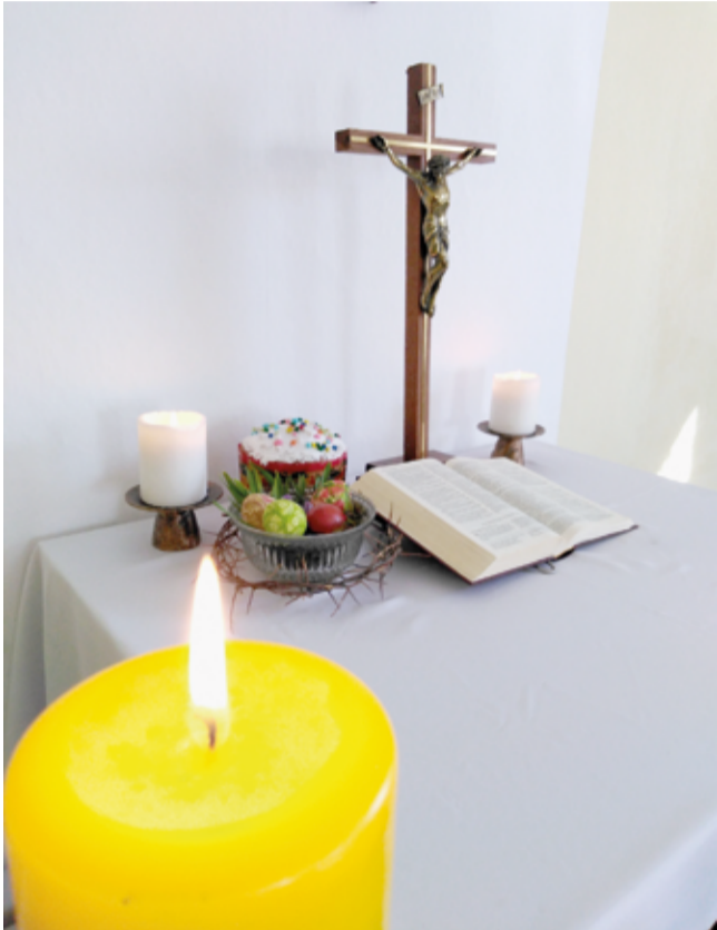
Пасхальный алтарь в общине села Пришиб (Благоварский р-н, Башкортостан)

Несмотря на то, что в этом году пасхальные богослужения в церквях прошли без прихожан и без сопутствующих им торжеств, мы решили не отказываться от традиционного пасхального коллажа в нашей газете. Он будет немного необычным: кадры онлайн-богослужений и фото украшенных алтарей в церквях с пустыми скамьями – так выглядела в этом году Пасха в общинах Союза ЕЛЦ.