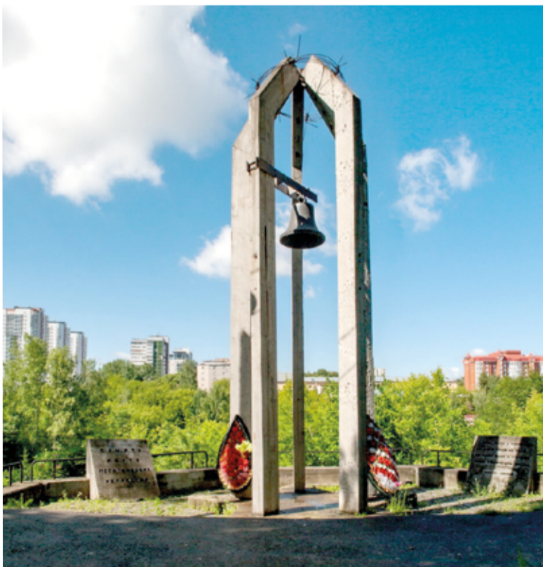
Памятник жертвам политических репрессий в Перми, у которого в свои траурные даты собираются и российские немцы