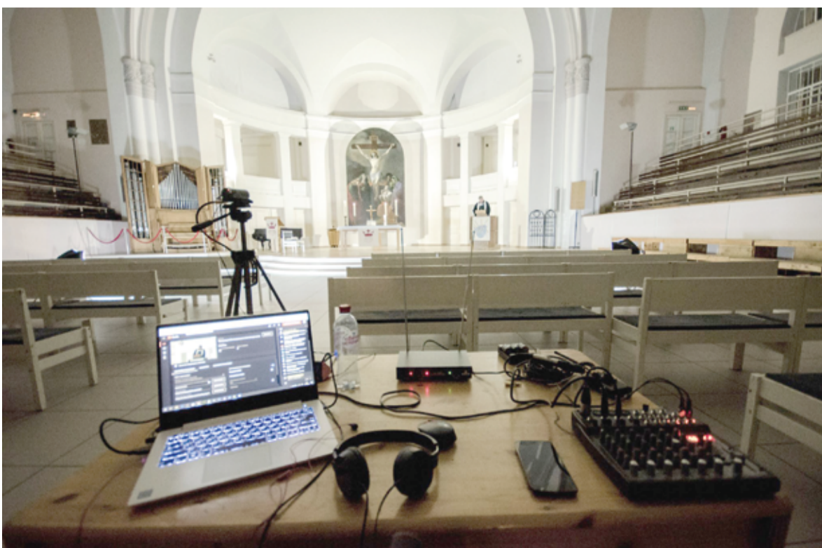
Богослужение глазами оператора – пасхальное богослужение в кафедральном соборе свв. Петра и Павла в Санкт-Петербурге