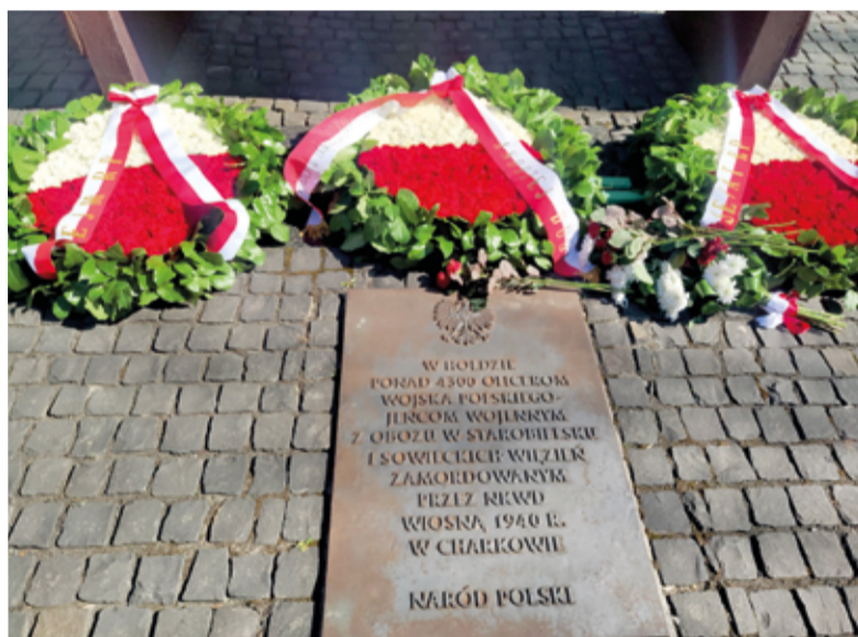
Цветы у мемориала жертвам Катынской трагедии, возложенные на памятной церемонии 13 апреля

Обращение президента Польши Анджея Дуды по случаю 80-летия Катынской трагедии зачитал генеральный консул Польши Януш Яблонский.