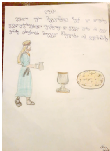
Ученики воскресной школы в качестве домашнего задания после онлайн-уроков пишут тексты, делают рисунки и поделки на заданную тему

Сейчас один из ресторанов в Тбилиси, Европейский ресторан Райнера Кауфмана, проводит акцию: тем гостям благотворительной столовой, кото-