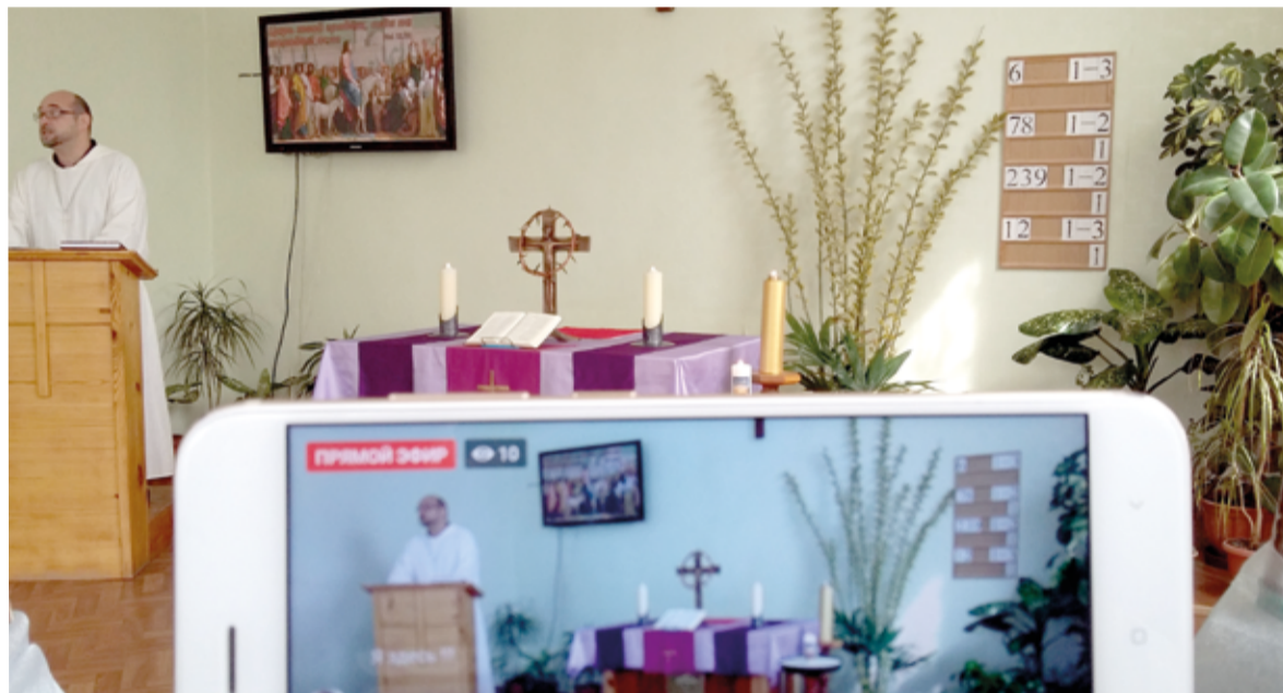
Трансляция богослужения из общины Бердянска

В трудностях и испытаниях Господь не оставляет нас, даруя силы преодолевать их, вдохновляя на поиски новых путей прославления Его имени. ■