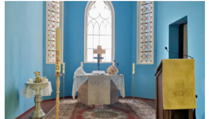
Пасхальный алтарь в церкви св. Иоанна в Гродно (Беларусь)