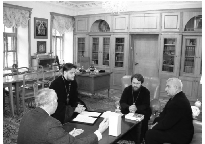
АРХИЕПИСКОП АВГУСТ КРУЗЕ НА ВСТРЕЧЕ С АРХИЕПИСКОПОМ ВОЛОКОЛАМСКИМ ИЛАРИОНОМ

Архиепископ Август Крузе рассказал о работе Генерального Синода ЕЛЦ, о некоторых его решениях и взглядах на будущее Евангелическо-лютеранской церкви. Архиепископ Иларион интересовался вопросами экуменического движения и участия в нем ЕЛЦ, а также вопросами женской ординации в нашей Церкви. Он подтвердил готовность к совместной работе в рамках