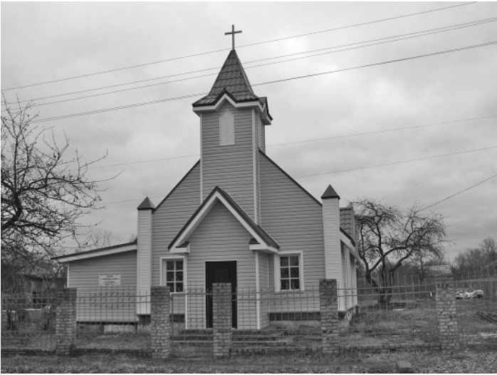
ЗДАНИЕ ЦЕРКВИ В ВЕЛИКИХ ЛУКАХ