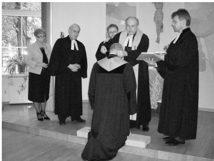
УЛАНД ШПАЛИНГЕР ПРИНИМАЕТ КРЕСТ ЕПИСКОПА НА ВВЕДЕНИИ В ДОЛЖНОСТЬ ЕПИСКОПА НЕЛЦУ

ОДЕССА. «Лицом к человеку – миссионерская Церковь через диаконию» – так звучала тема XVI Синода Немецкой евангелическо-лютеранской церкви Украины (НЕЛЦУ), состоявшегося с 19 по 21 октября в Одессе. Его участниками стали более 30 делегатов от общин НЕЛЦУ, а также пасторы Церкви и гости. Перед открытием Синода состоялось богослужение, на котором епископский визитатор Уланд Шпалингер благосло-