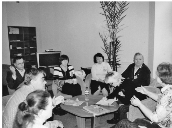
РАБОТА В ГРУППЕ