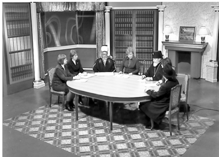
КРУГЛЫЙ СТОЛ С УЧАСТИЕМ ПРЕДСТАВИТЕЛЕЙ ПРАВОСЛАВНЫХ, МУСУЛЬМАН, ИУДЕЕВ, ЛЮТЕРАН И ОБЩЕСТВЕННОСТИ