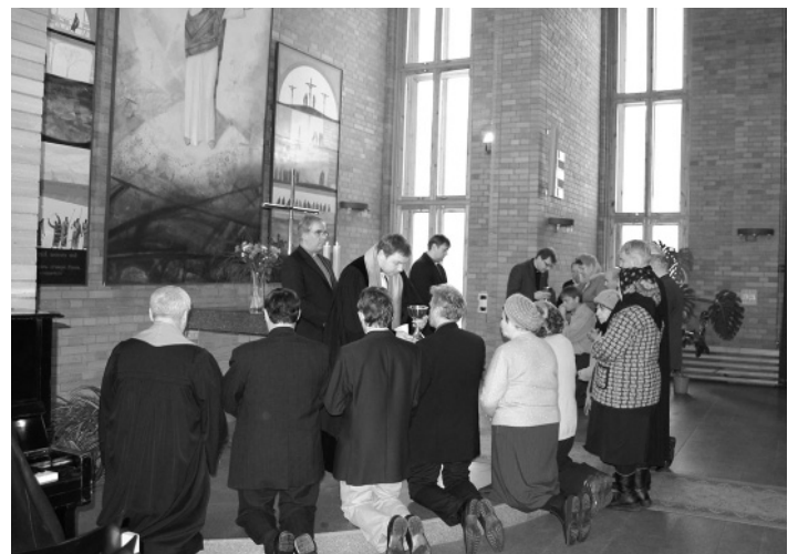
БОГОСЛУЖЕНИЕ С ПРИЧАСТИЕМ

Большой интерес и живое обсуждение вызвал доклад Архиепископа Августа Крузе о ситуации в ЕЛЦУСДВ и ЕЛЦ в целом. Среди задач, которые сегодня стоят перед Евангелическо-лютеранской церковью Урала, Сибири и Дальнего Востока, Архиепископ выделил дальнейшее духовное развитие и численный рост общин, для чего необходим переход с немецкого на русский язык на богослужениях, дальнейшую работу в направлении финансовой самостоятельности, развитие молодежной и детской работы, систематизацию образовательных мероприятий Церкви и развитие сотрудничества с партнерскими органи-