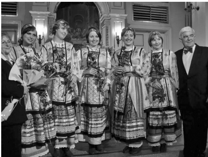
ХОР «ТЕ ДЕУМ» В КОСТЮМАХ СЛОБОЖАНЩИНЫ

Прощание было очень теплым, но польская песня «Do widzenia, do miłego sobaczenia!» уже позволила увидеть за горизонтом новую встречу.