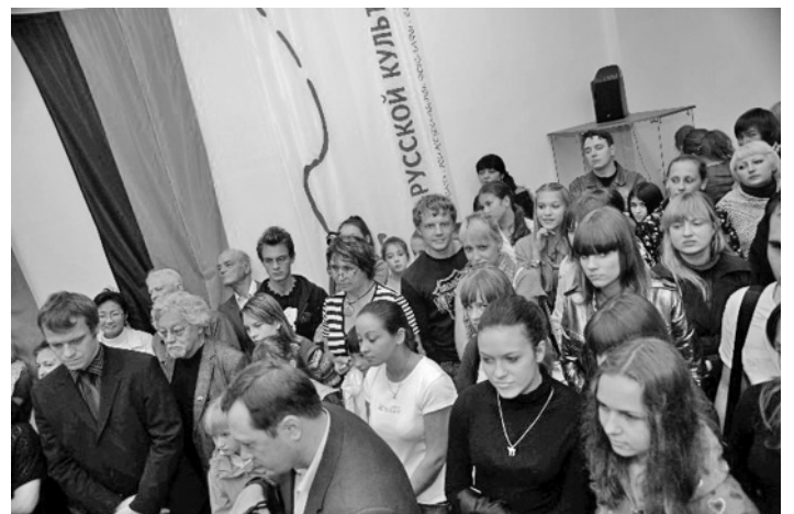
СОБЫТИЯ ФЕСТИВАЛЯ ПРОШЛИ ПРИ АНШЛАГАХ

Партнеры и спонсоры: Посольство Федеративной Республики Германия в Москве; Генеральное консульство Федеративной республики Германия, Немецкий культурный центр им. Гете, Москва и С.-Петербург; ООО КНАУФ Маркетинг Хабаровск; ЭОН-Рургаз, Эссен – Москва; ООО «Русхенк», Москва, Европейский культурный канал ARTE; Первое краевое телевидение «Губерния», Хабаровск; ГТРК «Дальневосточная», Хабаровск; Love-Radio, Хабаровск; Радио «Восток России», Хабаровск; Культурно-просветительский журнал «Словесница Искусств»; газета «Тихоокеанская звезда» и еженедельник «ТВР – Телевидение и радио», Хабаровск, внесли свой неоценимый вклад в то, что события Дней культуры были доступны для всех социальных и возрастных групп.