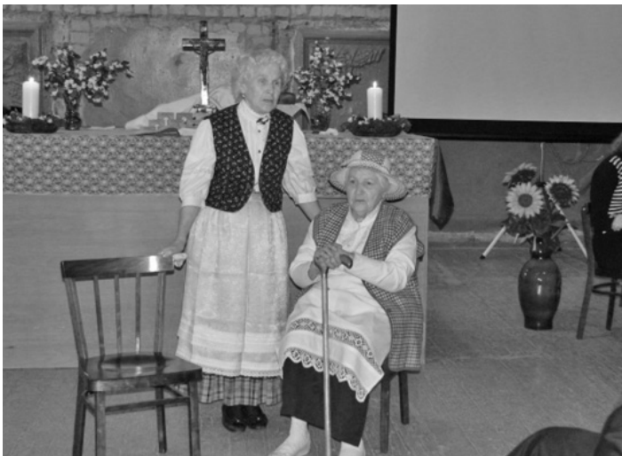
ТЕАТРАЛЬНАЯ СЦЕНКА «ЛУЧШАЯ ЖЕРТВА ГОСПОДУ – НАШЕ СЕРДЦЕ»

КАЗАНЬ. Торжественное богослужение, посвященное Празднику урожая, состоялось 18 октября в евангелическо-лютеранской церкви св. Екатерины. В этот день в казанской кирхе собрались представители лютеранских общин Казани, Набережных Челнов, Нижнекамска