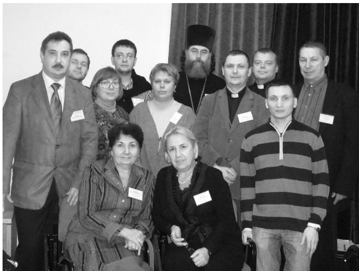
УЧАСТНИКИ КРУГЛОГО СТОЛА ПО ПРОФИЛАКТИКЕ ПРЕСТУПНОСТИ СРЕДИ МОЛОДЕЖИ