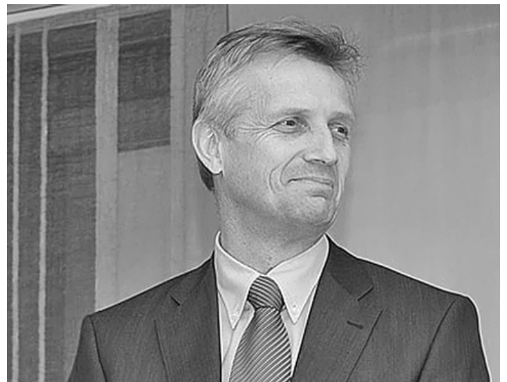
ГЕНЕРАЛЬНЫЙ СЕКРЕТАРЬ ВЛФ МАРТИН ЮНГЕ