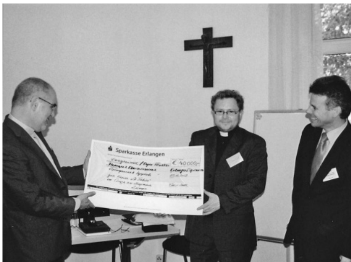
ВРУЧЕНИЕ СИМВОЛИЧЕСКОГО ЧЕКА ОТ СОЮЗА МАРТИНА ЛЮТЕРА НА РЕСТАВРАЦИЮ ЦЕРКВИ СВ. ПАВЛА

НЕЛЦУ состоит на сегодняшний день из 35 общин, расположенных на территории всей Украины, история Церкви началась с немецких переселенцев в Причерноморский регион в конце XVIII века. Центр Церкви находится в Одессе, самые большие общины находятся в Киеве, Одессе и Харькове. Сегодня прихожанами Церкви являются около 3000 человек. В общинах несут служение 15 пасторов.