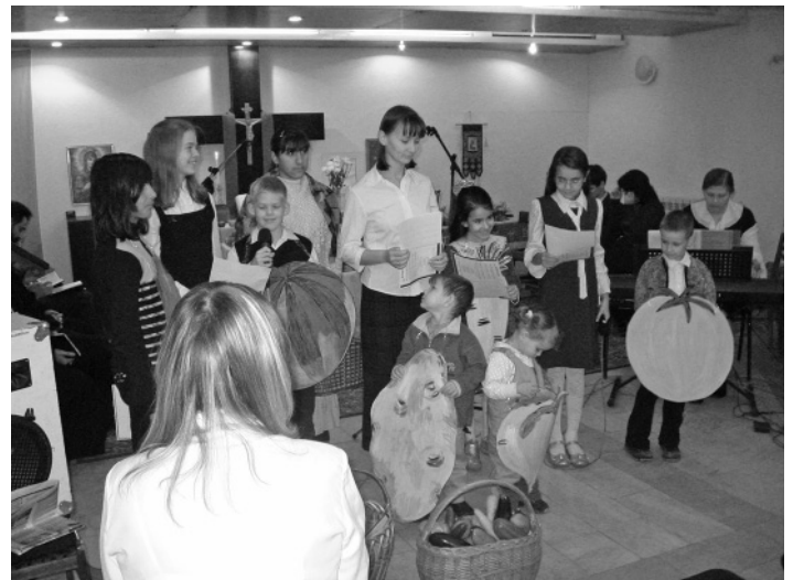
ДЕТИ ПОКАЗЫВАЮТ СЦЕНКУ О ТРУДОЛЮБИВЫХ ХОЗЯЙКАХ

Об этом же говорили и дети в своей сценке про двух трудолюбивых хозяек, вырастивших хороший урожай.