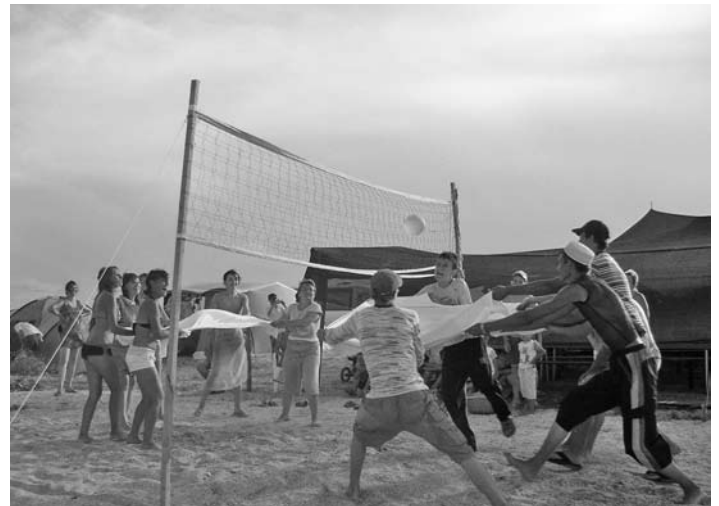
АКТИВНЫЙ ОТДЫХ УЧАСТНИКОВ ЛАГЕРЯ