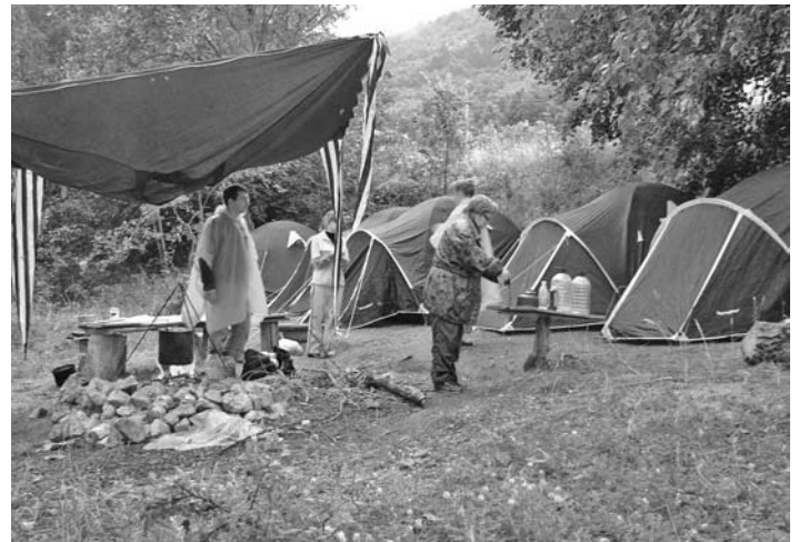
ТРОЕ СУТОК ДОЖДА НЕ ПОМЕШАЛИ КОСТРУ ГОРЕТЬ