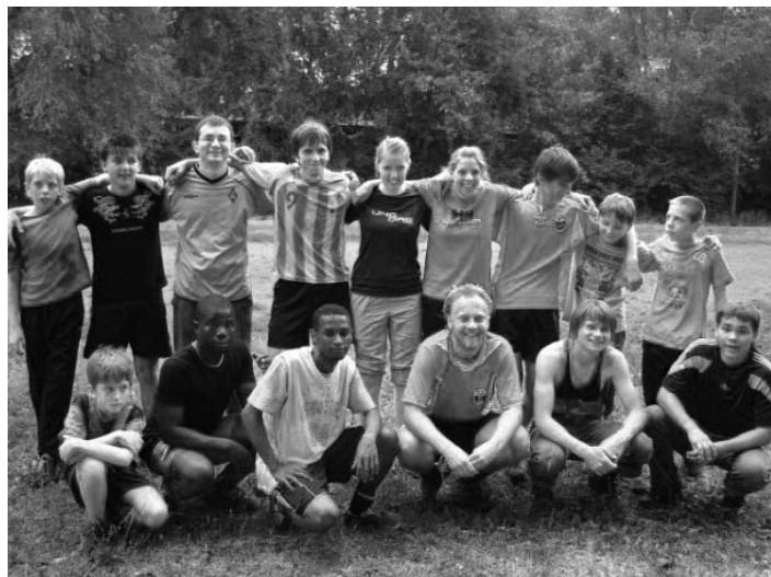
ЛАГЕРЬ ОТКРЫЛ МЕЖДУНАРОДНЫЙ ФУТБОЛЬНЫЙ МАТЧ...

блейских занятиях, которые проходили в Доме общины, мы говорили о сотворении мира, грехопадении и жертве Иисуса Христа за наши грехи. После каждого урока в малых группах мы с детьми обсуждали, как они могут применить в жизни то, что узнали в этот день. Реакция детей на Евангелие не была одинаковой: кто-то впервые услышал о Боге, кто-то себя считал слишком юным, чтобы задаваться такими вопросами, но все дети знали Благою Весть наизусть. Теперь выбор за ними. Меня тронуло то, что в нашей общине многие молодые люди откликнулись на предложение пригласить к себе гостей на обед или ужин, чтобы оказать им гостеприимство и ближе познакомиться с ними. Думаю, мы можем повторить слова апостола Павла: «Страннолюбия не забывайте, ибо через него некоторые, не оказали гостеприимство Ангелам» (Евр 13:2).