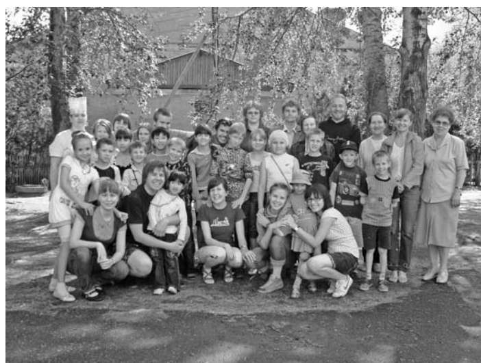
СЕГЕЖСКИЕ РЕБЯТА В ЛАГЕРЕ