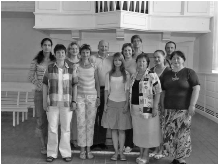
УЧАСТНИКИ СЕМИНАРА СЪЕХАЛИСЬ ИЗ АСТРАХАНИ, КАЗАНИ, НОВОСИБИРСКА, САМАРЫ, САНКТ-ПЕТЕРБУРГА И ВОЛГОГРАДА...

Отдельную благодарность за финансовую поддержку хочется выразить Объединению евангелических церковных музыкантов и Объединению евангелических церковных хоров в Германии.