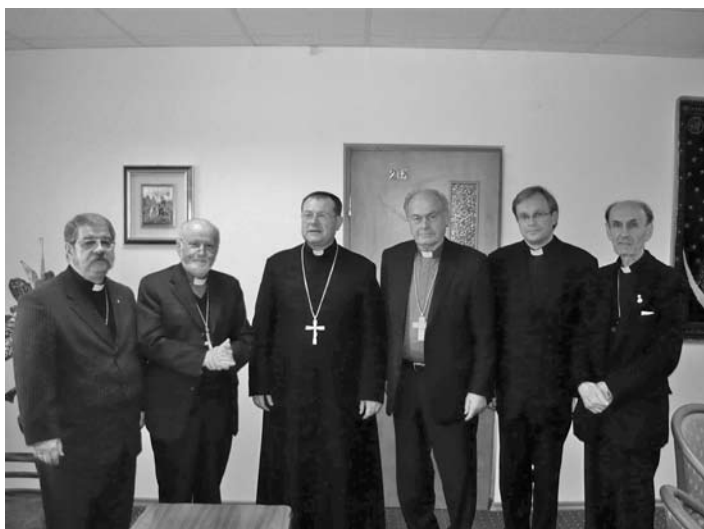
ГЛАВЫ И СОТРУДНИКИ ДВУХ ЦЕРКВЕЙ

СООБЩЕНИЕ ЦЕНТРАЛЬНОГО ЦЕРКОВНОГО УПРАВЛЕНИЯ ЕЛЦ