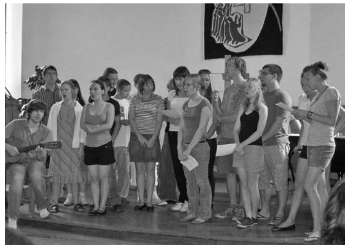
ЛАГЕРЬ БЫЛ ПОСВЯЩЕН ПОДГОТОВКЕ ПЕСЕННИКА

Мы благодарим организаторов и всех участников этой встречи и надеемся на дальнейшее сотрудничество.