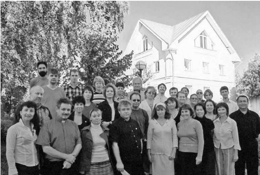
СОТРУДНИКИ ЦЕНТРАЛЬНОГО ЦЕРКОВНОГО УПРАВЛЕНИЯ И КНИЖНОГО СЛУЖЕНИЯ «СЛОВО» В ГОСТЯХ У СТУДЕНТОВ ЗАОЧНОГО КУРСА ТЕОЛОГИЧЕСКОЙ СЕМИНАРИИ В НОВОСАРАТОВКЕ 25 АВГУСТА