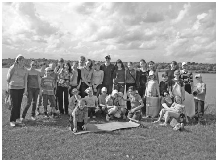
УЧАСТНИКИ ДЕТСКОГО ЛАГЕРЯ

ОМСК. На базе отдыха «Адмирал Макаров» в деревне Красноярка со 2 по 7 августа проходил детский лагерь ев.-лют. общины. В лагере участвовало 24 ребенка от 7 до 12 лет, и 8 наставников. Дети были разделены на три группы по возрастным категориям. Темой всего лагеря была «Ответственность». На библейских занятиях с детьми мы говорили о том, что несем ответственность за свои слова и поступки, о нашей ответственности перед родителями, друзьями, и, конечно же, перед Богом. Помимо библейских часов в программу лагеря входили молитвы, игры, спортивные и интеллектуальные мероприятия, рукоделие. В завершение лагеря был устроен прощальный костер, с песнями под гитару и с барбекю. Перед отъездом все дети получили в подарок детское Евангелие в комиксах, которое написано очень понятным для детей языком.