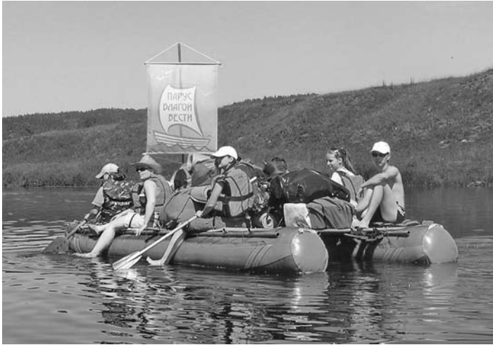
НА ФЛАГМАНСКОМ СУДНЕ ВСЕГДА БЫЛ ПОДНЯТ ГОЛУБОЙ ПАРУС С НАДПИСЬЮ «ПАРУС БЛАГОЙ ВЕСТИ»...

ПЕРМЬ. Лето 2009 года надолго запомнится молодежной группе Пермского пробства. Христианский лагерь для молодежи было решено провести на сплаве. Среди многих рек Урала река Сылва – одна из красивейших. Было решено сплавляться по Сылве на катамаранах, делая остановки на ночь на берегу. Опытные члены общины заранее прошли по маршруту, чтобы познакомиться с «характером» реки и осмотреть места для стоянок. Для сопровождения лагеря была приглашена группа квалифицированных молодых людей во