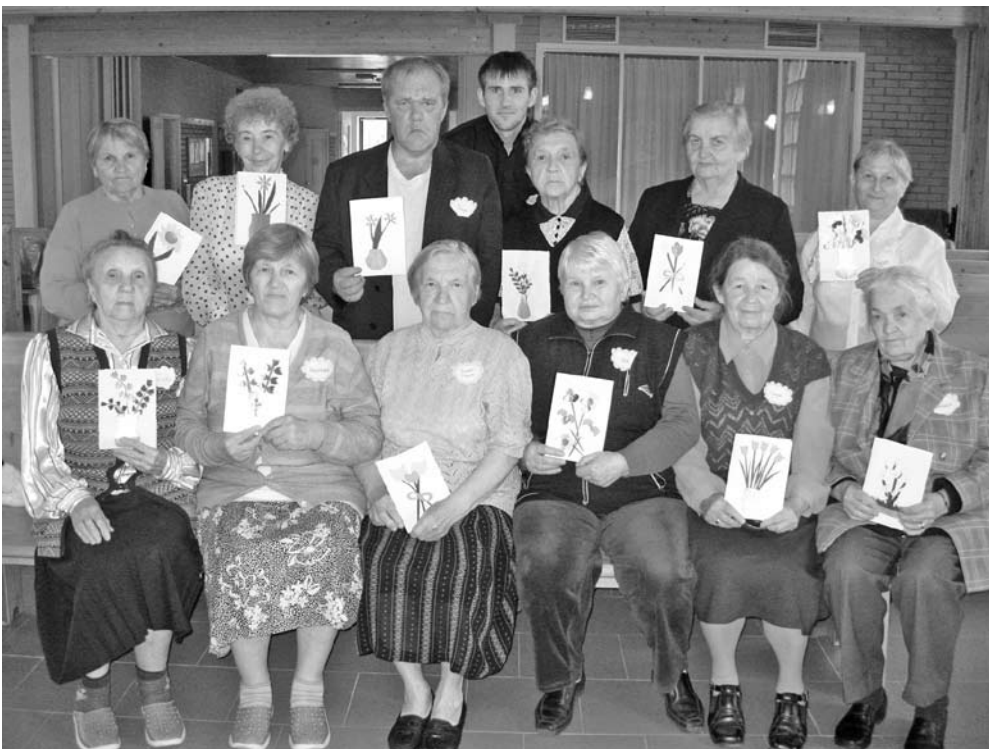
ДИАКОНИЧЕСКИЙ ЛАГЕРЬ ДЛЯ ПОЖИЛЫХ ПРИХОЖАН В КОНДОПОГЕ 10-12 ИЮЛЯ