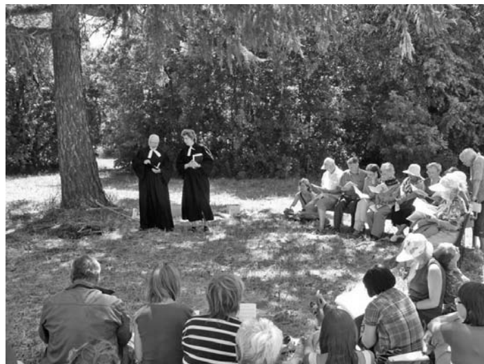
БОГОСЛУЖЕНИЕ С ПРИЧАСТИЕМ ПОД ОТКРЫТЫМ НЕБОМ

дился, вкусным обедом и холодным молоком со свежеспеченным хлебом.