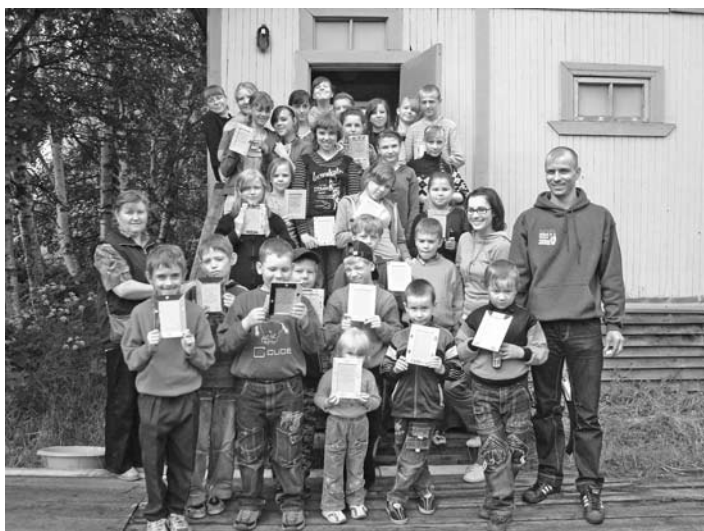
С ДЕТЬМИ В КЕМИ