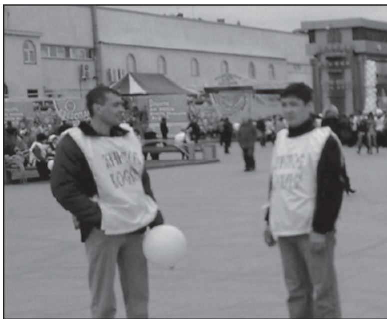
У ВХОДА В ЦЕНТРАЛЬНЫЙ ПАРК

плоды. И Слово Божье будет преобразовать наш город через сердца людей во славу Господа нашего Иисуса Христа! ■