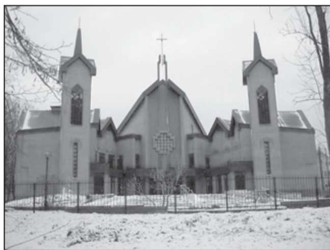
ЦЕРКОВЬ ВОСКРЕСЕНИЯ В КАЛИНИНГРАДЕ