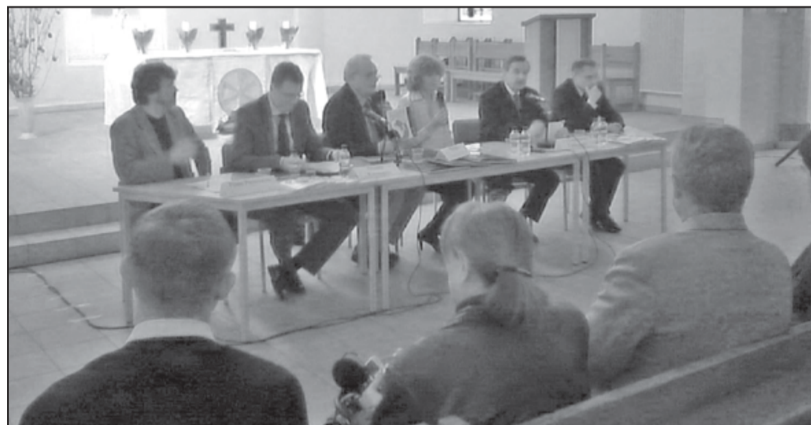
ГОСТИ И ОРГАНИЗАТОРЫ НА ОТКРЫТИИ ВЫСТАВКИ В ЦЕРКВИ СВ. ЕКАТЕРИНЫ

ЭКСПОНАТЫ ИНТЕРАКТИВНОЙ ВЫСТАВКИ ПОЗВОЛЯЮТ САМОСТОЯТЕЛЬНО ИЗУЧАТЬ ИНФОРМАЦИЮ О ЧЕРНОБЫЛЬСКОЙ КАТАСТРОФЕ И СОЛИДАРНОСТИ ЛЮДЕЙ, ПЕРЕХОДЯЩЕЙ ГРАНИЦЫ