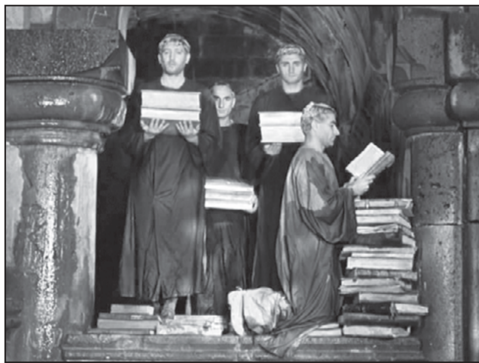
Кадр из фильма СЕРГЕЯ ПАРАДЖАНОВА «ЦВЕТ ГРАНАТА»