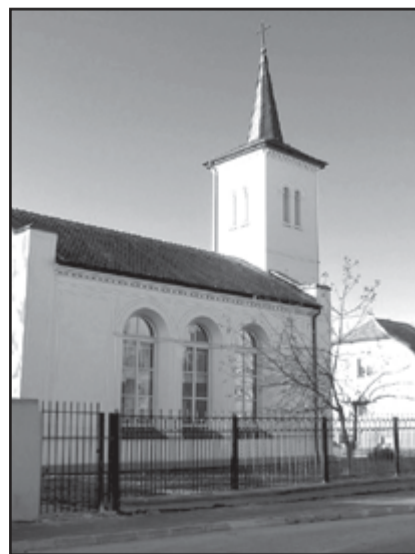
ЗАЛЬЦБУРГСКАЯ ЦЕРКОВЬ В ГУСЕВЕ

ворили о христианской идентичности, значении молодежи в Церкви, различных формах молодежного служения, театральном служении. Завершилось мероприятие христианской вечеринкой. Нас необычайно порадовала молодежная группа церкви Воскресения г. Калининграда. Эти знающие Бога ребята с хорошим лидером во главе могут принести своей Церкви много благословений. ■