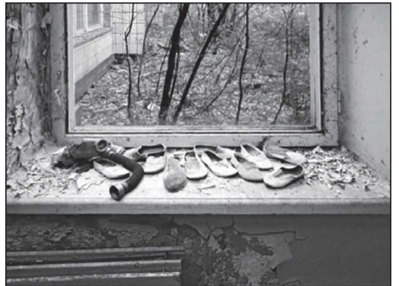
Один из фотоматериалов выставки «Чернобыль: Люди. Места. Солидарность. Будущее».

На открытии выставки состоялась презентация книги «25 лет после Чернобыля – европейская солидарность и культура памяти», в которой впервые предпринята попытка изложить системно историю, деятельность и общие условия европейского благотворительного движения Чернобыля. Книга, изданная Дортмундским международным образовательным