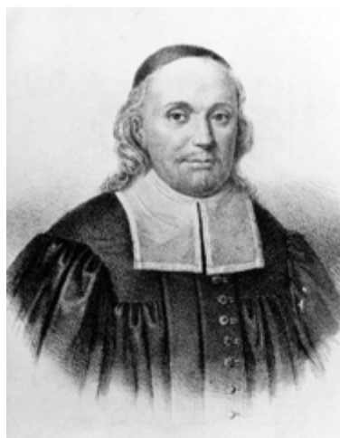
ПАУЛЬ ГЕРХАРДТ (1607-1607)

и утешение вне человеческих слов, но в Слове Божьем. Получив прекрасное гуманитарное образование, он начал изучать теологию в немецком Витгенберге. Европа XVII века страдала тогда не только от войны, но и от постоянных эпидемий чумы. Поэтому можно легко представить себе общее настроение, царившее в обществе современников Герхардта. На этом безрадостном фоне, его жизнеутверждающие, полные надежды и упования, песнопения были подобны охлаждающим каплям дождя, падающим на почти омертвевшую почву пустыни. Лирика Пауля Герхардта удивительным образом насквозь пронизана личным глубоким религиозным чувством. «Пока мой Бог со мною» – даже русский перевод прекрасно передает это ощущение