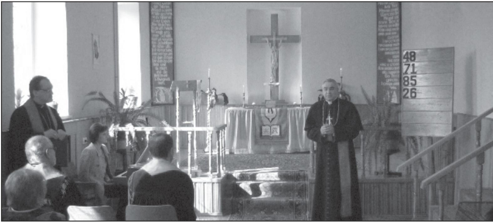
Празднование 20-летия общины г. Луцка

Евангелическо-лютеранская церковь (ЕЛЦ) – www.elkras.ru