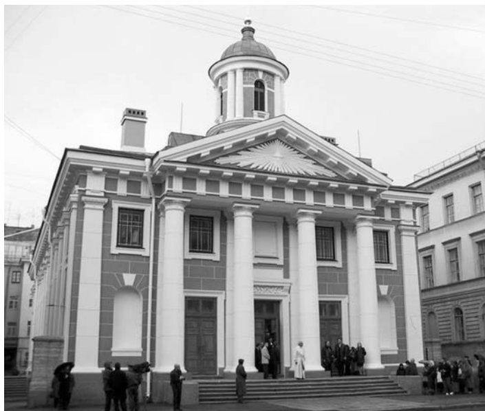
КАФЕДРАЛЬНЫЙ СОБОР СВ. МАРИИ