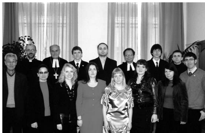
ВЫПУСКНИКИ СЕМИНАРИИ С ПРЕПОДАВАТЕЛЯМИ И АРХИЕПИСКОПОМ ЕЛЦ

НОВОСАРАТОВКА. Самым большим выпуском в одиннадцатилетней истории Теологической семинарии ЕЛЦ стал выпуск 2009 года. Одиннадцать еще вчерашних студентов-практикантов – десять очников и одна студентка-заочница – получили 20 февраля долгожданный диплом бакалавра теологии. Остались позади год практики в общинах и, затем, последнее испытание – коллоквиум, который все выпускники выдержали успешно.