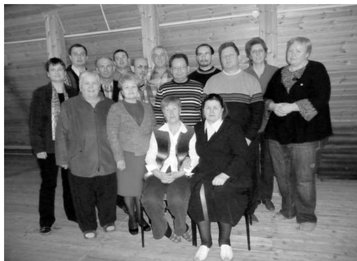
УЧАСТНИКИ ПАСТОРСКОГО КОНВЕНТА

КРАСНЫЙ ЯР. Пасторский конвент состоялся с 25 по 28 февраля при поддержке Немецкого национального комитета ВЛФ в Красном Яре под Самарой. Его участниками стали пасторы и проповедники из Волгоградского, Саратовского, Ульяновско-Самарского пробства, а также из Оренбурга.