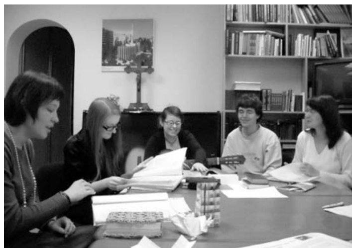
«НЕДЕТСКИЕ УРОКИ» для сотрудников общин

Дополнительно на семинаре мы кратко ознакомились с методом «Теология в картинках», который позволяет просто и ясно объяснить детям сложные вопросы веры. Участники семинара прекрасно иллюстрировали заданные библейские отрывки с помощью различных методов. Посещение любой новой общины всегда уникально, в этот раз меня особенно порадовали несколько моментов: Во-первых, этот семинар не потребовал никаких материальных затрат организаторов. Особенно актуален этот вопрос сейчас, в период кризиса, а также когда наши общины учатся существовать независимо материально от партнеров из-за границы. Проживание обеспечили прихожане саратовской общины,