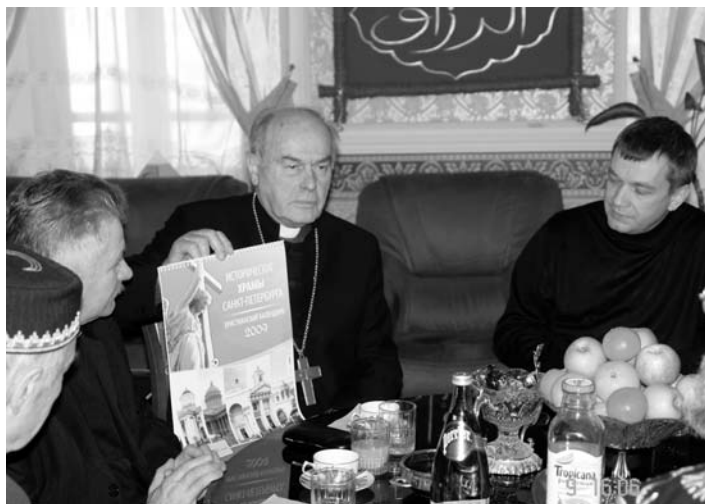
АРХИЕПИСКОП ЗНАКОМИТ УЧАСТНИКОВ ВСТРЕЧИ С МЕЖКОНФЕССИОНАЛЬНЫМ ИЗДАНИЕМ