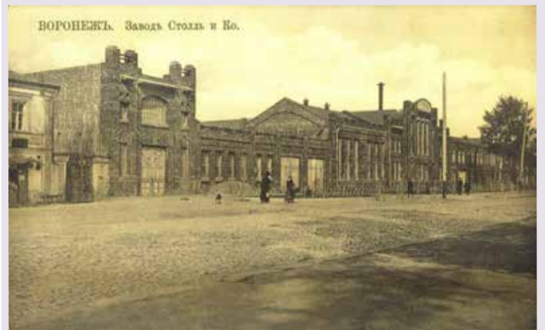
Завод «Столля и Ко» в Воронеже

В 1883–1891 годы Вильгельм Столля был гласным воронежской городской думы.