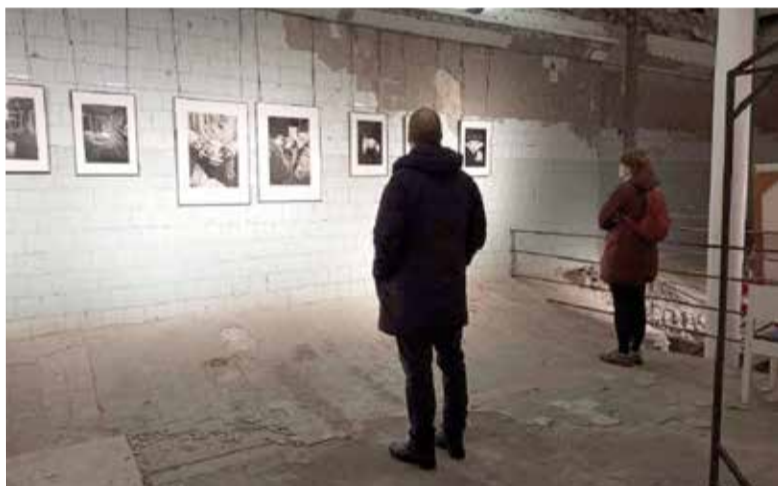
Выставка проходила в пространстве катакомб Петрикирхе...

«Руки города» – название фотовыставки и негласный призыв к заботе, посильной и разной, о тех, к кому приблизилась беда. ■