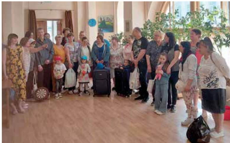
Вынужденные переселенцы из областей Украины в церкви св. Георга