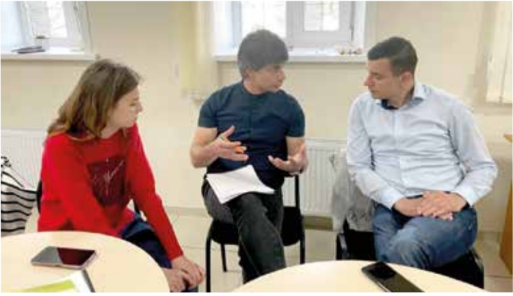
Участники охотно делились информацией о своей Церкви, а также приобретенным опытом в работе с детьми и молодежью...

«Сделать „перезагрузку“». Продолжение. Начало на с. 1