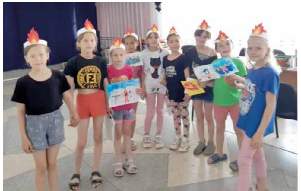
Пятидесятница в Костаное