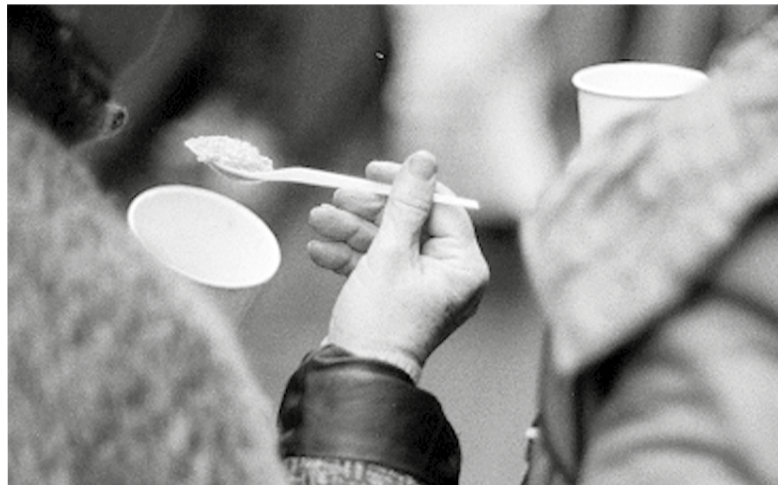
В кадре – только руки тех, кто приходит во двор флигеля Петрикирхе на раздачу горячей еды...

В кадре – только руки тех, кто приходит во двор флигеля Петрикирхе на раздачу горячей еды, которую волонтеры проекта «Суп и Хлеб» готовят дважды в неделю для всех нуждающихся. Публика собирается разная, порой контрастная, не каждый пришедший – бездомный. Это наблюдение и побудило авторов выставки им поделиться.