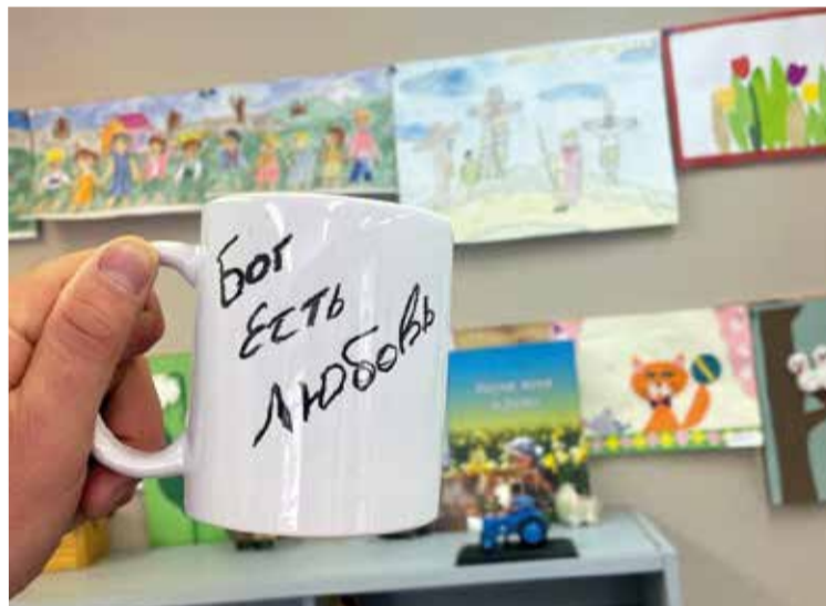
Последним пунктом программы стал мастер-класс по изготовлению чашек...

Калининград. 6 мая в церкви Воскресения прошел семинар для руководителей детского служения. На нем шла речь о целях детского служения, его организации и материалах для работы.