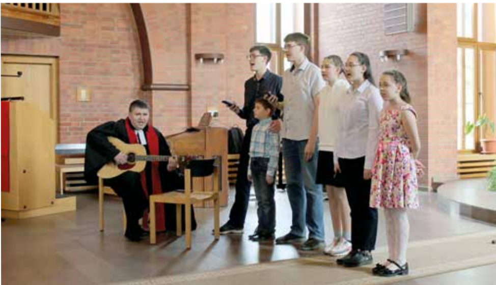
Пятидесятница в Омске