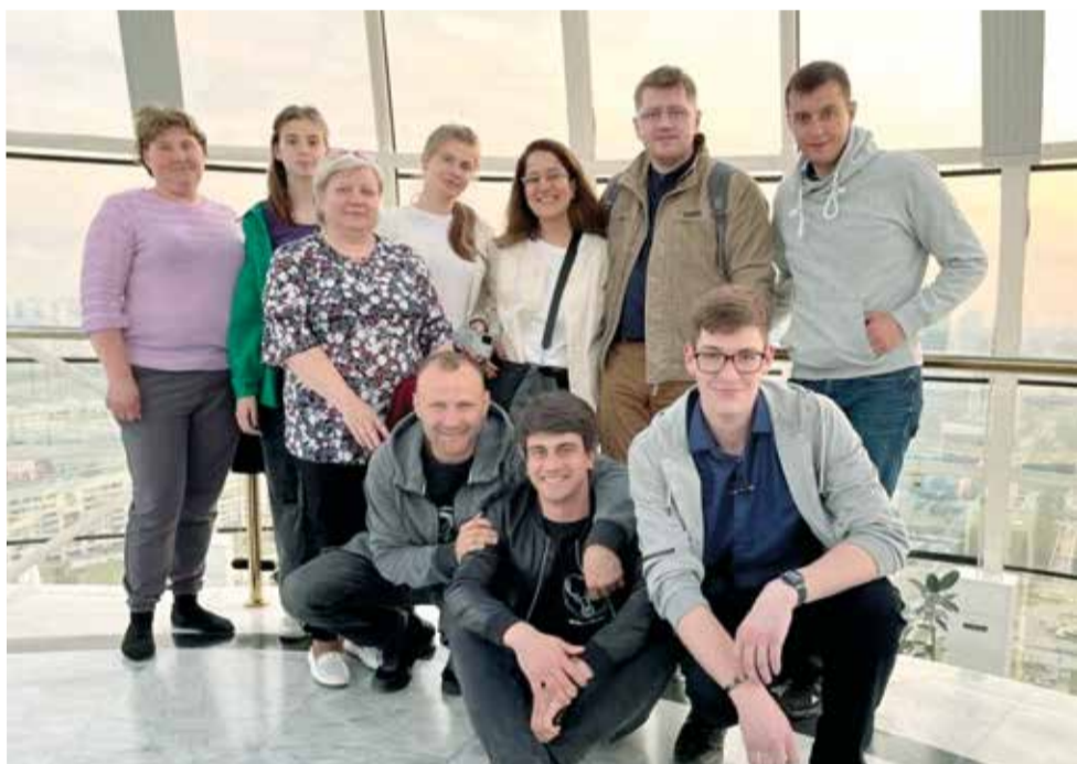
Участники встречи – координаторы детской и молодежной работы из Союза ЕЛЦ

Астана. С 11 по 14 мая в храме Христа Спасителя в Астане прошла встреча координаторов детской и молодежной работы в Союзе ЕЛЦ под названием „REstart“.