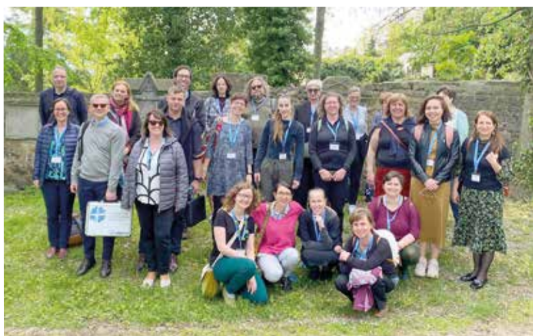
Участники консультации ВЛФ в Праге – пасторы, штатные сотрудники и волонтеры евангелических Церквей Восточной Европы

По материалам сайта www.lutheranworld.org