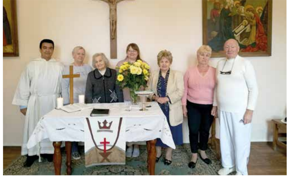
Пятидесятница в Симферополе