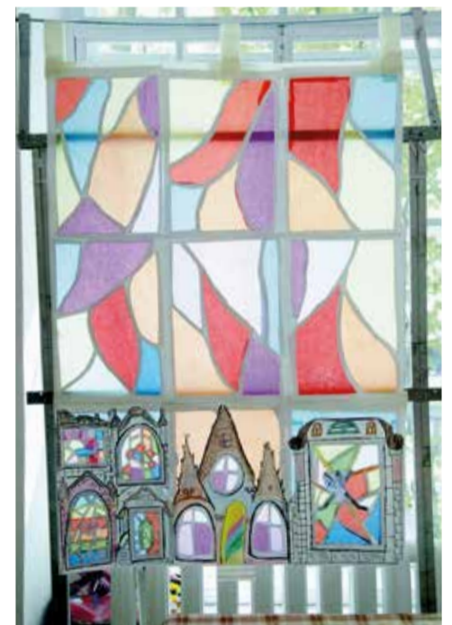
Пятидесятница в общине св. Анны и св. Петра в Санкт-Петербурге. Занятие в детской группе