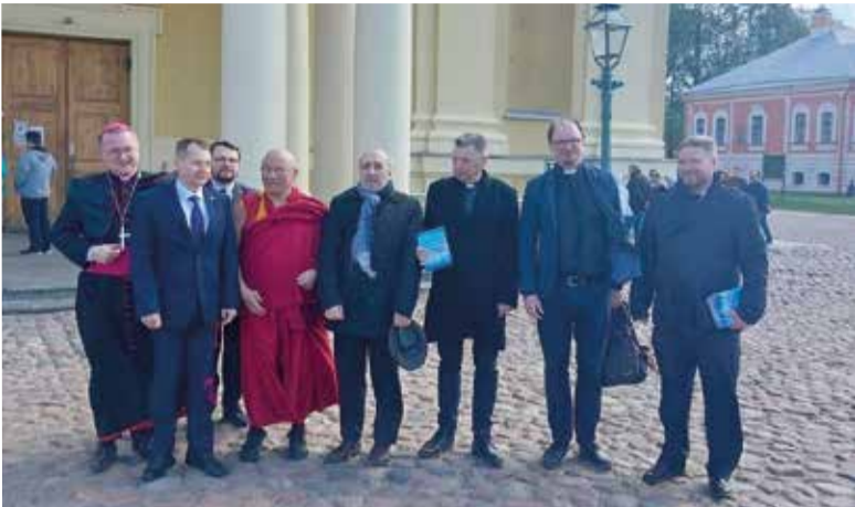
Представители храмов разных конфессий и религий, участвовавших в «Музыке храмов», с сотрудниками Отдела по связям с религиозными объединениями

20–21 мая прошла Всероссийская ночь музеев. Свою программу на ней представили и общины Евангелическо-Лютеранской Церкви России.