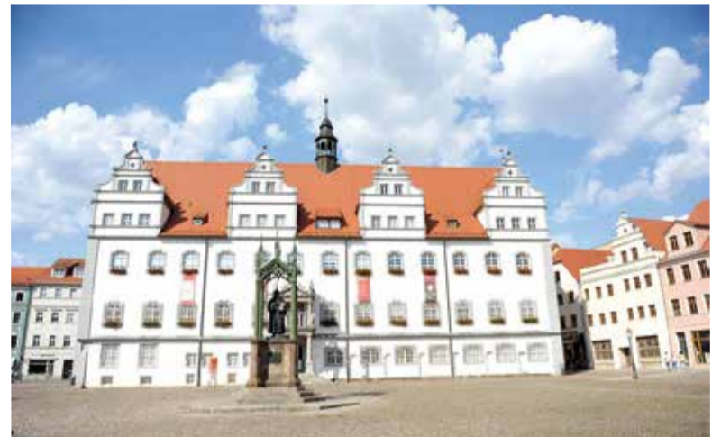
Старая Рыночная площадь в Виттенберге, где прошло заседание Совместной международной комиссии по богословскому диалогу

По материалам сайта www.lutheranworld.org