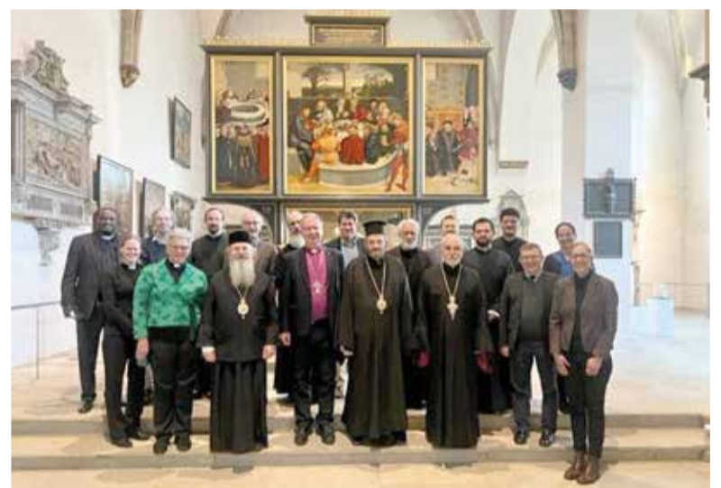
Члены комиссии в городской церкви св. Марии в Виттенберге, где проповедовал Мартин Лютер

ПРАГА. «Он подкрепляет душу мою» (Пс. 22) – таков был девиз консультации Всемирной Лютеранской Федерации (ВЛФ), посвященной деятельности тех, кто занимается помощью беженцам из Украины.