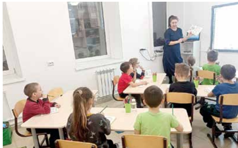
Занятия проходят в диаконическом центре общины

Выпускники групп «Росток» – 2017 года и «Крона» – 2019 года часто приходят навестить педагогов, делятся своими успехами, благодарят преподавателей за под-