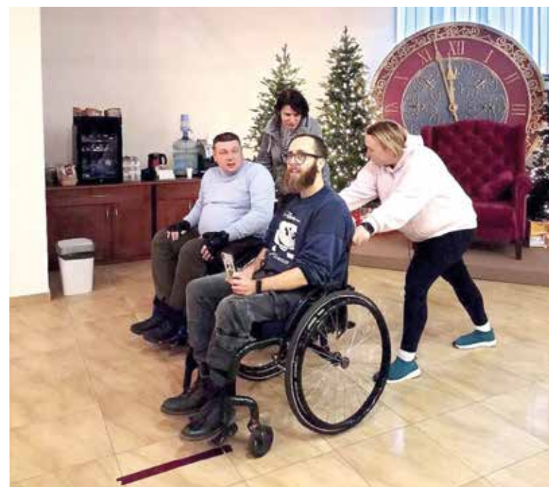
Студенты программы учатся управлять движением инвалидного кресла

На протяжении обучения студенты сформировали следу-