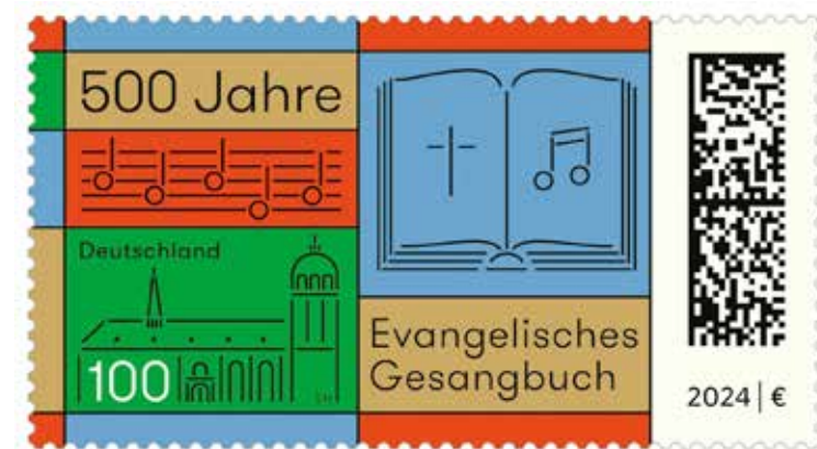
Специальная почтовая марка, выпущенная в Германии к 500-летию Евангелического сборника песнопений

Около 1523-24 года он программно писал Георгу Спалатину, секретарю саксонского курфюрста Фридриха Мудрого: У него, у Лютера, был план, по примеру пророков создать «немецкие псалмы для народа, то есть духовные песнопения, чтобы Слово Божье пребывало среди людей также и через пение». ➔