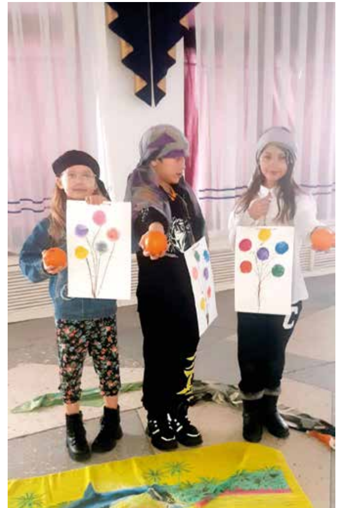
с. Садчиковка (Костанайская обл.)