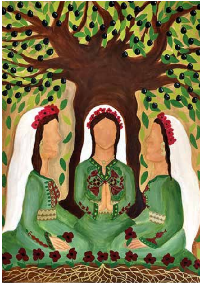
Картина Халимы Азиз «Молящиеся палестинские женщины» – символ Всемирного дня молитвы – 2024

1 марта в церквях разных конфессий во всём мире отпраздновали Всемирный день молитвы. Он был посвящен Палестине и проходил под лозунгом «Союз мира». В общинах Союза ЕЛЦ также молились о Палестине.