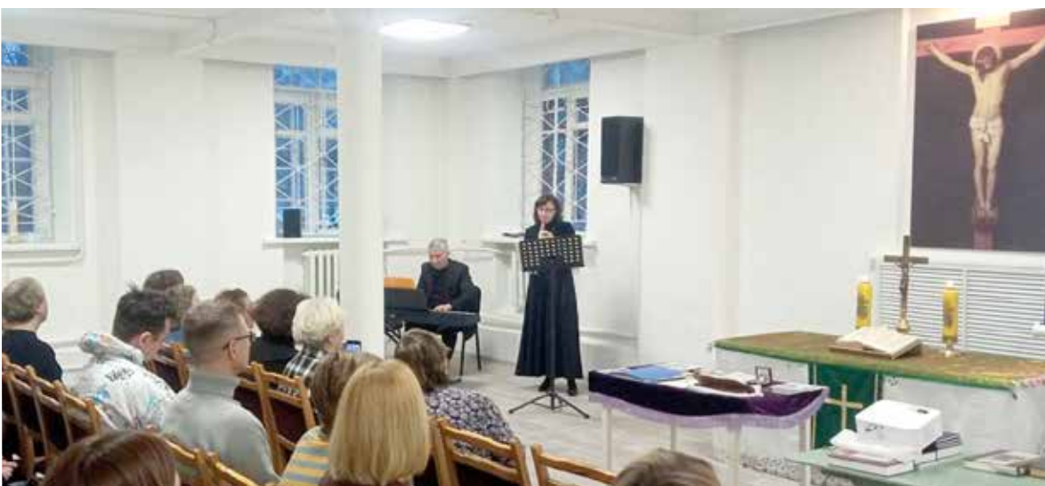
Еженедельно в кирху св. Марии на такие встречи приходит около 100 человек...

Еженедельно в кирху св. Марии на такие встречи, получившие название «Столлевыские вечера», приходит около 100 человек. ■