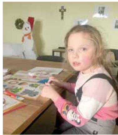
В начале февраля 2024 года прошел новый набор на логопедические, музыкальные и математические занятия...

В начале февраля 2024 года при поддержке Общества Мартина Лютера (Martin-Luther-Verein in Bayern e.V.) прошел новый набор на логопедические, музыкальные и математические занятия