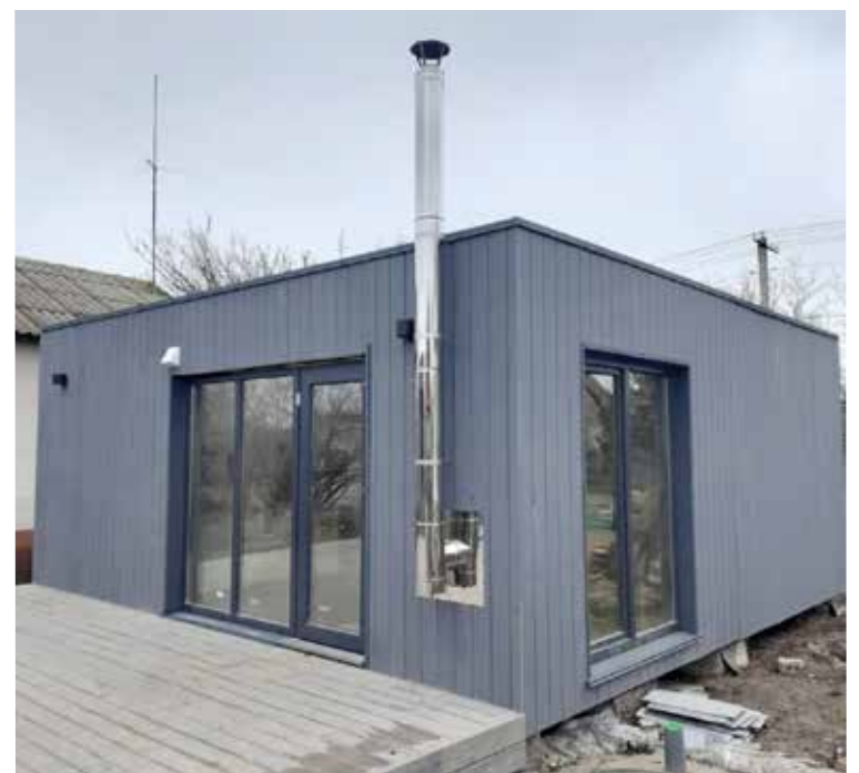
Два здания площадью по 39 м 2 построены на территории церковного комплекса в с. Петродолинское...