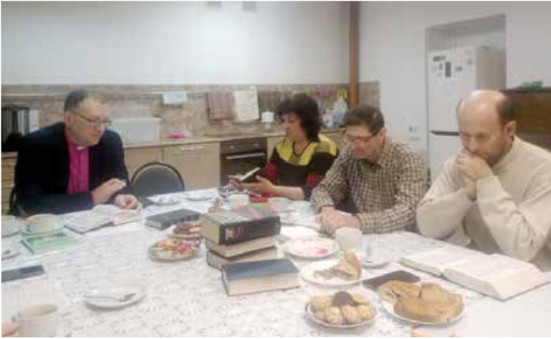
Архиепископ провел в общине Саратова библейский час

«Визитация архиепископа в Саратовское протство». Продолжение. Начало на с. 1