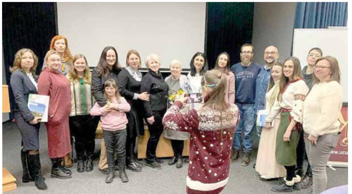
Участники и руководители программы

Я вспоминаю все наши беседы, на которых главный упор неизменно был на том, что у каждого человека всегда есть одинаковые потребности: чувствовать себя человеком, к которому относятся достойно, а также достигать взаимопонимания с другими, даже если на этом пути есть большие преграды. Этот курс помог мне окончательно понять эти важные истины. ■