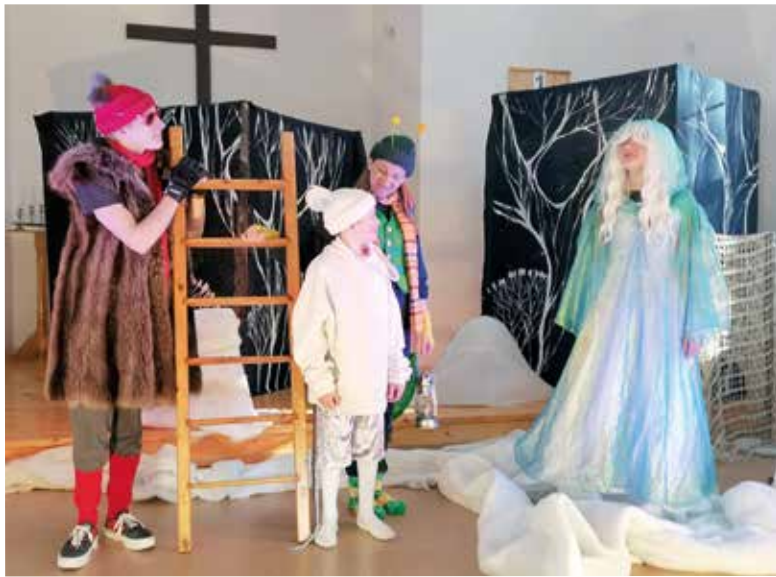
Спектакль «Новое имя для малыша» в церкви Спасителя в Берёзовском