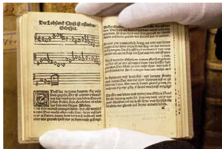
„Erfurter Färbefass Enchiridion“ – это самый старый сохранившийся протестантский сборник песнопений. Здесь он открыт на пасхальном хорале „Christ ist erstanden“. В сборнике содержатся и первые песнопения реформатора Мартина Лютера