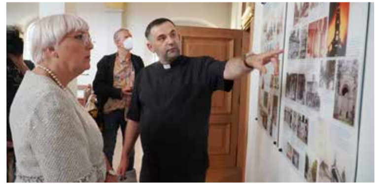
Пастор Александр Гросс знакомит министра Клаудию Рот с историей церкви св. Павла

ОДЕССА. 7 июня в ходе своего визита в Одессу министр ФРГ по вопросам культуры и СМИ Клаудия Рот посетила церковь св. Павла и церковный центр Немецкой Евангелическо-Лютеранской Церкви Украины (НЕЛЦУ).