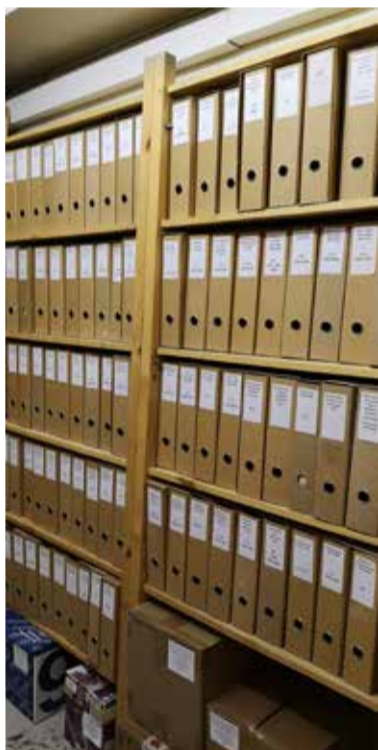
С конца 1990-х годов аккуратно систематизировались и оформлялись папки архивного хранения...

Оцифрованные документы архива доступны на нашем сайте. Ссылку на новую рубрику «Церковный архив / Kirchenarchiv» можно найти на www.elkras.ru в главном меню слева