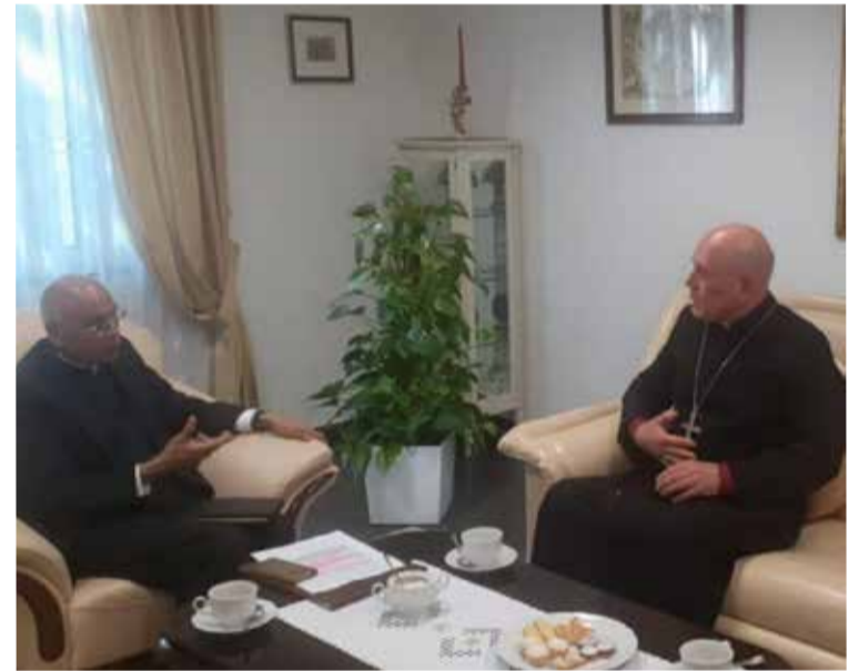
Апостольский нунций Френсис Ассизи Чулликатт (слева) и архиепископ Юрий Новгородов