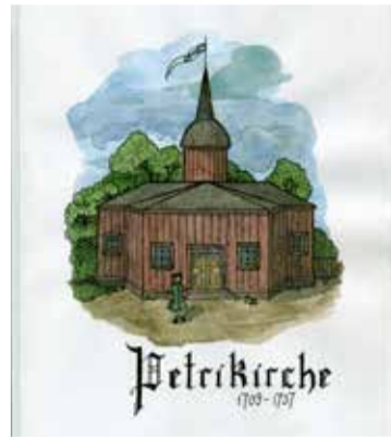
Первая деревянная кирха была построена в 1709 году на дворе вице-адмирала Корнелиуса Крюйса. (Рис. Анны Дягиловой)