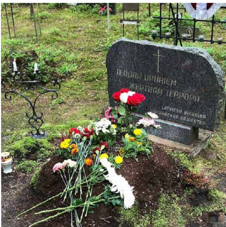
Мемориальный знак Латвийского общества на кладбище в Левашово