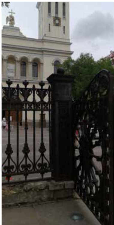
Ограда перед Петрикирхе сегодня

Историческая ограда продолжает выполнять свое назначение – закрывать церковный двор. Вот только ее состояние за почти двести лет без ремонта стало довольно плачевным: верх