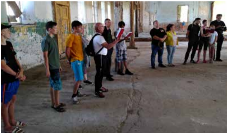
Молебен в заброшенной кирхе села Подстепное

Домой участники велопогулки отправились с планами повторить ее на следующий год. ■