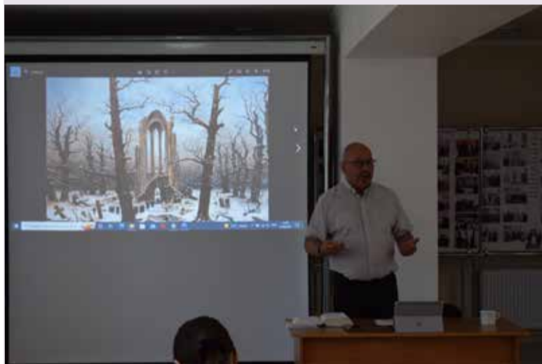
Увлекательная история христианских песнопений стала главной темой семинара...

Это были по-настоящему насыщенные, солнечные и наполненные поэзией дни. ■