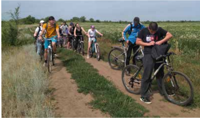
В велопогулке приняли участие около 30 человек, в том числе граждане многих иностранных государств...