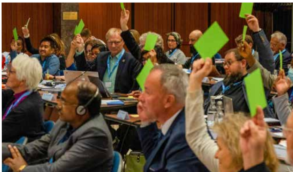
Голосование в Совете ВЛФ по вопросу принятия НЕЛЦУ как индивидуального члена