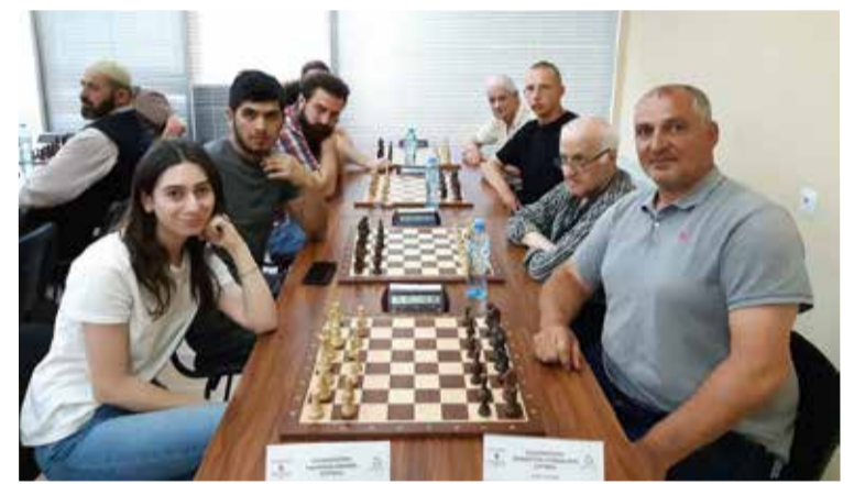
В мероприятии приняли участие представители различных Церквей и других религиозных сообществ, зарегистрированных в Грузии...