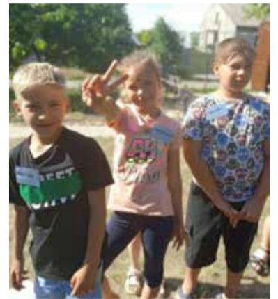
Три радостных дня провели вместе дети, подростки и взрослые

Тем временем, мы планируем еще два трехдневных лагеря в июле и августе. В этом все оказались единодушны: лагерю быть! ■