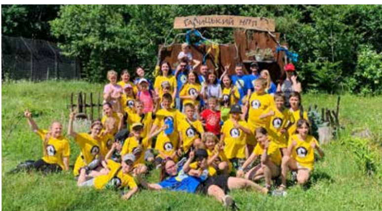
Участниками лагеря стали дети из многодетных и малообеспеченных семей, а также дети-переселенцы

Община св. Троицы, вместе с тремя другими реформатскими общинами в Украине, находится в братском общении с Немецкой Евангелическо-Лютеранской Церковью Украины с перспективой вхождения в ее состав. ■