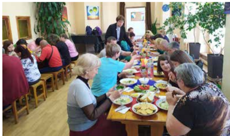
В программе встречи был совместный обед в церкви св. Георга