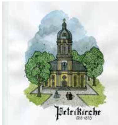
Вторая Петрикирхе в стиле петровского барокко была освящена в 1730 году и простояла до 1833 года. (Рис. Анны Дягиловой)

фундамента из «Петровского известняка» и Путиловского камня умышленно разрушен, а части чугунной ограды утрачены.