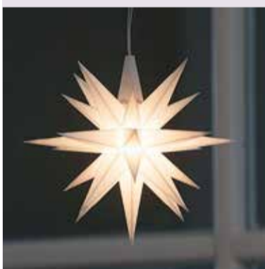
Благодаря гернгутерам у нас появилась гернгутерская звезда, которой мы украшаем наши церкви и дома в ожидании Рождества...

Саксонский граф Николай Людвиг фон Цинцендорф, который находился под влиянием пиетистских идей, пригласил в 1722 году моравских братьев – представителей преследуемой христианской евангелической деноминации – поселиться на землях своего имени недалеко от Циттау (Саксония). Основанное поселение получило название Гернгут. Гернгутерское объединение братьев было и остается сегодня одной из наиболее активных миссионерских Церквей в мире.