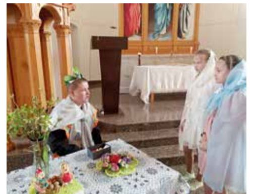
Зоркино (Саратовская обл.)