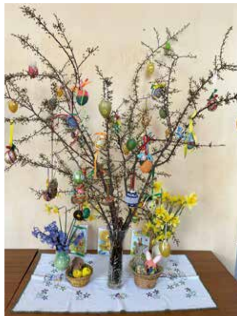
Бердянск (Запорожская обл.)