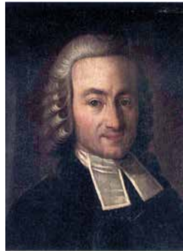
Пастор Генрих Готлиб Нацциус (1686–1751)

В 1743 году Миквитц и Фирорт открыто выступили против бывших коллег и, сложив с себя пасторские обязанности, прим-