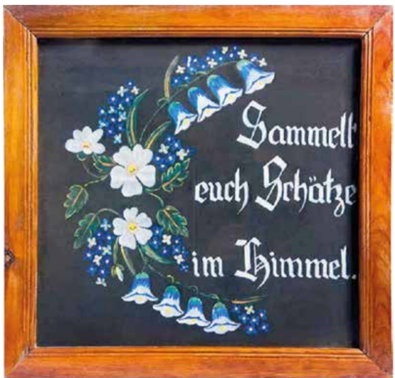
Панно с цитатой из Евангелия, «Sammelt euch Schätze im Himmel» («Собирайте себе сокровища на небе», Мф. 6,20). Ткань, масляные краски, деревянная рамка. Хранится в Павлодарском областном историко-краеведческом музее им. Г. Н. Потанина.