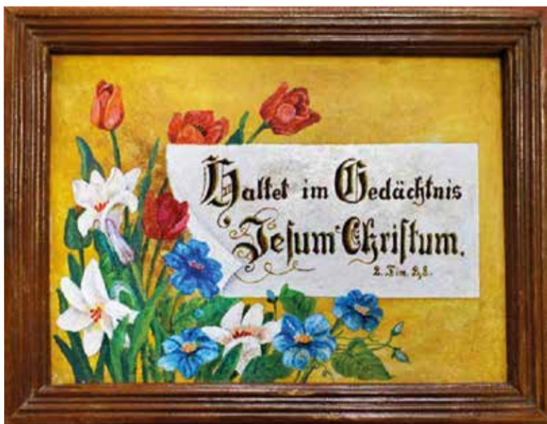
Панно с цитатой из Евангелия, «Haltet im Gedächtnis Jesum Christum» («Помни Господа Иисуса Христа», 2 Тим. 2,8). Панно в деревянной рамке, масляные краски, рисунок. Хранится в районном филиале немецкого культурного центра «Возрождение» в пос. Карабалык Костанайской обл.