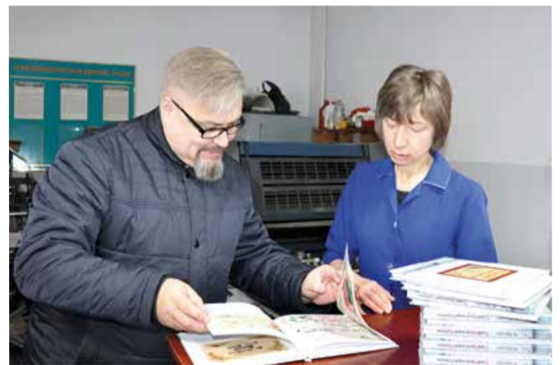
Автор с тиражом своей новой книги