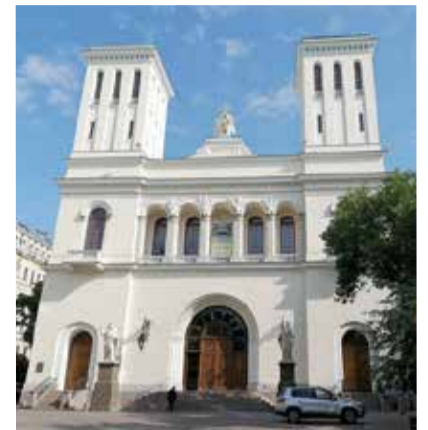
Кафедральный собор свв. Петра и Павла (Петрикирхе)

По вопросам просим обращаться в письменной форме по электронному адресу: kanzlei@elkras.ru . ■