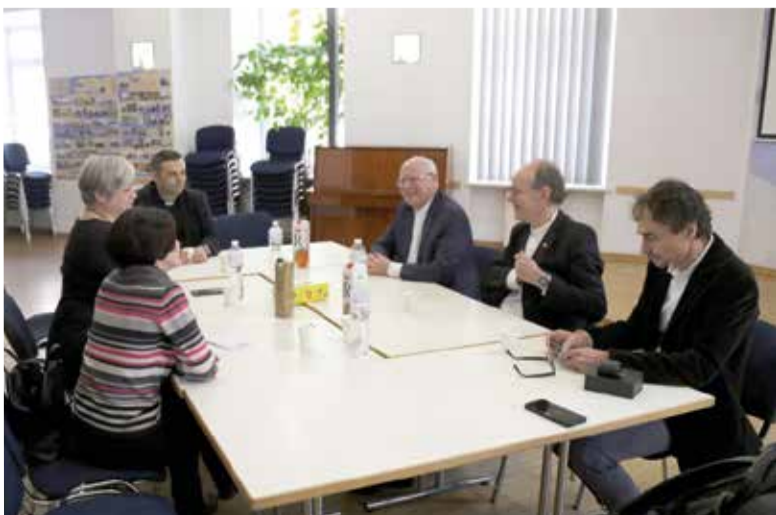
Круглый стол прошел в помещениях церковного комплекса св. Павла