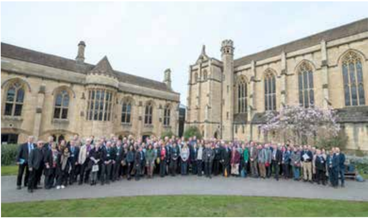
Участники подготовительной встречи в Мэнсфилдском колледже

«На пути к Генеральной ассамблее». Продолжение. Начало на с. 1