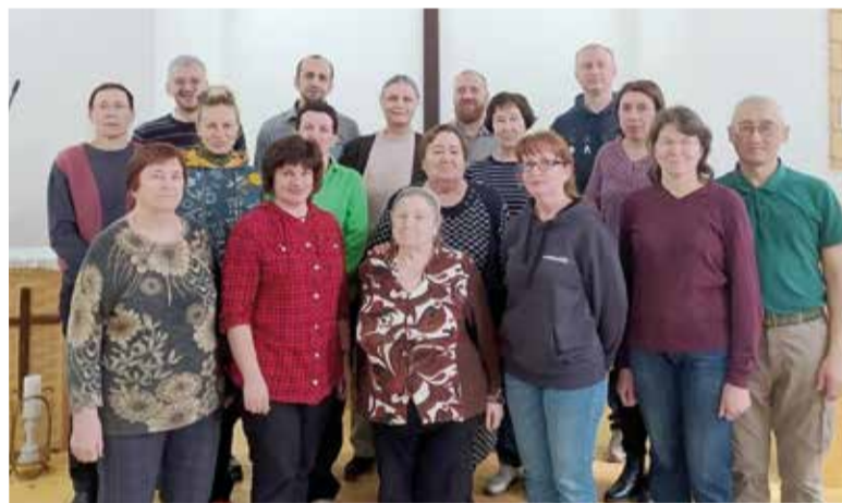
Участники встречи в церкви Спасителя Иисуса Христа

На нее собрались участники из Краснотурьинска, Волчанска, Нижнего Тагила, Тюмени, Челябинска, Старокамьинска, Полевского, Екатеринбург и Березовского.