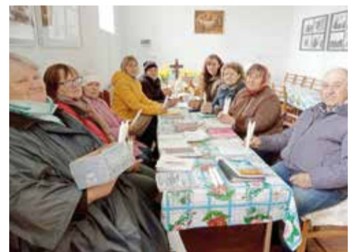
Змеевка (Херсонская обл.)