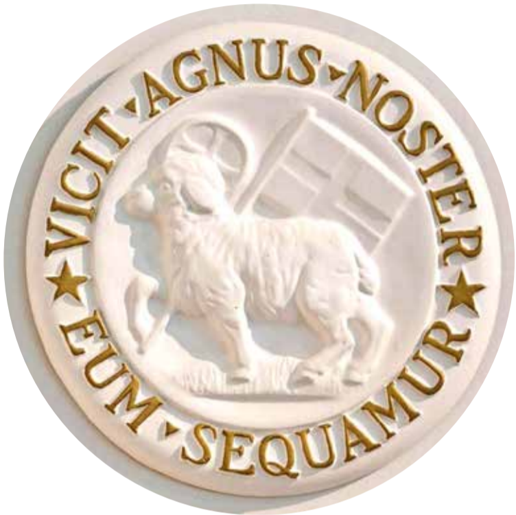
Символ Гернгутерского объединения братьев: «Наш Агнец одержал победу – будем же следовать за Ним»