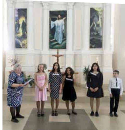
Маркс (Саратовская обл.)