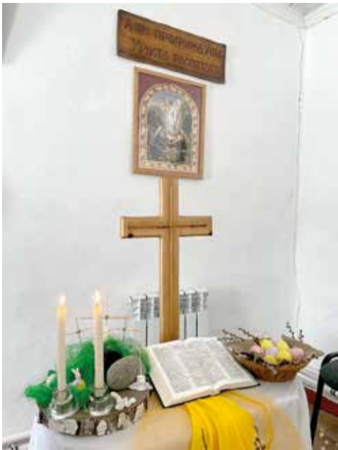
Фоминовка (Омская обл.)