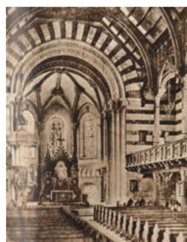
Церковь св. Павла. Исторические изображения

листок» писала: «Он был душой общества нашего города».