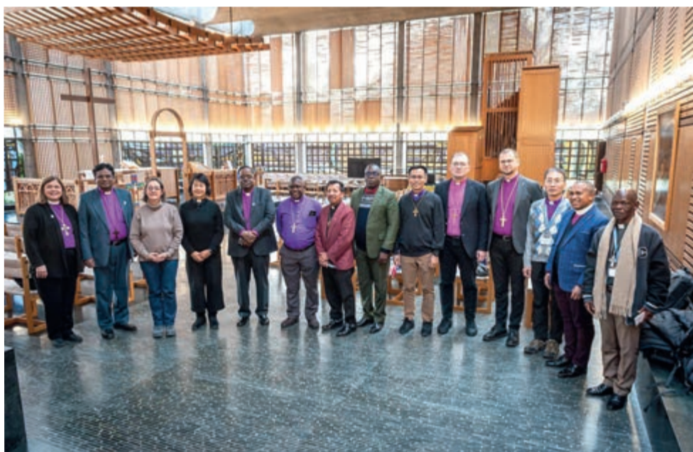
14 епископов и президентов Церквей-участниц ВЛФ приняли участие в Ретрите для новоизбранных церковных лидеров

ЖЕНЕВА/ВИТТЕНБЕРГ. Какие знаки надежды есть сегодня в Церквях-участницах Всемирной Лютеранской Федерации (ВЛФ)? С какими вызовами они сталкиваются, и как церковные лидеры справляются с ними?