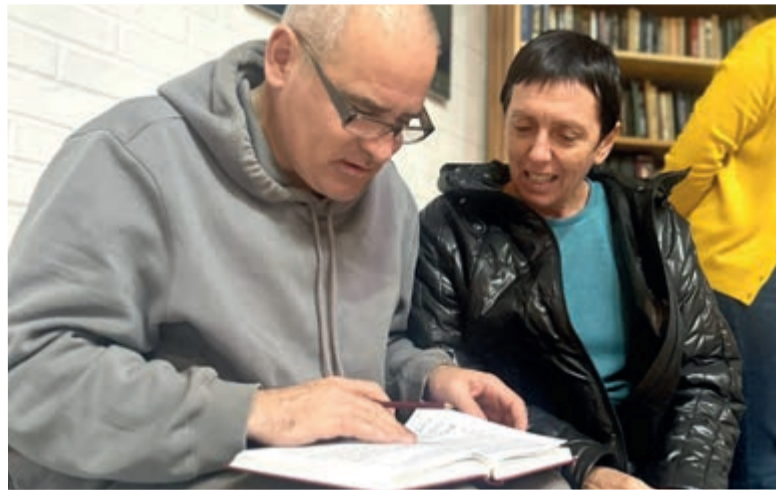
Слушатели учились применять полученные знания на практике...

Референт семинара показал, как менялись христианские песнопения, как они влияли на людей, как в них происходил процесс вза-