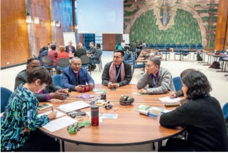
Участники ретрита поделились рассказами о своем личном лидерском пути, услышали о различных аспектах работы ВЛФ...

«Архиепископ принял участие в ретрите для церковных лидеров». Продолжение. Начало на с. 1