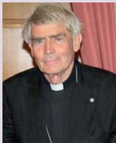
Пастор Манфред Брокманн (1937–2023)

Выражаем самые искренние соболезнования семье, прихожанам и всем общинам Дальнего Востока! ■