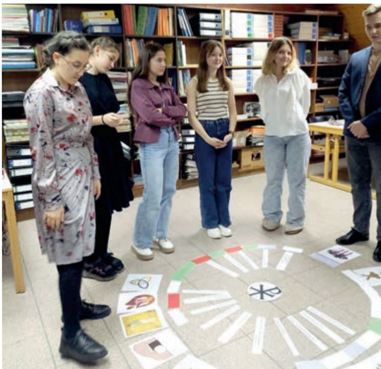
Во время игр мы узнали много нового о церковных праздниках...

Я желаю, чтобы в нашу общину приходило как можно больше молодежи, чтобы мы могли вместе собираться на подобных мероприятиях, дарить друг другу незабываемые эмоции и вместе восхвалять Бога! ■