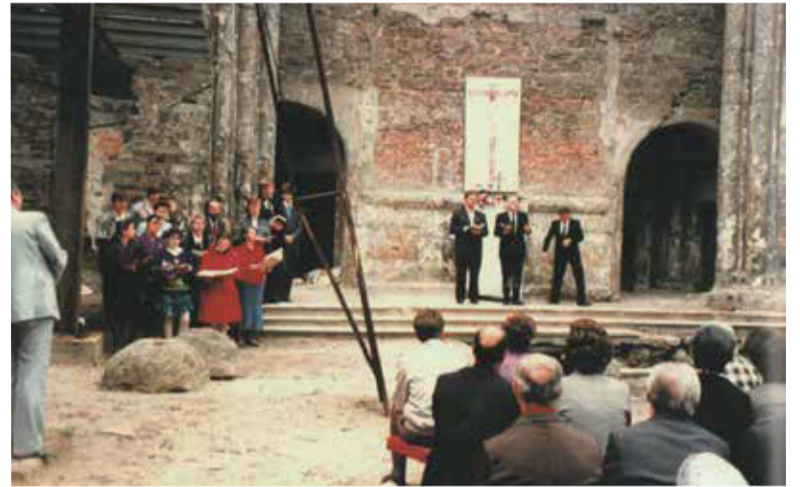
Первые богослужения возрожденной общины в руинах церкви св. Павла