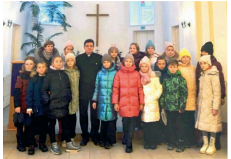
Экскурсия для детей в церкви св. Марии

Очень радостно было видеть у детей неподдельный интерес к церкви св. Марии и к христиан-