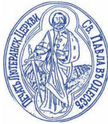
Историческая печать общины