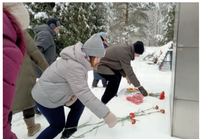
Прихожане общины св. Анны и св. Петра почтили память погибших, жертв тирании и деспотизма...