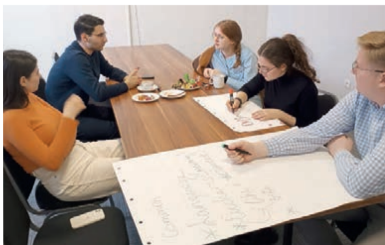
Мы много разговаривали, обменивались культурным опытом, рассказывали об особенностях менталитета в наших странах...

лись воркшопы для студентов «Идентичность и ее восприятие молодежью из разных стран и религиозных конфессий».