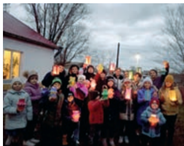
Камышенка (Акмолинская обл., Казахстан)