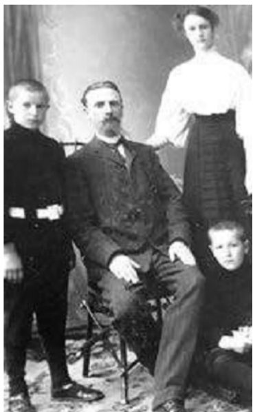
Исторические фото из семейного альбома