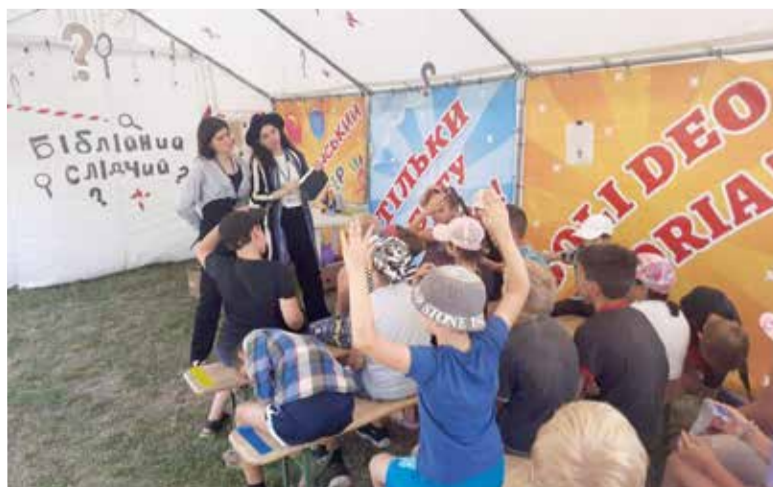
Каждый участник попробовал себя в роли детектива...

Если вы знакомы с этими библейскими историями, то точно знаете, что у них есть тайный смысл. Эти скрытые значения учили нас воспринимать Слово Божье с открытым сердцем, развивать и приумножать наши таланты, относиться ко всем как к ближним, помнить о нашей греховности и Господней безграничной любви к каждому из нас. ■