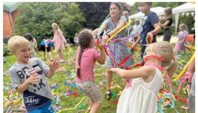
У детей, собравшихся на Церковном дне, была отдельная программа...

лошади катали восторженных детей вокруг церкви, а также ребят ожидало подрумяненное над углями маршмеллоу на палочках.