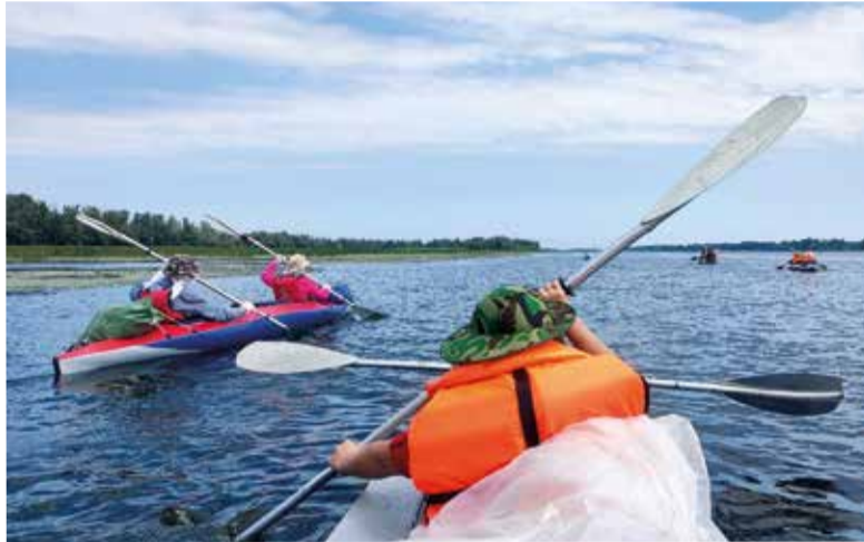
Некоторые в этом походе держали весла впервые в жизни, но успешно справились уже с первым отрезком пути...

Второй день похода выдался непростым: по воде шли против течения и ветра. Под конец запланированного дневного пути лодки набрали воды. Уже перед самым