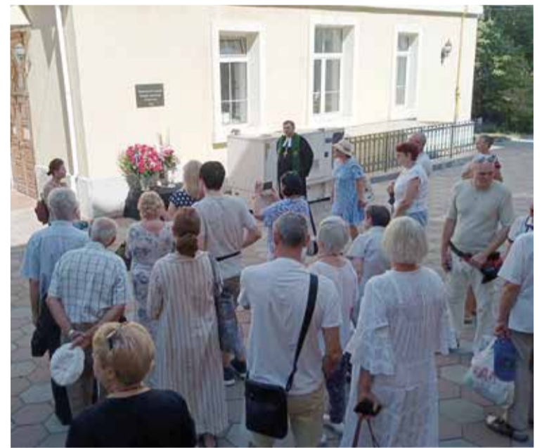
После богослужения его участники возложили цветы к мемориальной доске жертвам репрессий и депортаций, расположенной во дворе одесской кирхи...