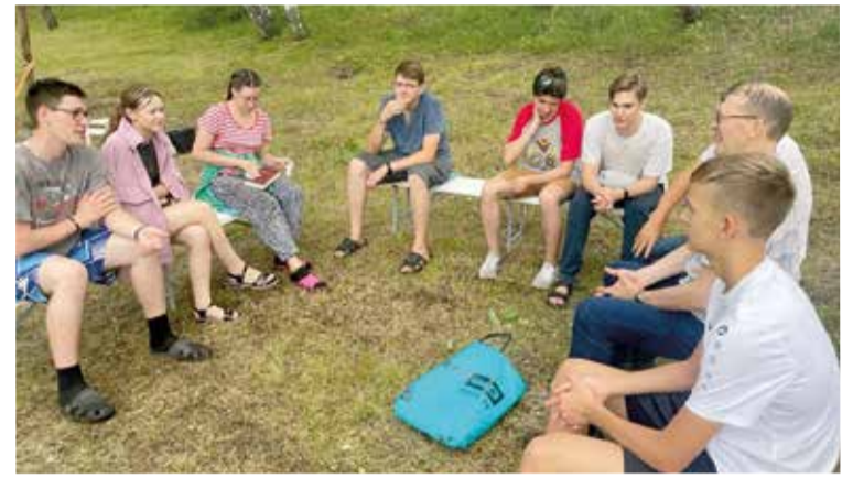
В лагере собрались прихожане и служители из общин всего Сибирского пропства...