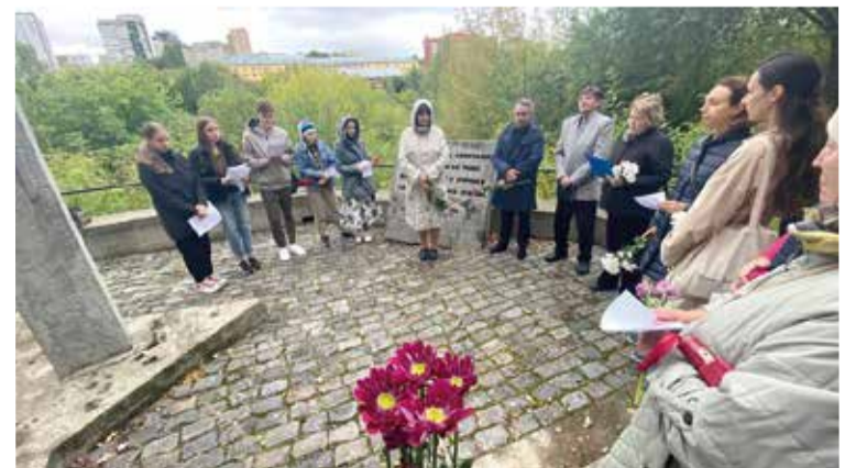
Возложение цветов к Мемориалу жертвам политических репрессий в Перми

В этот день очень своевременно прозвучала песня „Schön ist die Jugend“, которая стала гимном российских немцев в знак утерянной молодости депортированной немецкой молодежи 1940-х годов. ■