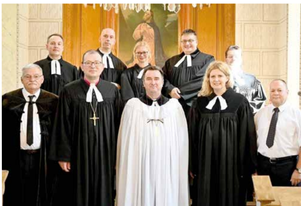
В нижнем ряду: архиепископ Владимир Проворов (второй слева), епископ Ярослав Яворник (третий слева), пастор Екатерина Прейман

СЕРБИЯ. С 24 по 29 августа архиепископ Евангелическо-Лютеранской Церкви России Владимир Проворов находился с визитом в Словацкой Евангелической Церкви Аугсбургского вероисповедания в Сербии (СЕЦАВС).