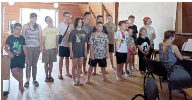
Ребята с ограниченными возможностями здоровья принимают участие в лагере вместе со здоровыми детьми...

Время пролетело незаметно. До новых встреч! ■