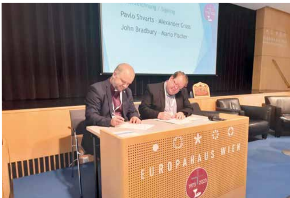
Епископ Павел Шварц (слева) и президент Джон Брэдбери подписывают соглашение о вхождении НЕЛЦУ в СЕЦЕ

ВЕНА. 5 июля Немецкая Евангелическо-Лютеранская Церковь Украины (НЕЛЦУ) официально стала индивидуальным членом Сообщества евангелических Церквей в Европе (СЕЦЕ).