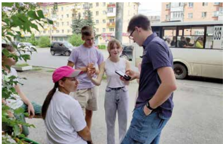
На станциях ребят ждали задания...