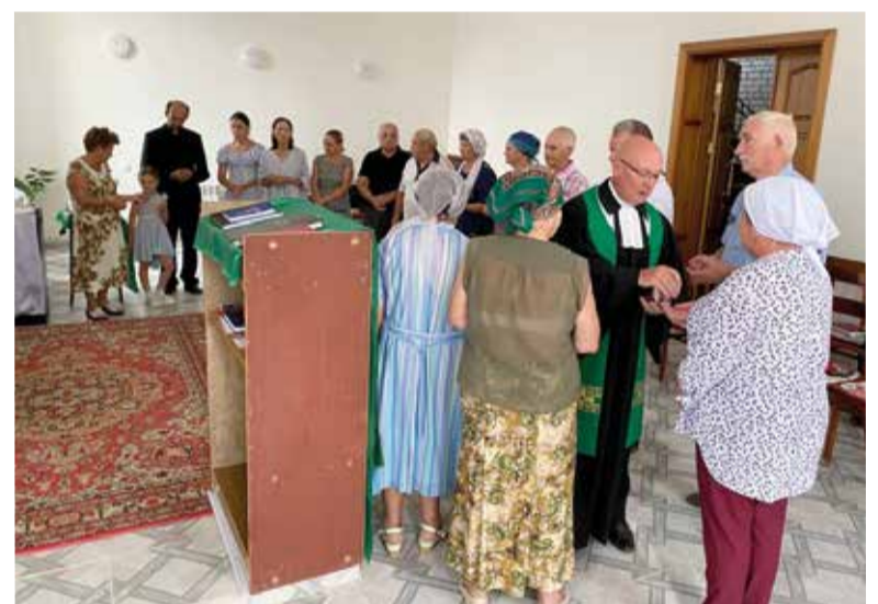
Богослужение в общине Камышина

когда мы вместе, а не по отдельности. И не только на бумаге, формально, а фактически, для Господа.