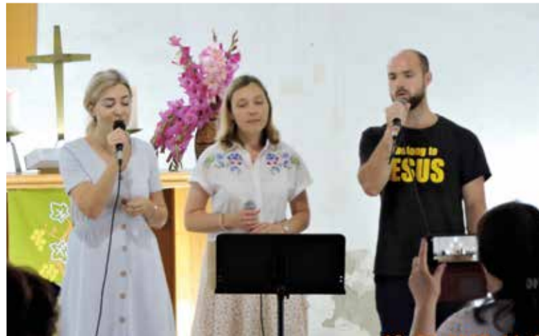
В концерте приняли участие шесть коллективов из протестантских общин...

По материалам сайта www.propstei-klg.com