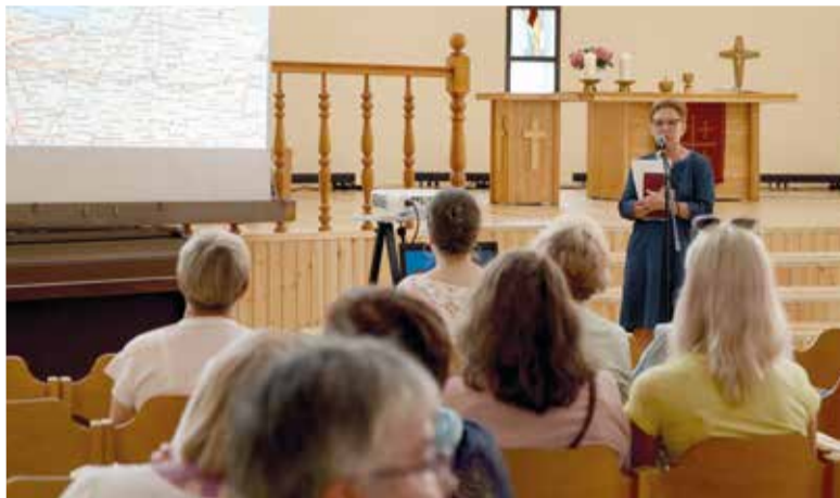
Об истории и современности общин рассказали их председатели...

Следующим пунктом программы стали презентации общин Калининградского пропства. Об истории и современности общин Светлого, Славска, Черняховска, Гусева, Правдинска, Большой