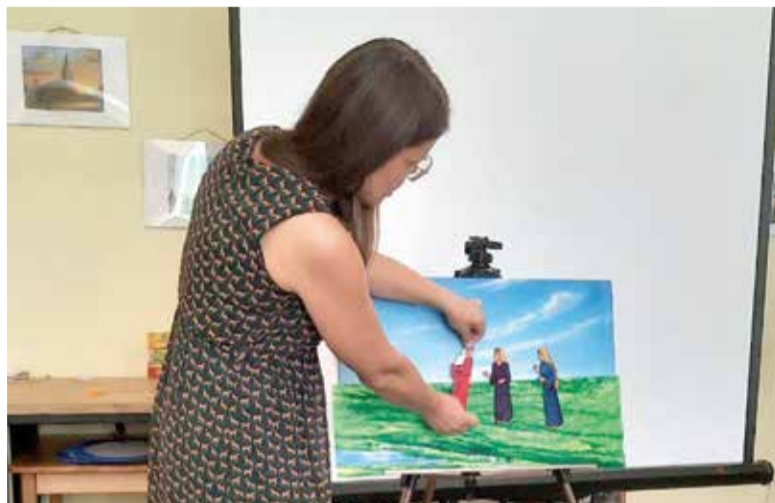
Участники семинара смогли попрактиковаться в подготовке рассказа библейской истории с помощью фланелеграфа ...