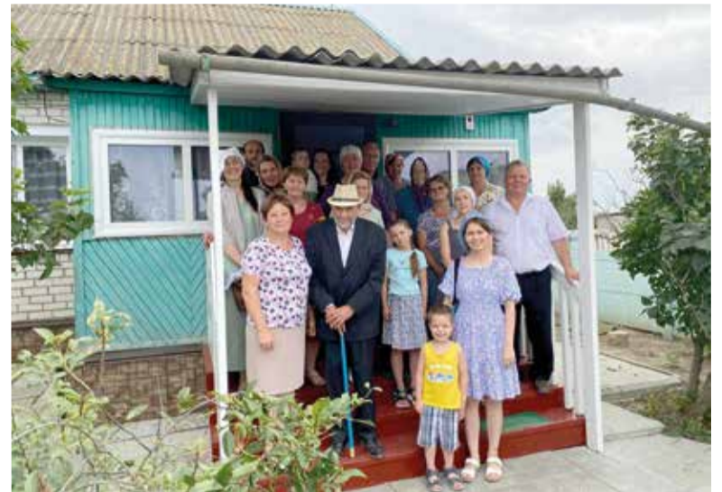
Община в Лебяжье

Изречением недели в воскресенье, 13 августа, был следующий текст: «Блажен народ, у которого Господь есть Бог, – племя, которое Он избрал в наследие Себе» (Пс. 32,12). Мы тогда народ Божий,