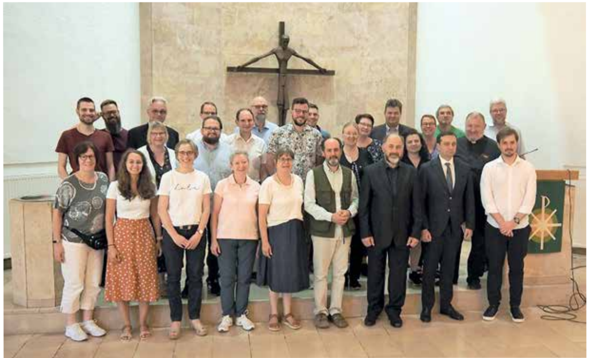
Гости из партнерской Церкви в церкви Примирения в Тбилиси