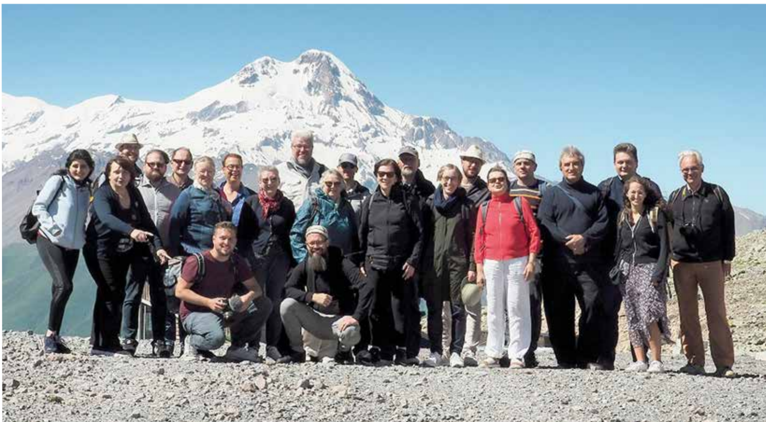
Мы получили большое впечатление от пейзажей Грузии...

Понемногу нам следует продумать всё, что мы могли бы сделать. Мы уверены, что Бог благословит нас на это. ■