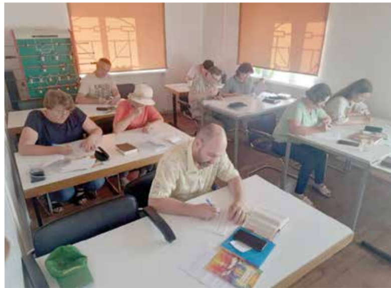
Семинар собрал участников из Одессы, Киева, Кривого Рога, Белой Церкви и села Новоградковка...

Этот семинар – лишь начало подготовки волонтеров для служения в общинах. НЕЛЦУ благодарит Северо-Восточную миссию (Швеция) за финансовую поддержку проведения семинара. ■