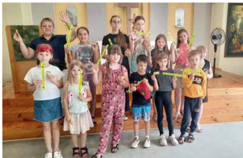
Участники детского лагеря