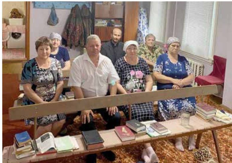
Община в Верхней Добринке

Через Саратовское пропство был сделан заказ необходимого количества брошюр «Слово