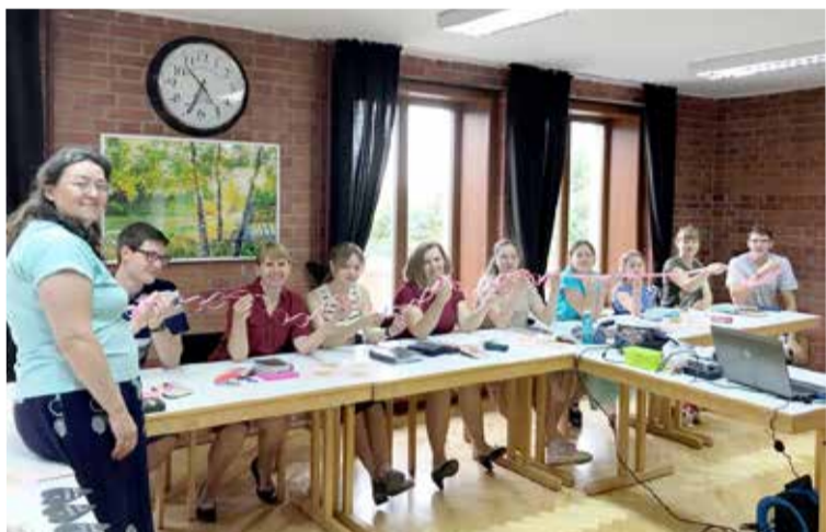
На занятиях семинара