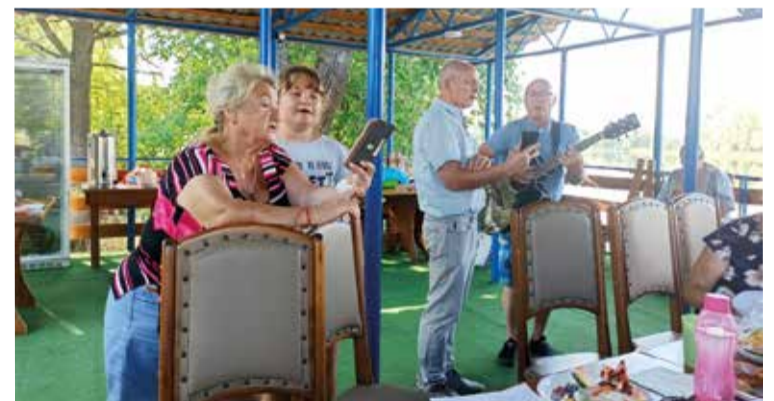
Пели много христианских гимнов...