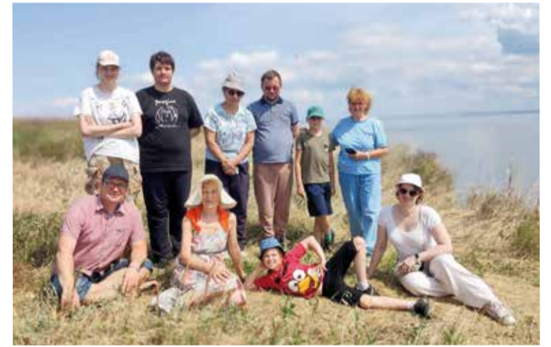
Участники автопробега на природе