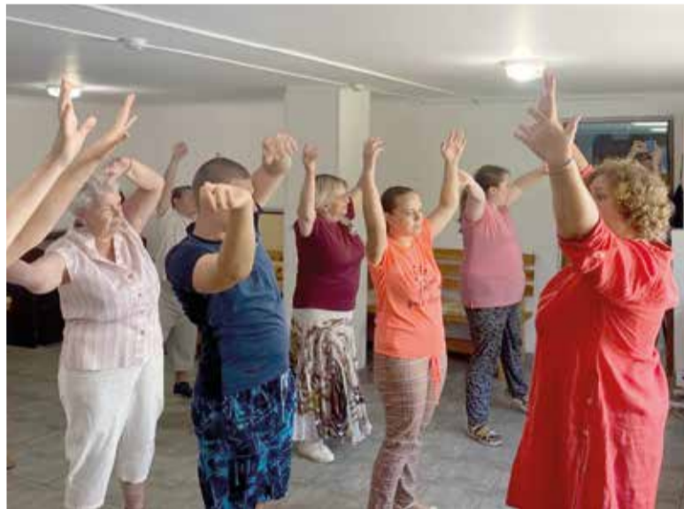
Участники конференции провели целый день с подопечными проекта «КИТ» общины г. Тольятти