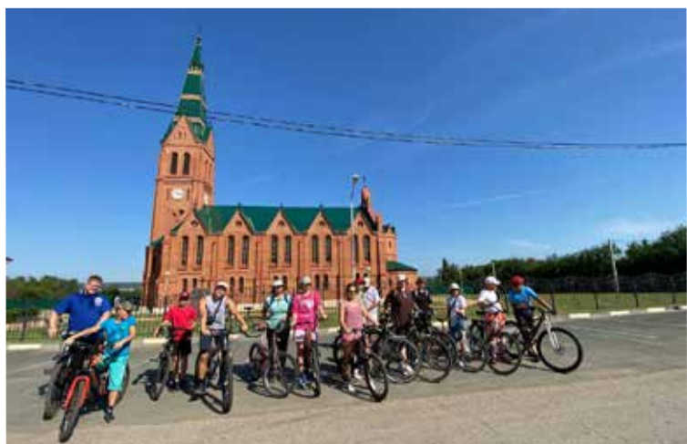
Велосипедисты стартовали от церкви Иисуса в с. Зоркино

Участники велопробега благодарят за финансирование этого проекта всех сопричастных жертвователей. ■