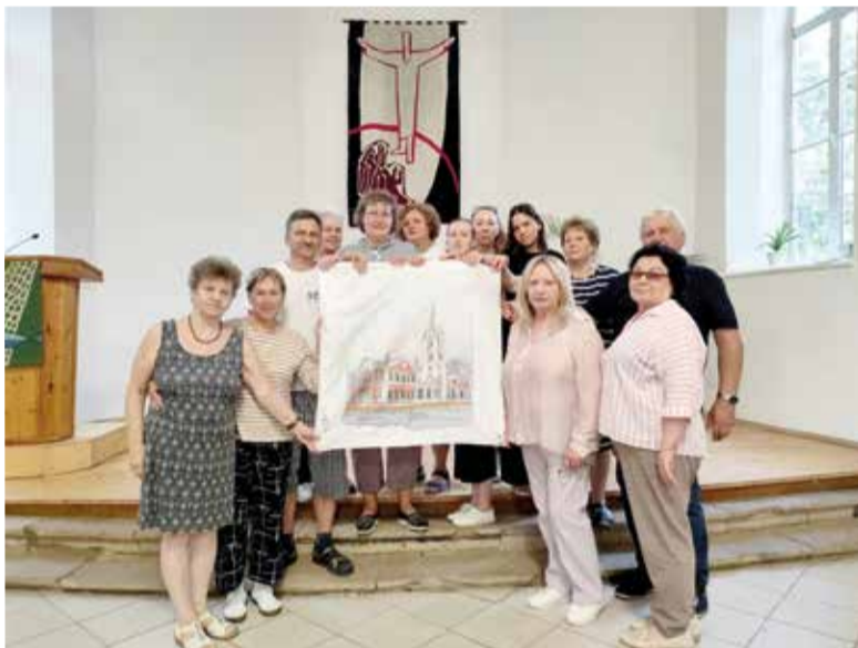
Участники конференции в церкви св. Георга в Самаре

Всё это вызвало интерес к более глубокому изучению всего материала, связанного с диаконией, и желание объединиться в сообщество и создавать новые проекты. ■